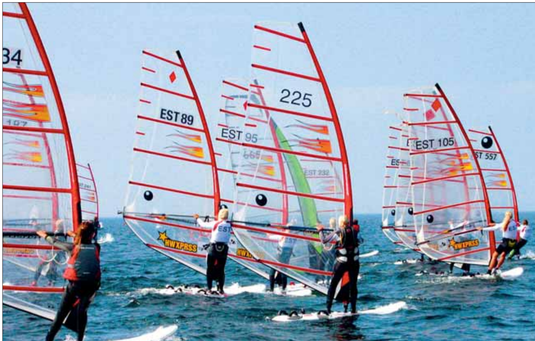
Nelja päeva vältel peeti keerulistes ilmaoludes kaheksa võistlussõitu.