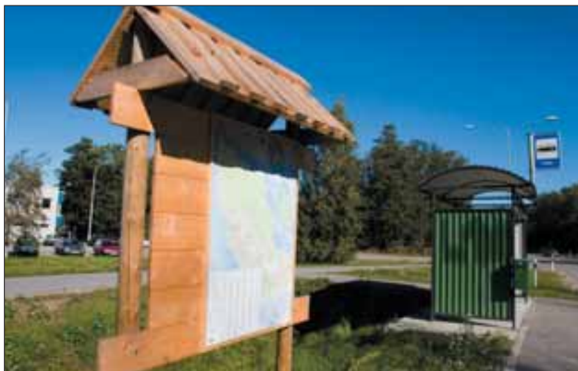
Varikatusega infostendidel on valla kaartide kõrval küllalt vaba ruumi, kuhu inimesed võivad paigutada teateid.

Kommunaalameti tellimisel uuendatakse peatselt ka Statoili tankla juures asuvat suurt vallakaarti. (VT)