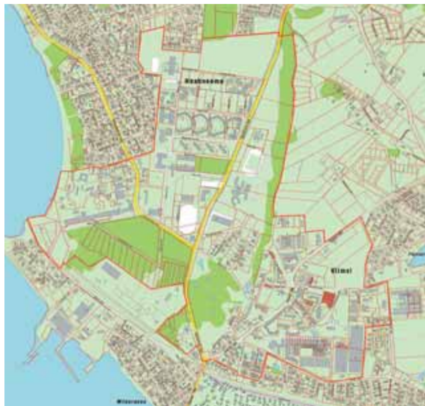
Kaugkütte piirkond on kaardil märgitud punase joonega. Täpsemat infot kaugküttepiirkonna kohta saab Viimsi valla kodulehelt www.viimsi.ee .