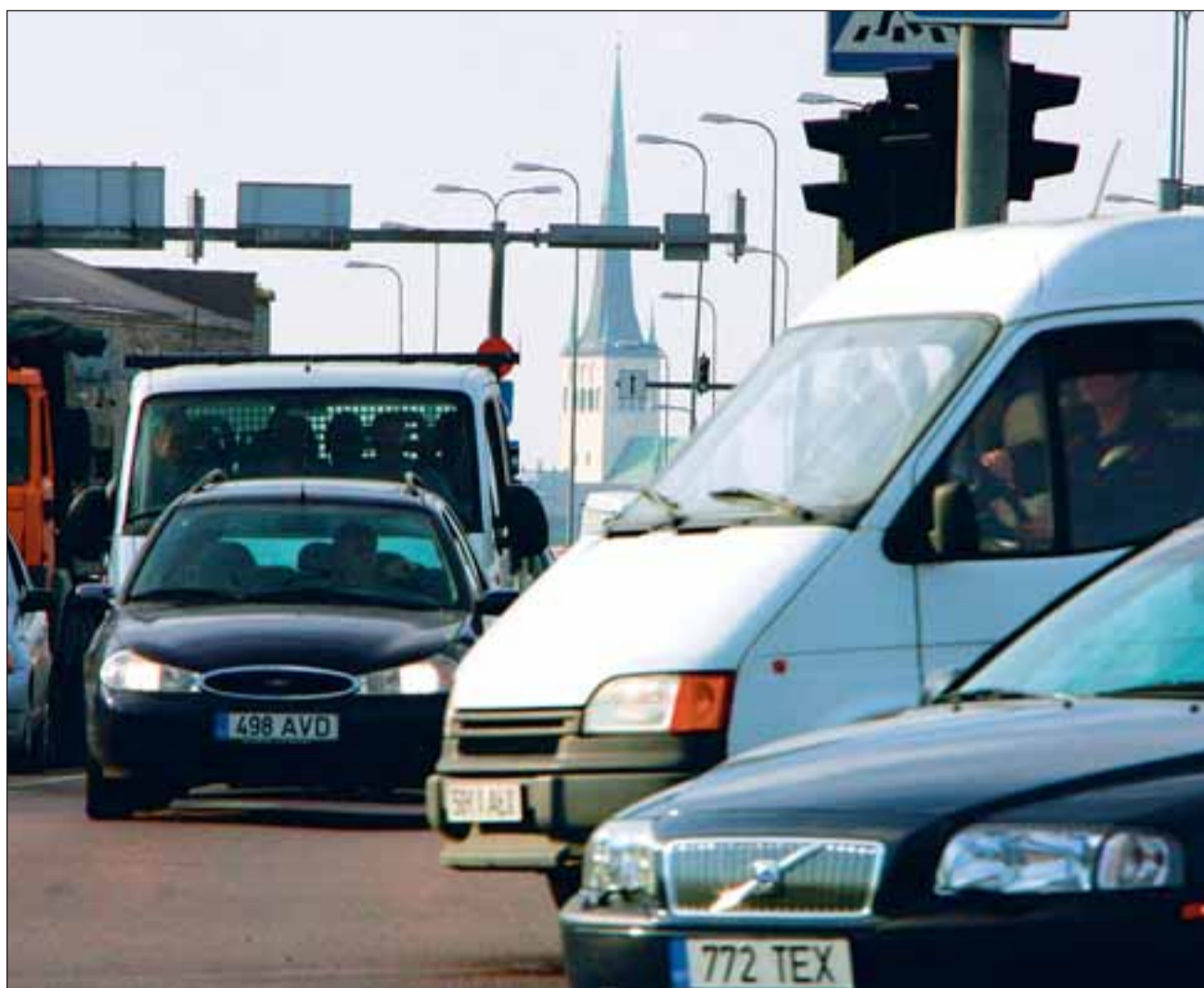
Viimsilased sõidavad hommikul tippnõul Tallinnasse kuni tund aega.