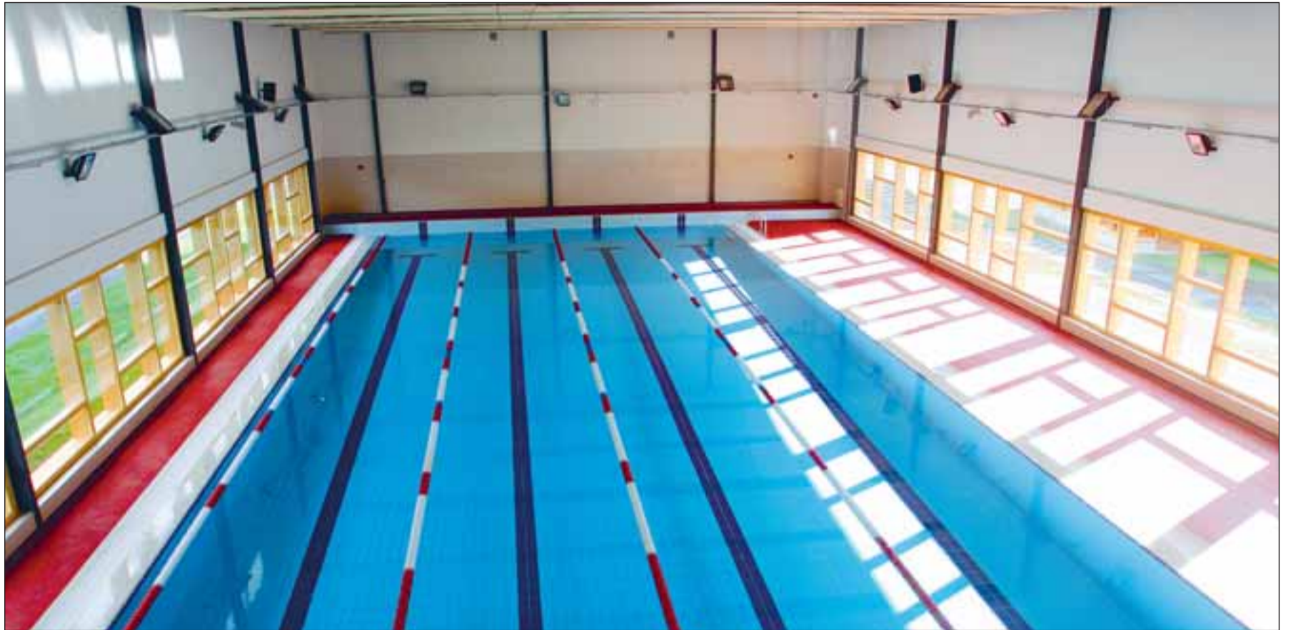
Ujula on vallarahvale avatud argipäeviti kella 7–8.30 ja pärast koolitunde kella 22-ni, puhkepäeviti kella 11–21.