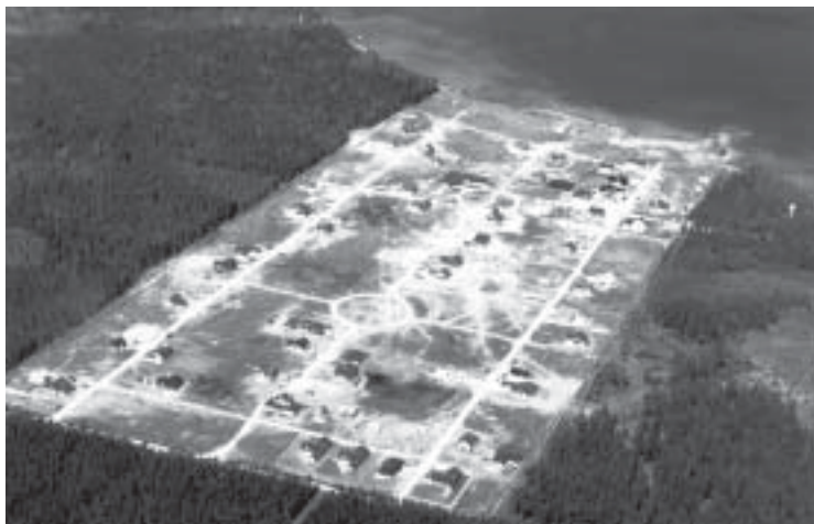
Kelvingisse on kerkinud esimesed majad.