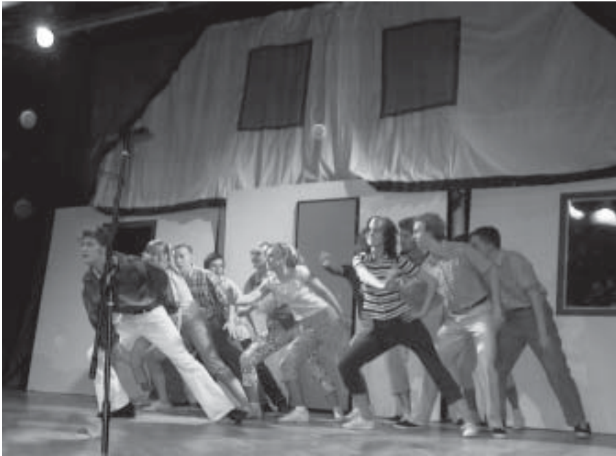
Kuulus rockistaar ja tema fänclub.