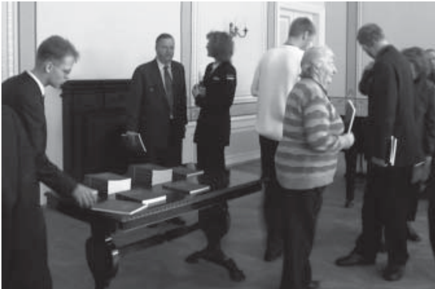
Raamatu esitlusel Laidoneri muuseumis 27. veebruaril.

Aastaraamatu koostas Leho Lõhmus, teostas SE&JS.