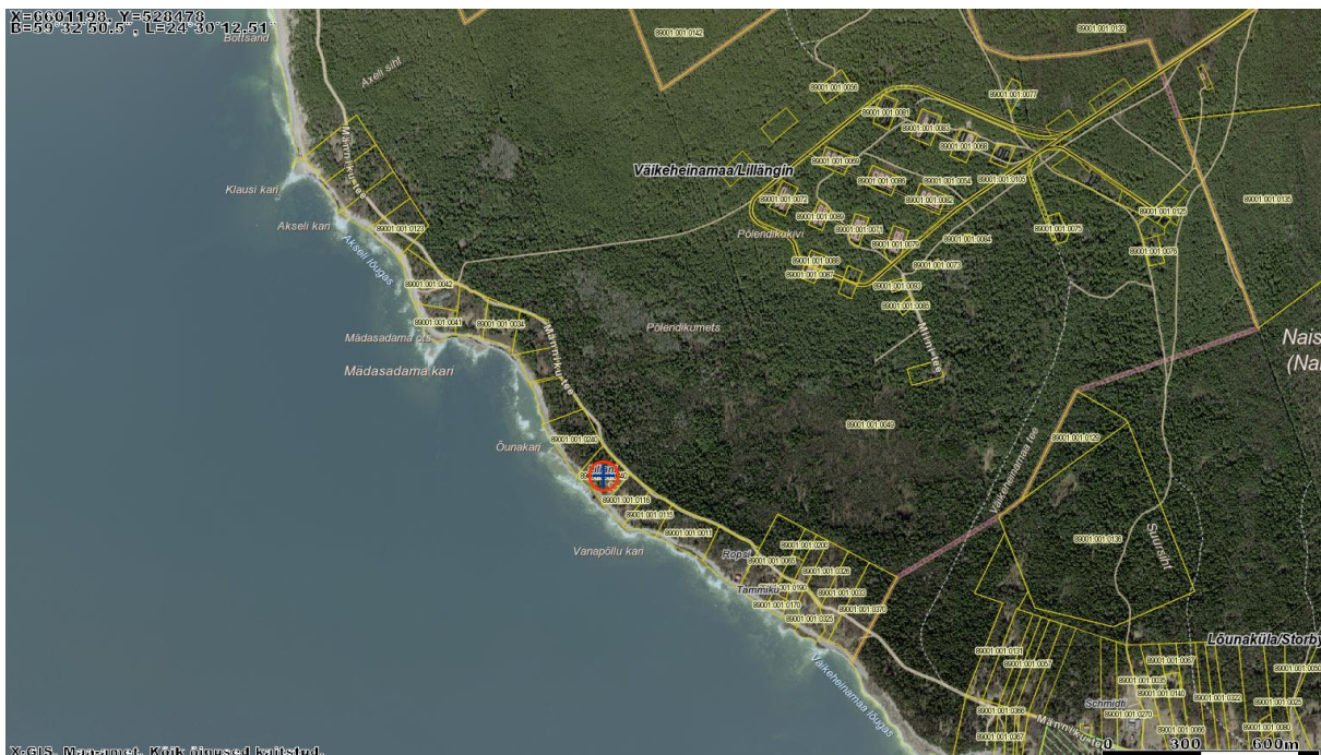
Joonis 1. Planeeringuala asukoht

Kogu Naissaare territoorium kuulub Naissaare looduspargi koosseisu. Kaitseala pindala on 1887 hektarit. Ala suurim väärtus on erinevad metsaelupaigatüübid. Kaitsealal on võimalik leida metsakooslusi kuivadest kõrgetel luidetel kasvavatest sambliku kasvukohatüübi puistutest laanekuusikute ning soostunud metsadeni. Naissaarele on iseloomulik ka erinevate rannatüüpide kiire vaheldumine. Naissaare looduspargi kaitseala maa-ala jaguneb vastavalt kaitsekorra eripärale ja majandustegevuse piiramise astmele kuueks sihtkaitsevööndiks ja üheksaks piiranguvööndiks. Planeeritav ala paikneb „Väikeheinamaa“ piiranguvööndis.