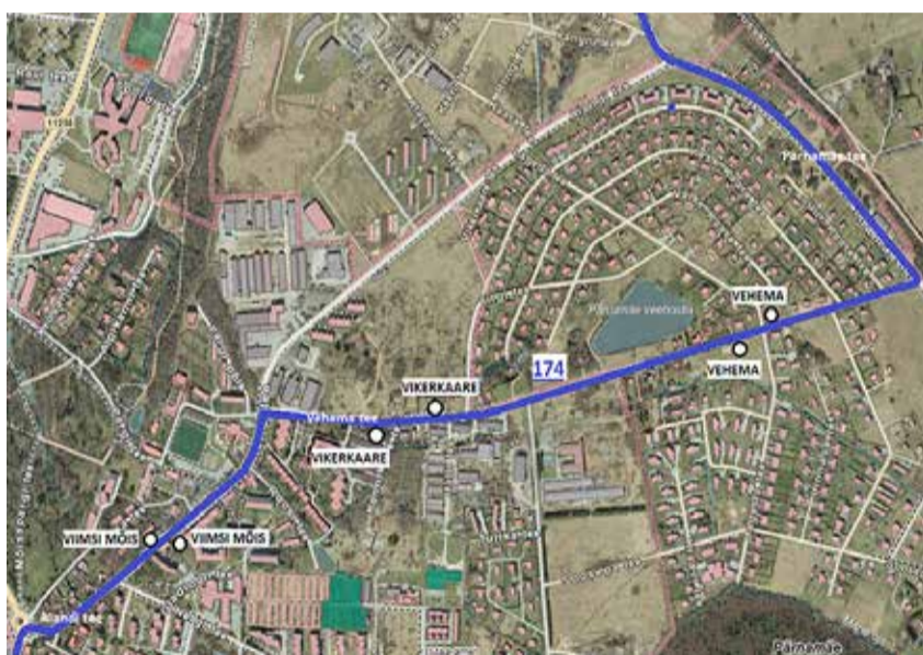
Maakonnaliini 174 uus marsruut ja peatused.