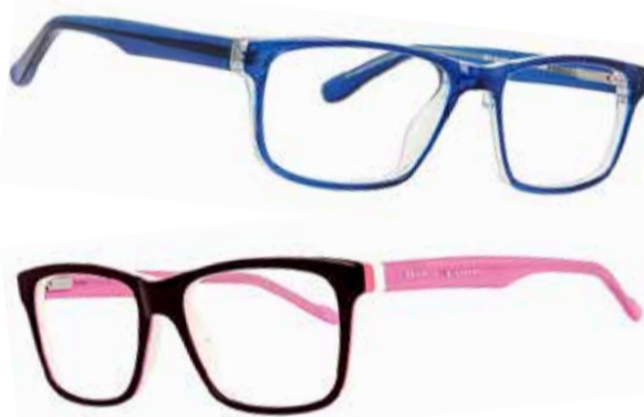
Kui silmaarsti juures käidud, leiab vajadusel ka koolilapsele sobivad moodsaid, aga vastupidavad prille Viimsi Keskusest.

■ Viimsi Keskuse kauplused on avatud E–L k 10–21, P k 10–19. Selver on avatud iga päev k 8–23. Vaata lisa www.viimsikeskus.ee .