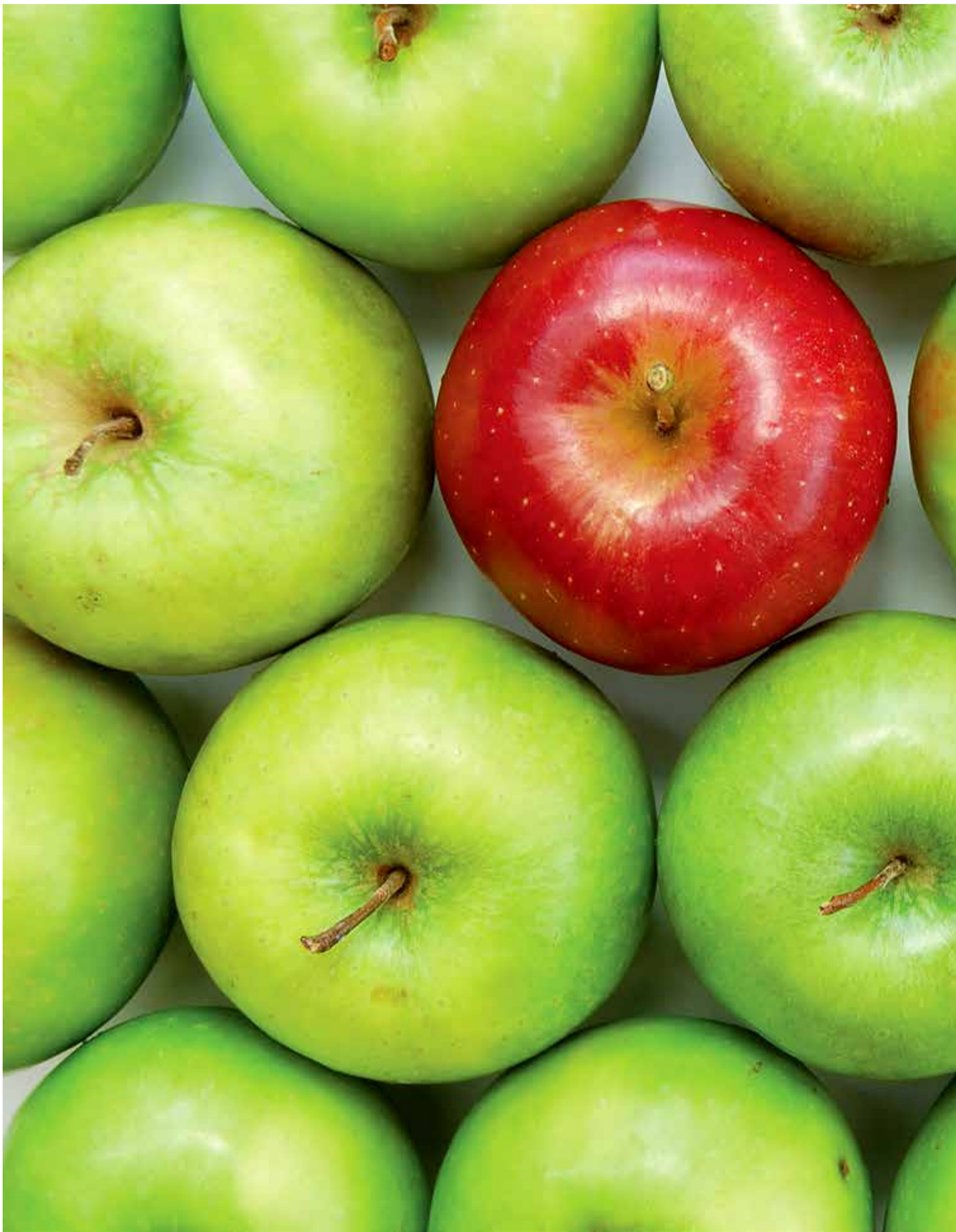
Üks õun päevas ...

Juur- ja puuvilja kasvatamisel on üks piirang – seoses seakatkuga peavad nad kõik olema kasvanud alal, mis on piiratud ja kuhu metsloomadel puudub ligipääs! Juur- ja puuviljad peavad olema sama kvaliteetsed nagu inimesed ise söök-