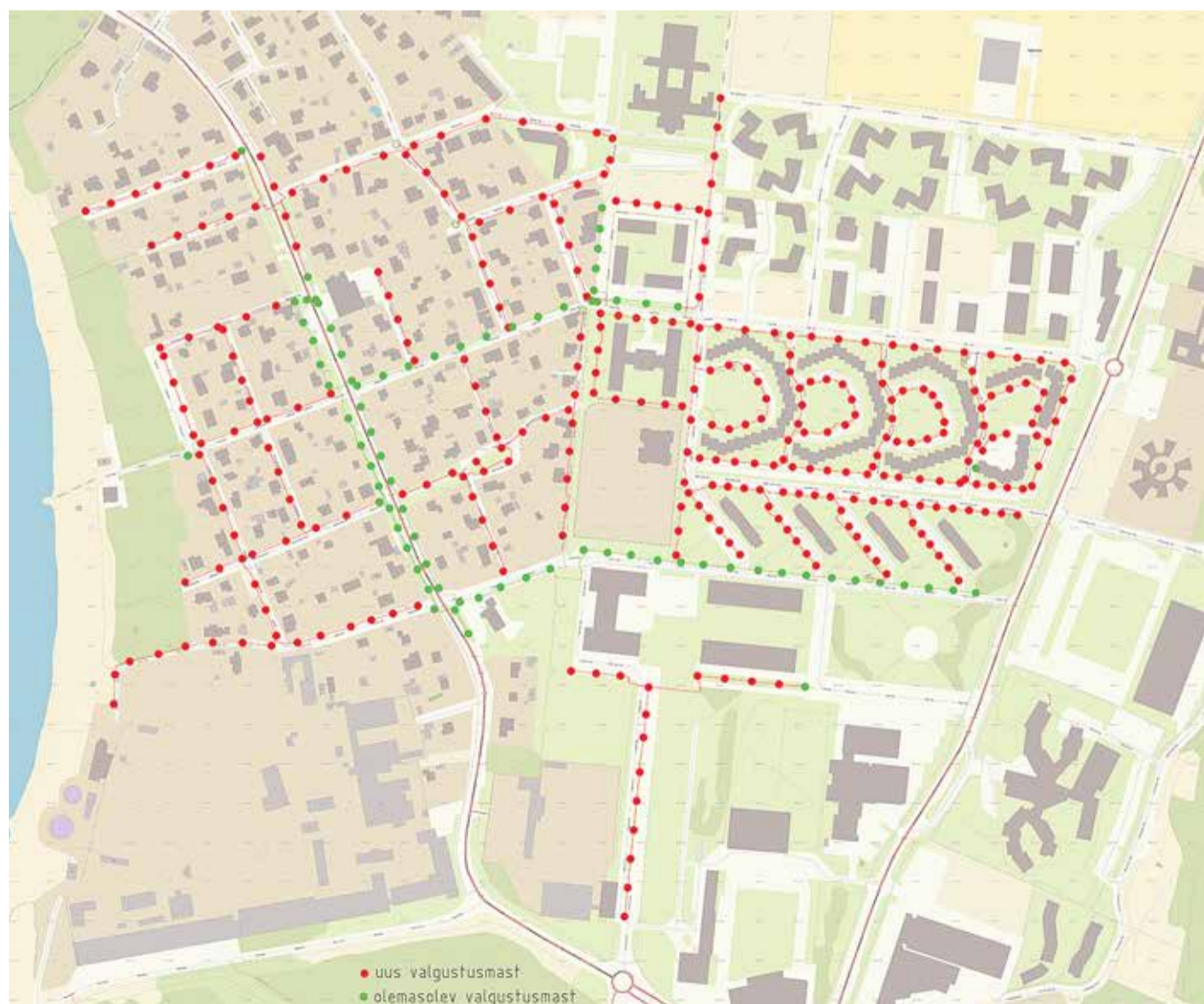
Tänavavalgustuse skeem. Skeem: Marge Kriisa