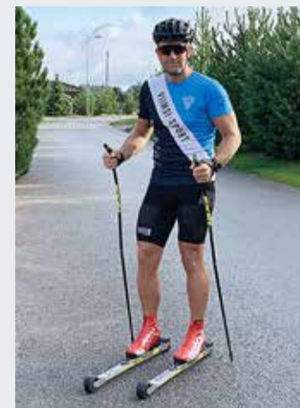
Viimsi Sport ootab sind!

Huviliste rõõmuks korraldab Viimsi Sport septembrist taas tasuta ühistreeninguid.