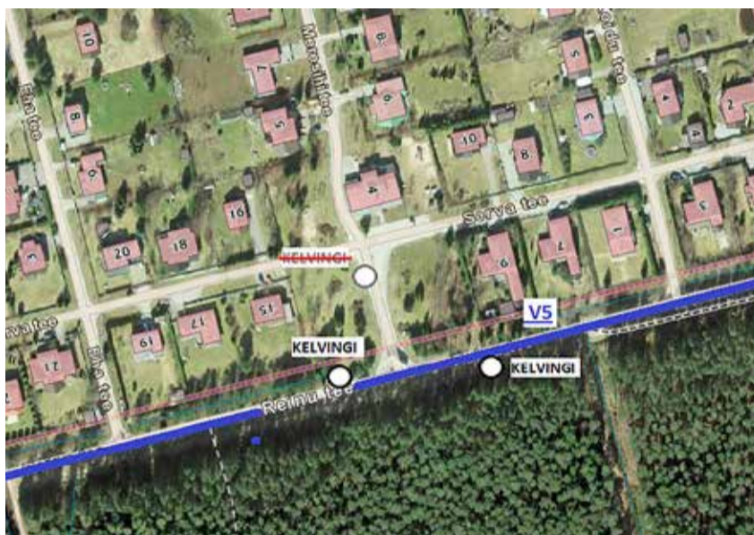
Bussiliini V5 uued peatused Kelvingis.