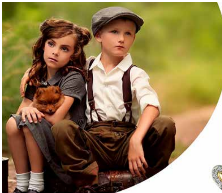
Juba suuremale koolijätsile leiab ka koolialguse põnevaid kingitusi. Fotod: tootjad

Toredaks kingiks on Apollo ja XS Mänguasjade valikus olevad laumängud, sest pärast pikka koolipäeva tahavad lapsed veidi ka mängude seltsis lõõgastuda. Male, kabe, Monopol ja paljud teised tuntud ning veel avastamist ootavad mängud pakuvad lisaks mõnusale puhkepausile palju õppimisrõõmu – kas siis mänguraha kokku lugeses,