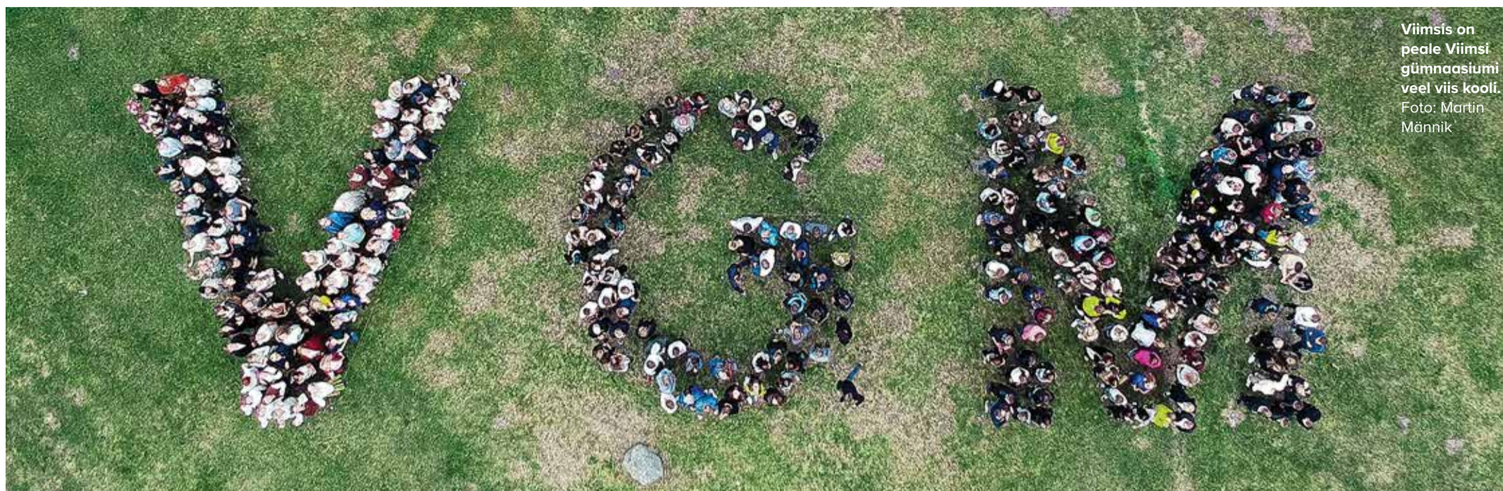
Viimsis on peale Viimsi gümnaasiumi veel viis kooli.