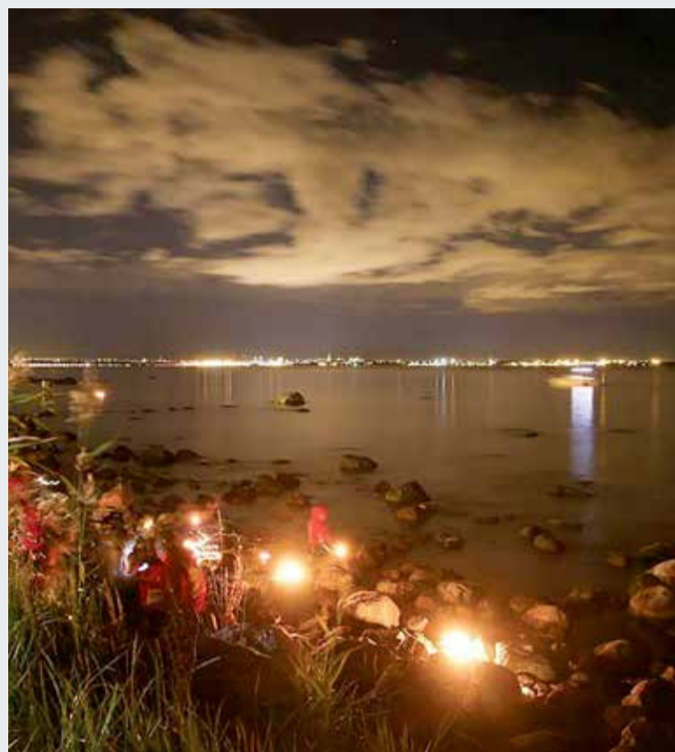
Muinastuled süüdatakse Naissaarel, Prangli saarel, Viimsi vabaõhumuuseumis ja Tammeeme külaplatsil.