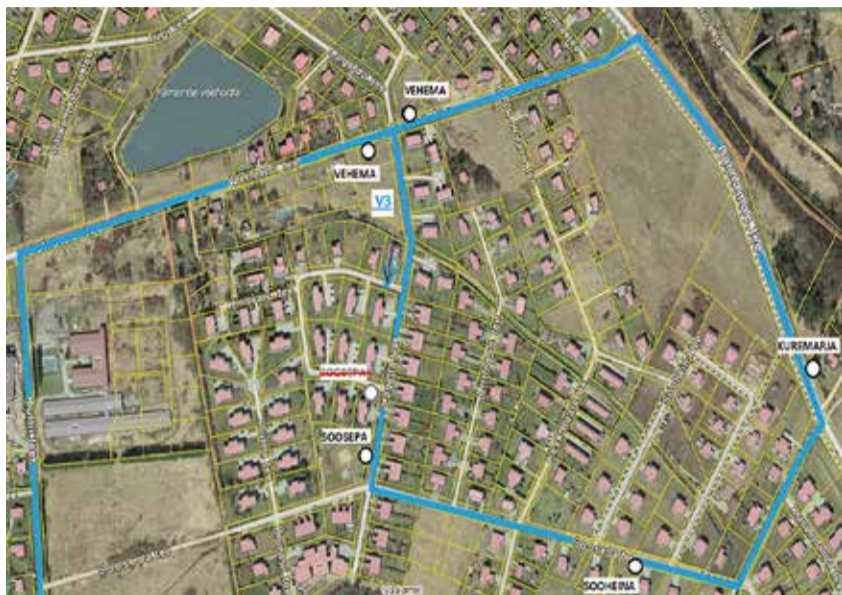
Bussiliini V3 uus kulgemistee Pärnamäe külas.

Kui oled unustanud oma asjad bussi, tuleks helistada vedaja infonumbrile ja anda teada, mis liinil, millisel kellaajal ja kuhu poole sõitsite. Kirjeldage esemeid ning jätkke oma kontaktand-