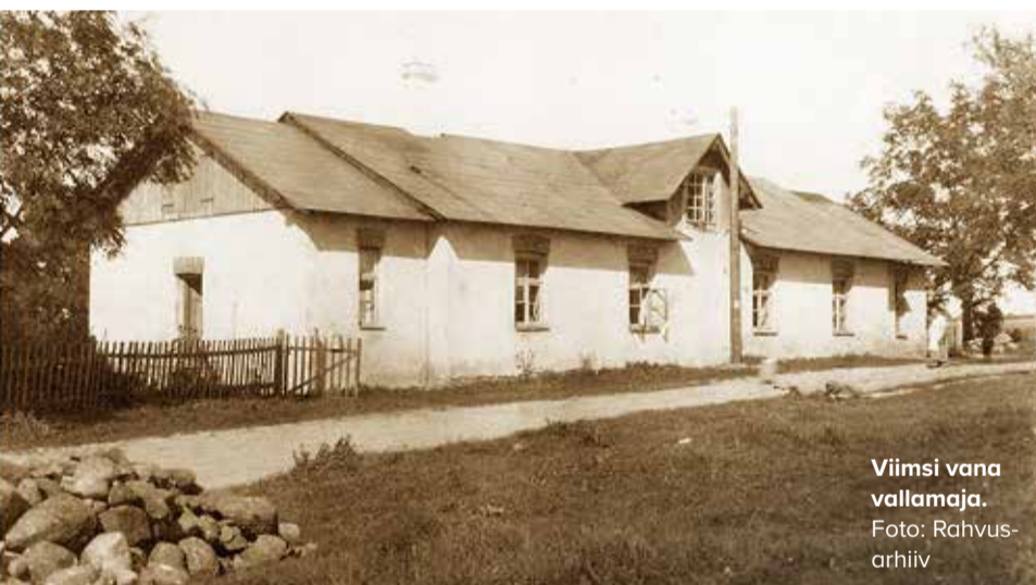
Viimsi vana vallamaja.