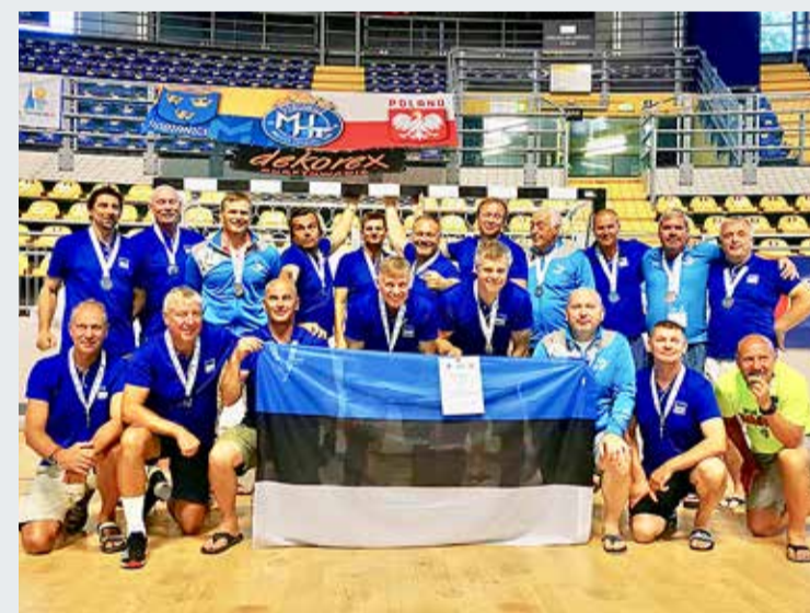
Võidukad käsipalliseeniorid.

Eesti käsipalliseenioride võistkond HC Viimsi-Intrac/Manitou osales 26.–28. juulil Torinos Euroopa seenioride mängudel (European Masters Games 2019).