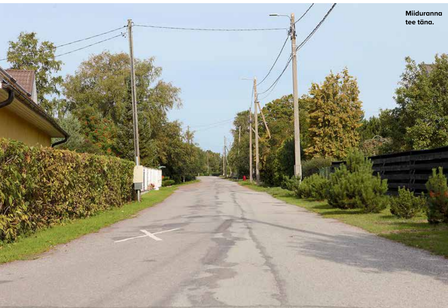
Miiduranna tee täna.