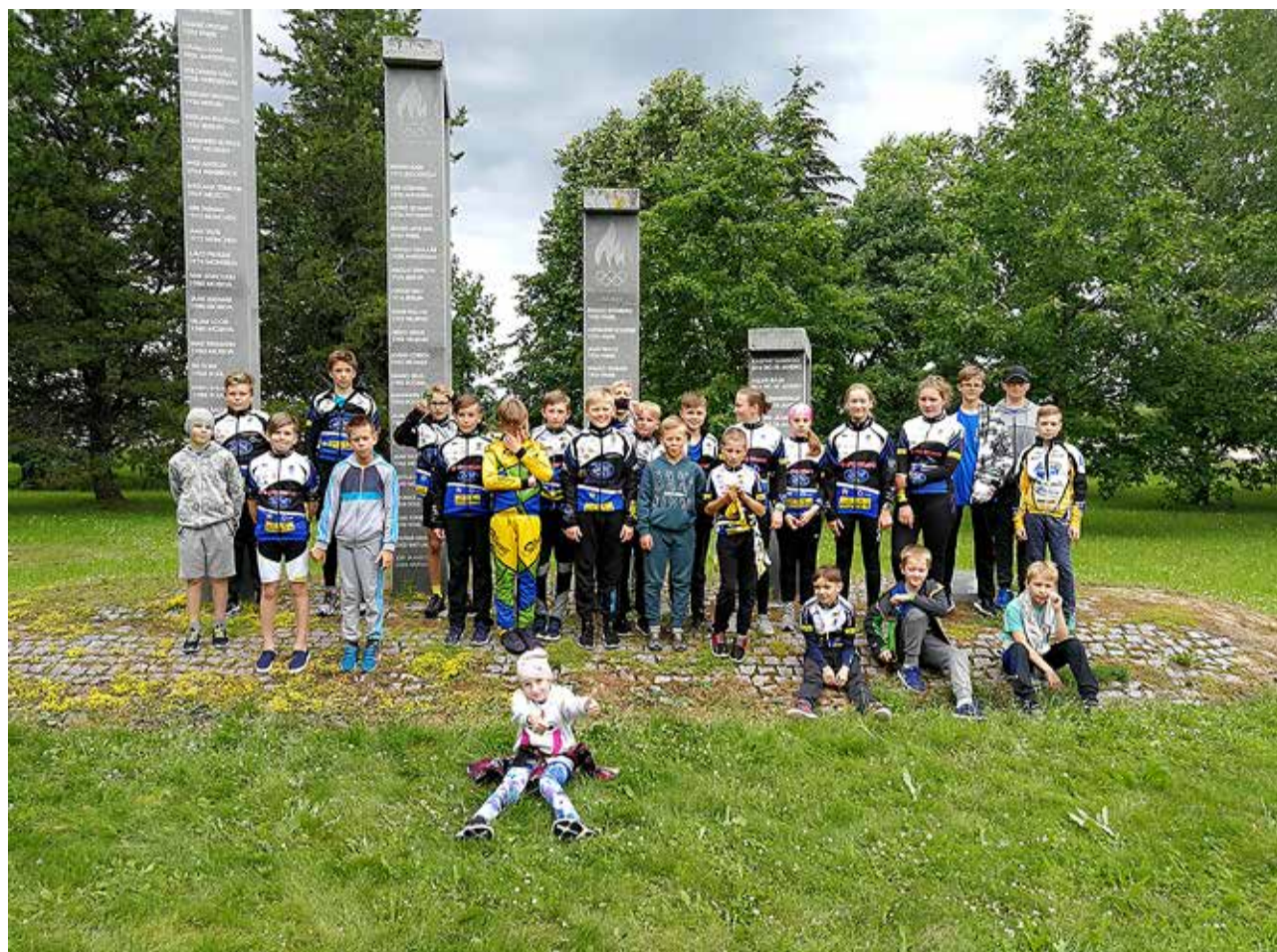
Kalevi Jalgrattakooli õpilased koos teiste klubide õpilastega. Põltsamaa laagris Olümpia sammaste juures.