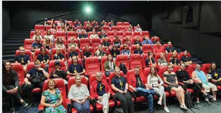
Maleva lõpetamine Viimsi kinos.

Seekord on malevasuvi taas lõppenud, kokku sai töökogemuse nii rühmades töötades kui ka noori juhendades 120 Viimsi noort vanuses 13–26.