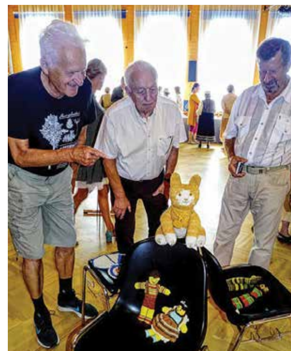
Huvilised imetlevad heegeldatud mänguloomakesi.