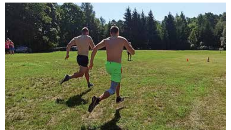
Jooks täies hoos.