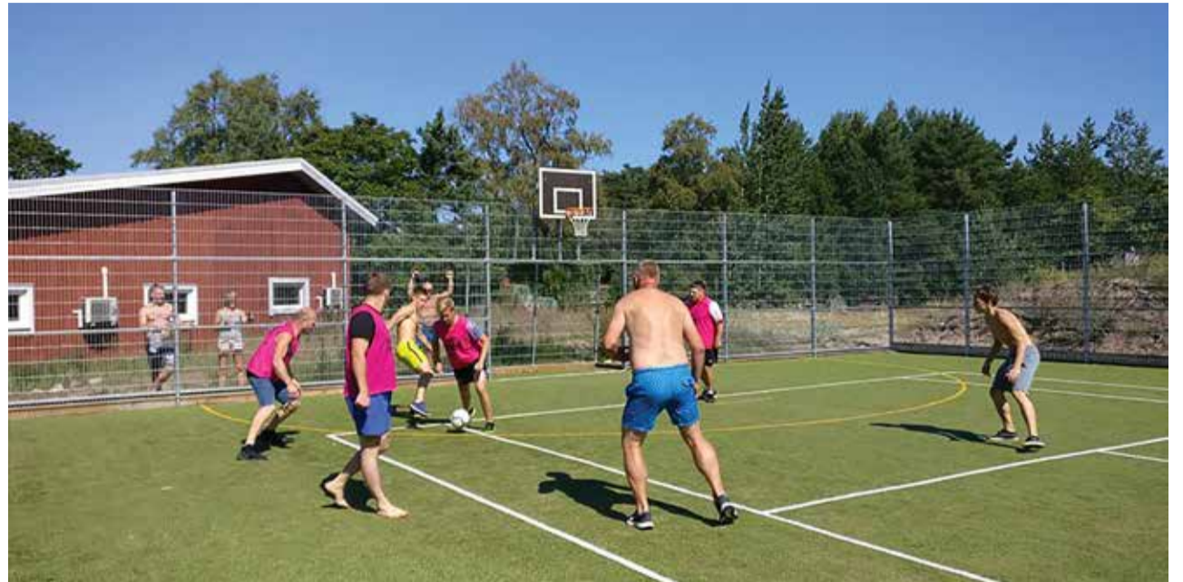
Jalgpall oli tõeliselt kuum.