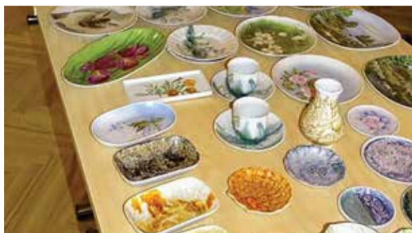
Näitusel ei puudunud ka keraamika ja vitraažid.