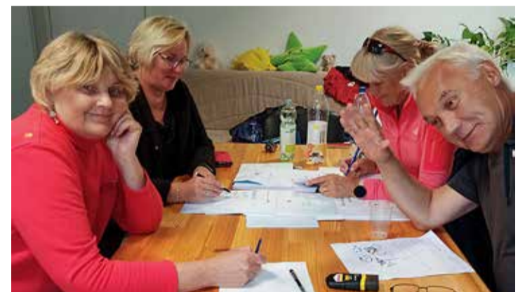
Kohtunikel tööd jagus – välja anti 145 diplomit.

KEHAKULTUUR Prangli saare suve üks oodatuid sündmusi – spordipäev – toimus 8. augustil spordiplatsil Rätsepamäel. See koht, kus sai koos võrkpalli mängitud ja kust hiljem ujuma minud, on saarel olnud noorte kogunemiskohaks läbi aegade.