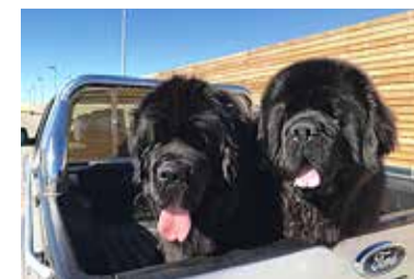
Kaks turisti vastremonditud Naissaare sadamas.