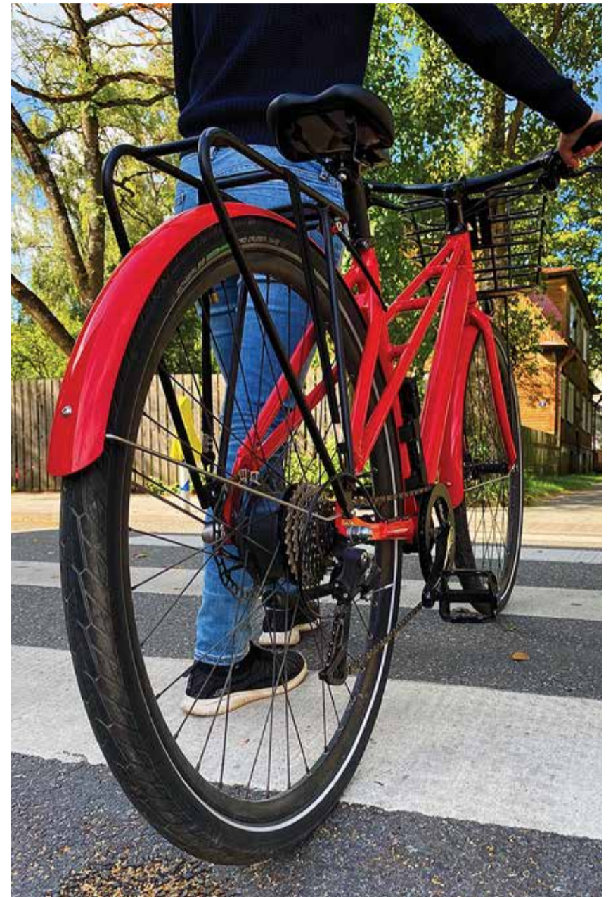
Enne tee ületamist veendu, et sind on märganud.

Kahjuks näeme üha enam, et nii lapsed kui ka täiskasvanud ratturid kuulavad liikluses osaledes kõrvaklappidest muusikat. See muutub eriti ohtlikuks just tee ületamisel, kui kõrvaklappidest tuleva valju muusika tõttu jääb kuul-