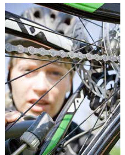
Kontrolli, et ratas oleks tehniliselt korras.

Enne, kui last jalgrattaga liiklusesse lubada, tasub temaga koos üle korrata liikluse reeglid ning üheskoos läbi sõita marsruudid, mida laps igapäevaselt lä-