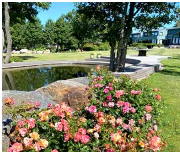
Konkursil "Eesti kaunis kodu" Harjumaa kauneimaks tunnustatud eramu aed Viimsi vallas Pringi külas.