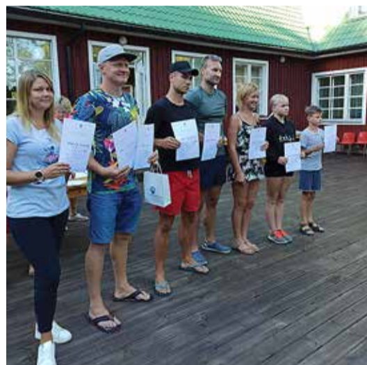
Kummikuvise oli populaarseim ala, pildil võitjad.