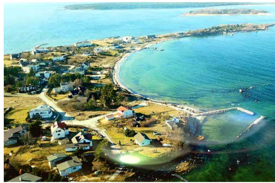
Rohuneeme tipp.

Kogukonna areng ja kasvamine ei sõltu aga kinnisvaraarendajate võimetest uusi maju ehitada ega ka vallavalitsuse võimest teid, koole ja avalikke