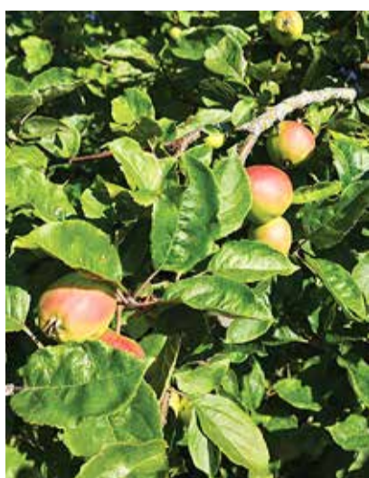
Päike on õunte paled juba priskeks paitanud, ärme lase neil raisku minna!

Kui Sinu aias on õunapuud ja tead, et Sa põhjusel või teisel neid õunu ära ei suuda tarbida, anneta need mahlateoks. Kogume õunad vabatahtlike abiga kokku, muudame tööstuses mahlaks ning toome mahla tagasi Viimsi lasteaedadesse ja koolidesse. Selleks, et oskaksime üleüldse mingite mah-