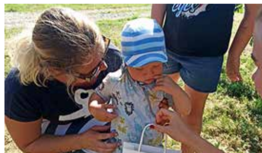
Kõige noorem osaleja oli 1-aastane.