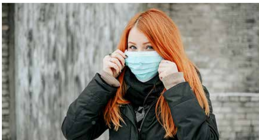
Kohtades, kus on inimesed koos kinnistes ruumides, tuleks kanda maski.

HOIA, mis teavitab sind, kui oled olnud lähikontaktis koroonaviiruse kandjaga. Samuti saad nii anonüümselt teavitada teisi kasutajaid enda haigestumisest. Rakenduse kasutajate telefonid vahetavad omavahel anonüümseid koode ning riik, rakenduse tootja ega telefoni tootja ei saa teada,