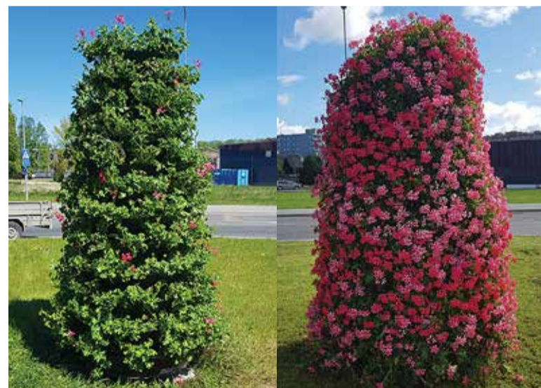
Aedniku suvi – juuni algus ja juuli keskpaik.

Kuhu viia niidetud hein ja rohitud umbrohi? Aednik soovib muidugi komposti teha, aga kui selleks soovi pole, siis võiks niidetud muru lähedalasuval metsikul heinamaal vähemalt laiaili laotada nii, et jääks õhuke kiht, mis laguneb kiirelt, mitte lihtsalt kärust ühte kuhja kallata. Hekkidest pügatud suuremaid oksa ja mahasaetud puid võtab tasuta vastu Lubja külas aadressil Metsise tee 11 asuv ettevõtte Puidukäitlus OÜ, mis jääkidest hakkepuitu valmistab.