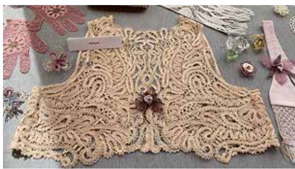
Niplispitsi tehnikas tööd.