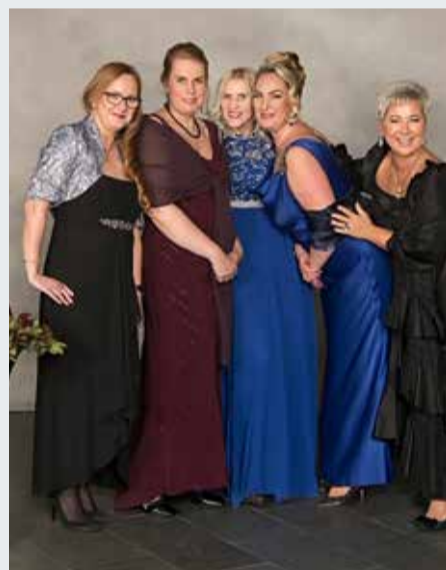
MTÜ Viimsi Invaühingu juhatus ja balli peakorraldajad.

Viimsi invaühingu poolt korraldatud Viimsi heategevusball toimus sel aastal juba 13. korda ja aasta 2020 ball on juba ettevalmistamisel.