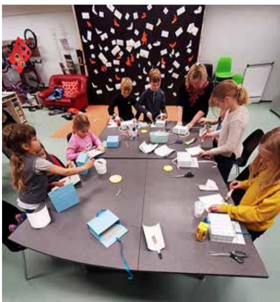
Tegus päev Randvere noortekeskuses.

Masin on programmeeritav, lõikama erinevaid kujundeid paberist, vinüülplastist, vildist või kangast. Projekti raames tehti koostööd Randvere kooli ja Randvere päevakeskusega. Päevakeskuses valmistati vanavanemate päeva tähistamisel pildiraame ning töötoa viisid läbi noored ise. Läbi käelisi tegevusi arendavate töötubade on noored endi sõnul avastanud endas andeid ning saanud võimaluse neid arendada.