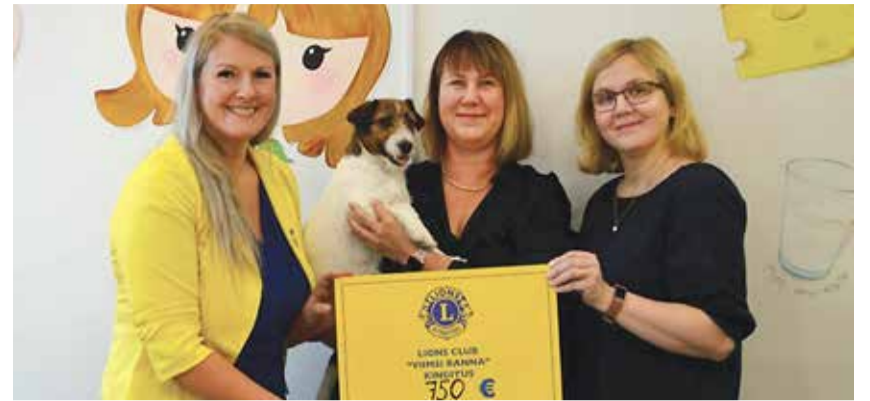
Viimsi Ranna Lions klubi toetuse üleandmine hüpokeer Lottale.

Diabeet ehk suhkruhaigus on krooniline ainevahetushaigus, mille puhul