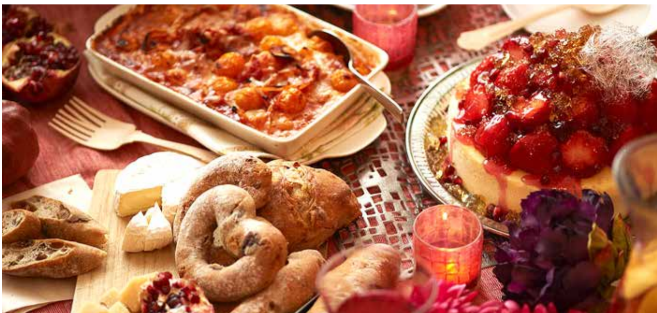
Lase maitsemeeled valla!

Traditsioonilisi toite saab huvitavamaks muuta uudsete lisanditega – jõululauale sobivad loomulikult erinevad moosid ja kastmed, mida saab nautida nii soolaste kui ka magusate roogadega. Selveri gur-