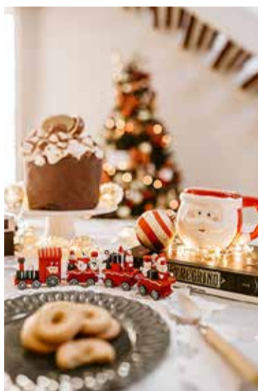
Naudi kaunist jõuluaega ja pühadega seotud hõrke maistusi!

meeletis on näiteks ootel kuivatatud tomati-balsamico tšatni, sidruni-laimi marmelaad, ingverimoos, jõhvika kaste portveiniga (kõik Mrs Bridges), aga ka Tamme talu jõulumoos ja sibulasärts. Juustude juurde saab pakkuda viigimarjasinepit või kirsikastet, mis jõulutoitudele uudseid maitseüansse lisavad.