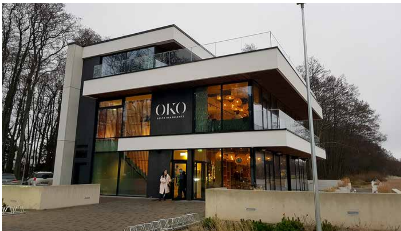
OKO Resto ootab kõiki aastavahetuse peole.