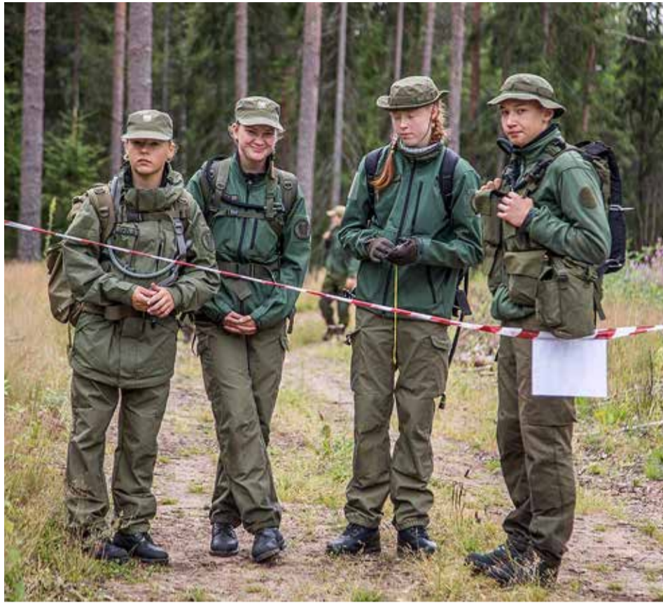
Viimsi kodutütred ja noorkotkad koos tegutsemas.

Kõigepealt annab see lapsele täiendava ja kõrbelise kasvukeskkonna, mida me organisatsioonis nimetame isamaaliseks kasvatuses. Me arvame, et see peaks toetama enekõike kodu, kust laps saab kõige väärtuslikuma osa kasvatuses. Samuti eeldame ka paremat toi-