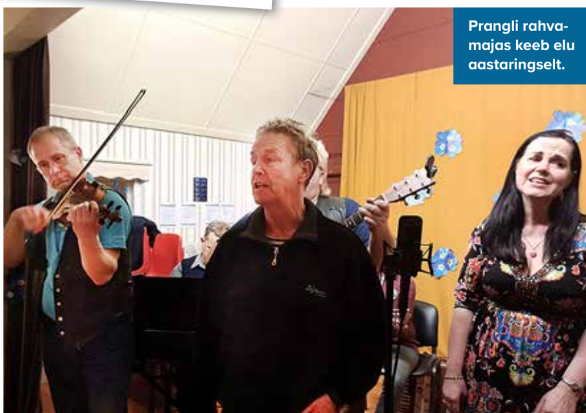
Prangli rahvamajas keeb elu aastaringset.