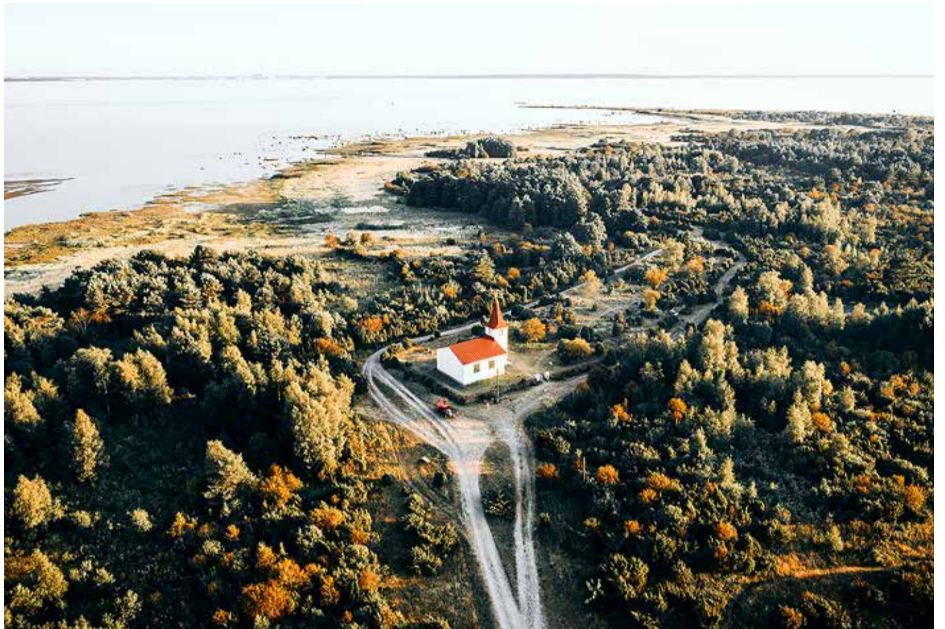
Prangli kirik Lääneotsa külas.

Õige oleks öelda, et ega tagasihoidlik saarlane suurt oma saarest lehes ei kirjuta, aga kirjutame ikka,