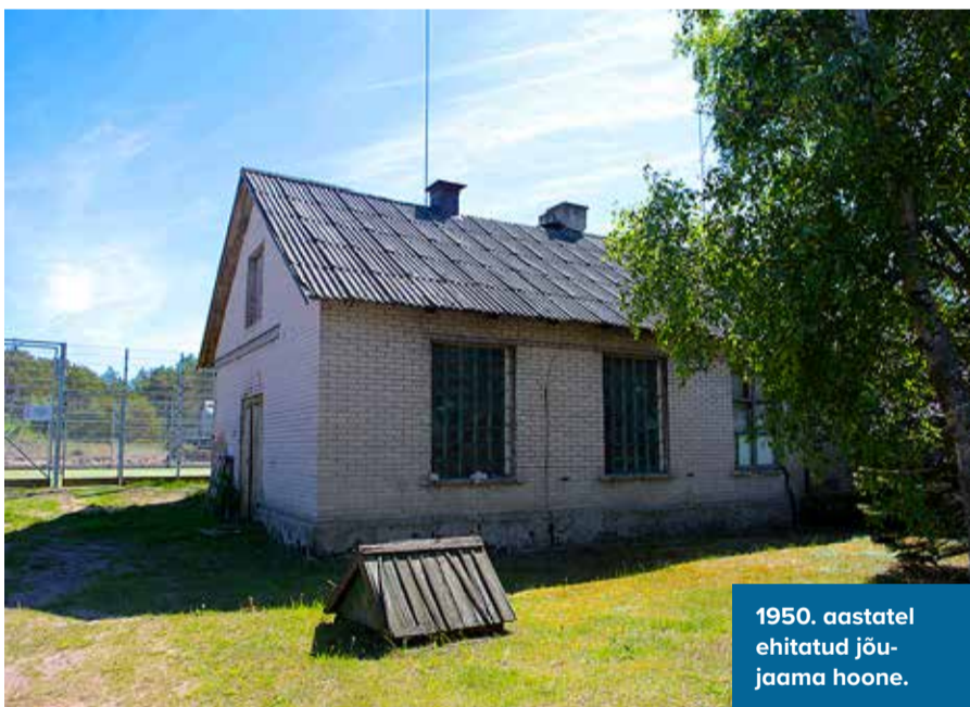
1950. aastatel ehitatud jõujaama hoone.