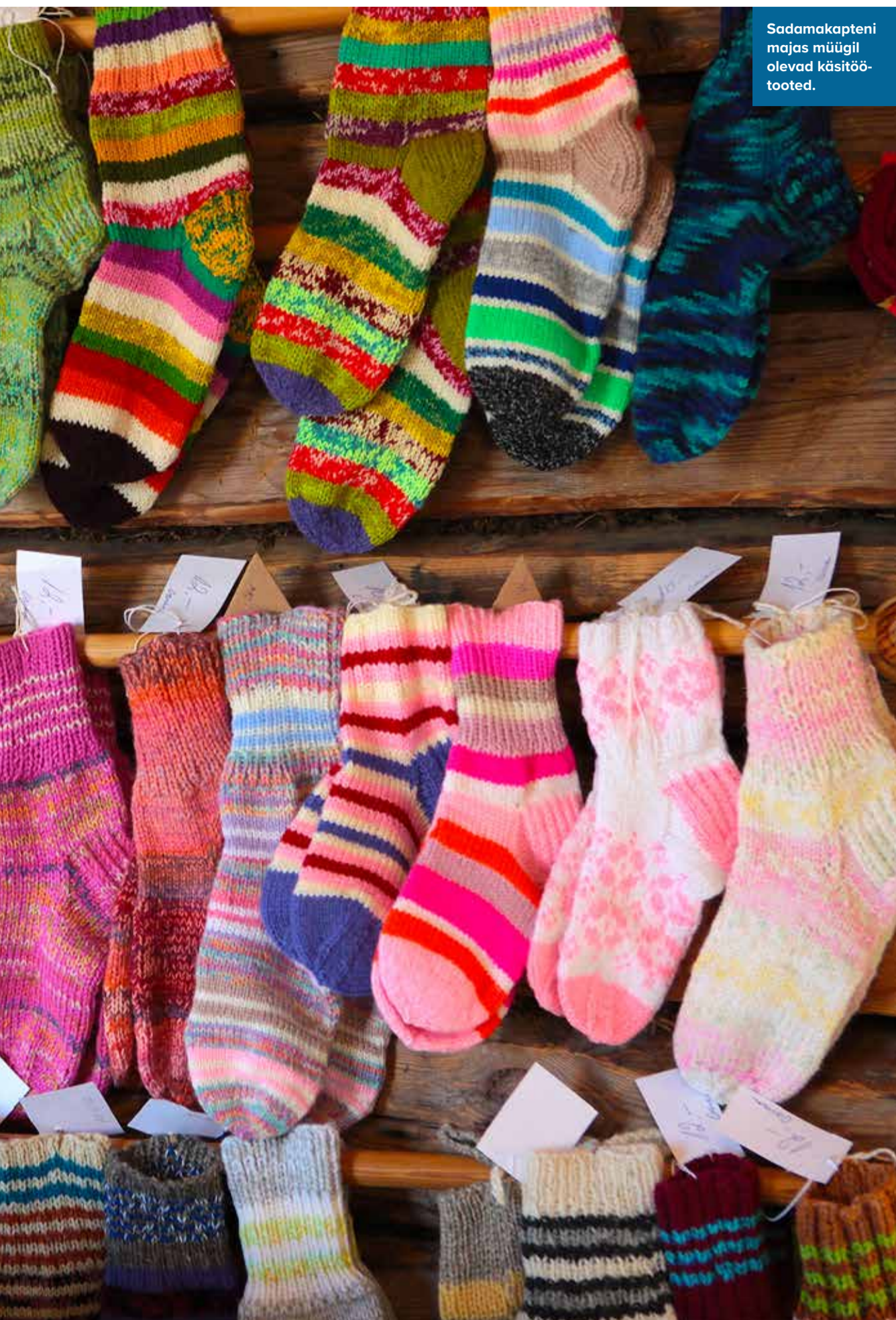
Sadamakapteni majas müügil olevad käsitöötooted.