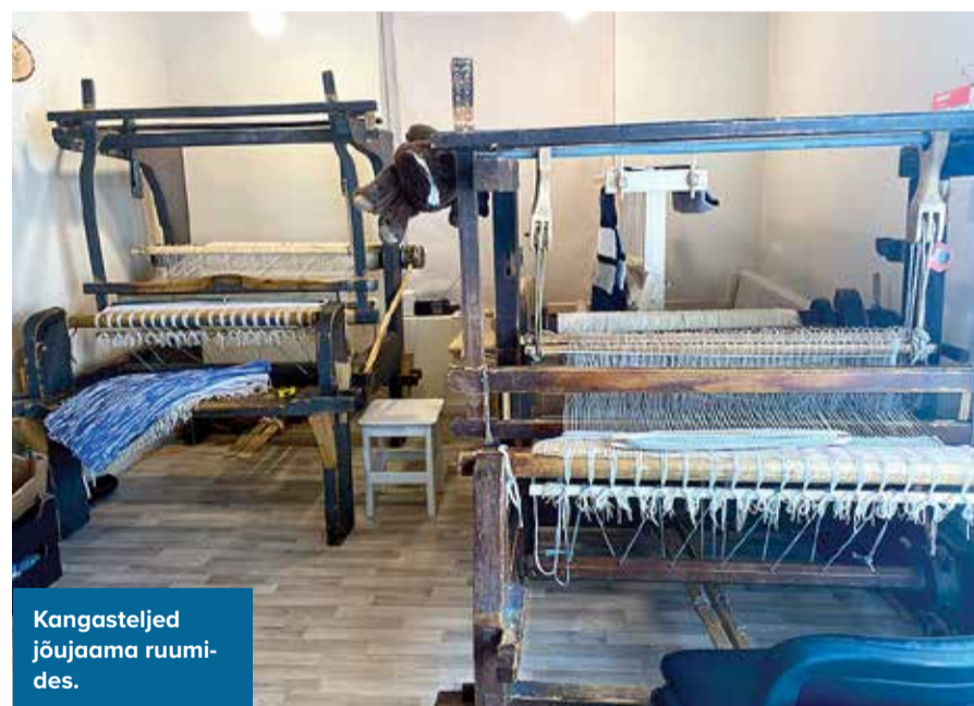
Kangasteljed jõuamaa ruumides.