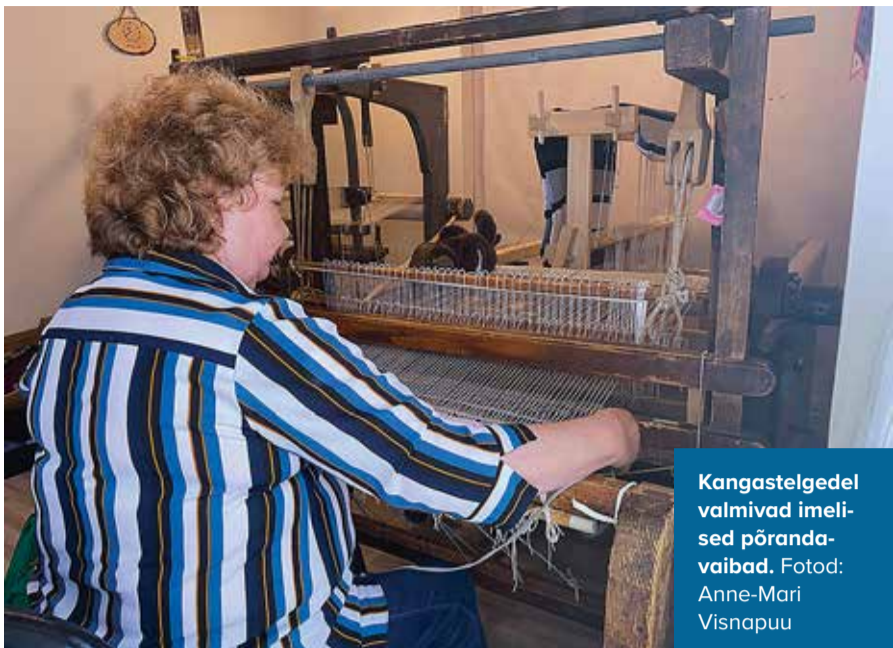
Kangastelgedel valmivad imelised põrandavaibad.