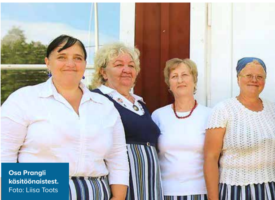
Osa Prangli käsitöönaiatest.