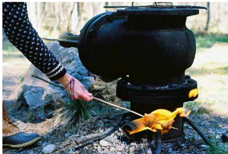
Prangli maagaasi läte ehk rahvakeeli gaasiük.