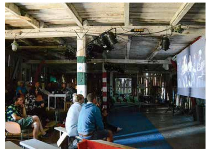
Filmi esilinastus Prangli saarel 14.07.2019.

2018. aastal käivitus Põhja-Harju Koostöökogu Leaderi toel ning MTÜ Prangliranna eestvedamisel projekt, mille käigus illustreeriti laeva Eestirand hukuga 1941. aastal seotud sündmusi. Projektiga olid sündmuste toimumiskohana seotud Prangli saar ning Neeme, lisaks kaasati Viimsi Rannarahva muuseum.