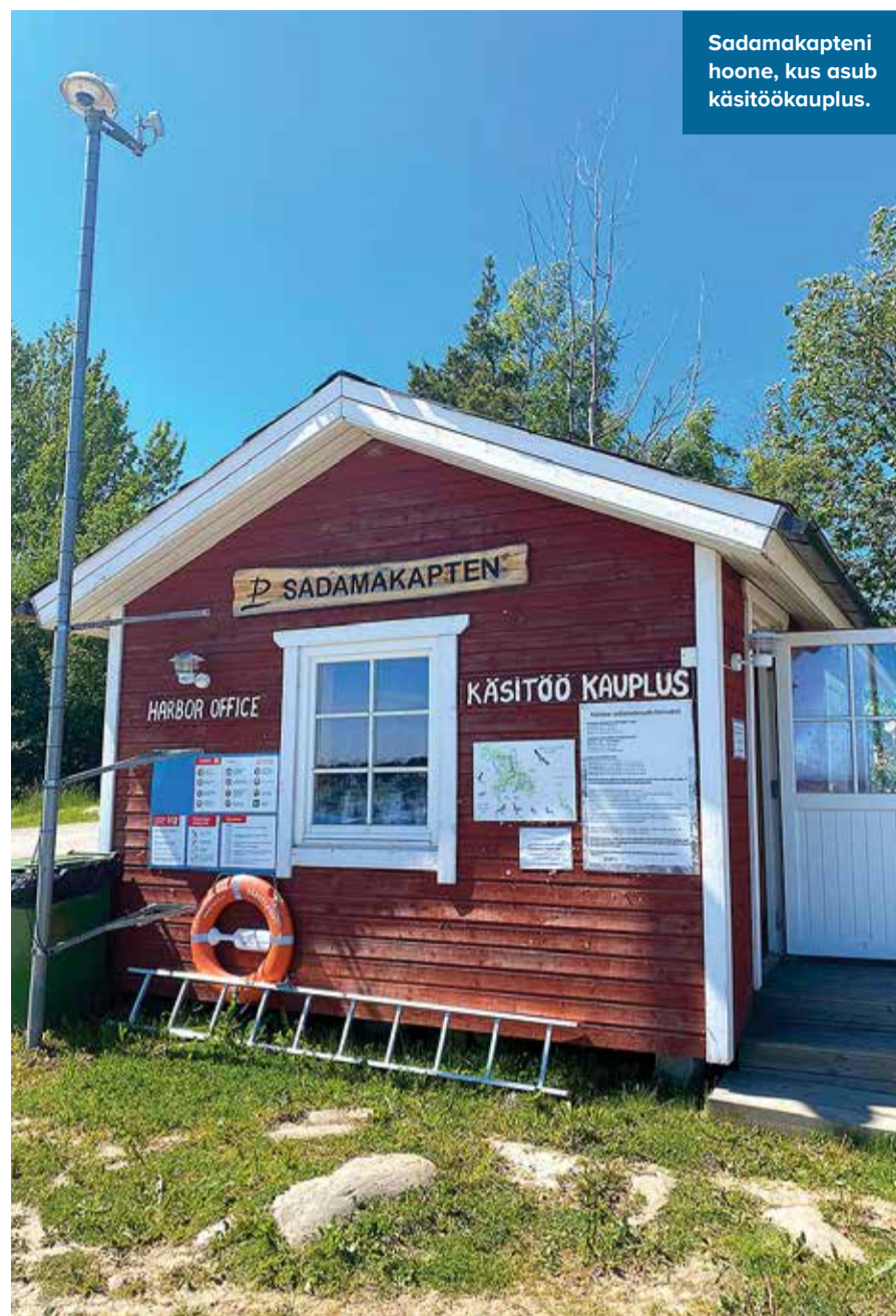
Sadamakapteni hoone, kus asub käsitöökauplus.