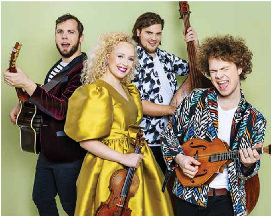
Curly Strings rõõmustab oma etteastetega alati nii suuri kui ka väikesi.

Curly Strings: Jaanipäeval on alati meie pere ja sõbrad kokku saanud ning siis on ikka väga-väga lõbus. Nüüd muusikutena on meil tihtipeale sel päeval esinemine ja seega tähistame seda koos teiste inimestega, mis on ju ka ääretult tore. Ootame väga üle pika aja kohutulist eheda publikuga.