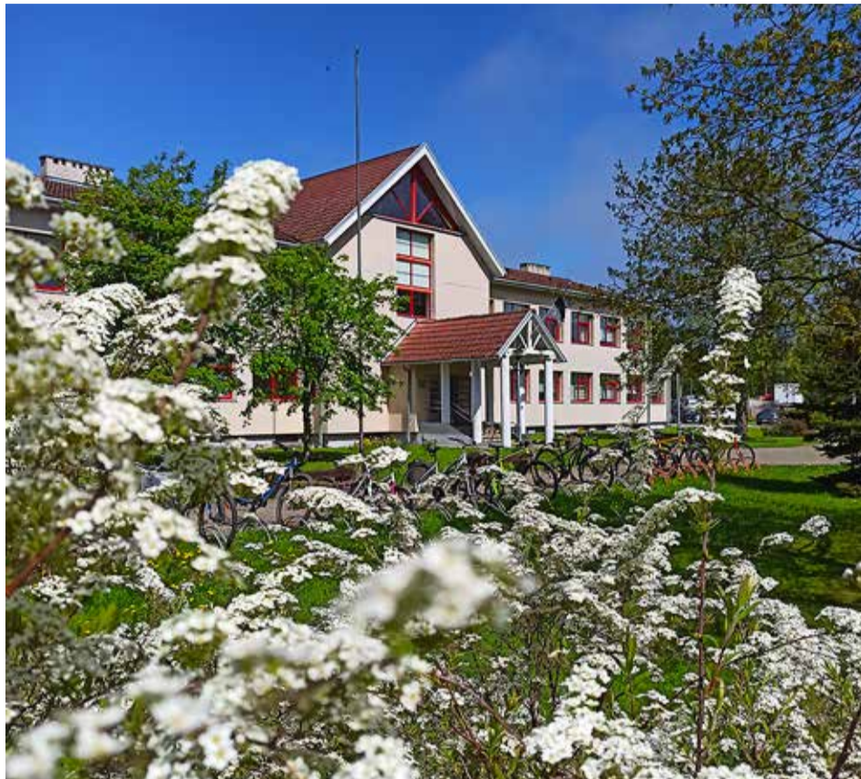
Väike, kodune ja armas Püüsi kool.

17 aastat tagasi Püünsisse kolides hakkas kohe silma kodutee ääres väike kena kool, kus lapsed vahetundide ajal õues ringi jooksid.