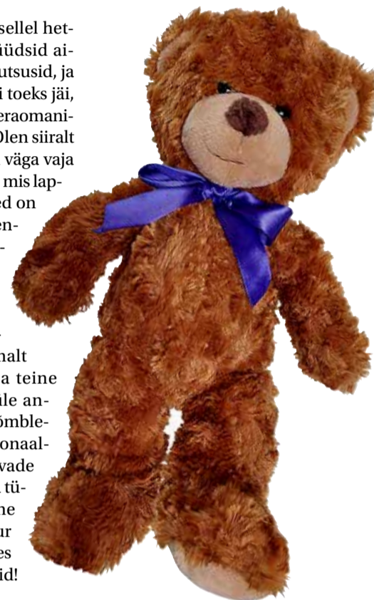
Politsei poolt lapsele antud Kalli-Karu pakkus väga vajalikku lohutust.

Teiseks tahan tänada empaatilisi ja tublisid kiirabitöötajaid, kes meid esmalt koju sõidutasid (oli ju vaja teine tüdruk tema vanematele üle anda) ning siis lastehaiglasse õmblema viisid. Ees seisis emotsionaalselt raske öö, kus peale haavade ülevaatamist lahutati ema ja tütar liftis – üks palatisse, teine narkoosi alla õmblema. Suur tänu ka arstidele, õdedele, kes kõige vajaliku eest hoolitsesid!