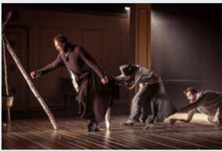
Hetk etendusest "Talupojad tantsivad prillid ees".

Reedel, 6. augustil ootab ees "Hingelt noorte festival" Paide vallimäel. Buss väljub Haabneeme busside lõpp-peatusest kell 8 suunaga Tammneeme, Randvere, Mähe.