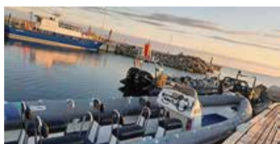
Laevastik Rohuneeme sadamas.

Watersport.ee pakub võimalust sõita Aegna saarele nii omale sobival kellaajal või liituda teise seltskonnaga. Suvi sõidetakse saarte vahet mitu korda