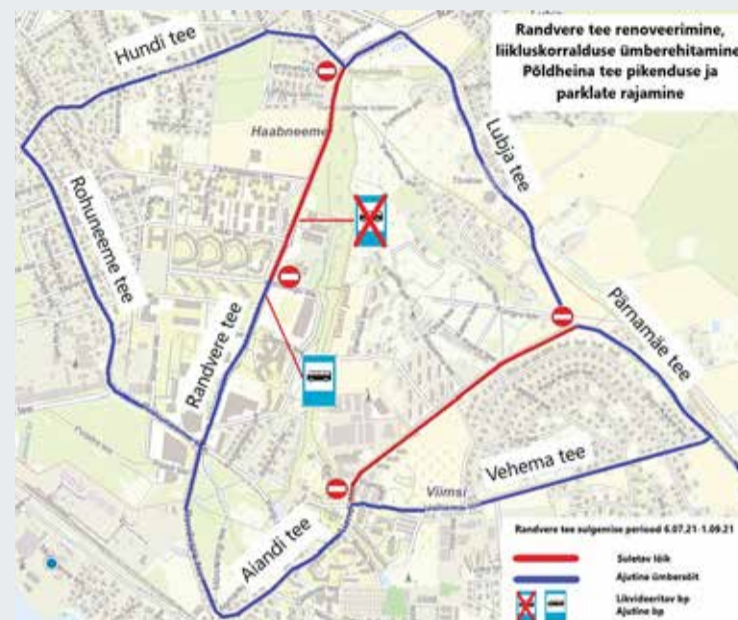
Liikluskorralduse skeem. Joonis: Trev2

28. juunil alustab valla lepingupartner AS TREV-2 Grupp Randvere tee ning Põldheina tee ja parklate ehitustöödega. Sel perioodil suletakse tavalikliiklusele teelõik vahemikus Hundi tee kuni Mereranna tee. Ajutine ümbersõit sõiduautodele on ette nähtud Hundi tee kaudu ja veoautodele Reinu tee kaudu.