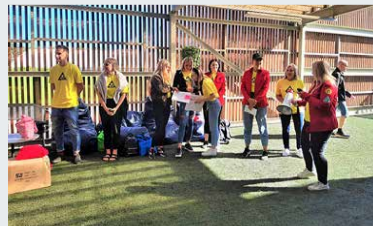
Viimsi õpilasmalev avati 14. juunil.