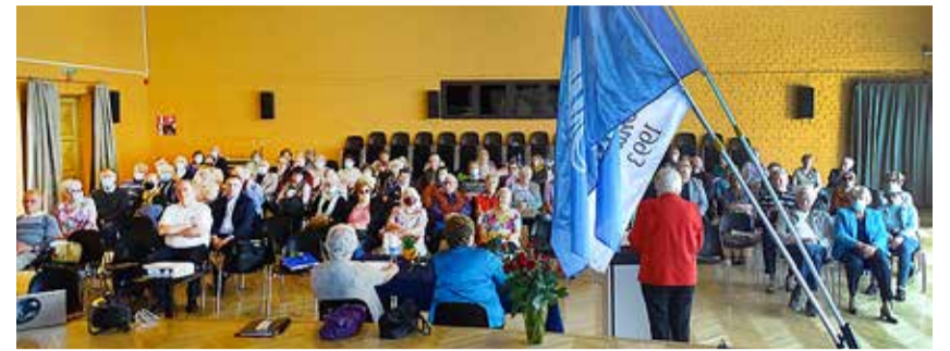
VPÜ suurkogu 29. mail Viimsi huvikeskuses.

VPÜ liikmed saavad valla toetusel osaleda kultuuri- ja spordiüritustel: matkata, käia ekskursioonidel, mängida bowlingut, harrastada kettagolfi ja kepikõndi, ujuda, treenida jõusaalet, kokata, maalida portselani, külastada teatreid ja kontserte, muuseumi ning väljanäitusi. Paljud meie liikmed osalevad päevakeskustes käsitöö-, laulu-, tantsu-, jooga-, sõnakunsti- ja näiteringides. Osaleme Viimsi Seenioride Nõukoja ja Rannameeste klubi töös.