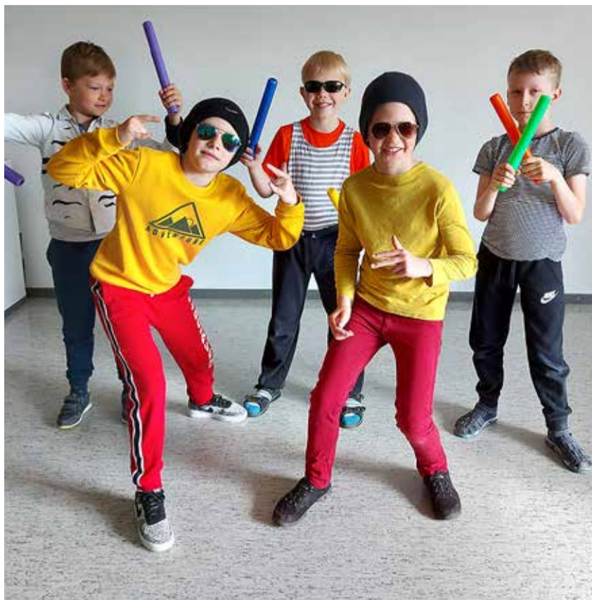
2b vahvad poisid.

Hääletamise tegi esinejate jaoks eriti põnevas asjaolu, et Viimsi kino oli