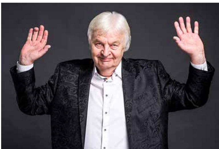
Ivo Linna laule teavad peast kõik viimsilased.

Curly Strings: Jaanitulele tulgu hea tuju ja tantsulustiga inimesed. Meie muusikale ei saagi ilma selleta kaasa elada!