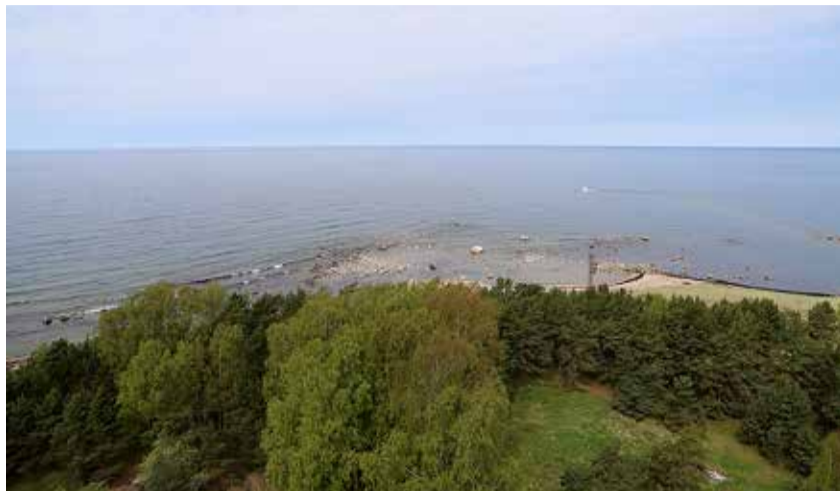
Naissaar on avastamist väärt ja suvel on üheks heaks võimaluseks Rannarahva festival.

Festival algab 10. juulil kell 15 Naissaare sadamas. Sadamaalal saab kogu festivali ajal mõnusa süüa-juua. Sinna jõudmiseks tuleb heita pilk Sunlinesi või reislaeva Monica kodulehtedele, kust saab osta endale sobiva laevapileti.