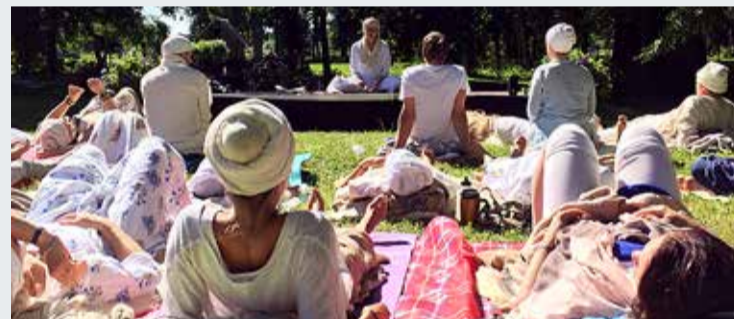
Tule perepäevale ja saa tuttavaks joogaga!