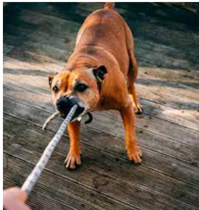
Koeraomanik peab oma looma eest alati vastutama.

VASTUTUS Kahjuks tuleb Viimsis liiga tihti ette olukordi, kus koera rünnaku käigus saab kannatada inimene või tema vara. Peame püüdlema selles suunas, et kõigil oleks hea ja hirmuvaba koos eksisteerida, olgu selleks siis jalgrattur, jooksja, lihtsalt jalutaja, ema käest hetkeks lahti lasknud laps, loomaomanik või lemmikloom. Seadus asetab suurema vastutuse alati siinkohal loomapidajale.