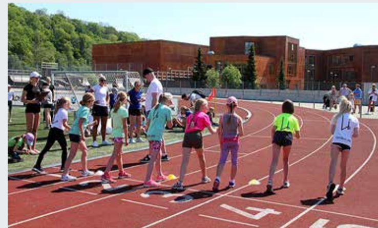
Laste rõõm sportimisest oli suur.

6. juunil toimus Viimsi staadionil esmakordselt spordiklubi Lindoni korraldatud mitmevõistlus 7–12-aastastele klubi noortele. Staadionile tuli kokku lausa 100 noort sportlast.