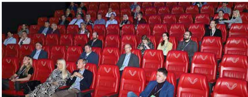
VT Viimsi ettevõtjad ootamas otseülekande algust Helsingist.

Koos vaadati Nordic Business Forumi ülekannet Helsingist ja arutati koostöövõimaluste üle rannarahva keskkonna-aasta 2020 planeerimisel ja õnnestumisel.