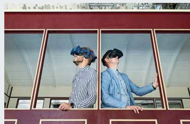
Avasta PROTO-s virtuaalmaailma sügavusi.

19. oktoobril avab Põhja-Tallinnas Noblessneri sadamalinna ukсед maailma esimene hariduslik virtuaalreaalsuskeskus PROTO, mis toob küllastajateni maagiliste leiutiste maailma. Enam kui 30 virtuaalreaalsuse ja “käed-küljes” eksponaati annavad võimaluse avastada ja proovida maailma muutnud leiutisi.