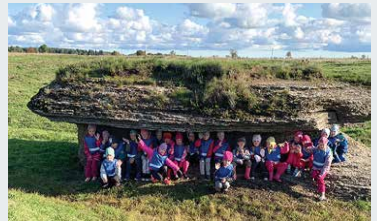
Täpselt õige koht grupipildi jaoks.