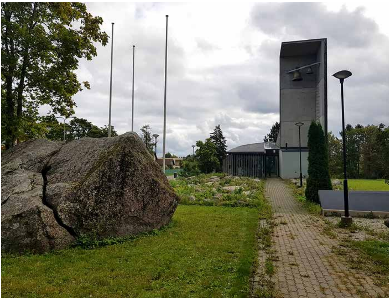
Viimsi Püha Jaakobi kirik.

“Koguduse liikmeks sobib iga inimene. Igaüks, kes usub, kes tunnustab oma usku ja kes seeläbi mõistab ikka enam, kuidas Jumal meid eluteel juhatab ja hoiab. Koguduse liikmeks saab inimene ristimise läbi, nii et ka lapsed, kes ristitakse, on koguduse hingekirjas. Täiskasvanuna lihtsalt antakse liiksaks ristimise toimingule ka leerit-