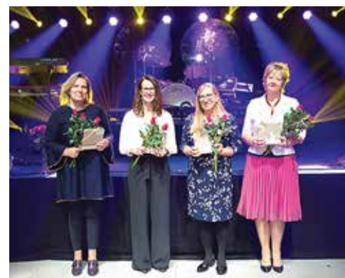
Viimsi koolide juhid.