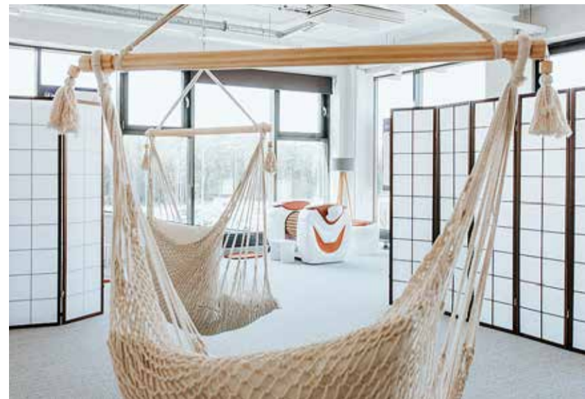
Hubane Roll Spot Viimsi stuudio ootab sind.

Kindlasti tekitab massaaž rohkem janu nendel, kes ei tarbi piisavalt palju vett. Samas võib see tekitada ka peavalu, kuid siis tulebki rohkem vett juua, sest toksiinid hakkavad liikuma. Une kvaliteedile ja magusaisu vähenemisele aitab samuti rullmassaaž kaasa – sel-