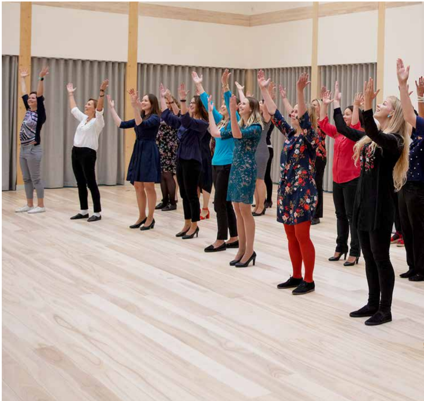
Õpetajate päeva aktusel esitavad õpetajad äsja omandatud tantsu.

Haabneeme koolis õpetaja rollis olles tulid mulle meelde ajad, mil ise olin veel seal koolis viienda klassi õpilane ning ei teadnud absoluutselt, mis mind ees ootab – millised uued võrratud sõbrad ma endale gümnaasiumist leian ning kui ägedad ja hoolivad õpetajad on mul privileeg endale saada. Ma tõesti saan vaadata tagasi oma kooliteele positiivselt ja ühel päeval võtan endale missiooniks tänada kõiki neid suurepäraseid inimesi südamest, kes on sellel teekonnal aidanud mul lõpusirgele jõuda. Arvan, et seda peaksime aeg-ajalt tegema me kõik, olenemata teekonna sihtmärgist või pikkusest. Arvan, et õpetajate ees suutsime tänu üheskoos juba veidi üles näidata kooli aktusel, kus kõigil abiturientidel läks süda sees soojaks, nii ka õpetajatel.