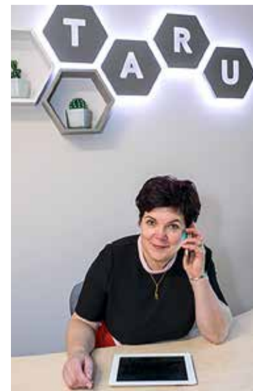
Taru on Viimsi ühistöökontor.

ma ette vastavasse konteinerisse või Uuskasutuskeskuse kogumispunkti, aga kasutuskõlbmatu tekstiili saab panna musta kilekotti ja anda tasuta ära anda Viimsi jäätmejaamas.