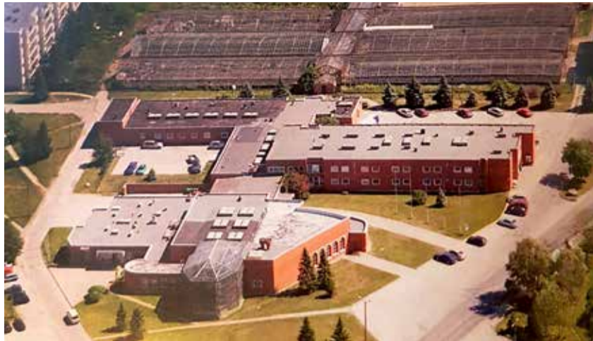
Pirita lillekasvatussovhoosi keskusehoone, kasvuhooned ja kortermajad 2006. aastal.

1. novembril 1944. aastal muudeti Viimsi majand Eesti NSV Rahvakomisaride Nõukogu otsusega uuesti Viimsi abimajandiks, mille juhatajaks mää-