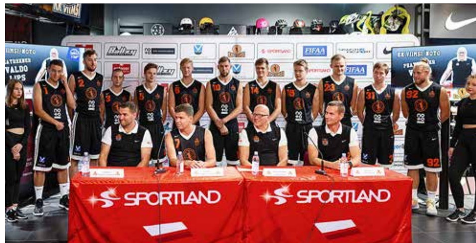
Viimsi/Estover esindusmeeskond.

Meeskonna peatreenerina jätkab Valdo Lips, kes on komplekteeritusega rahul ja kinnitab, et lisajõude juurde ei otsita. Üheks suurimaks eesmärgiks sel hooajal on jõuda põhiturniiril veerandfinaali