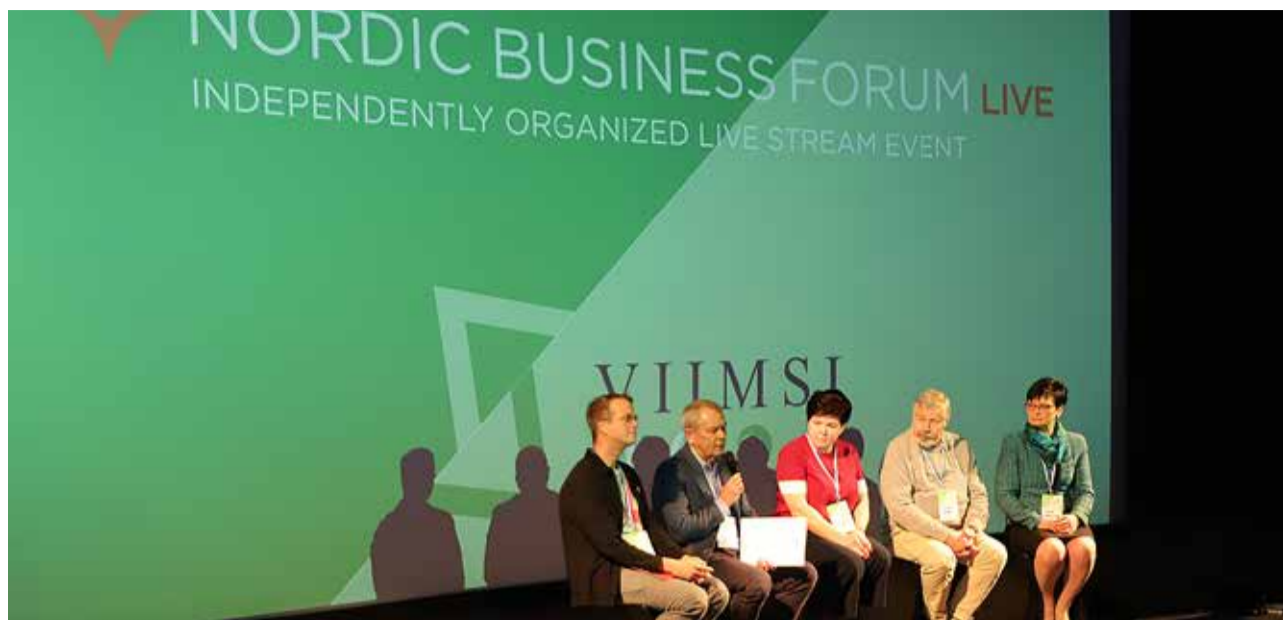
Ärifoorumile eelnes keskkonnateemaline diskussioon heategevusorganisatsiooni, ettevõtjate ja valla esindajatega.