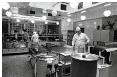
Söökla köögipool.