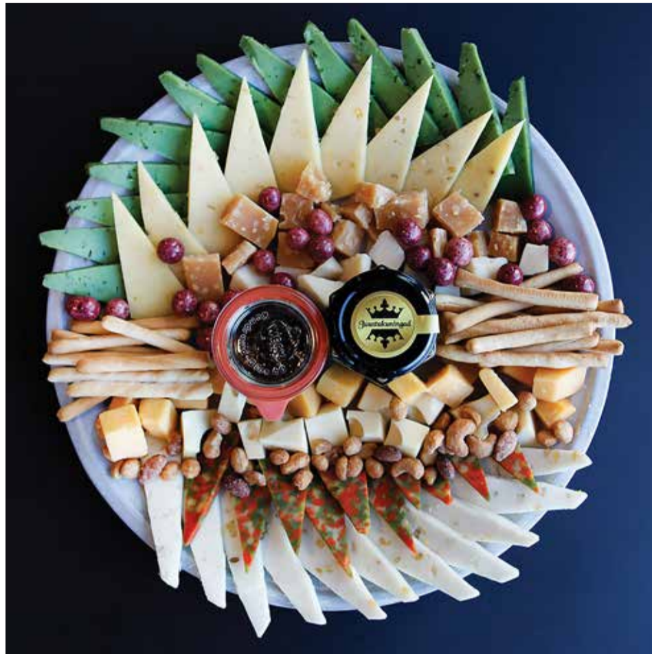
Uhke juustuvalik mõjub peolaul kui kunstiteos.

Krugeri veinipoe valikusse lisandusid suvel kaks veinimõisa Portugalist, Vinho Verde piirkonnast Quinta d'Amores ja Casa de Vilacinho veinikeldrist, mis on lühike aja võitnud paljude klientide südamed. Vinho Verded on tuntud oma värskuse, mahlaka puuviljasuse, madala alkoholisisalduse ja ilusa mineraalsuse poolest, mis teeb neist ideaalse kaaslaste paljude toitude kõrvale: salatid, mereannid,