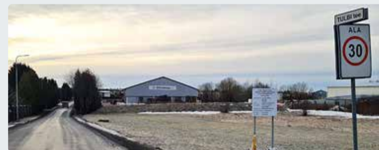
Tulbi teel toimub ajutine teesulg.