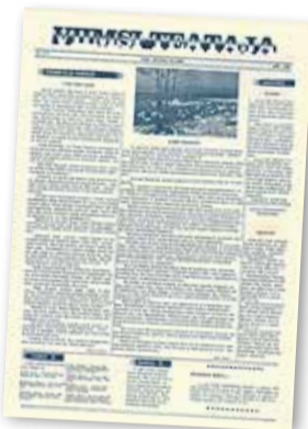
1989. aastal ilmunud esimene Viimsi Teataja esikülg.

1991. aasta aprillis muudeti rahvarinde häälekandja ümber Viimsi valla infoleheks ja toimetajaks sai