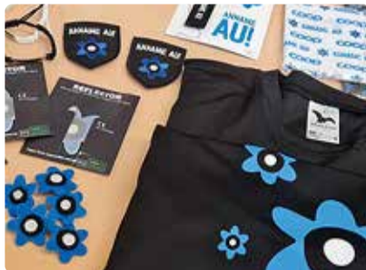
Ostes sinilillesümboolikaga esemeid, toetad Eesti sõjaveterane ja nende lähedasi.