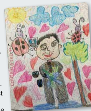
Lepatriinude kingitus vallavanemale.