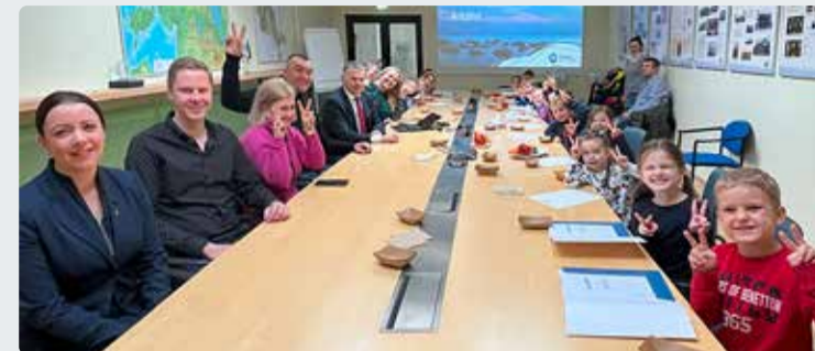
Lepatriinud tutvusid kohtumisel vallavanema tööga.