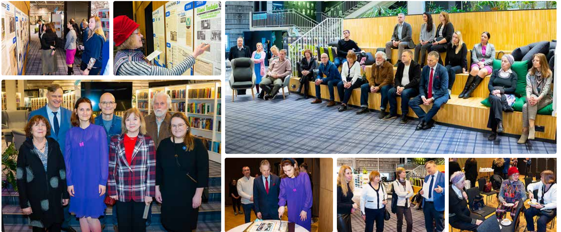
Viimsi Teataja sünnipäevanäituse avamine Viimsi raamatukogus. Suur tänu kõigile, kes avamisest osa võtsid! Elagu Viimsi Teataja!