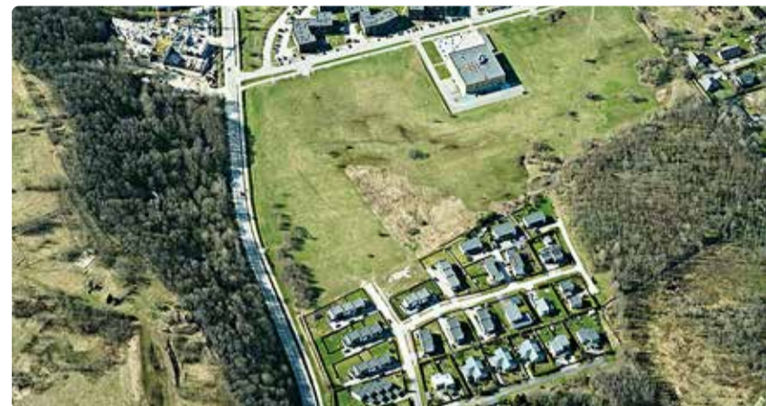
Vaade Tamme pargile.

Ettepaneku suhtes kriitilisemad tõstsid peamiselt esile muret kohaliku floora ja fauna säilimise pärast: "Toetan mõtet jätta antud metsaala looduslikuks. Elan samas piirkonnas, seal võib tihti näha kitsi, rebaseid. Tegemist on liigirikka alaga. Ei toeta mõtet, et