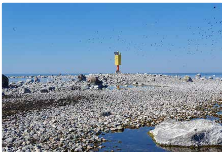
Kevadine Vullikrunn, saare keskel Aegna tulepaak.

Sillikrunn ja Vullikrunn asuvad Aegna saarest põhja pool ja kuuluvad Rohuneeme küla koosseisu. Sillikrunn (teise nimega Vahekari) on 0,32 ha suurune liivase ja kivise pinnamoega väikene saar-laid. Vullikrunn (Suurkari) on 0,26 ha suurune valdavalt kivi-