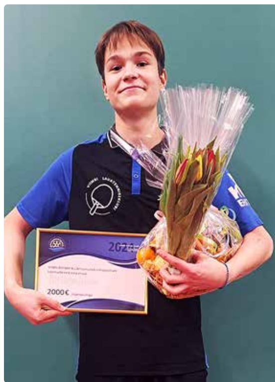
Viimsi Rotary klubi autasu üleandmisel.

miljonist naabrist, sõbrast, juhust ja probleemilahendajast, kes näevad maailma, kus inimesed ühinevad ja tegutsevad püsivate muutuste loomiseks – kogu maailmas, meie kogukondades ja meis endis. Enam kui 200 riigis on kokku üle 1,4 miljoni liikme.