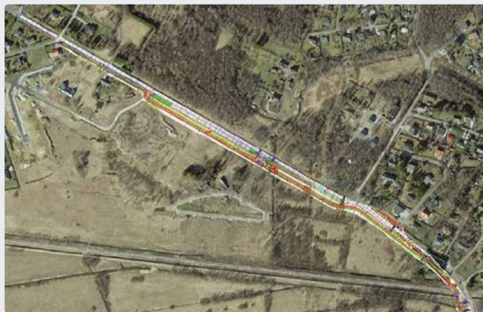
Muuga kergliiklustee. Kaart: maa-amet

■ Tulbi tee 3 projekteerimistingimustega seoses toimub avalik arutelu 9.05.2024 kell 17 Viimsi vallavalitsuses aadressil (Nelgi tee 1).