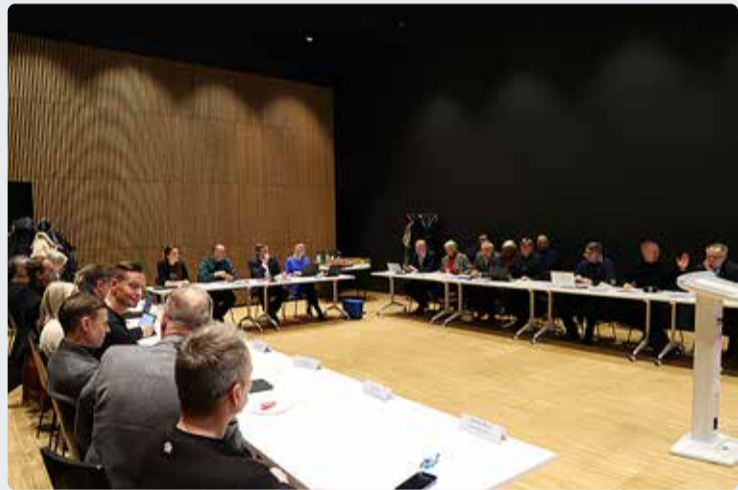
Vallavolikogu istung.