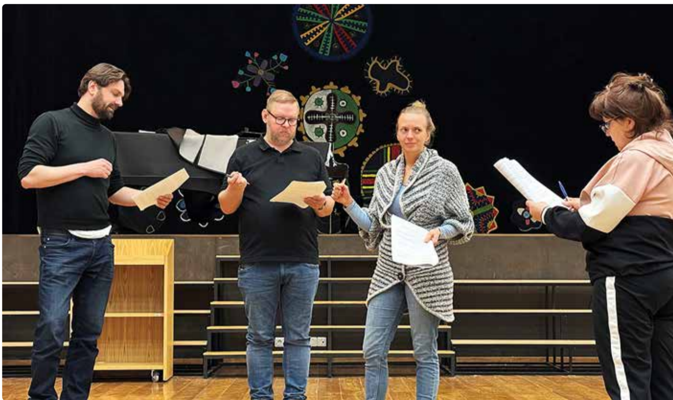
Lavastuse proovid on hoo sisse saanud.

■ “Tuulte vallas” etendub Viimsi Artiumis viiel korral: 11., 12., 20., 21. ja 22. mail. Pileteid saab osta Piletikeskusest. Grupitellimuste puhul (alates kümnest inimesest) võtke palun ühendust saara.tall@viimsiartium.ee või tel 5193 9866.