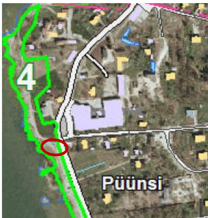
Joonis 2. Kinnistu paiknemine haljaku suhtes. Allikas: teemaplaneering.

Detailplaneering ei vasta ka Viimsi valla üldplaneeringu teemaplaneeringule Miljööväärtuslikud alad ja rohevõrgustik . Teemaplaneeringu järgi paikneb planeeringuala haljastul nr 4, nimetusega "Püünsi küla rand", mis hõlmab rannajoont pea kogu Püünsi küla ulatuses ning mille eesmärk on valla rohelise võrgustiku sidususe suurendamine. Sidususe seisukohast peab mainima, et planeeritavast alast põhja poole on algse haljastu nr 4 eraomanduses kinnistud planeeritud elamumaadeks ja suures osas juba täis ehitatud ( https://service.eomap.ee/viimsivald/#/planeeringud ). Lõunapoolne osa aga koosneb suuresti üldkasutatava maa sihtotstarbega Pikaneeme kinnistust, millel asuvad haljastu nr 4 osa Viimsi vald hooldab ja kavandab arendada ( Viimsi valla heakorra ja haljastuse arengukava 2018-2028 ).