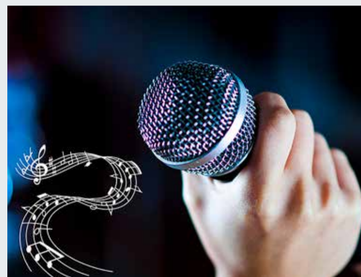
Laulukonkursile on oodatud kõik noored lauljad.

Lauluvõistlus "Viimsi Laululaps 2022" toimub laupäeval, 9. aprillil algusega kell 12 Viimsi raamatukogu saalis (Randvere tee 9, Haabneeme).