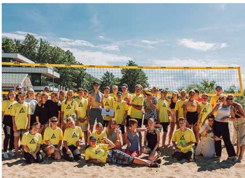
Malevas käivad töö ja lõbu käsikäes.

Malevasse võib kandideerida iga 13-19-aastane noor, kelle elukoht on rahvastikuregistri andmetel Viimsi vald või kes õpib Viimsi valla haridus- asutuses.