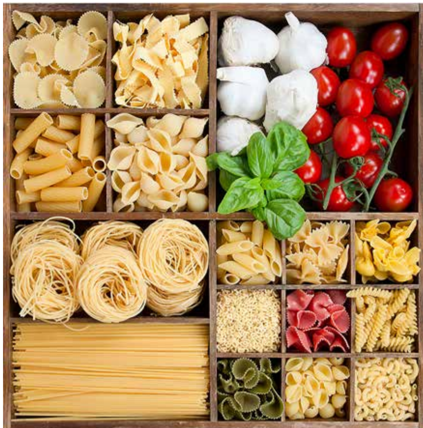
Soovitav on hoida kodus varu toiduainetest, mis ei rikne liiga kiiresti.