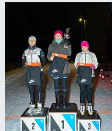
Naiste 33 km esikolmik.

Võistlus toimus valgustatud 2,35 km pikkusel Tädu terviseraja ringil ning suusutati vabastiielis. Pikema distantsi sõitjad läbisid raja 14, lühema distantsi sõitjad 7 korda.