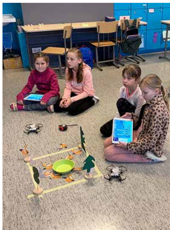
Lapsed droonitunnis nuputamamas.

Kui HK Unicorn Squadi tehnoloogiaringi tundides osalevad ainult tüdrukud, siis koolides alustanud pilootprojekti tunnid on mõeldud kõigile, nii poistele kui ka tüdrukutele. Kuid lähtuvalt programmi kontseptsioonist toimuvad poiste ja tüdrukute tunnid siiski eraldi. “Hetkel näeme, et tüdrukud on tehnoloogiliste teadmiste poolest poistest veel maas, mis tuleb ilmselt ühiskonna stereotüüpide, lapsevanematest ja nende suunamistest, tüdrukute ebakindlusest jne. Oleme lugenud uuringuid ning teame, et segarühmades võtavad neid automaatselt passiivsema rolli. Aga tegelikult lahendavad nad erinevaid programmeerimise ja muud taolisi ülesandeid väga edukalt, kui neile vaid võimalus anda,” selgitab Koser. “Ainult tüdrukutest koosnevates gruppides saavad nad kiiremini positiivseid kogemusi ja arenevad tohutu kiirusega. Poistele meeldib rohkem võistlemine, tüdrukud oskavad jälle paremini koostööd teha. Poisse ja tüdrukuid eraldi õpetades saab ühe ja teise eeliseid ära kasutada ning mõlemad, nii poisid kui ka tüdrukud, saavad tundidest parima kogemuse.”