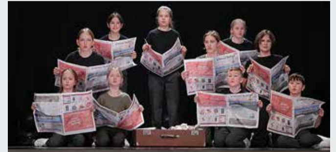
"Muutumistes" jõudis lavale ka Viimsi Teataja.

18.–19. veebruaril toimusid Jõgeval Betti Alverile pühendatud luulepäevad "Tuuletund", mis oli varasemalt ära jäänud XXIX luulepäevade "Tähetund" ja XVII luulepäevade "Tuulelapsed" asemel toimunud üleriigiline festival.