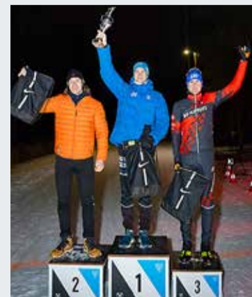
Meeste 33 km esikolmik.

10. veebruaril peeti Tädu terviserajal Viimsi 2. Öömaraton suusatamises. Ilus suusailm tõi radadele kaugtelt üle saja suusataja.