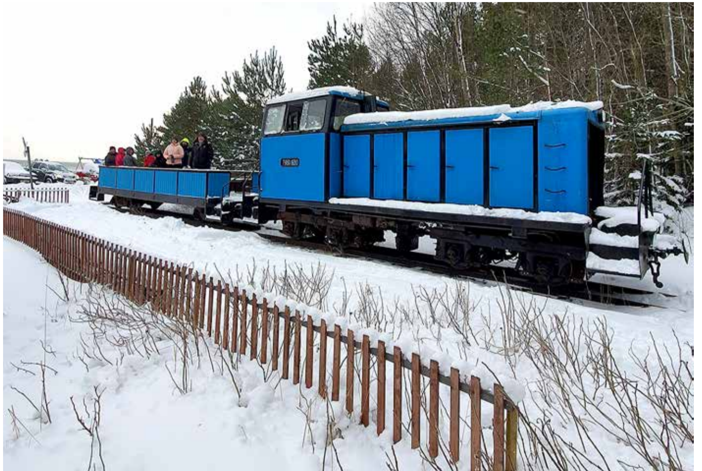
Muuseumirong külalisi vastu võtmas.

Tavapärase lahke hoolitsuse asemel, mil jumalateenistust ette valmistavad vaimulikud ja muusikud sadamas sooja autosse pakitakse