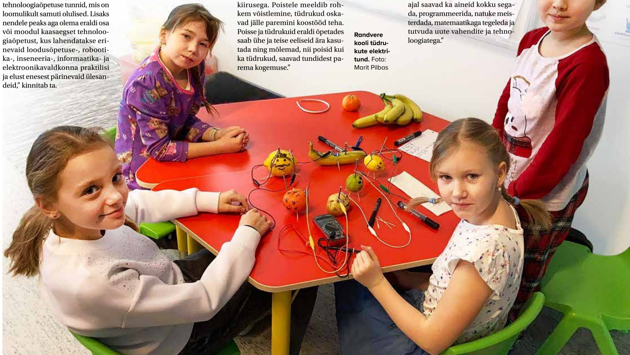
Randvere kooli tüdrukute elektritund.