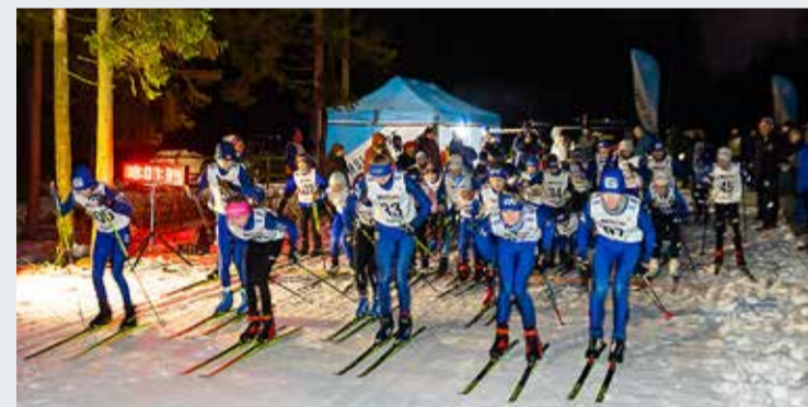
Lisaks maratonile toimusid samal õhtul ka CFC Viimsi suusasarja noortesõidud.