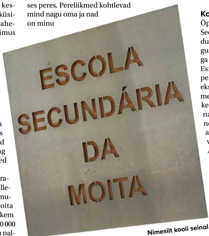
Nimesilt kooli seinal.

Viis kuud kodusest mugavusest eemal ja üksi elamine täiesti teises keskkonnas on mulle palju õpetanud. Olen kasvanud ja minu vaatenurk on muutunud viisil, mida ma poleks osanud ette kujutada. Neli kuud enne vahetusaasta lõppu võin juba öelda, et olen iseseisev, hindan rohkem oma perekonda ja sõpru, olen avatud uutele ideedele ja olen enesekindlam. Seiklus on tõestanud, et kõik on võimalik ja saan kõigega hakkama. See on olnud mu elu parim aeg ja jään alati mäletama, kuidas valik minna kodunt kaugemale ja avastada, mida maailm on minu jaoks varunud, muutis mu elu. See kogemus jääb alati kalliks.