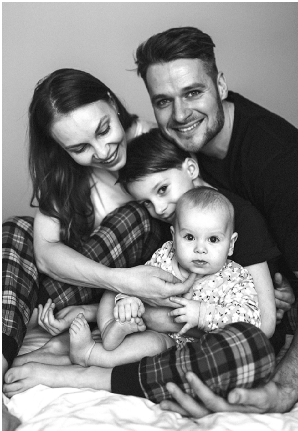
Perekond on endale mõnusa kodu rajanud Viimsisse.