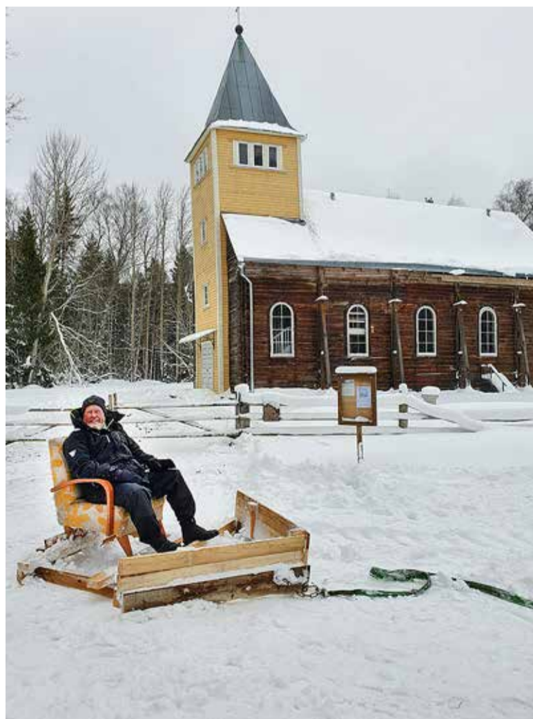
Küünlapäeva missa Naissaare Maarja kirikus.

Ühel hetkel tuli koguduserahval end pikkade laudade tagant teele sättida, et veel enne pimedat üle mere mandrimaale jõuda. Saare püsielanik oli tagataskus veel üks üllatus: äraminejatele oli ette valmistatud lõbus ühislaul, mille sõnum lühidalt öeldes manitses mitte lahkuma. Õnneks on järgmine võimalus Naissaarel kohtuda juba 5. märtsil. Kes soovib liituda, saab võimaluste kohta lähemalt uurida Tallinna Rootsi-Mihkli kogudusest.