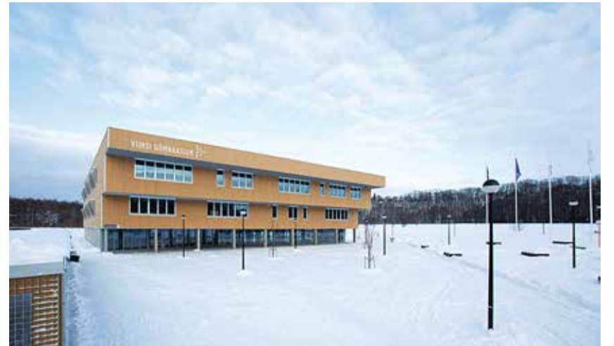
Sügisest saab Viimsi gümnaasiumis õpinguid alustada kuni 204 õpilast.

Tänavu kevadel lõpetab Viimsi valla koolides 280 9. klassi õpilast, 2023. aastal lõpetab 272 õpilast, 2024. aastal ca 300 õpilast. Lahendused gümnaasiumikohtade suurendamiseks on leitud koostöös Viimsi gümnaasiumi ning haridus- ja teadusministeeriumiga (HTM). Osapooled on kokku leppinud, et 2022/23 õppeaastal võtab Viimsi gümnaasium vastu ühe klassi komplekti (34 õpilast) lisaks. Senine vastuvõtt võimaldas vastu võtta 170 õpilast ühes lennus. Seega, sügisest saab Viimsi gümnaasiumis õpinguid alustada 204 õpilast. HTM on planeerinud laienemisega seotud ressursid ja õpperuumide lahenduse. Kooli kõrval paigaldatakse ajutiselt neli moodulklassi. Lisaks on valla poolt õppetöö läbiviimiseks välja pakutud ruumid kultuuri- ja hariduskeskuses Viimsi Artium, mida kool saab kasutada üksikuteks väiksema hulga õppijatega rüh-