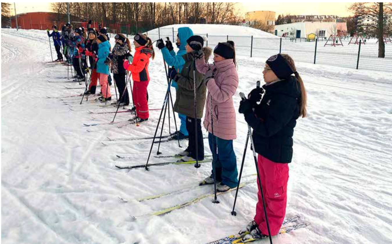
Haabneeme kooli 3b klassi lapsed suusatarakusi omandamas.

Kuna Haabneeme koolis toimuvad liikumistunnid põhimõt-