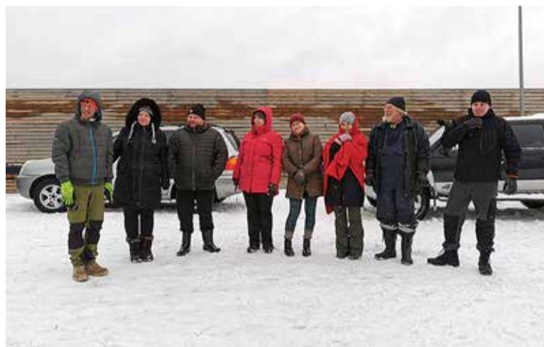
Naissaare Männiku küla laulukoor kirikurahvast saatmas.

ja ees tee saadetakse, ootas kõiki merelt tulnuid hoopis rong. Jah, see legendaarne sõiduriist, mille kunagine püsielanik Peedo Lehtla rööbastele sättis, liigub nagu muiste, aga on nüüd Viimsi Rannarahva muuseumi hoole all korda sätitud ja sõitjatele ohutu.