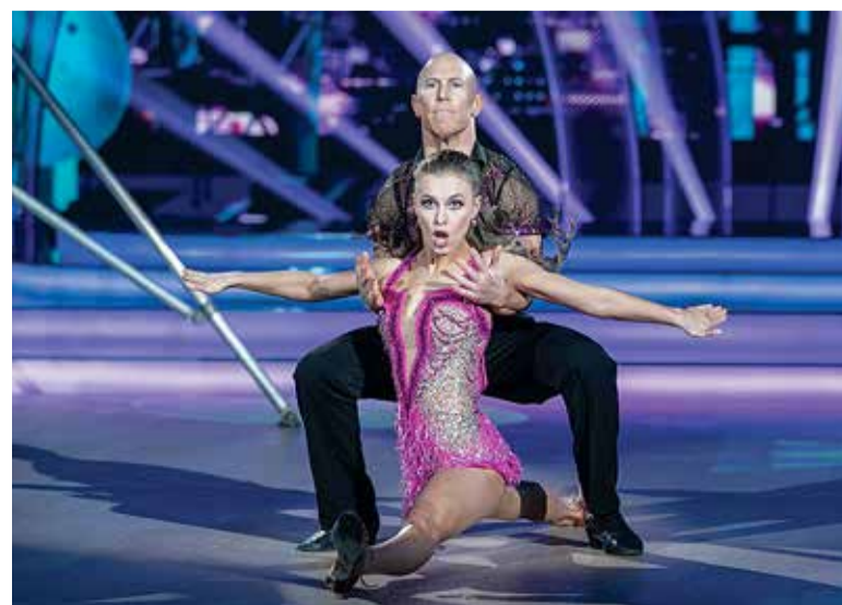
"Tantsud tähtedega" saates koos maailma tipp-ragbimängija Peter Stringeriga.

Tiitlitest ja saavutustest tähtsamaks peab Valeria häid peresuheteid ning talle antud võimalust teha oma tööd koos abikaasa ja lapsega. "Šoutantsumaailmas on see pä-