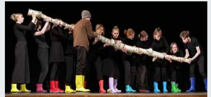
"Kõik on siin oma teha".

Viimsi Collegium Eruditionise näitetrupp EKSPERIMENT tõi nii nooremas kui ka vanemas vanusegrupis koju laureaditiitlid. Luulepäevade "Tähetund" laureaadiks kuulutati EKSPERIMENTI lavastus "Kõik on siin oma teha".