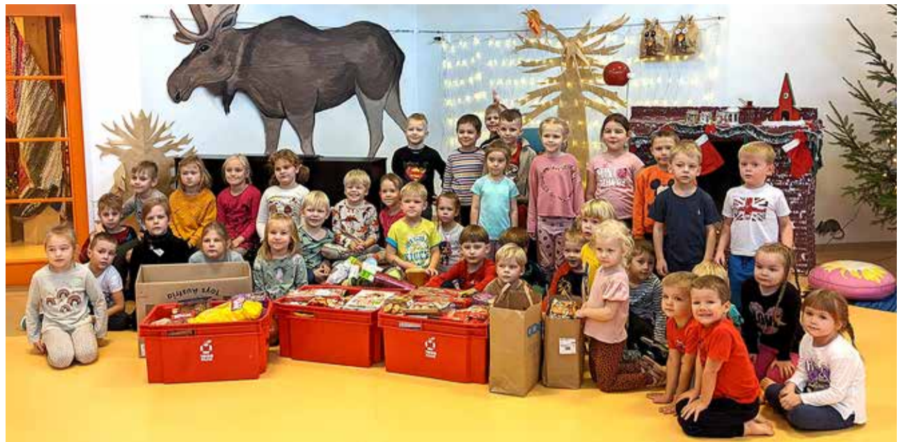
Heategu teeb rõõmsaks nii andjad kui ka saajad.