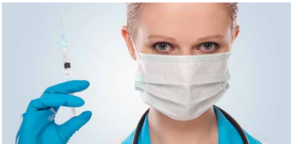
Tõhustusdoos aitab kaitsta viiruse eest.

Koroonakaitse kalkulaator on aga hea abivahend, mis annab vastuse