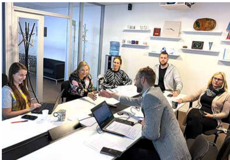
Arendusosakond koos sotsiaalosakonnaga teenuseid disainimas.