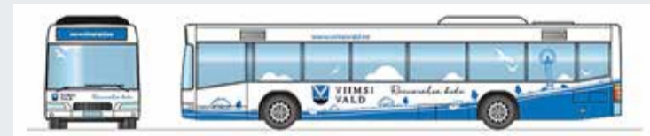
Utul bussidel on Viimsi valla tunnusgraafikaga.