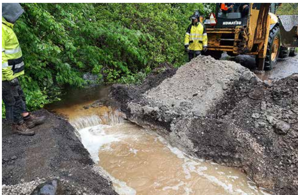
Sademevee uputus Randvere külas ja truubi parandus.

2021. aastal väljastati 57 sademevee tehnilist tingimust, millega määrati ära, kuidas tuleb hooned rajamisel, rekonstrueerimisel või muu taristu rajamisel lahendada kinnistu sademevesi. Alates 2021. aasta suvest rakendab vallavalitsus kõigi uute hoonete püstitamisel säästlike sademeveelahen-