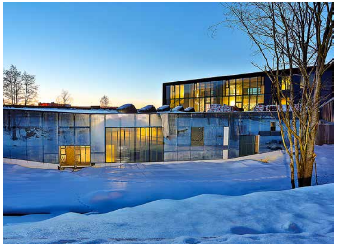
Artiumi vundamendiauk veebruaris ja valmimisjärgus hoone detsembris 2021.