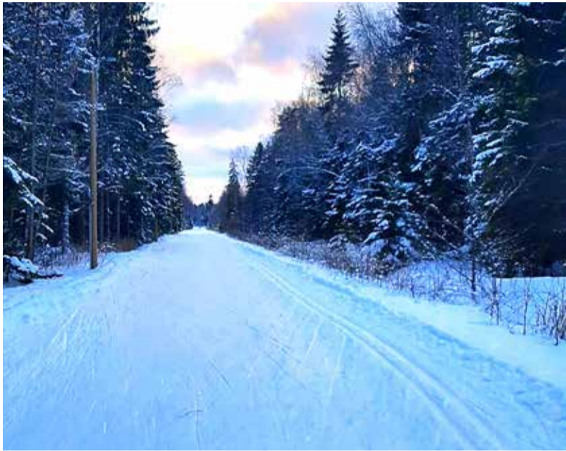
Tädu suusarajad on hästi hooldatud ja pakuvad rõõmu paljudele.

Tahan tunnustada ja tänada neid naisi ja mehi, kes hoolitsevad selle eest, et Viimsi rahvas saaks täiel rinnal nautida seekordse imelise talve mõnuseid.