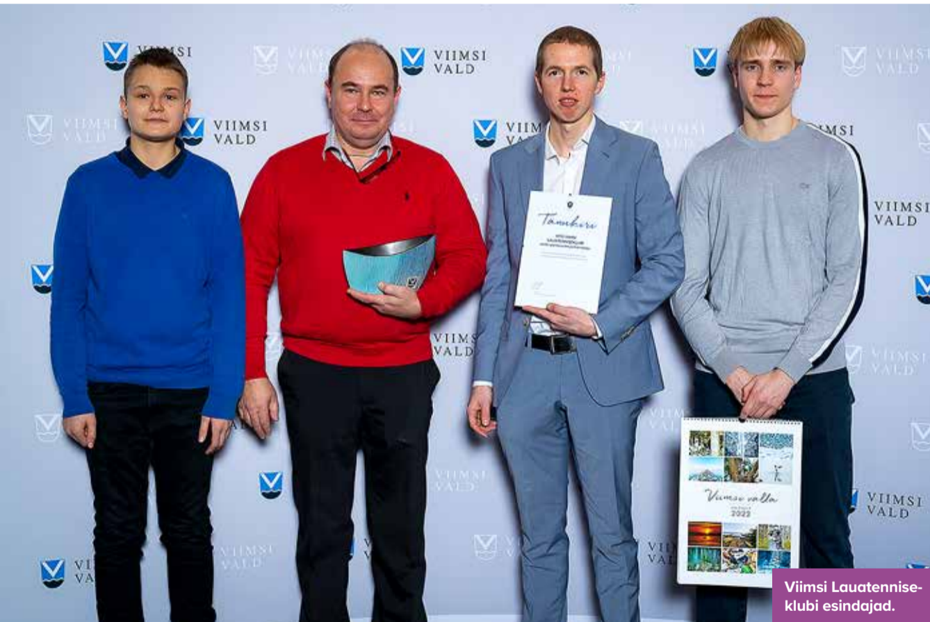
Viimsi Lauatenniseklubi esindajad.