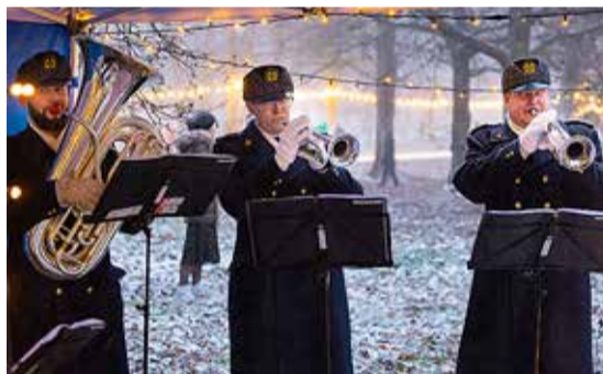
Esimese adventi tähistamine jõulumaal.