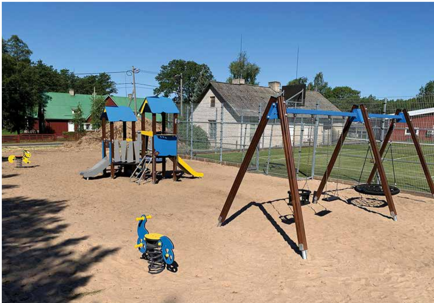
Prangli saare mänguväljak.

Heakorratöölised niitsid 2021 niiduperioodil kogumahuga ca 173 hektarit üle valla paiknevaid haljas- alaid ja mänguväljakuid (98 erine- vat haljakut, maht ca 28 ha). Erine- vate haljakute niidukordi tuli kokku 616, keskmiselt niideti igat haljakut hooajal 6 korda.