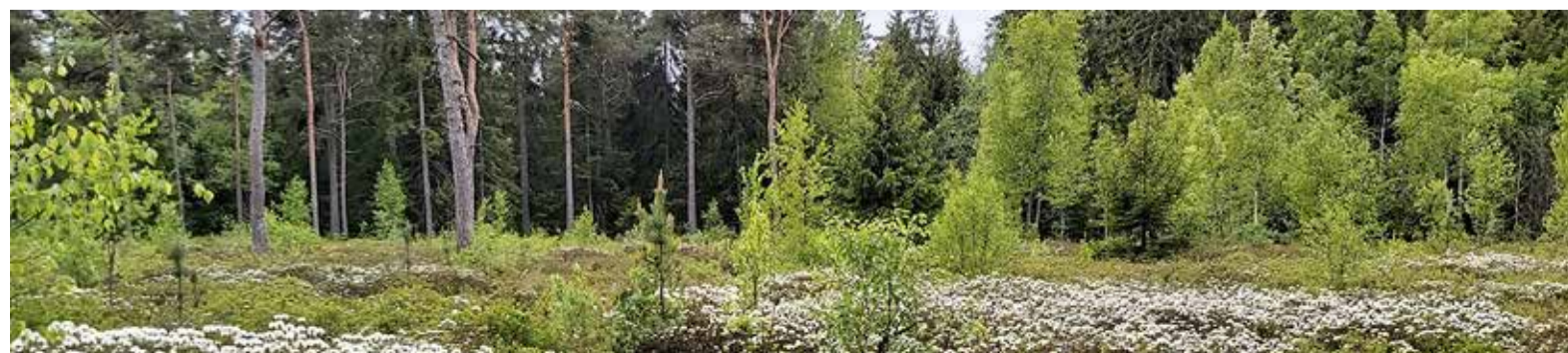
Aastal 2021 kinnitati Leppneeme-Tammneeme, Krillimäe (fotol) ning Mäealuse maastikukaitsealade kaitsekorralduskavad.