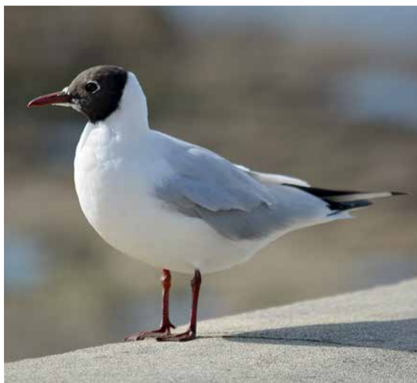
Lindude gripi hooaeg algas eelmise aasta oktoobris ning on kujunemas raskeks.

Viiruse leviku pidurdamiseks peavad linnupidajad tagama, et kodulindudel poleks kokkupuuteid looduses vabalt elavate lindude ja neilt pärineva nakkusohutiku materjaliga. Selleks tuleb vajadusel kasutada võrku, katust vms eraldusvõimalusi ning linde tuleb