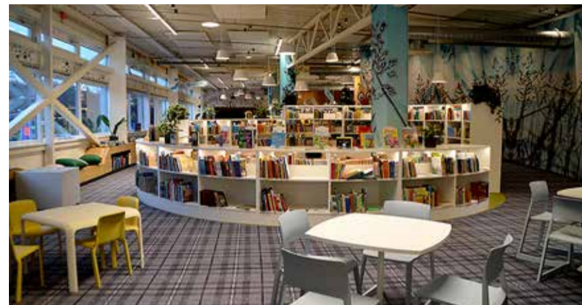
Viimsi raamatukogul on palju potentsiaali, et olla üheks kogukonnakeskuseks.

Raamatukogul on võimalus viia oma teenused tavapärastest ruumidest väljapoole. Suvekuudel luuakse inimestele võimalused laenata lugemisvara