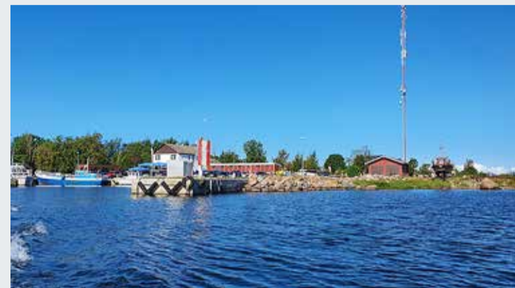
Väikesaarte hulka kuulub ka Viimsi vallas asuv Prangli.

Rahandusministeerium ja Riigi Tugiteenuste Keskus (RTK) avasid väikesaarte programmi taotlusvooru projektidele, mis suurendavad väikesaarte elanikele osutatavate esmatähtsate teenuste kättesaadavust ja kvaliteeti.