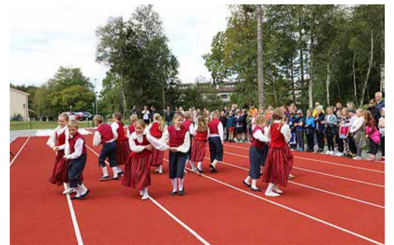
Septembris avati pidulikult Püünsi kooli staadion.