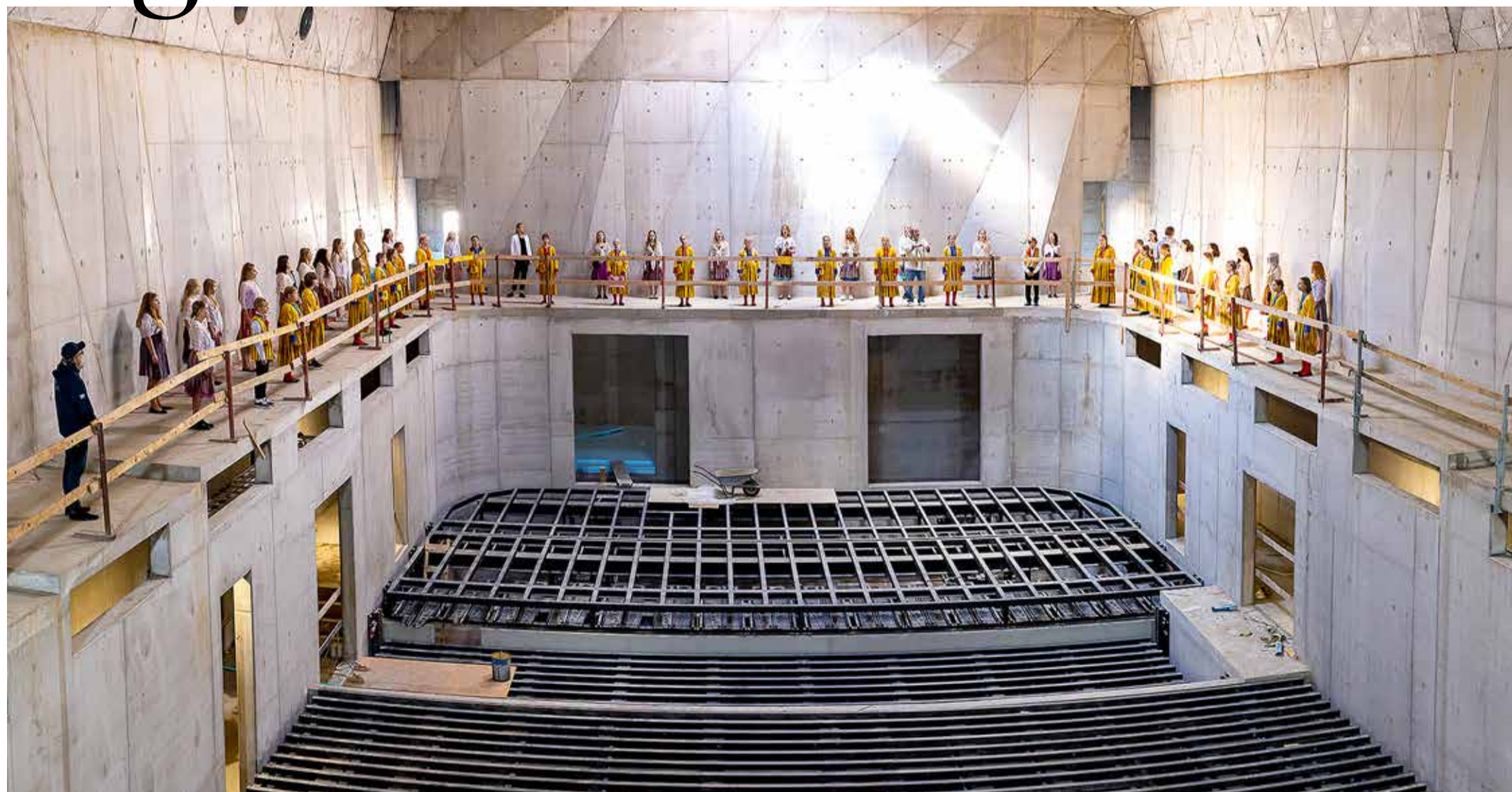
Viimsi Artiumist saab nii Viimsi kui ka kogu Eesti kultuuri nurgakivi. Fotol ETV tütarlastekoor vahetult enne hoone sarikapidu.