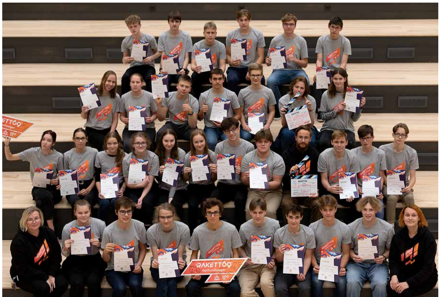
Rakett69 Viimsi laagri lend.