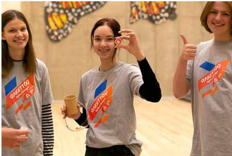
Siniste rakett.

Meeskonnasisese energia ühtlustust ja suurenevast omavahelist dünaamikat oli näha peagi peale teise ülesande lahendamist, mil