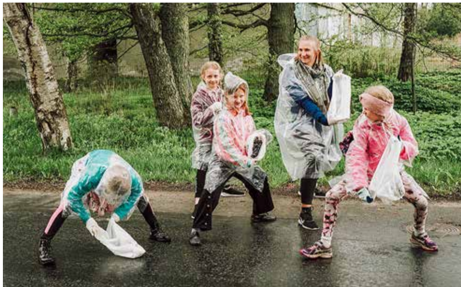
Püünsi noortekeskuse prügi-kõnd.

Aasta jooksul on toetatud ka Viimsi noortevolikogu tegevuste taasalgatamist, tutvustatud KOV 2021 valimisprotsessi 16–17-aastastele noortele, osaletud NEET-staatuses noortega seotud KOVidele suunatud koostöömudeli loomise koosloomeprotsessis, loodud noortekeskusele info edastamiseks kodulehekülj, süsteemselt tegeletud noortefo levitamisega, kinnistatud noortekeskuse brändi, loodud kaasa noorsootöö erialaliitude (ENK, ANK) tegevustes ning jagatud noorsootöö praktikaid ametnikele ja välisriikide esindajatele. Kaasa on loodud ka Viimsi haridusaasta tegevustes, mis keskenduvad osalusele ja ettevõtlikkusele. Haridusaastal said alguse lauamänguõhtute sari "Osaledes ettevõtlikuks" ning erialade tutvustus.