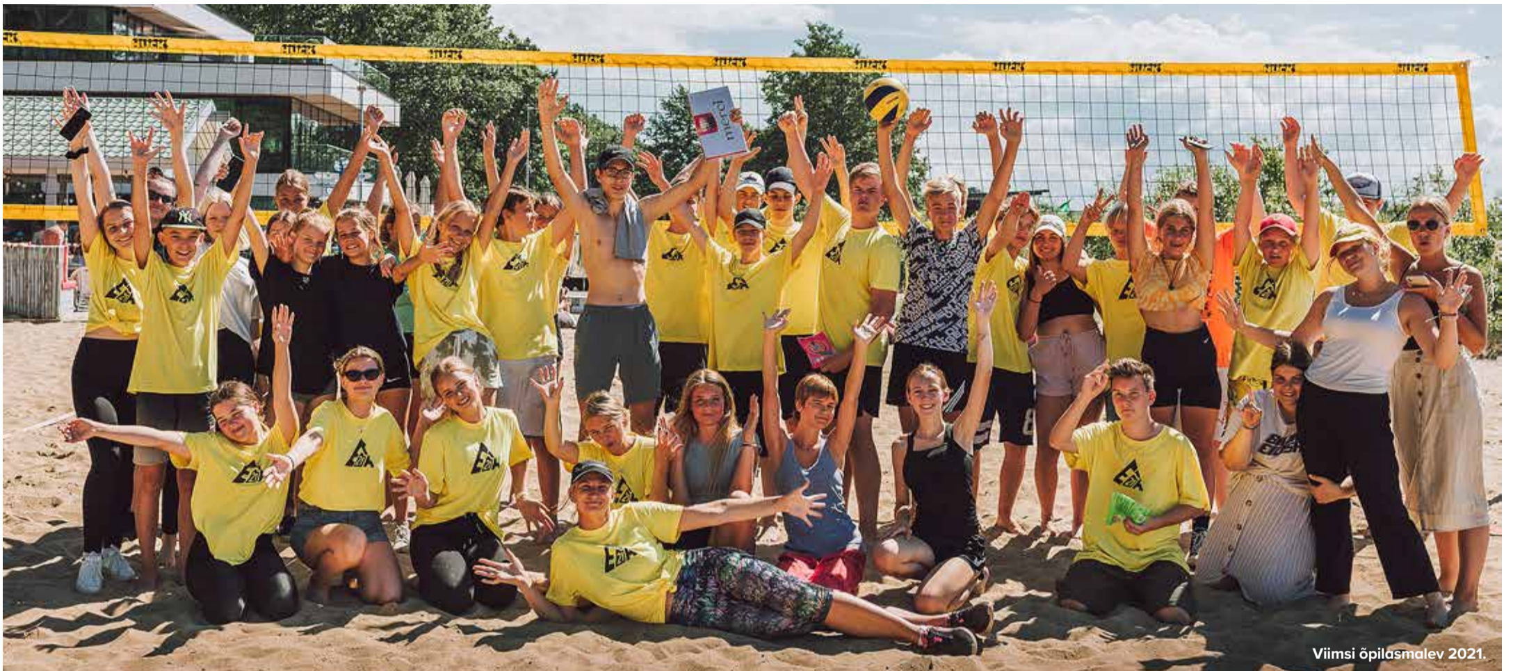
Viimsi õpilasmalev 2021.