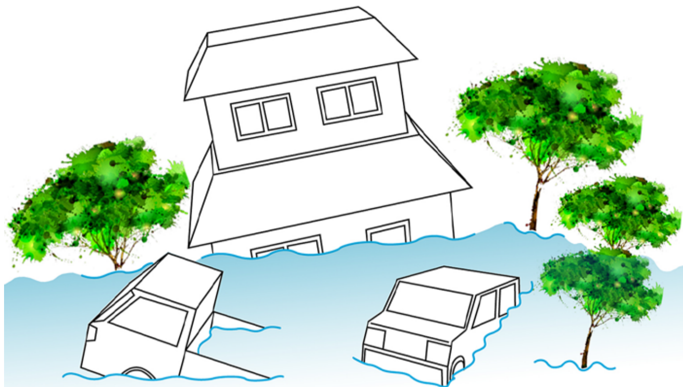
Üleujutunud linnas on häiritud meie tavapärase elutegevus. Joonised: Gen Mandre

Soovitav on erinevad stsenaariumid eelnevalt läbi mängida, et tagada valmisolek ohuolukordadeks. Võimalusel tuleks mõelda ka tagavaralahendustele, et olemasoleva sademeveesüsteemi tõrke