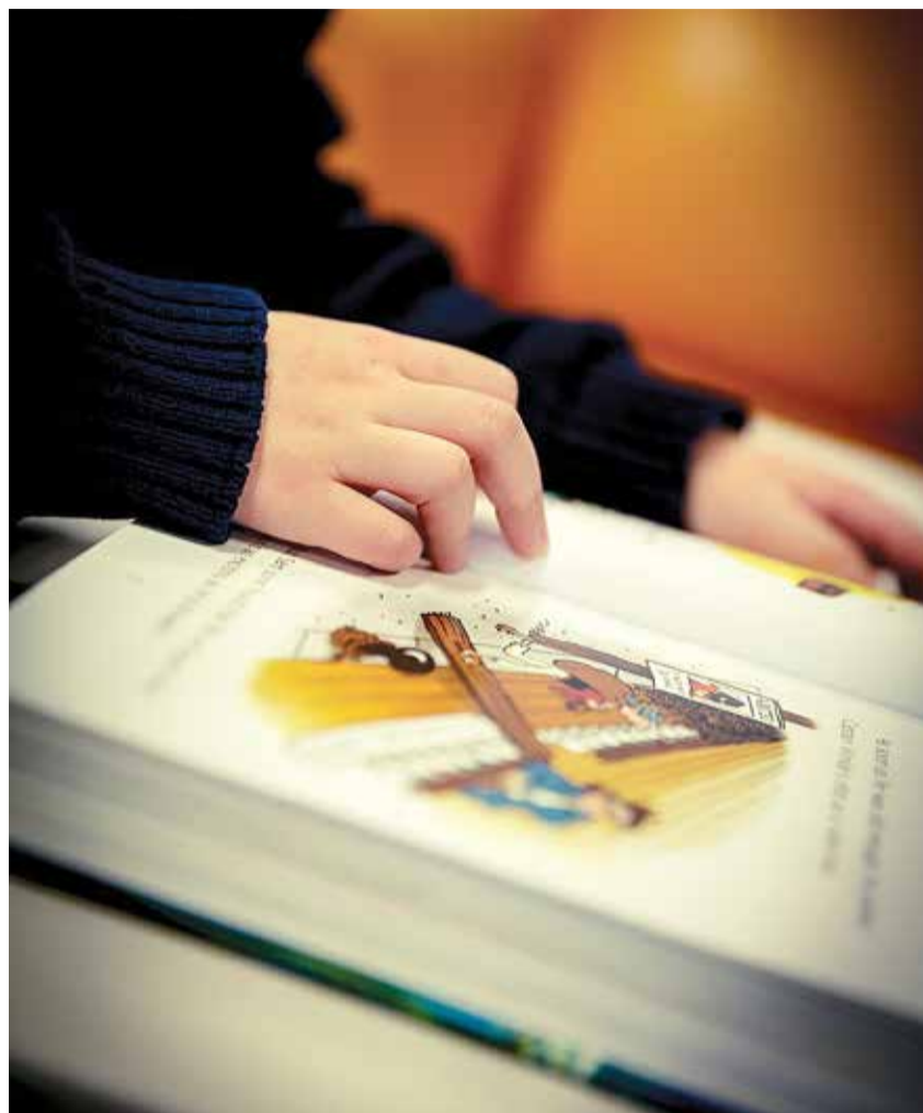
Lubage lapsel võimalikult palju ise tegutseda, aga andke teada, et tugi on olemas.

5 Tundke igapäevaselt huvi, mida laps päeva jooksul õppinud on, mis pakkus talle rõõmu, mis valmistas