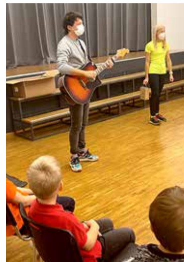
Stig Rästa Haabneeme koolis laulmas lastele hambapesulaulu.

Haridus- ja teadusministeerium kiitis heaks Lions klubide ettevõtmise pöörata tähelepanu laste suuhügieenile ning tuletada meelde, et laste hambaid ravitakse Eestis kuni 19. eluaastani tasuta.