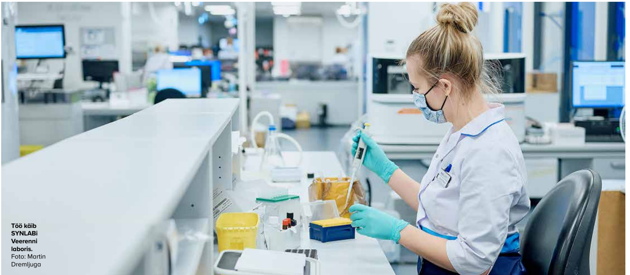
Töö käib SYNLABi Veerenni laboris.