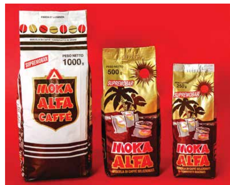
Moka Alfa kohvid sisaldavad seitset eri tüüpi kohviubasid.

Kõige värskemat ja paremat kohvi saab värskelt jahvatatud ubadest.