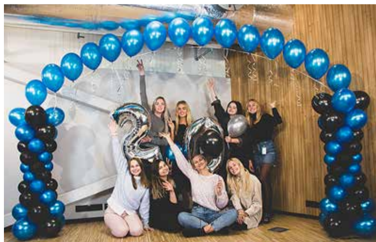
Noorsootöötajad Viimsi Noortekeskuse 20. sünnipäeval.