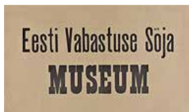
Sõjamuuseumi vana nimesilt.

armee üksuste lipud, eksponeeritud olid mannekeenid Vabadussõja- aegsetes mundrites, sõjakaardid, ülem- juhataja sõjaaegse töökabineti sisus- tus ja palju muud. Muuseumi asu- kohaks sai Tallinna vanalinnas asuv maja Vene tänaval.