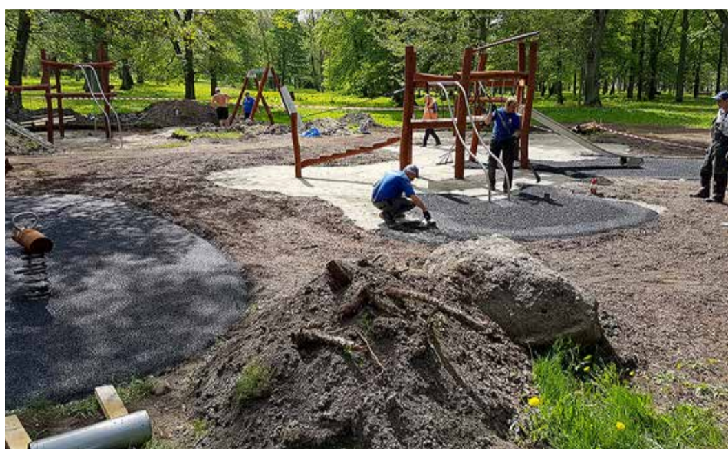
Mõisapargi mänguväljaku ehitus.

Aasta jooksul pandi avaliku ruumi juurde 15 uut pinki, kokku on avalike pinkide arv Viimsi vallas 127. Kavas on jätkata vanade pinkide asendamist seljatoega pinkide vastu. Lisaks paigaldati juurde avalikke prügikaste 20 tk, kokku on teeäärsete avalike prügikastide arv 240 tk. Lisaks jätkati pakendipunktide arendamisega ning aediku ja haljastuse sai Koralli tee pakendipunkt (maksumusega 12 752 eurot), 2019. aastal on kavas korrastada Pärnamäe tee sissesõit ja sealne punkt. Pakendipunktide arv on 24 punkti üle valla.