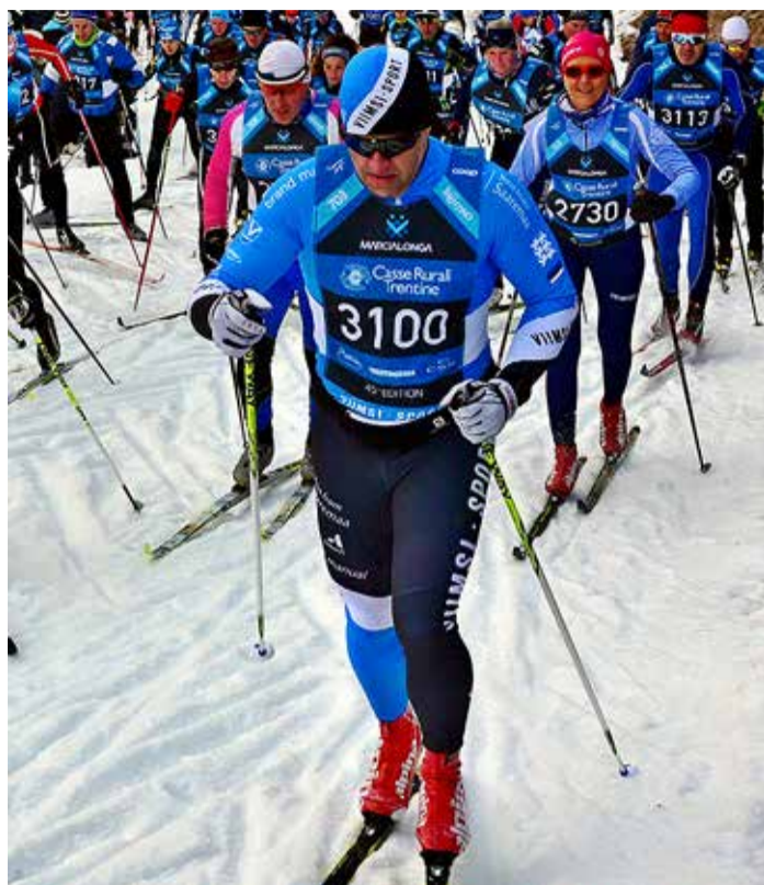
Liitu spordiklubiga Viimsi Sport ja võid kanda sama kena spordiriietust nii talvel suusatades kui suvel jalgrattaga sõites või muud sporti harrastades.

Viimsi Sport on mõeldud kõigile viimsikatele ning klubi eesmärk on anda käegakatsutav panus kogu Viimsi valla sportlikumaks muutmisele, sest tervisesport on jõukohane kõigile. Klubi ühendab erinevate spordialade entusiaste. Rakendatavate spordialade hulka kuuluvad nii jooksmine, kepikõnd, orienteerumine, triathlon, rattasõit kui ka suusatamine.