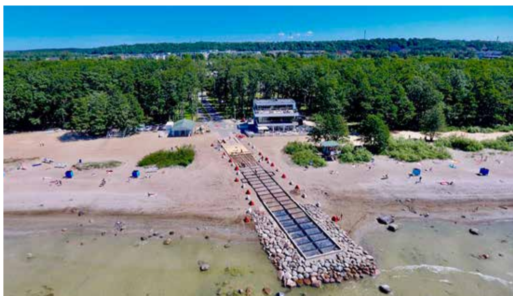
Haabneeme ranna muuli rekonstrueerimine.

Viimsi vald aitas kaasa Tee-me Ära talgutele ning maailma koristuspäeva talgutele, sügisel toimus lehtede äraveo kampaania. Aasta jooksul veeti valla avalikust ruumist ja prügikastidest ära kokku 525 m 3 jäämeid ning lehekampaania raames 150 m 3 puulehti.