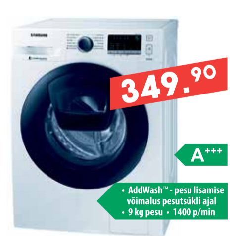
Pesumasin Samsung WW90K4430S