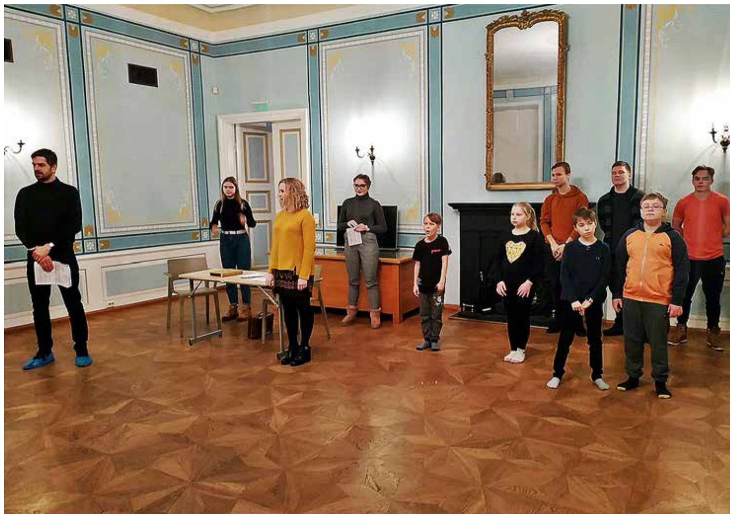
Et tekiks parem tunnetus, toimusid proovid sõjamuuseumis.