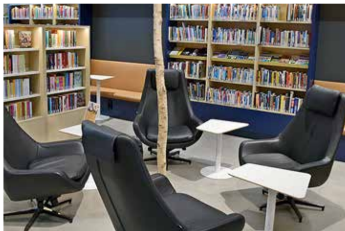
Siseinterjäär Laajasalo raamatukogus.

tamisi. Seejuures tullakse raamatukokku, et teha ka tõsist mõtetööd – paljudes raamatukogudes on eraldi individuaal- ja rühmaruumid, kus õppurid saavad teha rahu oma koduseid ülesandeid.