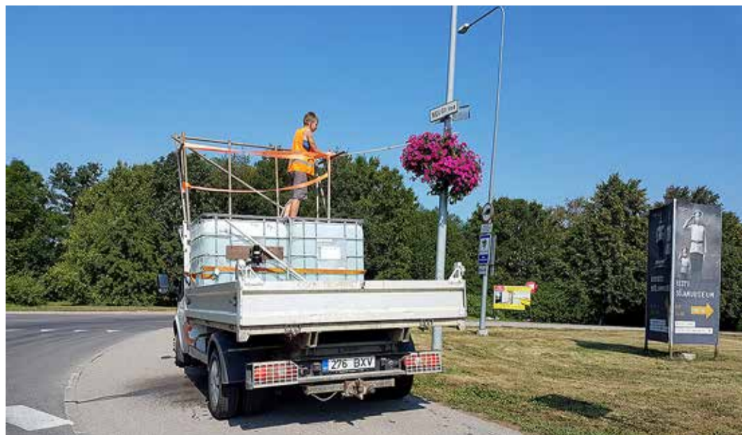
Lilleamplitte kastmine kuumal suvel oli suureks väljakutseks.

Sademeveesüsteemide jooksvateks töödeks – avariitööd, kraavide puhastamine, sademeveekanalisatsiooni ja дренаazi survepesu – kulus 2018. aastal 86 400 eurot. Võrreldes 2017. aastaga kahanes jooksvate tööde rahaline maht 36%, põhjuseks oli möödunud aasta sademete hulk, mis vähenes võrreldes 2017. aasta sademete hulgaga. 2018. aasta Eesti keskmine sajusumma oli võrreldes 2017. aastaga 113 mm madalam.