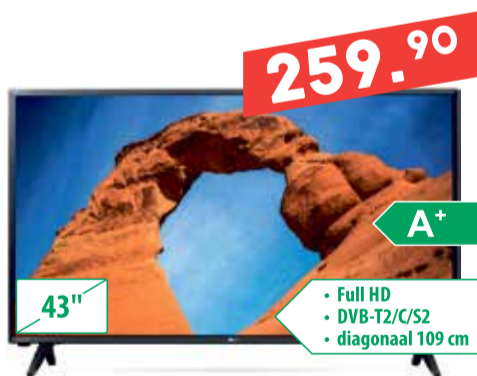
Teler LG 43LK5000PLA

Sooduspakkumised kehtivad kuni 5. veebruarini.