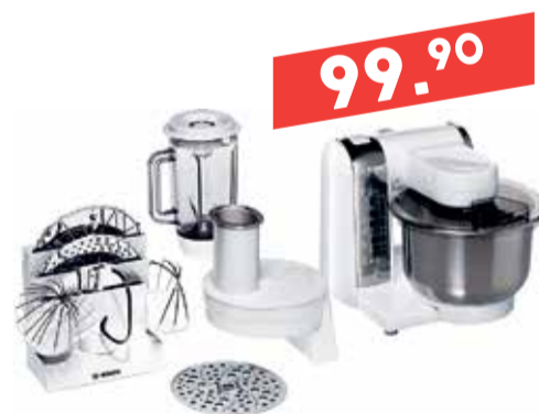
Köögikombain blenderiga Bosch MUM48CR1