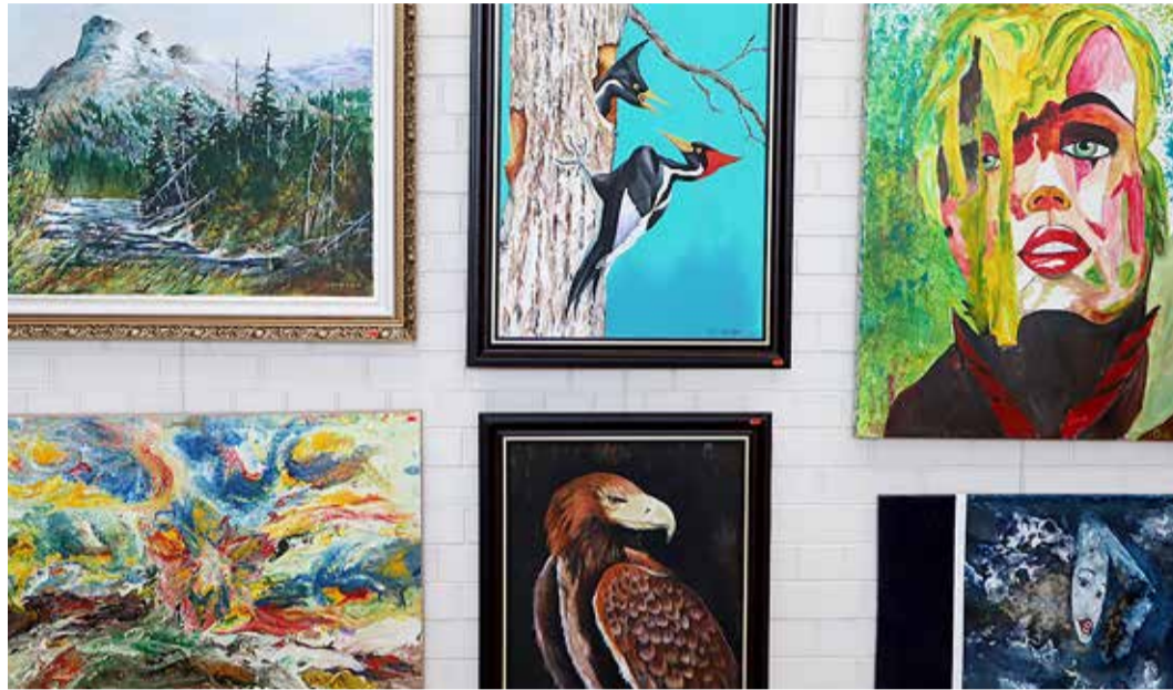
Seinad täis värvikaid maale Viimsi huvikeskuse fuajees.

Maalimisega tegi Eha algust juba Soomes. “Vend elas siis Rootsis ja me tegime koos Soomes ja Rootsis kunstinäitusi.”