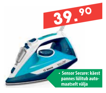
Triikraud Bosch TDA 3024210