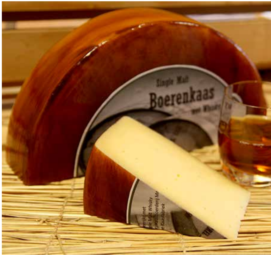
Talujuust viskiga.

Juustueksperdi sõnul on juustudel positiivne mõju osteoporoosi ennetamisel, kuna selles leidub organismile kergesti kättesaadavaid kaltsiumi- ja fosforühendeid, mis tugevdavad luude struktuuri.