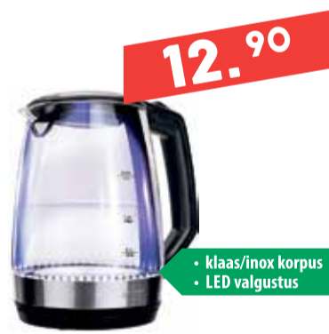
Veekeetja MPM MCZ-83