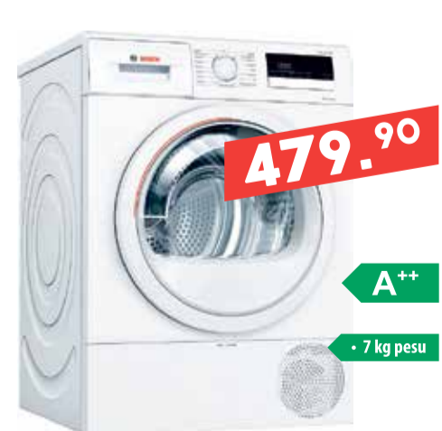
Soojuspump-pesukuivati Bosch WTR85VL7SN