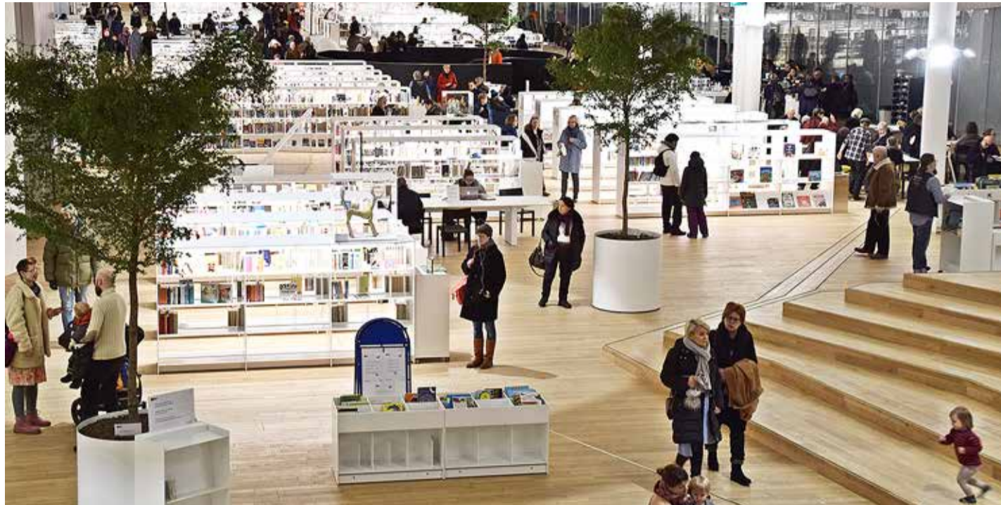
Helsingi linnaraamatukogu Oodi 3. korrusel asuv raamatukogu.

Eesti raamatukogud käivad ajaga kaasas, tagades kõigile inimestele võrdse juurdepääsu kultuurile ja kunstile, eluajale õppele ning luues võimalusi ühiskondlikuks aktiivsuseks ja demokraatia arenguks. Meist mitte kaugel, üle lahe on raamatukogud ühiskondliku elu keskused. Seal korraldatakse kontserte, vestlusringe ja filmivaa-