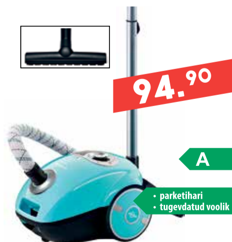
Tolmuimeja Bosch BGL35M0N6