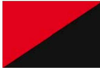
Naissaare madruste ja ehitajate vabariigi lipp.

ju all, vaid koondasid erinevaid poliitilisi liikumisi nagu menševikud, esseerid jt. Nõukogudega liitusid ka anarhistid, kes olid alguses kommunistide kõige suuremad liitlased. Koos võeti üle nõukogud ja koos kukutati ka Venemaa Ajutine Valitsus 1917. aasta oktoobris. Ideoloogiliselt olid anarhistid Vene revolutsiooni ajal sarnaselt kommunistidega eraomanduse ja kapitalismi vastased. Kommunistidest eraldasid neid peamiselt vaated võimule. Anarhistid uskusid, et riike senises mõistes pole vaja ja elukorraldus peab