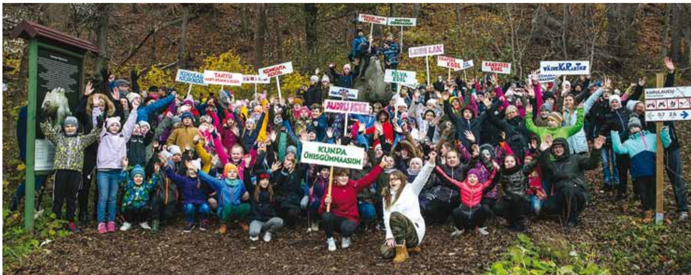
Teatrefestivali grupipilt.