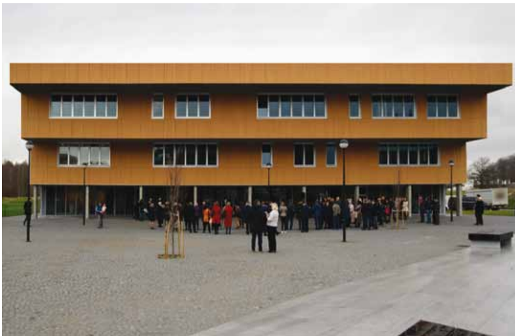
“Aasta Puitehtis 2018” konkursil sai koolimaja rahva lemmiku ja Arcwood liimpuidu eriauhinna.