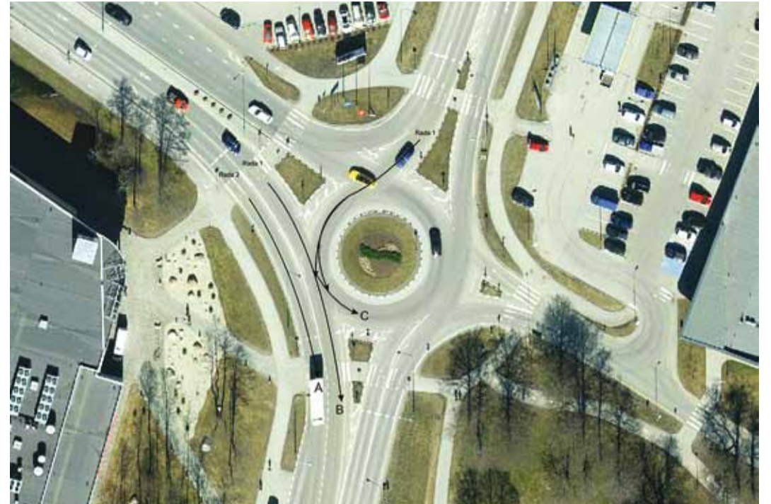
Viimsi – Rohuneeme tee ja Viimsi – Randvere tee ristmik.

Riigiteede Viimsi – Rohuneeme tee ja Viimsi – Randvere tee ristmikul on pidevalt liiklusõnnetusi, mis on tihti põhjustatud kehtestatud liikluskorraldusest mittearusaamisest ja/või valesti tõlgendamisest. Palume Maanteeameti kui riigitee valdajalt selgitust, kuidas peab Rohuneeme ja Randvere poolt tulija antud ristmikul õigesti sõitma, et mitte tekitada liiklusohu.