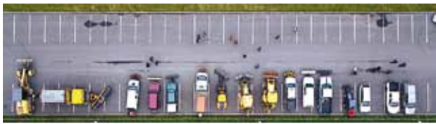
Talitööde masinapark vallas.