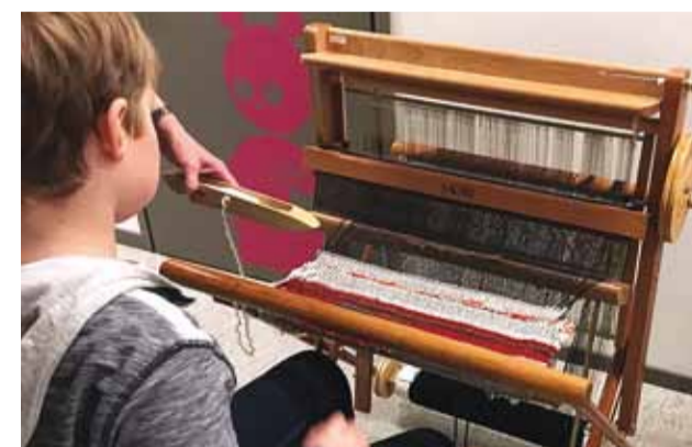
Poistelegi tundus vaibakudumine huvitav.