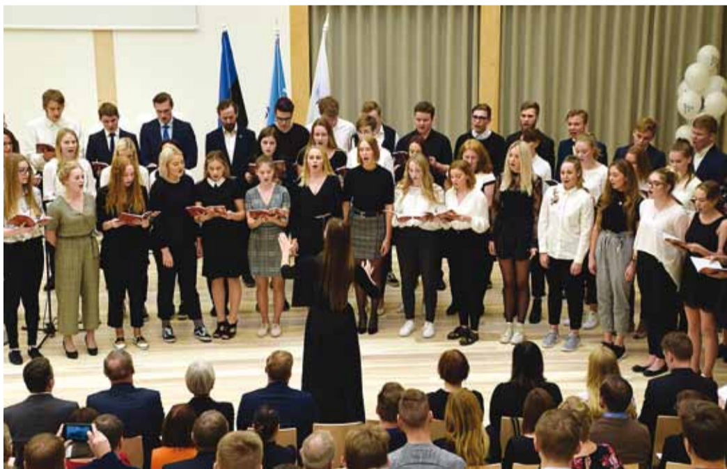
Koolikoor esitas avaaktusel “Tuljaku”.