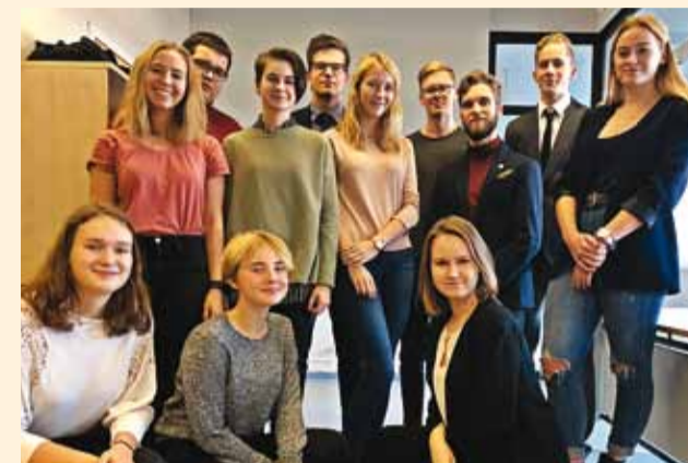
Viimsi noortevolikogu.

Viimsi noortevolikogu on koht, kus oma ideed ellu viia. Sellest sügisest järgmise kevadeni on ka minul võimalus kaasa rääkida ja noortevolikogus osaleda. Aktiivne töö on toimunud juba üle kahe kuu ja võin öelda, et seal on koos väga edukad ja andekad noored.