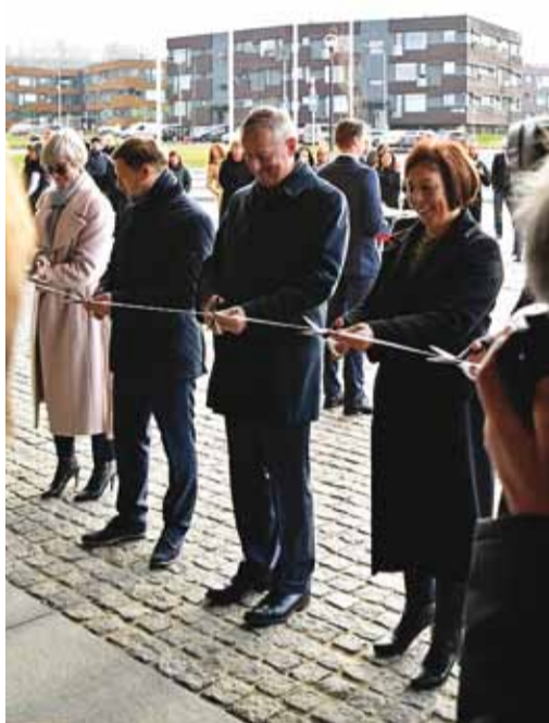
Koolimaja pidulik lindilõikamine.