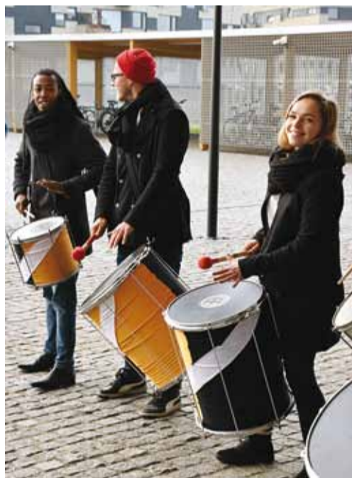
Kool avati trummipörinaga.

14. novembril saabus päev, mil Eesti Vabariigi haridus- ja teadusminister Mailis Reps sai öelda, et gümnaasiumi uus maja on lõpuks valmis, nimetades seda ajalooliseks sündmuseks, sest Viimsi Gümnaasiumi näol on tegemist esimese riigigümnaasiumi avamisega Harjumaal.