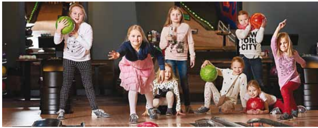
Sõpradega bowlingu mängimisest ei saa küll enam midagi lõbusamat olla.

Jõulupeo turniir võib alguse saada bowling uradadel ning jätkuda piljardilaudade taga – või