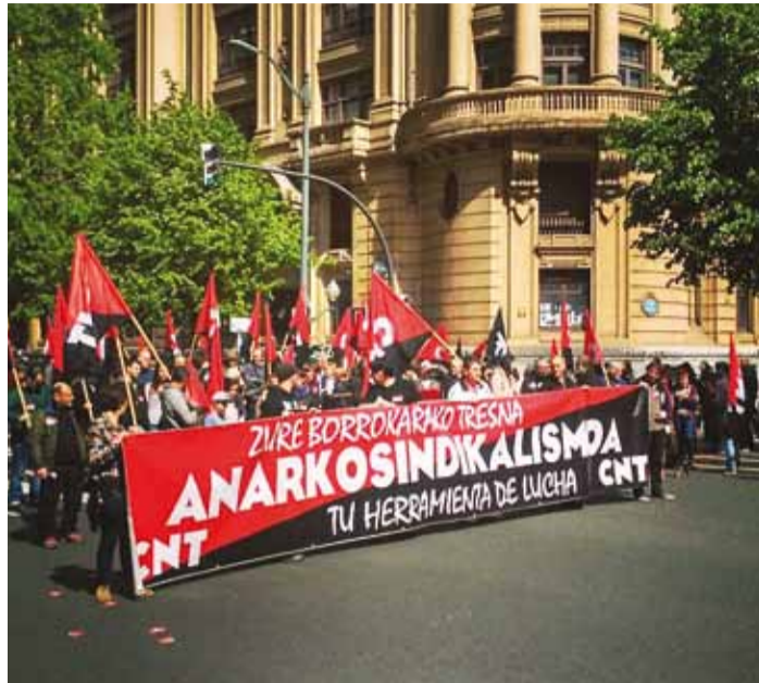
Anarhistide demonstratsioon tänapäeva Hispaanias.

Samal ajal moodustati aga ka teine võimuorgan – Petrogradi Tööliste ja Soldatite Saadikute Nõukogu, mille eeskuul moodustati Eestimaa Tööliste ja Soldatite Saadikute Nõukogu. Nõukogude eesmärk oli