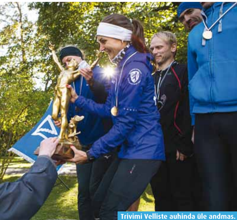
Trivimi Velliste auhinda üle andmas.