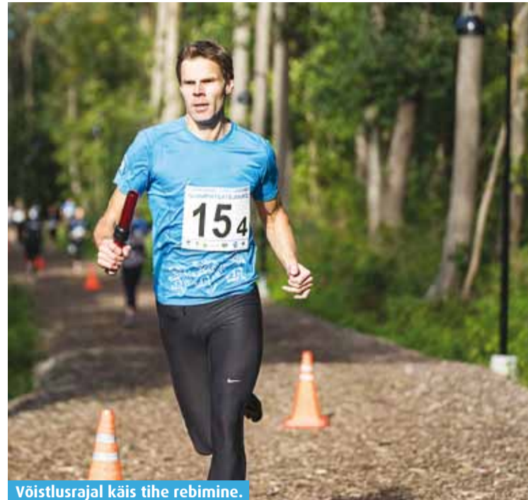
Võistlusrajal käis tihe rebimine.