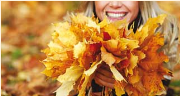
Vaid avalikust ruumist pärit puulehed sobivad äraviimiseks!

Viimsi vallavalitsus korraldab taaskord Viimsi poolsaarel sügisese lehtede äraveo kampaania.