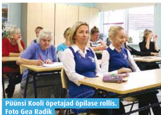
Püüsi Kooli õpetajad õpilase rollis.