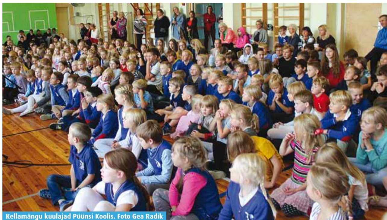
Kellamängu kuulajad Püüsi Koolis.

Sel aastal oli 1. oktoobril toimunud muusikapäeva tähistamiseks Harjumaale kavandatud üritusi 19 eri kohta, neist kolm Viimsi valda. Kontserte peeti nii MLA Viimsi Lasteaiad Päikeseratta majas, Püüsi Koolis kui ka Viimsi huvikeskuses.