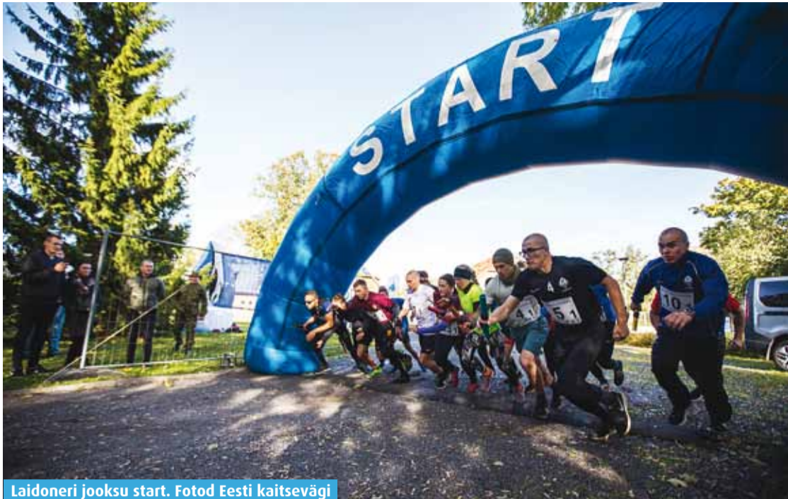
Laidoneri jooksu start.