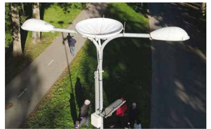
Paigaldatud kastmissüsteem droonivaates.

maatne kastmissüsteem võimaldab sademevee kogumist ning kogutud sademeveega automaatselt ja optimaalselt lillepottide kastmist tänavavalgustuspostidel. Seade koosneb neljast põhielemendist: sademevee kogujast, paagist, solenoidklapist ja automaatikakapist. Seade võimaldab koguda sademevett, kasta lillepotte, koguda andmeid ilmastiku kohta ja vähendada