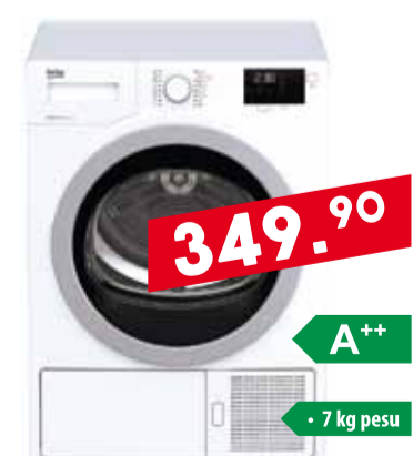
Pesumasin Whirlpool TDLR 60220

• 6 kg pesu • 1200 p/min • invertermootor