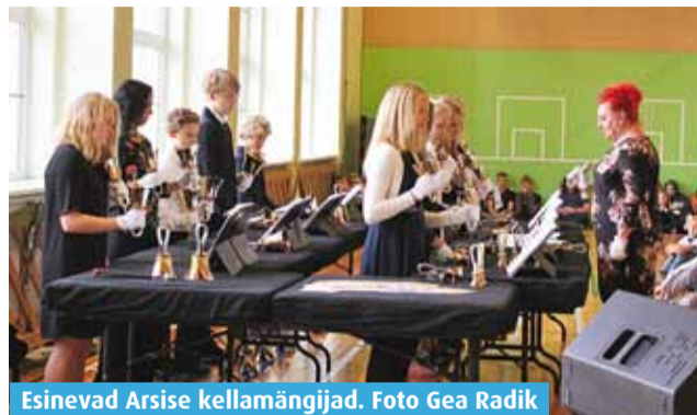
Esinevad Arsise kellamängijad.