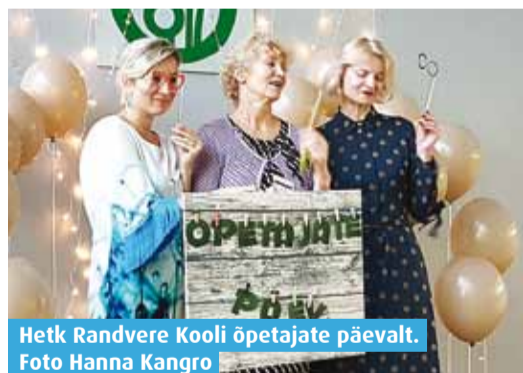
Hetk Randvere Kooli õpetajate päevalt.