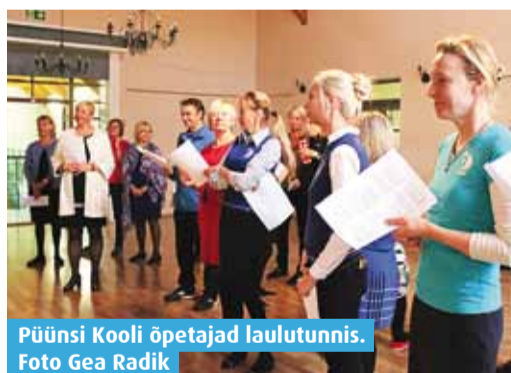
Püüsi Kooli õpetajad laulutunnis.

Viimsi koolides tähistati 5. oktoobril õpetajate päeva. Igas koolis oli oma päevakava. Toimusid lõbusad rollivahetused, esitati koolisketše või tähistati oma-moodi isegi varajast halloweeni. Õpilastele anti võimalus proovida õpetajarolli ja vanemate klasside õpilased said anda tunde väikesematele. Osades koolides andsid tunde ka kutsutud külalised ja lapsevanemad.