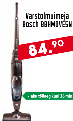
Varstolmuimeja Bosch BBHMOVE5N