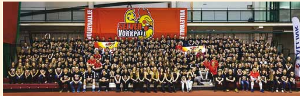
Selveri Tallinn Võrkpalliklubi.

Spordiürituste korraldamise juht Eesti Spordiselts Kalev