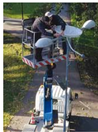
Kastmissüsteemi paigaldamistööd.

maatne kastmissüsteem võimaldab sademevee kogumist ning kogutud sademeveega automaatselt ja optimaalselt lillepottide kastmist tänavavalgustuspostidel. Seade koosneb neljast põhielemendist: sademevee kogujast, paagist, solenoidklapist ja automaatikakapist. Seade võimaldab koguda sademevett, kasta lillepotte, koguda andmeid ilmastiku kohta ja vähendada