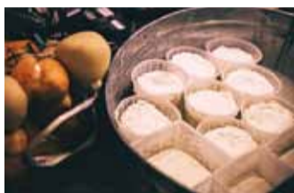
Ehe Itaalia toit.

Idee pood luua tekkis siis, kui me olime perega mõne aasta eest Itaalias pisut pikemalt. Sealne toidukultuur jättis meis väga sügava jälje. Paari aasta jooksul tekkis meil mõningane teadmine ja tajus Itaalia eluviisist ja kommetest, mille Eestis-