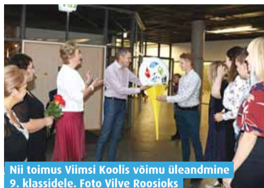
Nii toimus Viimsi Koolis võimu üleandmine 9. klassidele.