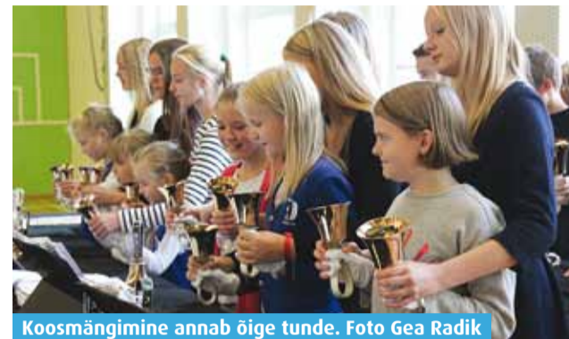
Kosmängimine annab õige tunde.