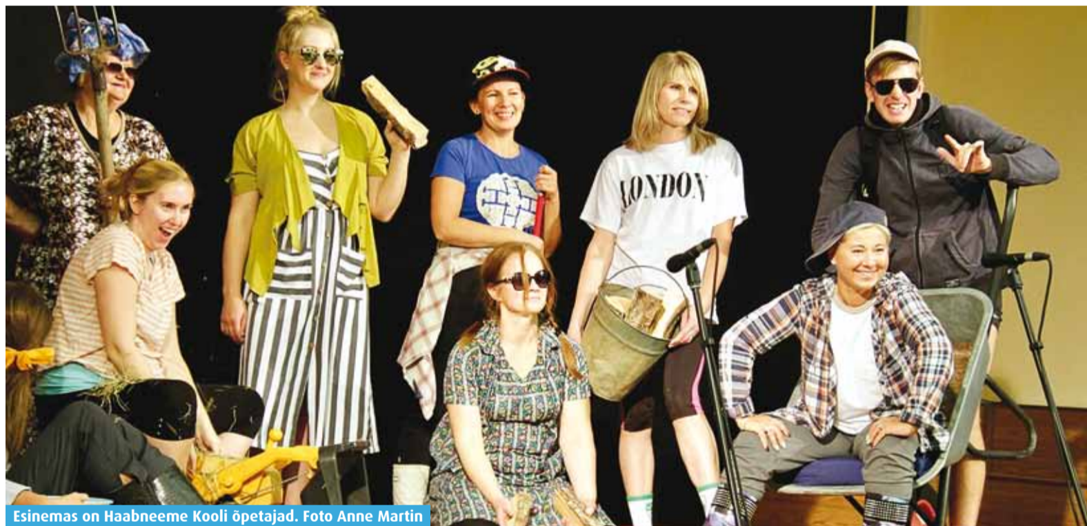
Esinemas on Haabneeme Kooli õpetajad.