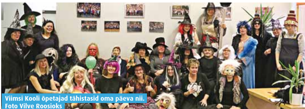
Viimsi Kooli õpetajad tähistasid oma päeva nii.