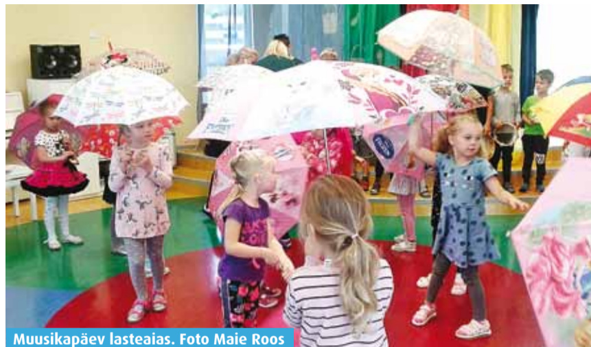
Muusikapäev lasteaias.