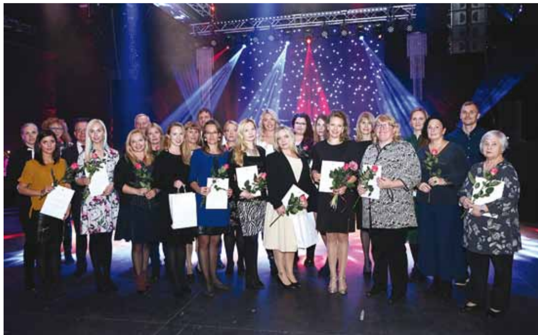
Viimsi valla poolt tunnustatud haridustöötajad 2018.

6. Kohusetundliku ja suure pühendumusega tehtud klassi-