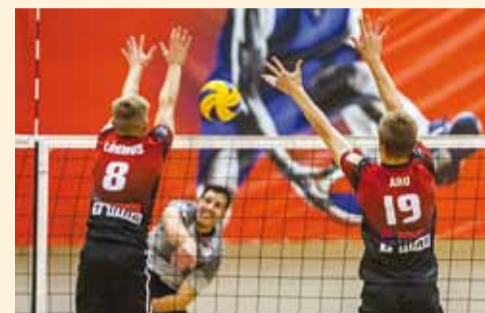
Võrkpall on võrratu.

Eesti võrkpallikoondise viimaste aastate edu lainel on ala populaarsus järjest kasvanud. Sellest hooajast alustab Selveri Tallinn Võrkpalliklubi treeninguid Viimsis, Haabneeme Koolis. Alaga on oodatud tutvust tegema ja uusi sõpru leidma kõik poisid ja tüdrukud sünniaastaga vahemikus 2007-2010.