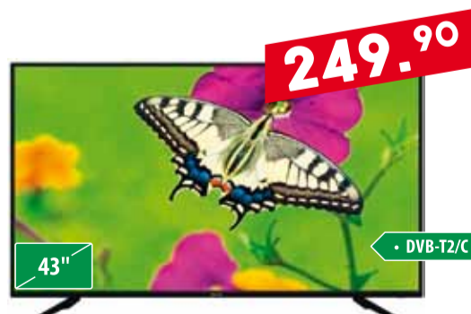
Teler Daewoo L43 T630VPE