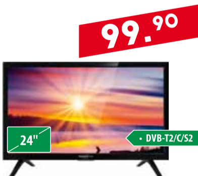
Teler Thomson 24 HD3206