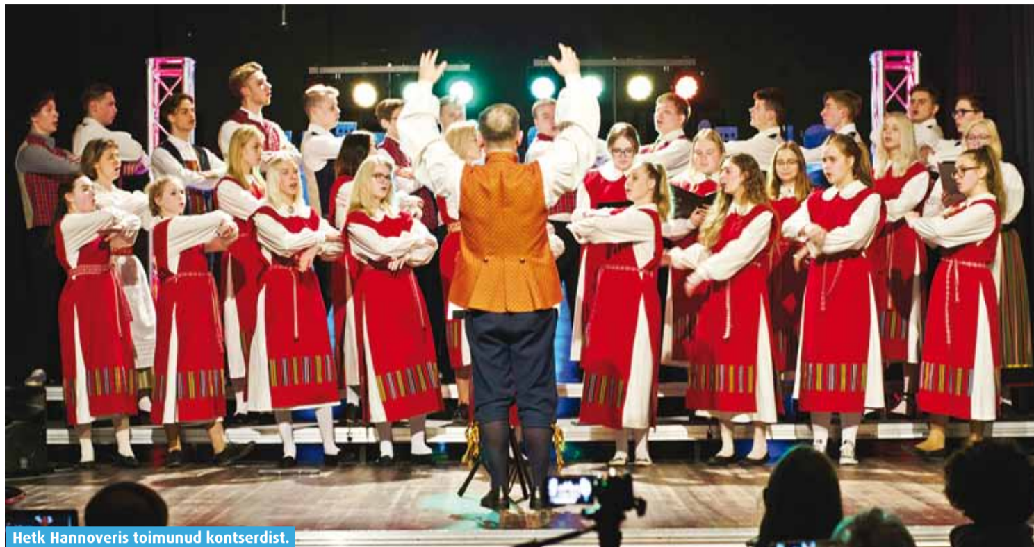
Hetk Hannoveris toimunud kontserdist.