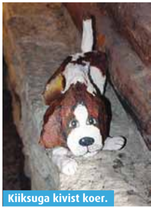
Kiiksuga kivist koer.

Traditsiooniliselt on sügislaad ja ubinapäev Viimsi vabaõhumuuseumis toimunud septembri viimasel nädalavahetusel, kuid seoses õunte varasema küpsemisega leidis see sündmus seekord aset nädala jagu varem, 22. septembril.