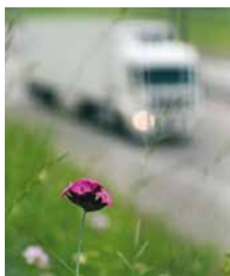
Hea uudis - transpordi saaste väheneb.

Samal ajal kui sõidukite arv, nende aastane läbisõit ja vedelkütuse tarbimine järjepidevalt kasvab, väheneb maanteetranspordi sektorist tekkinud õhusaaste, seda ka liiklustihedate sõiduteede vahetus läheduses.