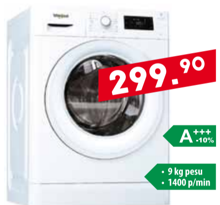
Pesumasin Whirlpool FWG 91484W