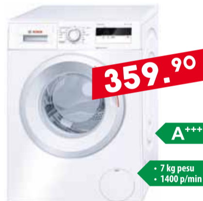
Pesumasin Bosch WAN280L7SN