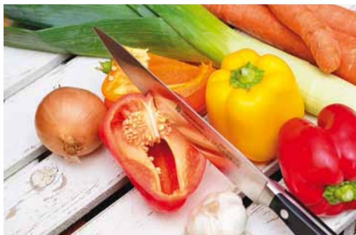
Mida värvilisem on toit, seda rohkem vitamiine selles leidub.

ralt värvilisi ande, näiteks kõrvitsaid, porgandeid, pastinaaki, maguskartulit, kaalikat, õunu, pime, jõhvikaid jne. Eelista võimalusel alati mahedaid puu- ja köögivilju, sest need on mürgija säilitusainevabad. Neid süües saad olla täielikult kindel, et need toetavad sinu ja su pere tervist.