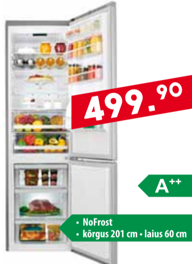
Kombikülmik LG GBB60PZGS