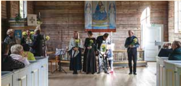
Tänukontsert Püha Maarja kabeli heaks.

Pühapäeval, 23. septembril tänas Harjumaa Omavalitsuste Liit kõiki 2. juunil Viimsis toimunud Harjumaa laulu- ja tantsupeol osalenud kollektiivide juhendajaid ja peo korraldajaid väljasõiduga Naissaarele.