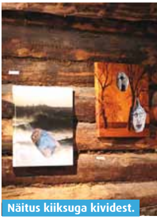
Näitus kiiksuga kividest.