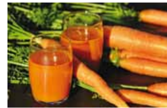
Oranžides viljades leidub palju C-vitamiini.

Biomarket hoolitseb selle eest, et mahe oleks alati lihtsalt kättesaadav, ja pakub laia ning värvilist puu- ja köögiviljavalikut. Mõned Biomarketi lemmikutest värsketest hooajalis-