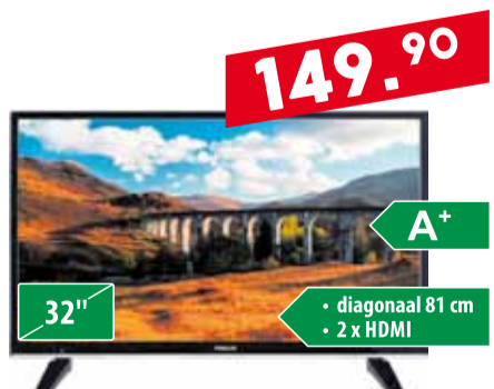
Teler Finlux 32 FHB4001