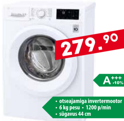
Pesumasin LG F2J5WN4W