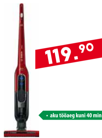
Varstolmuimeja Bosch BCH6ATH18B