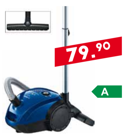
Tolmuimeja Bosch BGN2A300