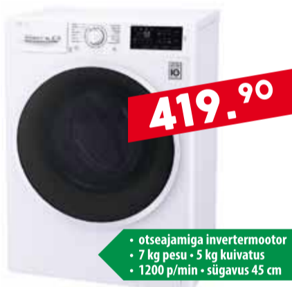
Kuivatiga pesumasin LG F2J6HM0W