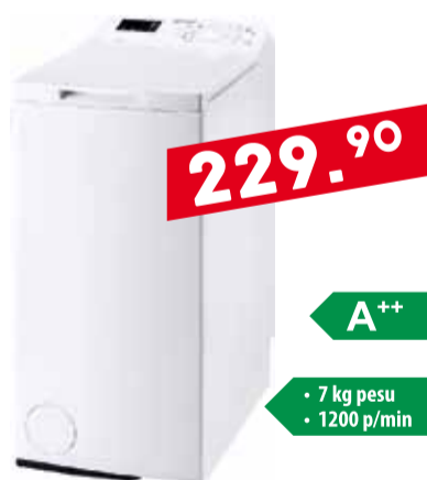
Pesumasin Indesit ITWD71252W