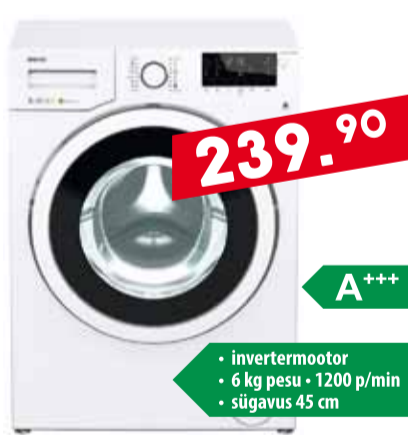
Pesumasin Beko WMY 61283MB3