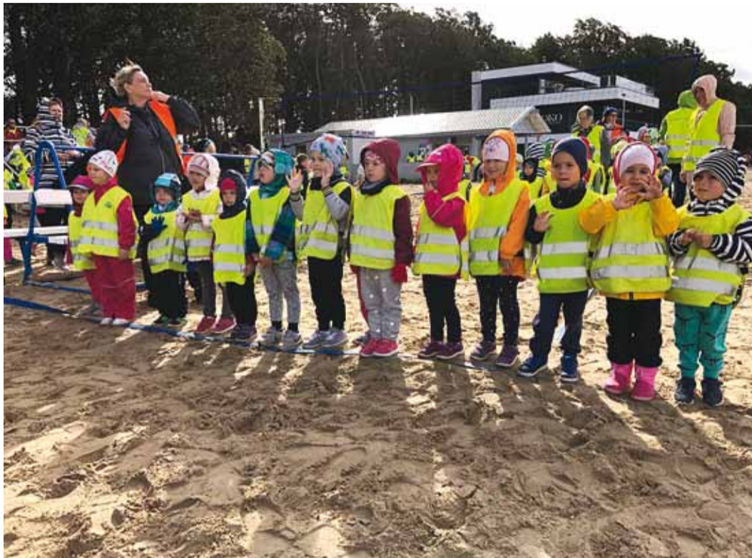
Rannajooksuks valmistumas.

Finišis ootasid lapsi rinnamärkide ja kõrrejookidega Viimsi lasteaiade õppejuhid. Lasteaiade direktor isiklikult jagas rühmadele tänukirju. Kui jooks joostud, leiti aega Haabneeme ranna uute atraksioonidega tutvumiseks. Puidust laev oleks just nagu spetsiaalselt meie ürituse jaoks randa uhitud.