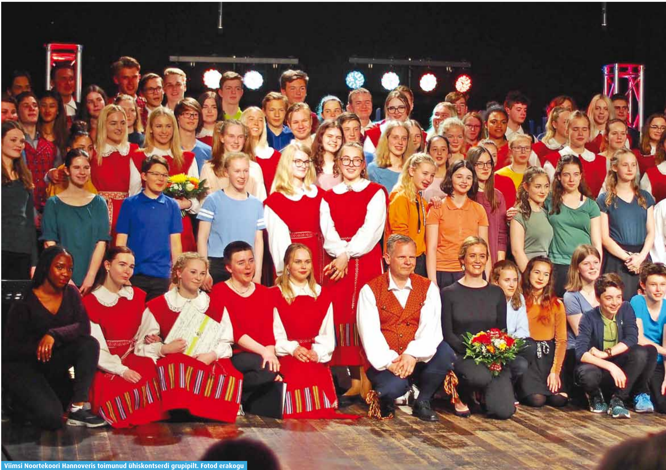
Viimsi Noortekoori Hannoveris toimunud ühiskontserdi grupipilt.