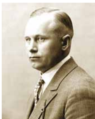
Otto Tief.

Pidulikkust jätkus ka Tallinna Reaalkooli kõrvale, hukkunud koolipoiste mälestusmärgi