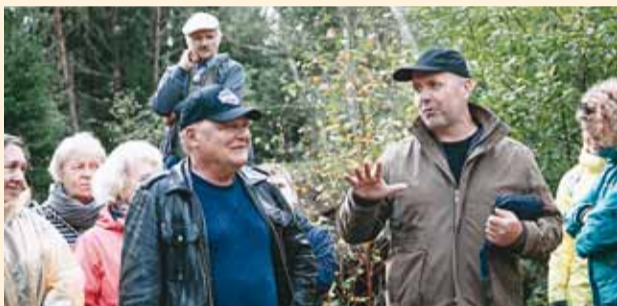
Külastele tutvustati Naissaare ajalugu.

Väljasõidul osalenud 80 Harjumaa kultuuritegijat said põgusa ülevaate Naissaare ajaloo ja koos külastati rannakaitsepatari 10B varemeid, mis on kõige monumentaalsem mälestis saare kirevast militaarajaloo.