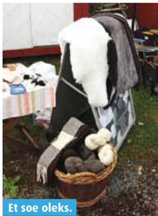
Et soe oleks.