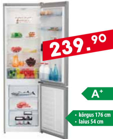
Kombikülmik Beko CSA270K20XP