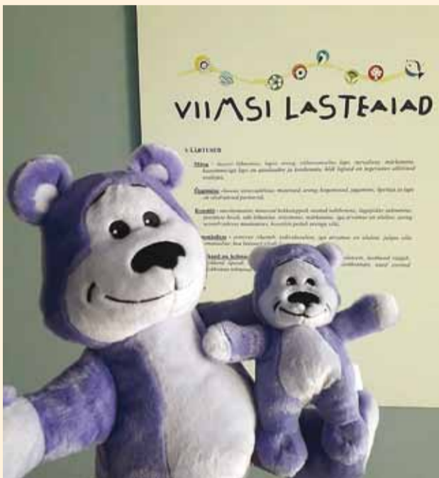
Sõber Karu aitab nüüdsest ka Viimsi lasteaialastel olla teineteisele headeks kaaslasteks.

Ühiskonnas aina laiemat kõlapinda pälviv kiusamine saab alguse vähestest sotsiaalsetest oskustest, mille hulka kuuluvad iga kaaslaste mõistmine ja temaga arvestamine. Inimesele annab robotite ees veel pikaks ajaks eelise just empaatiavõime ja vastavad oskused. Kiusamisega tegelemisel on efektiivsimeks viisiks selle ennetamine ning eriarvamuste oskuslik lahendamine.