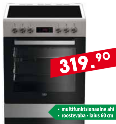
Klaaskeraamiline elektripliit Beko FSE 67310GX