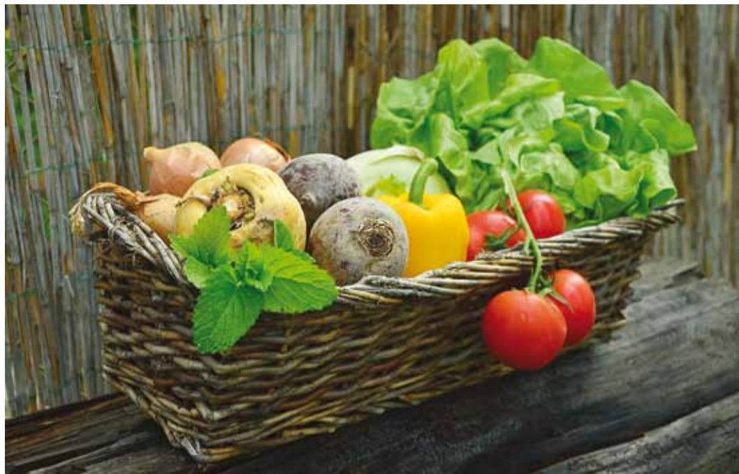
Eelista võimalusel mahedaid puu- ja köögivilju.

Uue hooaja saabumisel on aeg oma toidulauda muuta! Sügis pakub meile oht-