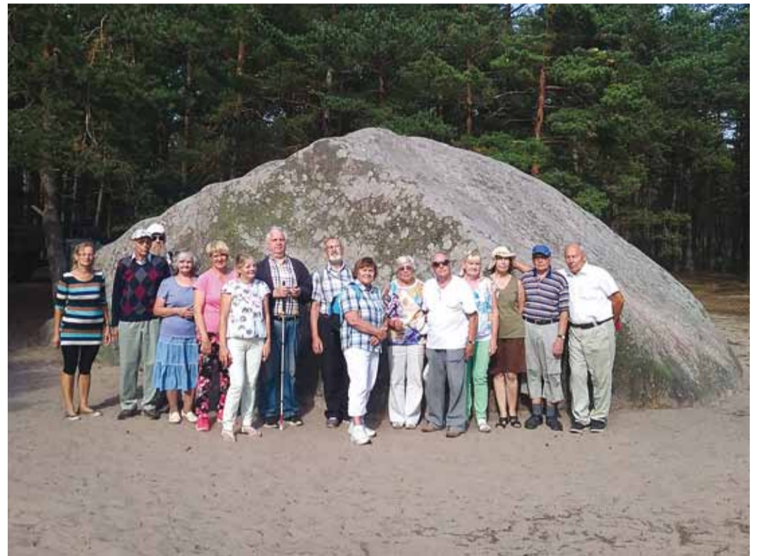
Matkajad Punase kivi juures.

Laevalt maha astunud rändurid, keda meietaluste kõrval oli teisigi, ei pea vaeva nägema söögiasutuse otsimisega. Võid kohe astuda välikohvikusse ja