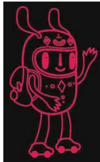
Selline on HopKid'i logo.

Appi tuleb uus nutirakendus Viimsi laste sõidutamiseks ja saatmiseks. Lapsevanemad on loonud nutirakenduse HopKid – sõidu- ja saatmisteenus platvormi, mis paneb kokku transportiteenus ja lapsehoidja parimad omadused ning võimaldab lasta lapsi turvaliselt sõidutada ja saata kooli, trenni, sünnipäevale või võistlustele. HopKid aitab kaasa Harjumaalaste liikumisvõimaluste parandamisele, sealhulgas ka Viimsi valla piirkondades elavatel lastel.