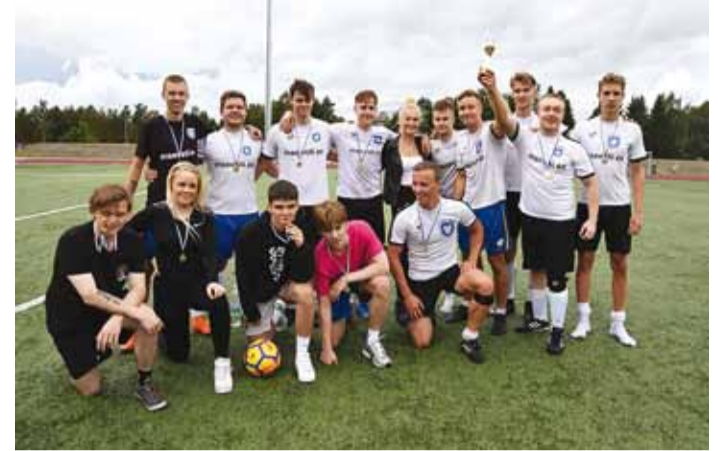
Noorte meeskond jalgpallikohtumisel noored vs vallavalitsus.