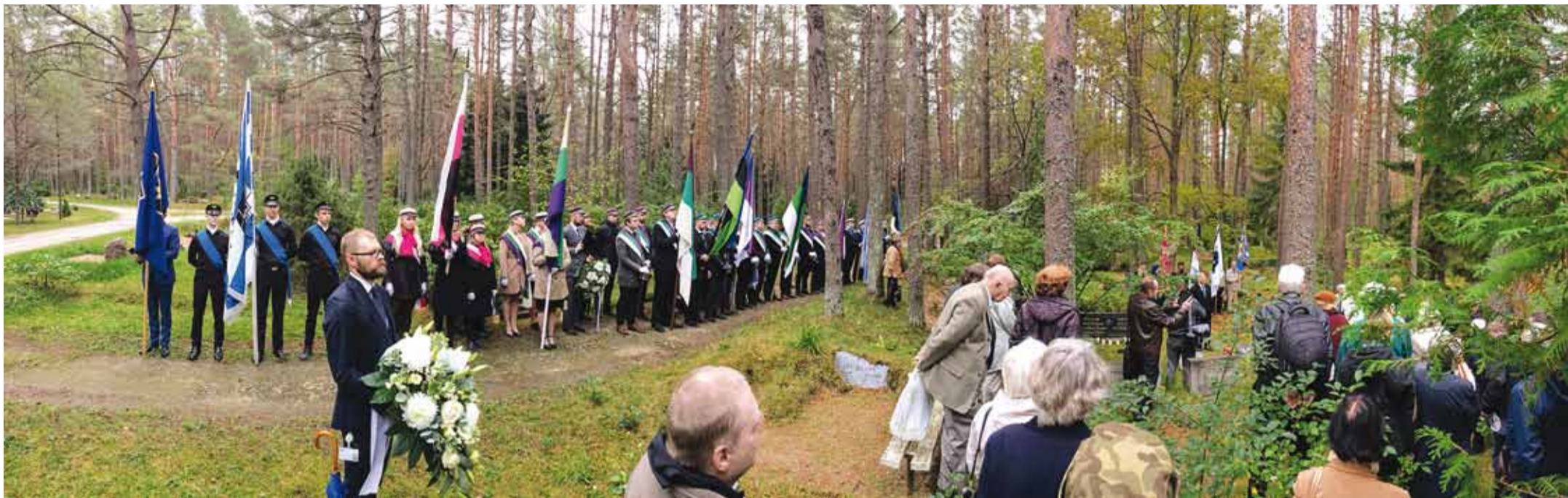
22. septembril koguneti Metsakalmistule meenutamaks Otto Tiefi valitsust ja tähistada vastupanuvõitluse päeva.