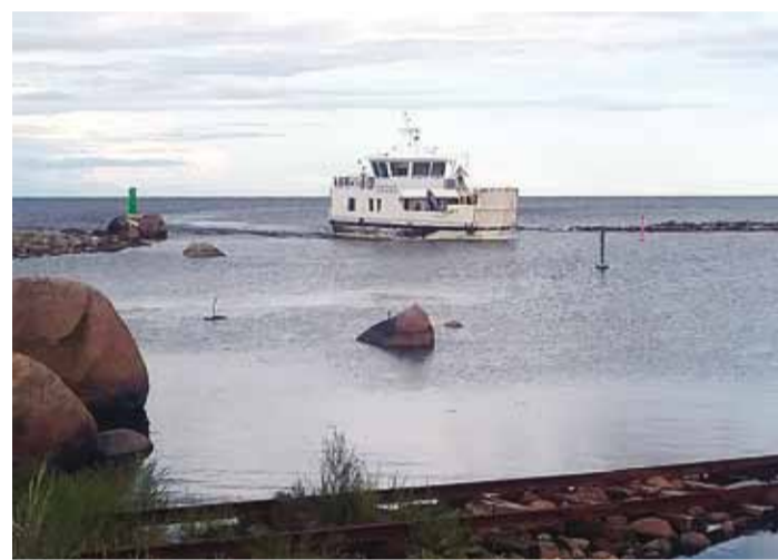
Tere tulemast, Wrangö.

endale midagi lubada. Tartlastel oli selja taha jäänud vähemalt üks söögivahe. End pisut turgutanud, oli võimalus ronida Prangli Reisidelt tellitud auto kasti ning Abruksa, Kihnu, Manilaiu, Osmussaare või Vormsi reisile sarnane saarematk võis alata.