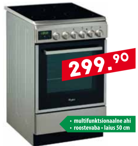
Klaaskeraamiline elektripliit Whirlpool ACMT 5533IX