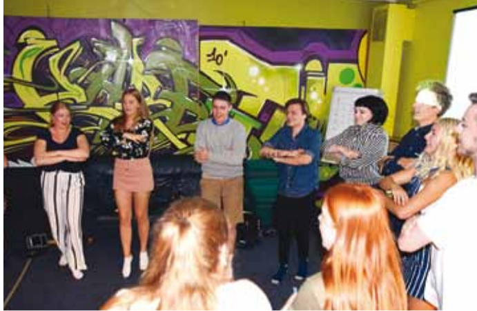
Islandlased Kaera-Jaani õppimas.