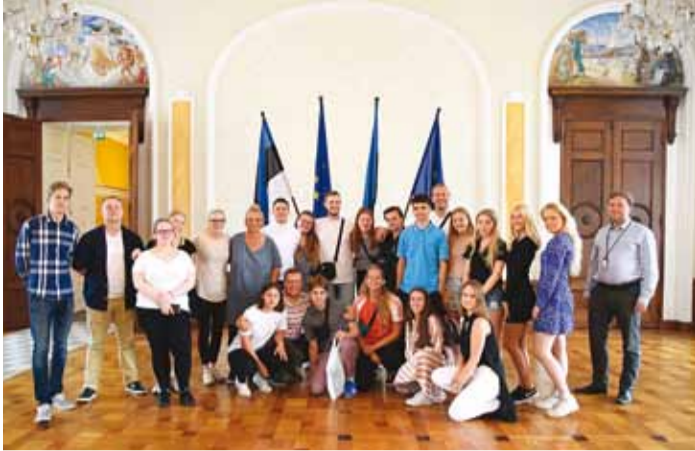
Riigikogu külastamine.