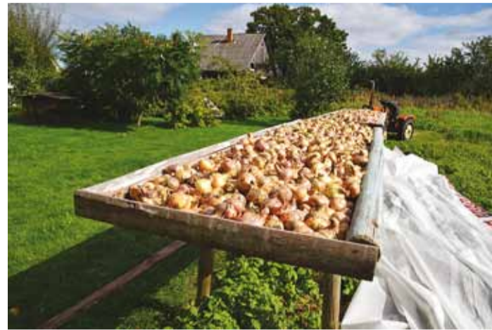
Sibulad peavad kuivamiseks saama soojust ja õhk peab liikuma.

Ehtsa Peipsiääre sibula tunneb ära lapiku kuju ja mahlase ning tugeva maitse poolest. Poola või Läti sibul, mida turul vahel Peipsi sibula pähe pakutakse, ei ole võrreldavgi! Viimsi-