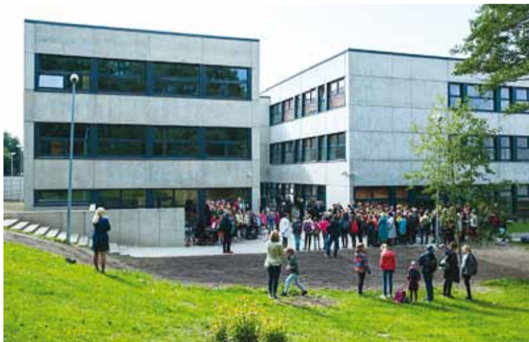
Haabneeme Koolist saab tänu uuele 3-korruselisele juurdeehitusele 9-klassiline kool. Kool sai juurde 1000 m 2 netopinda.

"Haabneeme Kooli uus moodne juurdeehitus loob juurde koolikohti ning pakub õpilastele ka erinevaid huvihariduslikke võimalusi nii teadmiskeskuse ringide kui ka kooli enda huviringide näol. Kool korraldatakse 6-klassilisest koolist ümber 9-klassiliseks ning nüüd saavad õpilased lõpetada Haabneeme Koolis põhikooli ega pea õp- petsükli käigus kooli vahetama."