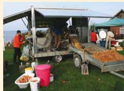
Mahlategemiseks on vajalik eelregistreerimine.

Mahlapressimisega alustatakse laupäeval kell üheksa ja press töötab kindlasti õhtutundideni välja. Vajadusel jätkatakse