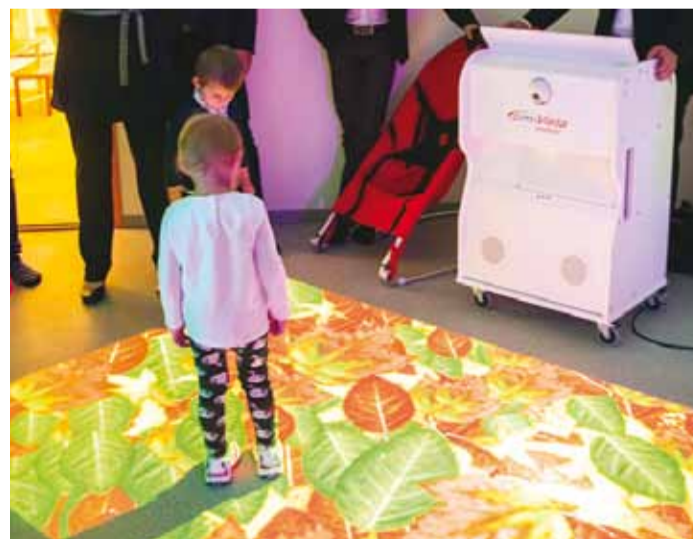
Uus-Pärtle lasteaia on uus ja moodne tehnoloogia, mis aitab lastel õppida muusika, värvidemängu ja interaktiivsete piltide abil.

“Viimsi on kasvav vald ning igal aastal on õpilaste arv meie valla koolides järjepidevalt suurenenud. Tänavu alustas esimesel septembril õppetööd kõikides valla koolides kokku juba 2575 õpilast,” ütles Viimsi vallavanem Rein Loik. “Haabneeme Kooli juurdeehitus on