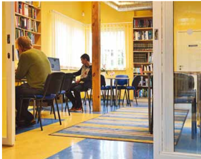
Viimsi raamatukogus on avatud teabetuba, kus lugejate kasutada 3 arvuti- ja 7 lugemiskohta.

Paljud teiste raamatukogude kolleegid on imestanud, kuidas me ometi nendes ruumidesse ära mahume, kui kõik näit-