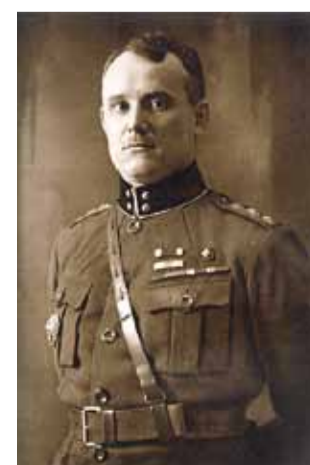
Kindral Johan Laidoner.

Kindrali mälestusele ja olümpia-aatele pühendatud teatejooks on kutsutud looma vaimset sidet kunagiste ja tänaste põlvede vahel. Kindral Johan Laidoneri olümpiateatejooksule on oodatud koolinoored, üliõpilased, kaitseväelased, kaitsepolitseilased, noorkotkad, spordiklubid ja firmad, et võisteldes proovile panna oma sportlik visadus ja tahtejõud.