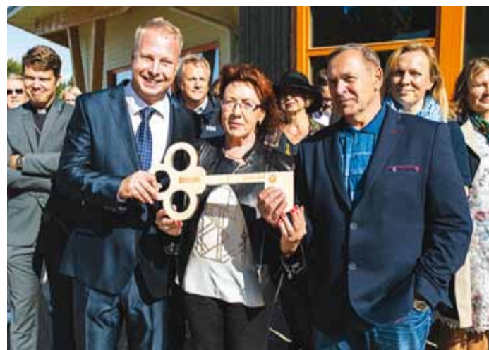
Ehitaja andis sümbolise lasteaia võtme Viimsi vallavalitsuse ja volikogu ning Harju maavalitsuse esindajate kätte.