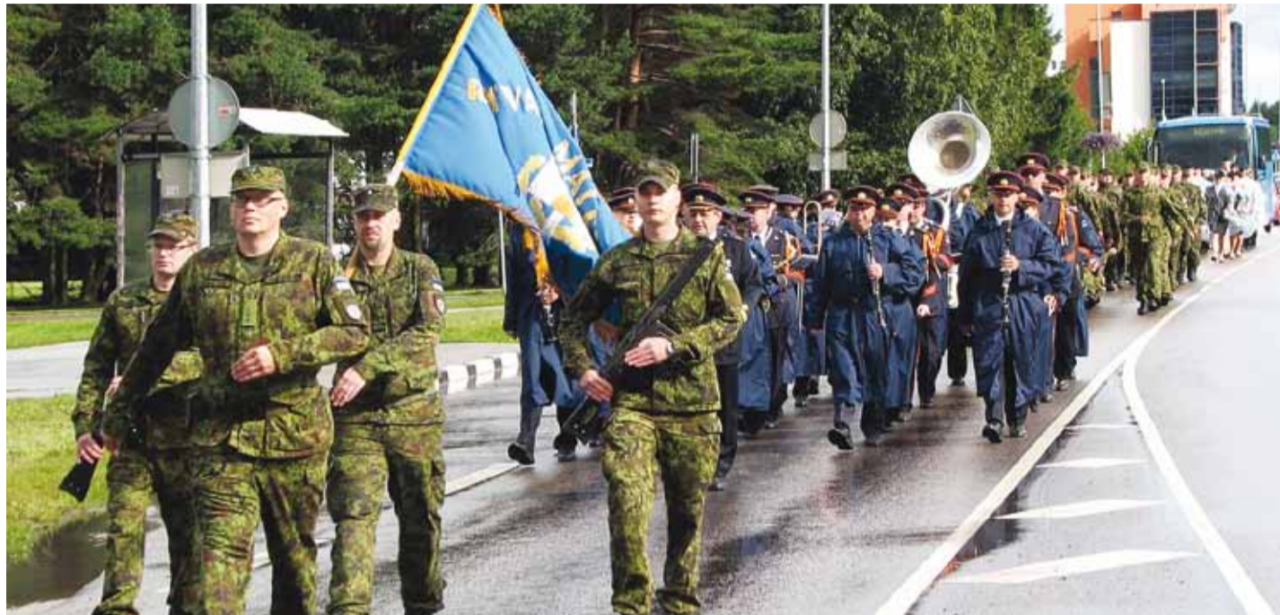
Rävala malevkonna esindus marsis läbi Haabneeme aleviku.

Jalutuskäigust ja pidulikust rivistusest võtsid osa malevkonna liputoimkond, kaks rühma, Noorte Kotkaste, Kodutärdar ja Naiskodukaitse esin-