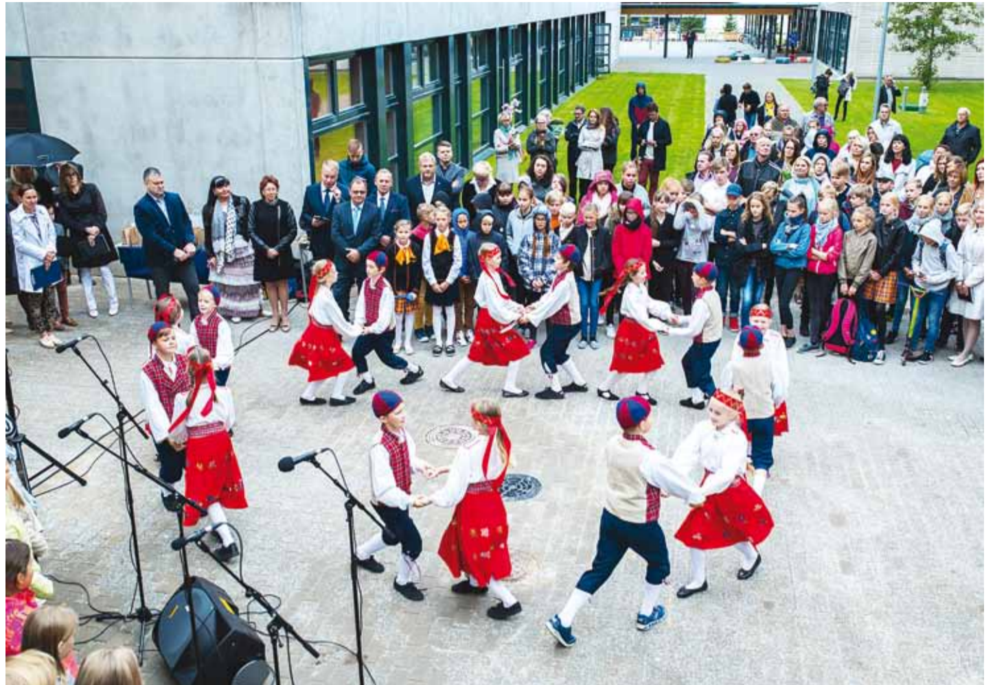
Avamisel esinesid Haabneeme Kooli tantsulapsed.