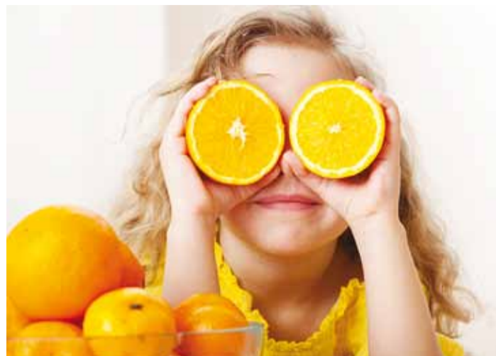
Kõige kuulsamat vitamiini C saab ka tsitruselistest.

Algav sügis toob lapsed linna uueks kooli- ja lastaia-aastaks. Lapsevanematena soovime, et laps kohaneks kiiresti uue elurütmiga ning kohe esimesed viirushaigused last tõvevoodisse ei murraks. Kui väikelaps on plaanis viia esmakordselt sõime või lasteaeda, oleks nutikas hakata selleks juba aegsasti valmistuma. Uues keskkonnas, kus on uued reeglid, palju uusi kaaslast, uued toidud, kasutusel teised materjalid ja puhastusvahendid võib väikelapse immuunsus saada suure koormuse. Kui veel lisada stress, mis kaasneb vanematest lahusolekuga, võib vastupanu haigustele nõrgeneda. Aga kui laps on haigestunud, siis tegeleb kogu organism haigusega võitlemisega ning lapse areng jääb tahaplaanile. Sagedaste haigestumise pärast tunneb muret aga kogu pere, vanemate töökäimine on takistatud ja haigestuda võivad ka teised.