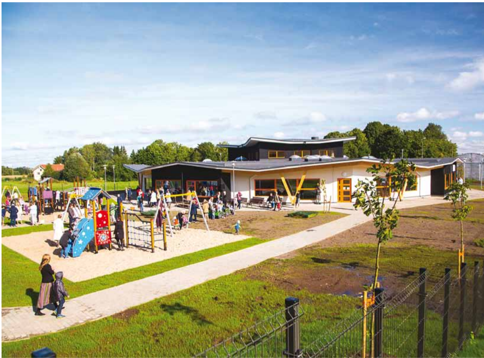
Uus-Pärtle lasteaia 2-korruselises hoones on kuus rühmaruumi, eraldi ruumid muusika-, kunsti- ja võimlemistundide läbiviimiseks ning teraapiaruumid. Lasteaia netopinda on 1551 m 2 .