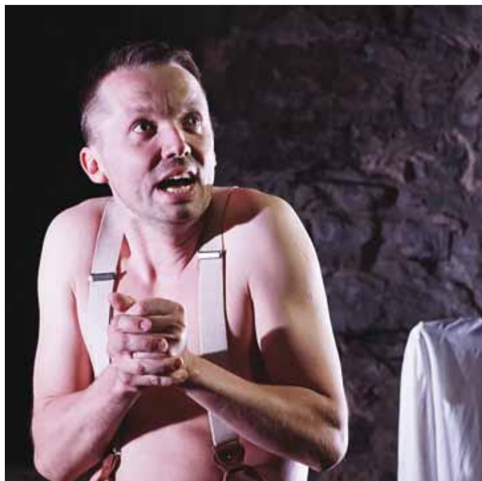
Argo Aadli täissaalidele mängitud lavastus "Hullumeelse päevik" jõuab Viimsi publiku ette novembris.

Sel sügisel pöörame rohkem tähelepanu toitumisele. Tulemas on loengud taimetoiduhuvilistele. Räägime toitumise mõjust enesetundele, meeleolule, kehakaalule ja tervisele. Kuidas