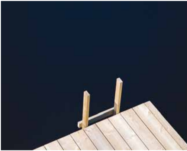
Palju olulisem eesmärgile jõudmisest on teekond selle sihi suunas.

Küllap see küsimus vaevab meid igäht aegajalt, olgu siis üksikisikuna või kogukonnana, ja loomulikult ka ühiskonnana. Samas ühe probleemina võiks vast seejuures esile tõsta hoopiski selle, et me tõttame edasi küll, kuid teadmata tegelikult kuhu. Sest kui silmsil on vaid väikesed eesmärgid, on kaugemad sihid puudulikud ning nii võib tulevik päris tume paista.