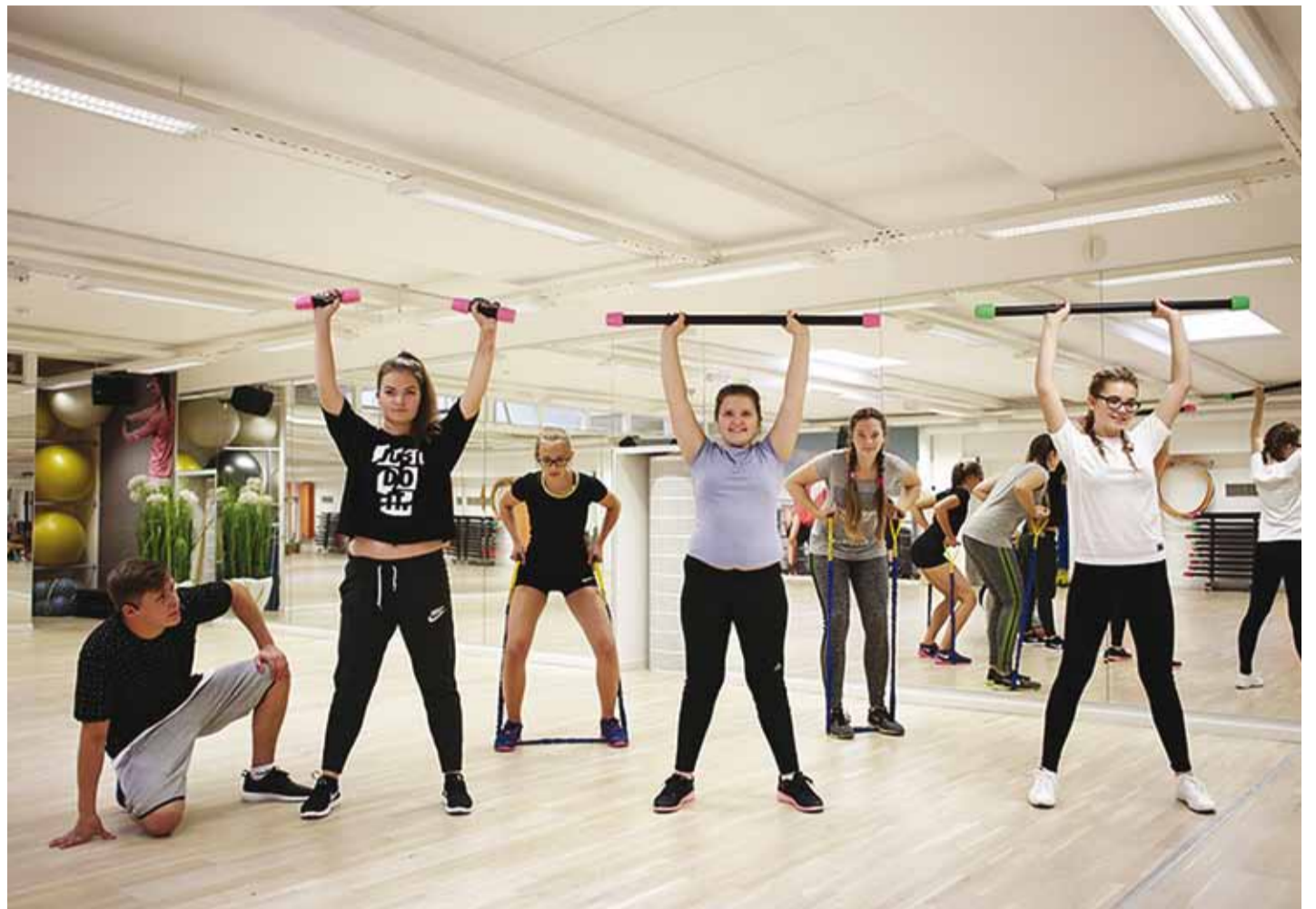
Noortetreening on 12–15-aastastele noortele mõeldud lõbus ja kaasahaarav üldfüüsiline treening.