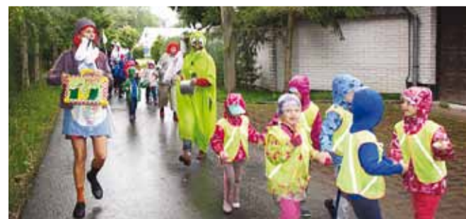
Pidupäeva matka juhtis Pipi koos sõprade Karlsoni, nõia ja jäneseaga.

1. septembril oli Randvere lasteaia rohkem signat-siginat kui tavalistel päevadel, sest lisaks teadmiste päevale tähistati Randvere lasteaia 10. sünnipäeva.