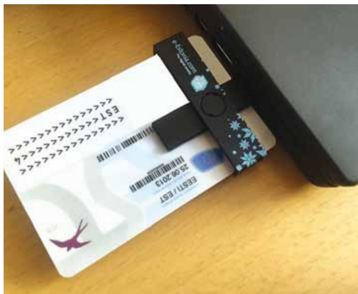
Võimalik turvarisk puudub alates 16. oktoober 2014 välja antud ID-kaarte.

“Praeguse info kohaselt ei ole antud turvarisk realiseerunud ning mitte kellegi digitaalset identiteeti ei ole selle abil kuritarvitatud,” ütles Peterkop.