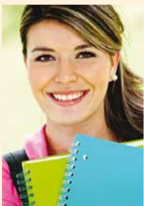
Tunnustused antakse üle 17. oktoobril.

2017. aastal pälvivad täiskasvanud õppija nädala (TÕN) raames tunnustuse 8 Harjumaa tublimat tegijat järgmistest kategooriates: aasta õppija, aasta koolitaja, aasta koolitussõbralik organisatsioon, aasta raamatukogu ja aasta õpitegu.