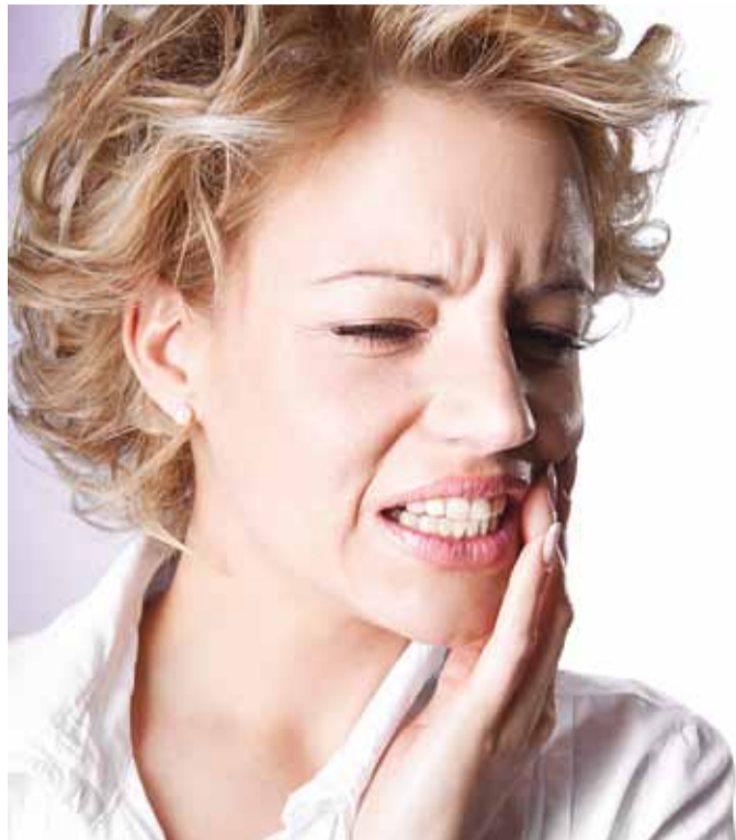
30-eurost hüviti saab kasutada ühel hambarasti külastusel kuni 50% arve eest tasumiseks ning hüvitis arvestatakse kohe arve tasumisel.

Kui arst osutab nii nimekirja kuuluvaid kui ka mittekuuluvaid teenuseid, siis arvestatakse