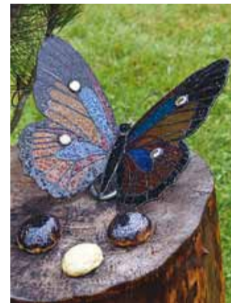
Vitraažiliblikas on perenaise kädetöö.