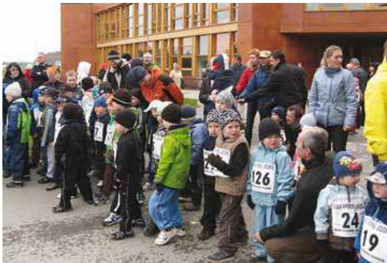
8. mai 2010, XXIV Viimsi Jooks. Tillude vanuseklassi poiste start.

Arengukava jääb avatuks pidevale ja regulaarsele uuendamisele aruteludele, täiendavatele ettepanekutele ning võimaldab arendada muid liikumisharrastuse ja spordi arengut puudutavaid dokumente.