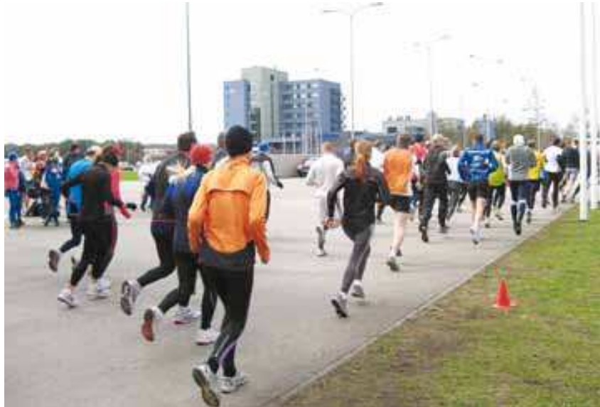
8. mai 2010, XXIV Viimsi Jooksu start 9,5 kilomeetrisele distantile.

ta järelejäävat vaba aega mitte raisata liikumiseks muude piirkondade vaba aja ja sporditegevuste juurde, vaid leida selleks võimalusi kodukohas. Nagu näitavad teostatud uuringud, on siserajatised (indoor) maksimaalselt koormatud ja pakkumine on selles osas maksimaalselt kasutatud. Kui aga arvestada valla elanikkonda, potentsiaalset tarbijat, siis oleks tarve veelgi suurem. Siserajatiste osas on seega võimalused ammendatud ja jääb üle kasutada reservi – välistingimustes (outdoor) olevaid või sinna loodavaid võimalusi . Antud suundumus leiab käsitluse arengukava viimases, (arendavas) osas.