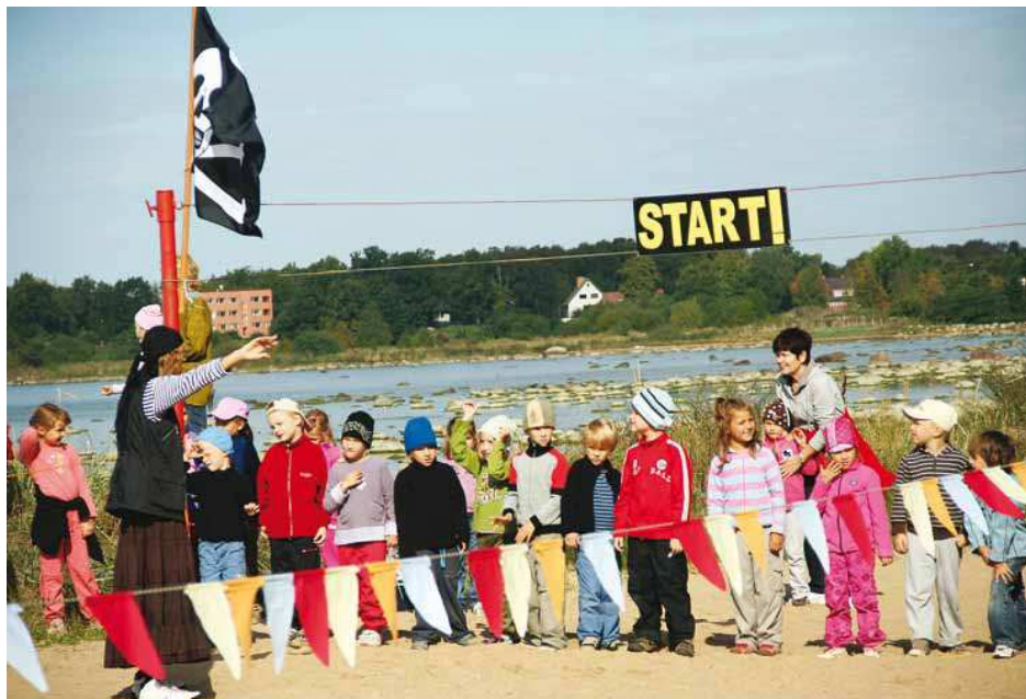
Viimsi Lasteaiad lapsed 9. septembril 2010. a Haabneeme rannas sportlike mängu läbi viimas.