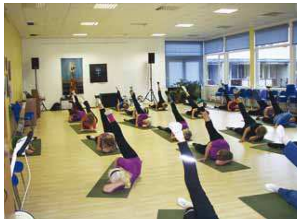
Tervisevõimlemine Viimsi Päevakeskuses.

Nii uuringute kui ümarlaua arutluste põhjal ilmneb ka vajadus väiksemate võimlemise/tantsusaalide, jõusaalide, lauatenniseruumide järele , mis ei pruugi olla omaette rajatised, aga võiksid paikneda teiste rajatiste/hoonete juures. Sellised rajatised võiksid olla ka lähipiirkonda jäävate elanike/töötajate (eriti just eakate inimeste) liikumisharrastuse rahuldamiseks, nagu see toimib väga hästi paljudes Lääne- Euroopa riikides.