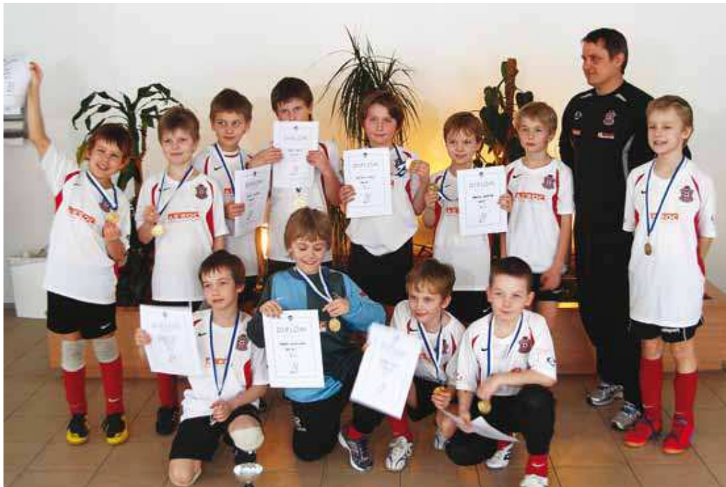
Martin Reimi Jalgpallikool Viimsis on oma kaheaastase tegevuskava tähtsaima eesmärgi saavutanud. Kiili Cupi võitjad 2010. a.

Rahastatavate tegevuste kohta käiv regulaarne aruandlus ja planeerimine on loonud koondpildi valdkonnast ja võimaldab kavandada edasist tegevust ka situatsioonis, kui laste ja noorte huvitegevust hakatakse regulaarselt toetama ka üleriigiliselt (alates 01. jaanuarist 2009. a. loodeti rakendada laste ja noorte huvitegevuse üleriigiline toetus, kuid seoses alates 2008 alanud üleüldise majandussurutise situatsiooniga on määramata ajaks edasi lükatud).