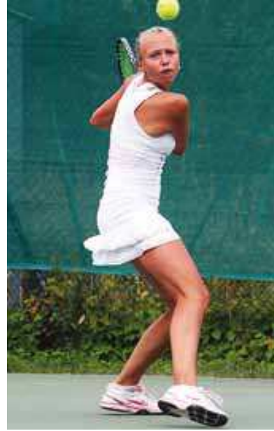
Anett Kontaveit võistlushoos, 2011.