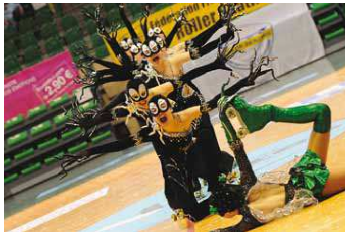
7.-8.05.2010 EM rulluisutamise kujunduisutamises ja rühmakavades Prantsusmaal. Viimsi rulluisuklubi Rullest tündrukud rühmakavaga "Ämblikud".