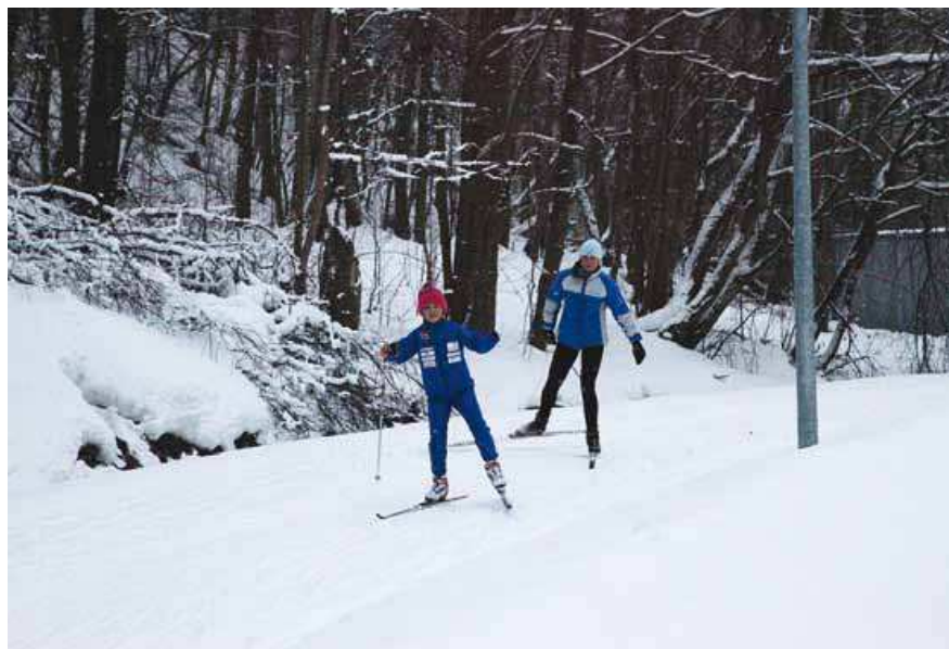
Treeningul tervisespordirajal, 2011.

Ühe olulise strateegilise ülesandena on Viimsi vallas vajadus spordirajatiste ja liikumisradade võrgu (siia kuuluksid eelkõige välisrajatised, kuid pikas perspektiivis ka siserajatised) tervikliku arendamise ja haldamise korraldamist . Valla ülesanne on välja töötada ja käivitada optimaalne ja efektiivne lahendus kas koostöös partneriga mittetulundus- või ärisektorist või siis valla allaasutusena alates 2012. a.