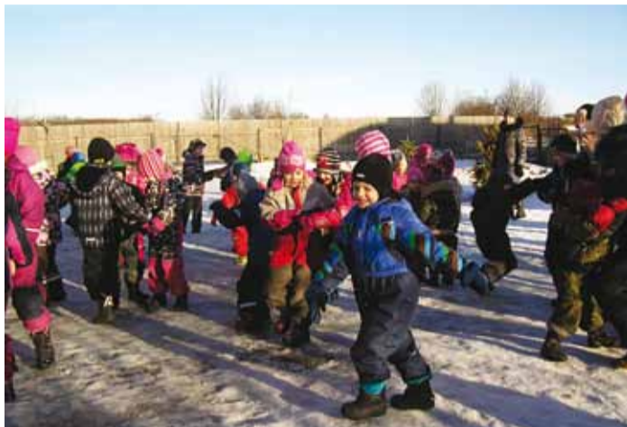
Sõbrapäevapeol ei hakanud kellelgi igav.

Lapsed jälgisid esinemise huvi ja rõõmsa kaasaalamise- ga ning sedasi tekkis mõnus õhkkond, kus mängiti muu- sika, naeru ja kilgete saatel koos vahvaid ja lõbusaid män- ge. Laulumängud "Kes aias", "Mul on üks tore tädi", "Lapa- duu" jt haarasid kõik kaasa ja näiteks "Värvamängust" võt- sid osa ka õpetajad. Vähem- tuntud mängudest tehti läbi näiteks lõbus "Till-lill-lippu linnassid" ja Hilariuse "Hiire