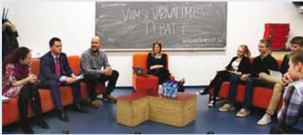
Vastamisi on noored ja poliitikud.

18. veebruaril toimus Viimsis esimene varivalimiste debatt – noored vs poliitikud, kus arutleti teemal: kuidas noori rohkem poliitikaga ühendada?