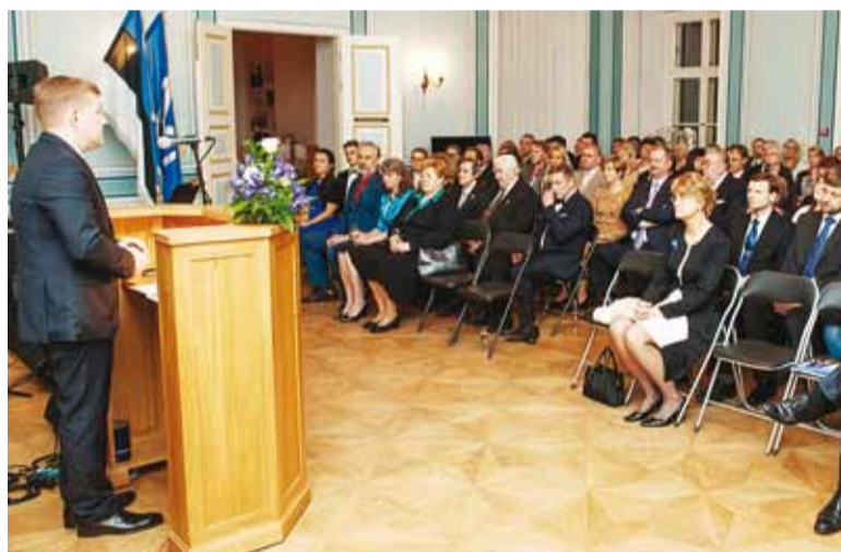
Rohkem fotosid vastuvõttust näete www.fotograafid.ee ja Viimsi valla Facebookist.