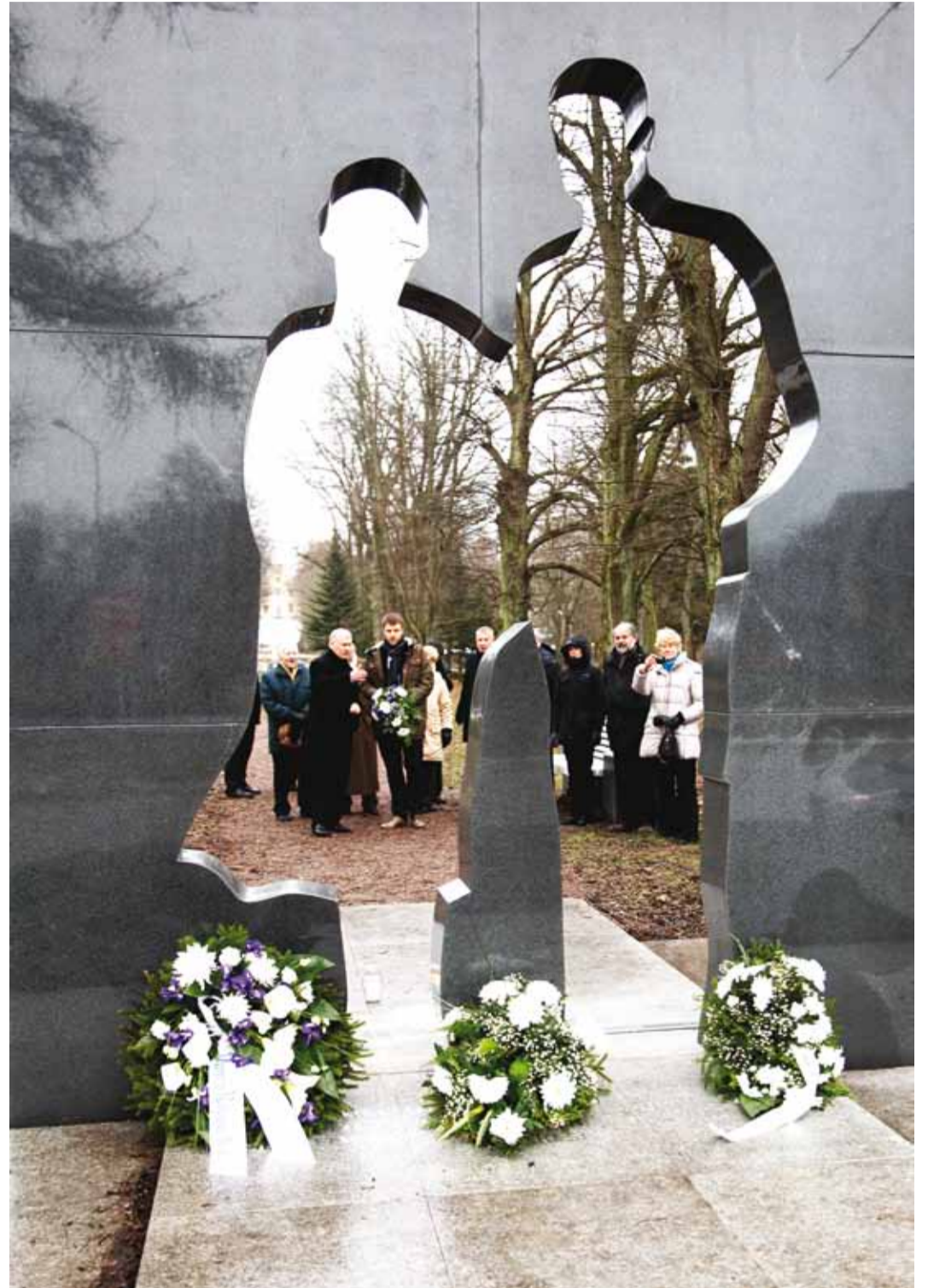
Pargade asetamine Johan Laidoneri ja Maria Laidoneri mälestusmärgi jalamile.

1. detsembril 1924 nimetati Johan Laidoner kommunistliku riigipöördekatse ajal