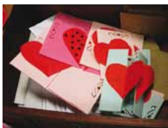
Sõbrapäeva postkast.

9.-13.veebruarini kestis meie koolis üle-eestilise noorteorganisatsiooni T.O.R.E. (Tugiõpilaste Oma Ring Eestis) siinsete liik- mete korraldatud sõbra- nädal. Tugiõpilased taha- vad suurendada märka- mist, hoolida kaaslastest, olla toeks ja arendada oma sotsiaalseid oskusi.