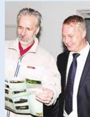
Kaartide esmavaatlus Viimsi vallavalitsuses.

Põhja-Harju Koostöökogu ühistegevuse tulemusel valmis Viimsi, Jõelähtme ja Rae valla turismikaart, mida esitleti turismimesil Tourest 2015.