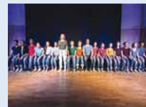
Hetk etenduselt.

Viimsi Kooli näitering Eksperiment osales 31. jaanuarist 2. veebruarini kestnud teatrifestivalil “Teenifest XIII” uue lavalooga “Vaba(n)dus”. Lavastus pälvis uhke metateatraalse kohalolu preemia.