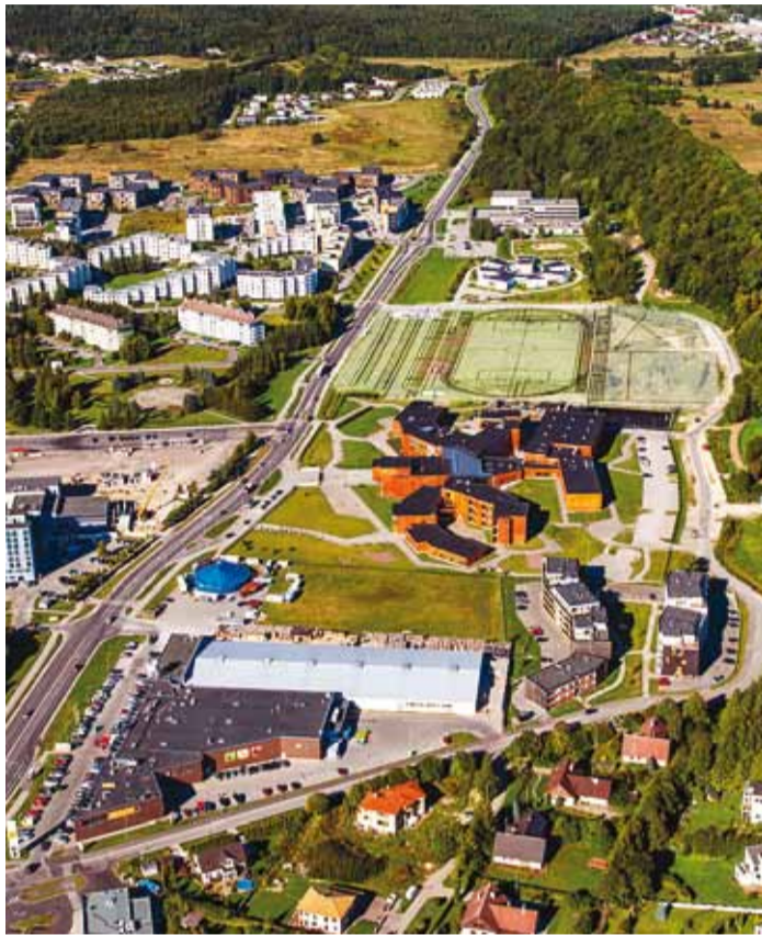
Aerofotolt paistab, kus staadion asuma hakkab.

“Kaasaegse kergejõustiku- ja jalgpallistaadioni ehitamine on koalitsiooni lubadus, mille täitmist pean isiklikult üliolu-