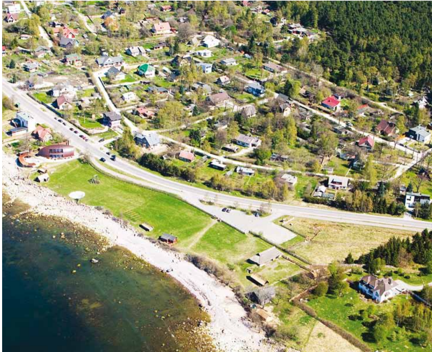
Vaade Pringi küllale vabaõhumuuseumi kohalt.