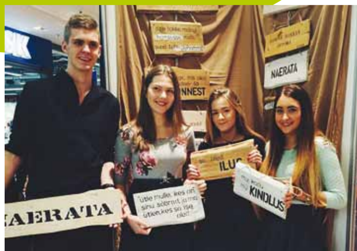
Koos autoritega on pildil valik Slogani töid.

Slogan kujutab endast puupinnale värvitud ajatut tsitaati, vaimukad ütlust või motiveerivat mõtetera. Slogan sobib ideaalselt kas kinkimiseks või