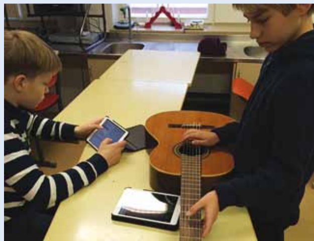
Turengin yhteiskoulu paberivaba 7. klassi õpilased füüsikatunnis.