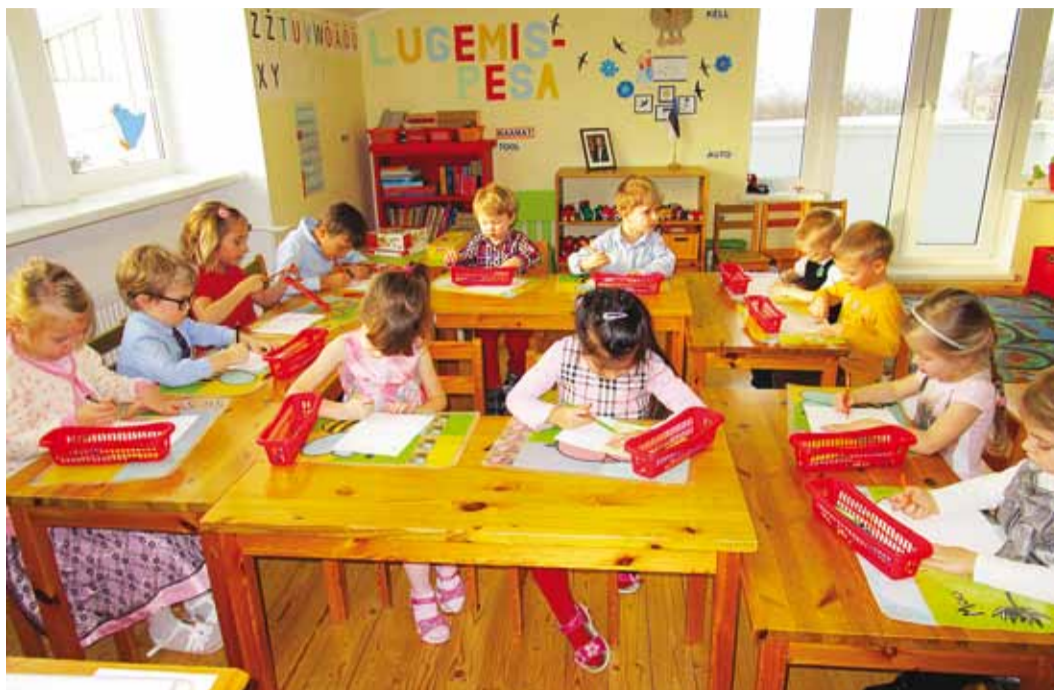
Pääsupojad on rõõmsad ja loominguilised.

Lapsed teeb rõõmsaks rohke õues viibimine. Meil rakendunud õuesõppevorm lubab lastega õues läbi viia pea kõiki tegelusi. Oma õuealadele oleme just õuesõppe tarbeks ehitada lasknud katusealused, mis lasevad väljas tegutseda iga ilmaga. Pääsupoegadel on õues mängimiseks ilusa haljastuse ja toredate atraktsioonidega õueala. Lapsed koos õpetajate