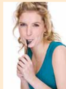
Mesimagusal naiste- päev.

Eesti Meetootjate Ühendus korraldab 7. ja 8. märtsil Tallinnas Lillepaviljonis (Pirita tee 26) kogupere ürituse Mesimagusal naistepäeval.