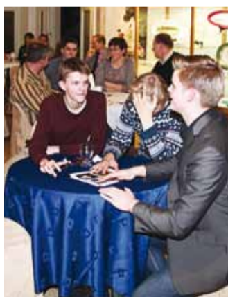
Korraldajaid rõõmustab hea tagasiside. Fotojäädvustus õpetajate ja õpilaste meeskonna võistlusmomendist.