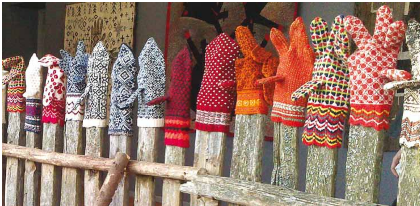
Käpikutel on meile palju jutustada.