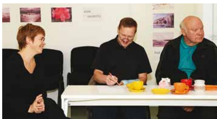
Võidukas Muuga võistkond.

Näiteks arutati tükk aega, millistel spordialadel võivad nii mehed kui ka naised oma-