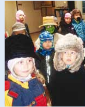
Väikesed mardisandid.

Ootame novembrikuus mardid- ja kadripäeva programmidesse külla lasteaedu ja algklasse.