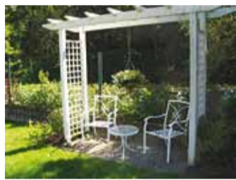
...kui ka puhkekohti.