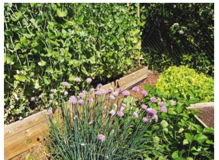
Koskla tee lastesõbralikus aias oli väga tore köögiviljanurk.