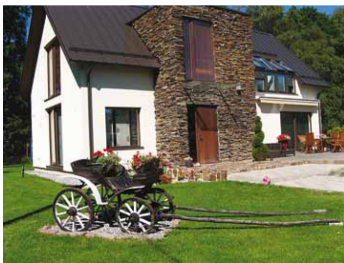
Suvelilled päralt on Kristel Menningu Pääsukese tee aias kaarik.