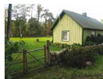
Väga korras suvilaõuesid tuleb järjest juurde.