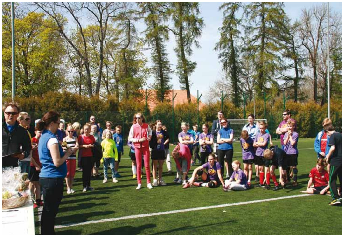
Võistlused on täies hoos.

Kuigi seda on peetud pigem miinuseks, leiavad mitmevõistluse korraldajad, et paralleelklasside rohkus on üheks Viimsi Kooli väärtuseks. See laseb ju