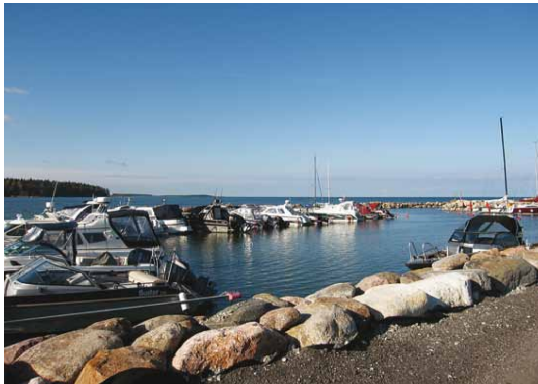
Sopp Kelvingi sadamast.

Tiirutame Kelvingi tänavail, vaatame üle randa rajatud puhkealad, spordi- ja mänguplatsid (suuremalt jaolt on need valminud 2005. aastal), mille jaoks vald maa tasuta rendile andis ja mille pärast küla ka