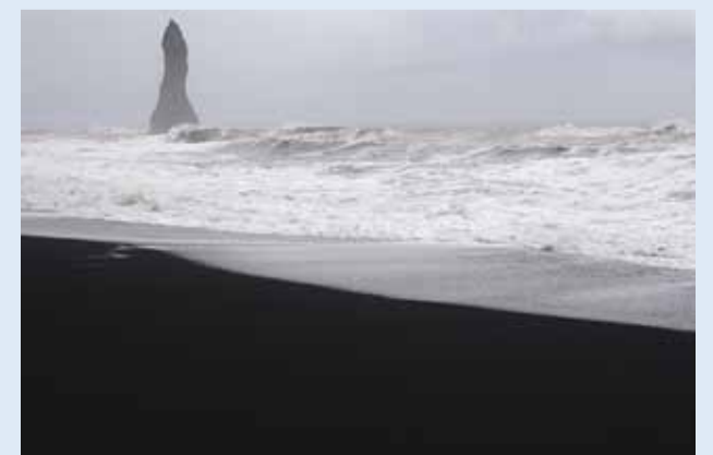
Musta liivava rand.