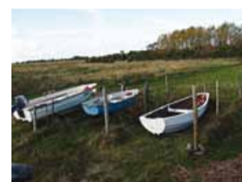
Paate kaitseb okastraat rannas üidanud pulli pärast.