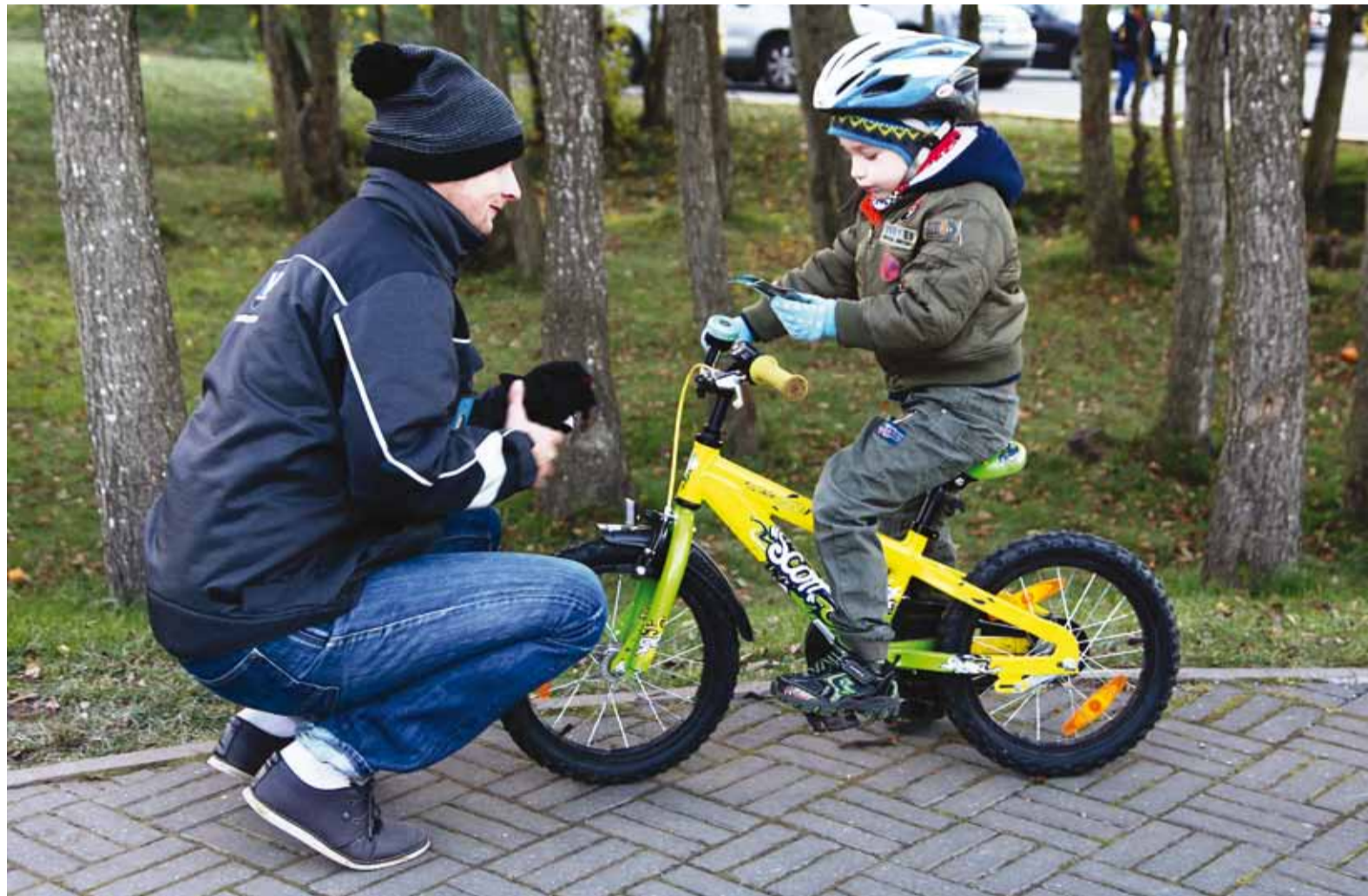
Helkurite jagamine Karulaugu lasteaia juures.