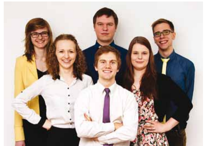
The Fews. 2011. aasta Viimsi JazzPopFestil jagasid The Fews ja Söörömöö I ja II kohta.

Kell 15.30 algab vokaalansamblite võistlus, kus astuvad üles ansamblid Blue-S, Ellad, Force Mažoor, Kammerkoor Aktiva meeskvarlett, Keskmised, Kört, Musaklubi vokaalansambel, Mustad Klahvid,