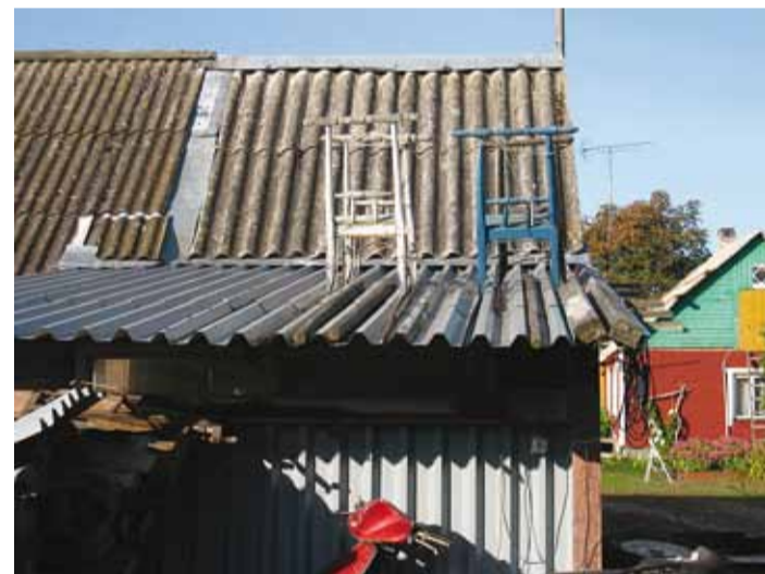
Neli kelku taliteeootel.

võsu-liivsiibulaid ja viimaseid roosa merikanni õisi. Mõlemad liigid on kaitse all, kalmuaias saavad nad rahu kasvada.