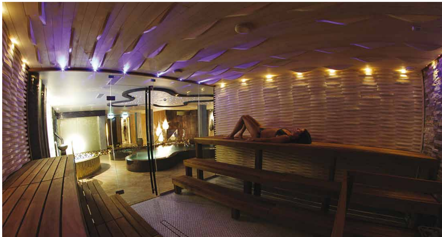
Leili võttes näeb ka seda, mis toimub lõõgastusaladel.