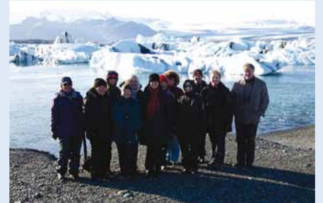
Jokulsarlóni laguuni ääres.

26. septembrist 1. oktoobrini viibis 12 Viimsi Kooli gümnaasiumiastme õpetajat Islandil rahvusvahelise projekti ESTIC – Sustainable School Policy kohtumisel.