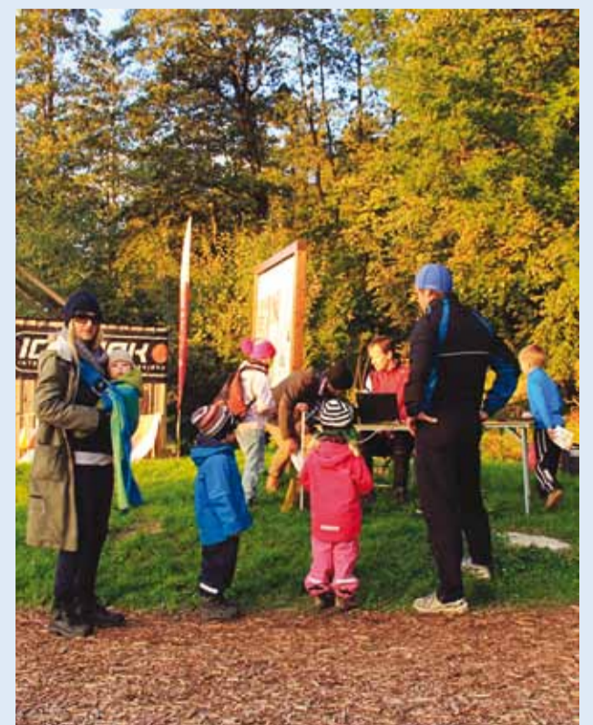
Karulaugu MOBO rajal.