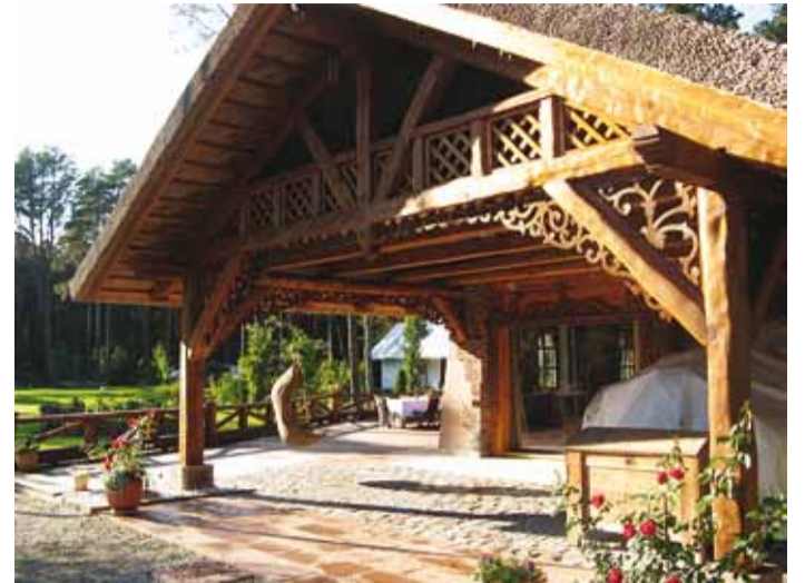
Tammneemes Perna tee 20 koduaias kohtuvad Eesti ja Moldovaavia omapära.