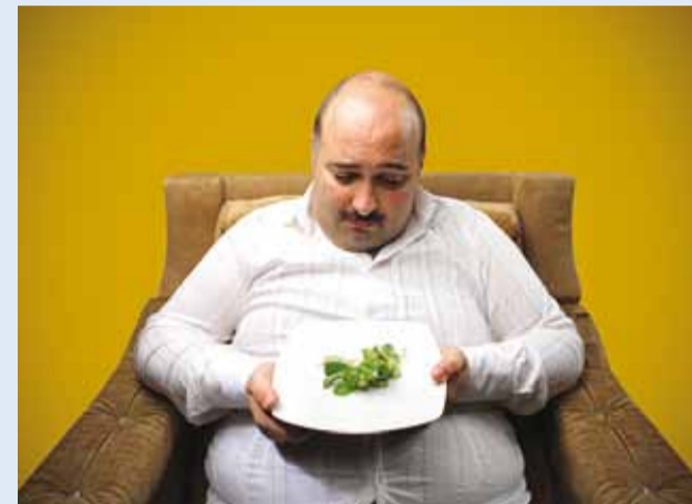
Täielik loobumine võib olla kehale liiga suur muutus.

Targalt toitudes teeme head nii oma tervisele kui ka enesetundele ja meeleolule.