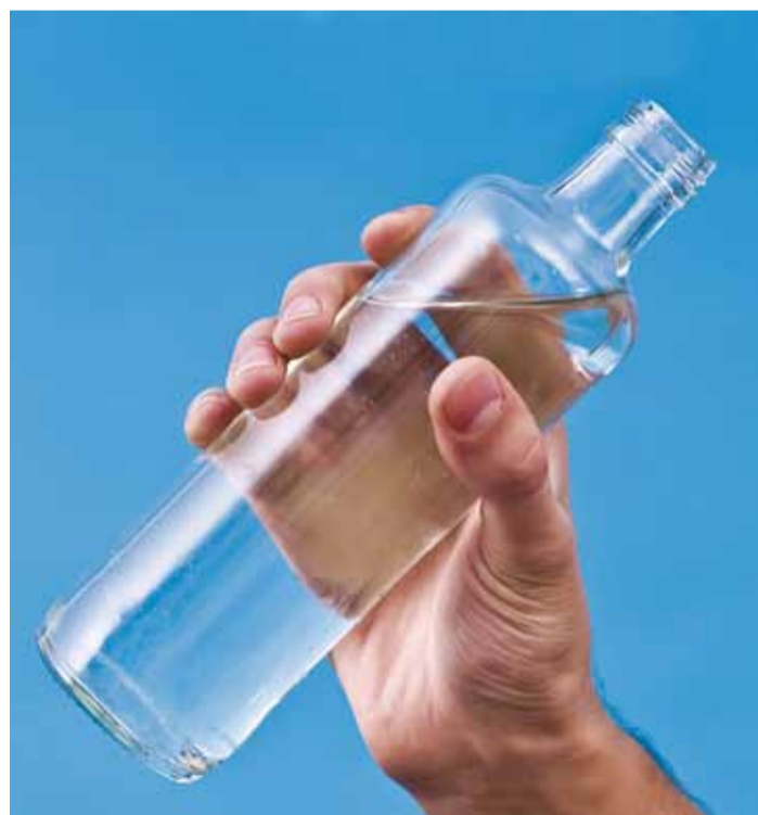
Kõige tervislikum on juua vett.

Kuidas mõjub energiajook kasvavale organismile? Vererõhk tõuseb ja kui veresoone on nõrgemad, võib ka noorukil tugeva pingega korral tekkida insult, mis võib omakorda lõppe-