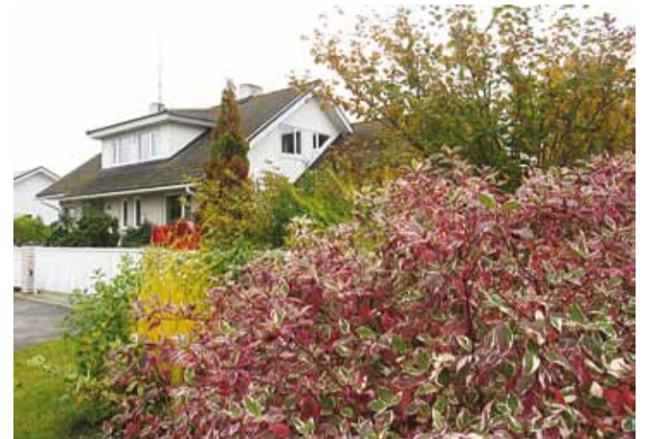
Oktoobris on liigirikaste aedade ja haljasaladega Kelvingi uskumatult värvikas. Esiplaanil kontpuu.

Mõne nädala eest saime lõpuks bussipeatuse Reinu tee