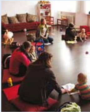
Koolitus aitab endast ja oma lastest paremini aru saada.

Tänu vallavalitsuse ja MTÜ Avituse koostööle on Viimsi emadel ja isadel võimalik osaleda mõnevõrra unikaalsel koolitusel.