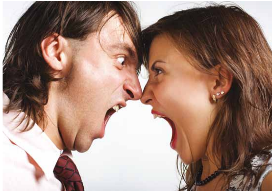
Vanemate tülid ajavad lastele hirmu nahka ja tekitavad süütunnet.

Paljud lapsed on Noraga samas olukorras. See, kuidas lapsed tulevad toime oma tunnetega vanemate lahkuminekuga ajal ja järel, sõltub palju