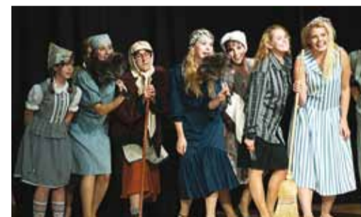
“Aken vastu päikest” – hetk lavastusest.

18.–19. oktoobril toimus Kehra kultuurimajas Harjumaa Harrastusteatri Festival.