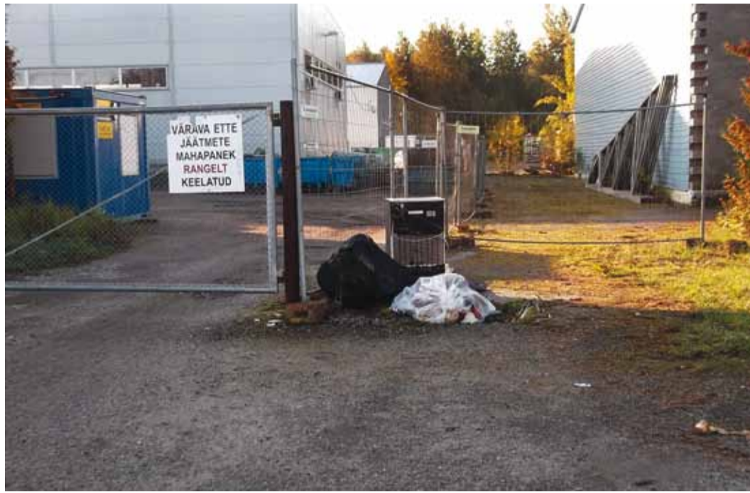
Ikka veel poetatakse prügikotte valesse kohta.

Kuna ükski organisatsioon ei saa tegutseda kahjumlikult, siis selleks, et teenust saaks pakkuda kõikidele soovijatele, on vajalik piisavat hulka teenusega liitujaid. Seega kutsume üles kõiki Viimsi valla külade elanikke liituma pakendikotiteenusega ja aitama sellega kaasa keskkonna paremaks muutmisele.