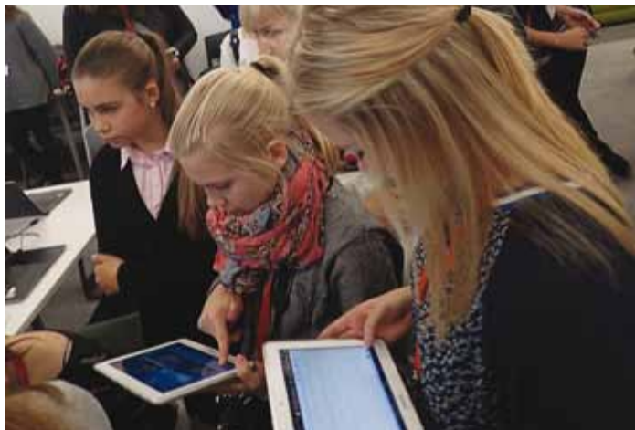
Õpilased raamatumessil artiklit kirjutamas.