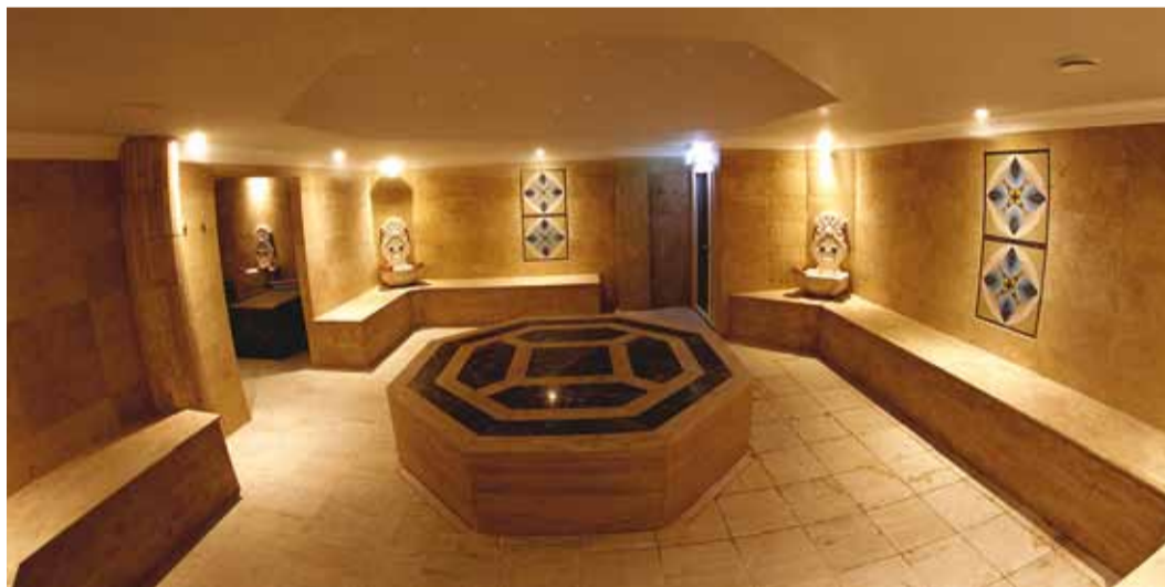
Türgi saun e hamam.