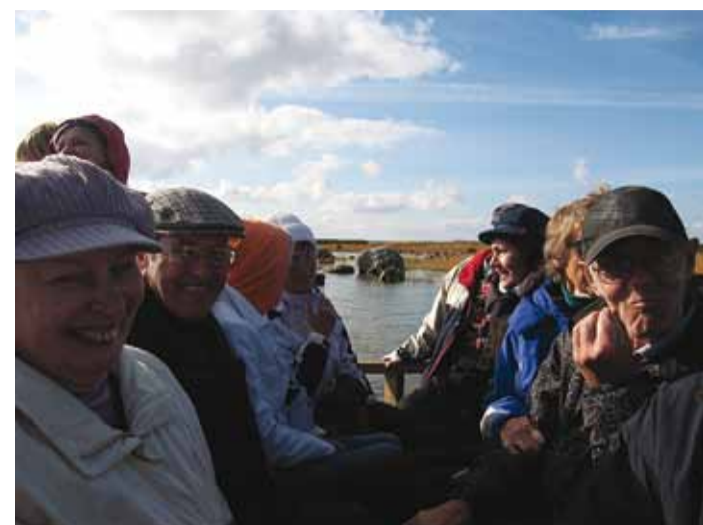
Eriliseks elamiseks oli sõita veoautokastis merevetel.

Kõige armsama kohana jäi- gi meelde väike valge kirik ja kalmuaed, kus pinnast pole püütudki siledaks saada. Sügisel, kui samblal punavad pihlakamarjad, on vaikne kalmistu väga kena. Kalmude vahel nägi