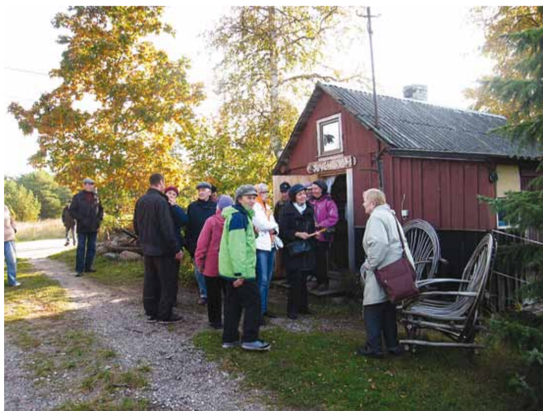
23 reisilist Prangli suveniire valimas. Toreda sõidu korraldas Viimsi Pensionäride Ühendus.

neid on talvisteks poesõitudeks igas peres 4–5 tükki. Adru on siin hinnatud väetis. Rõgeldis on munast, jahust, piimast ja soolalihast panniroog, õige jõulupraad küpsetatakse aga soolatud seapeast. Jõuluõhtul on kirik rahvast täis, muidu käib jutlusel u 7 inimest, õpetaja Kalle Reba-