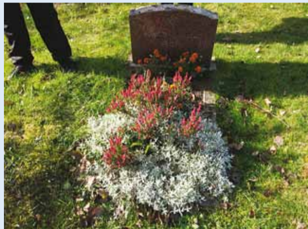
Sügis Prangli kalmistul.