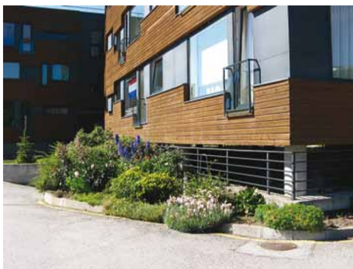
Tammepõllu tee 1 kaunis haljastus.