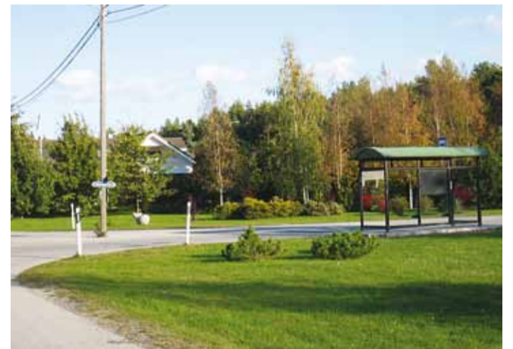
Üks asi, mille üle uhkust tunda: bussipeatus on nüüd ohutus kohas küla lipuplatsi ja lasteaia juures.

äärest külamaja juurde, lapsed pääsevad nüüd ohutult lasteaeda ja koju.