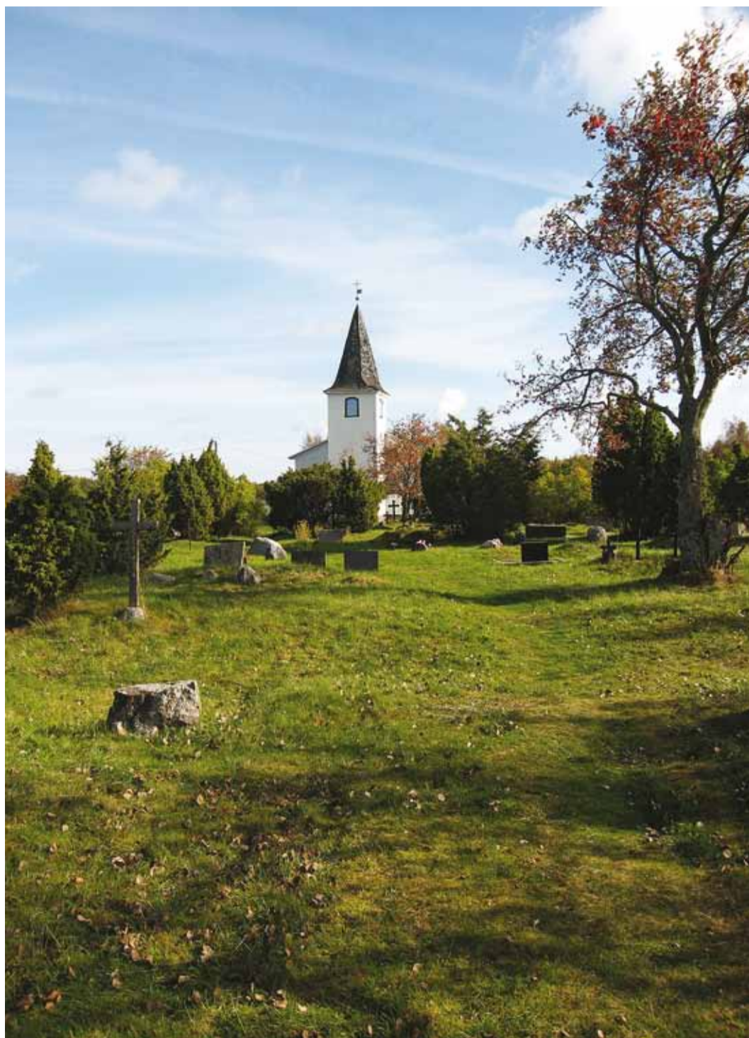
Prangli kirik sai värsket värvikuue juuni alguses.

Pranglil elab püsivalt umbes 70 inimest ja väikese kooli püsimiseks on sinna mandrilapsi juurde võetud. Sissetulekut an-