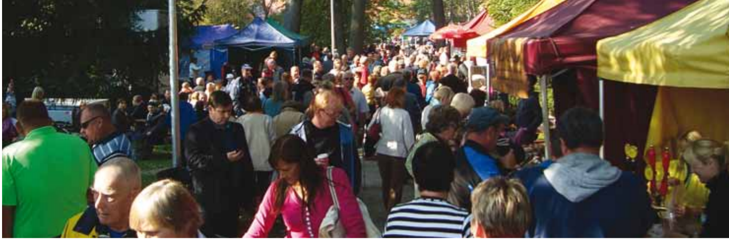
5 km pikkune kaubatänav.