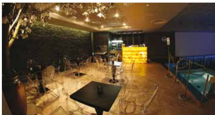
Ka kohvik ootab lõõgastuma.

"Lõpuks ometi..." oli paljude klientide esimene reaktsioon, kui Tallinn Viimsi SPA-s avati uus 18+ spaa- ja saunakeskus. Sauna- ja veemõnusi saab seal nüüd nautida rahus ja vaikus.