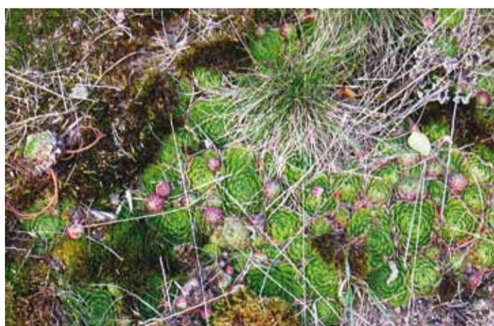
Võsu-liivsiibul. Saare taimekooslustest ja kaitsealustest liikidest saab hea ülevaate 2012. aastal avatud Prangli saarte loodusmuuseumis.