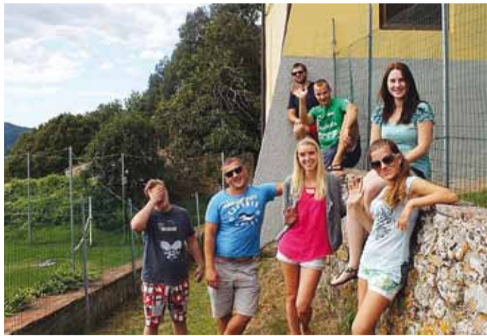
Viimsi noored pärast rahvuslikku õhtusööki.

Projekt raames uurisime noorte käitumist: kuhu meie käitumine viib ja kas on alternatiive tavakäitumistele. Neljast riigist pärit noored pandi mõtlema, kuidas saab olla „lahe“ ja ühiskonnas aktsepteeritud, käitudes massist erinevalt. Kaheksapäevane noortevahetus hõlmas arutelusid noorte käitumismallide üle, keskenduti nähtusele mainstreiming, mis eesti keeles tähendab peavoolu. Miks noored järgivad peavoolu ja