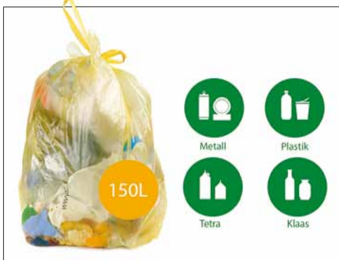
Segaolmejäätmete seast pakendid taaskasutusse ei jõua.

Kes kodust pakendikotiteenust kasutada ei soovi, saab sorteeritud pakendid viia avalikesse pakendikonteineritesse, mis asuvad Viimsi vallas järgmistel aadressidel.