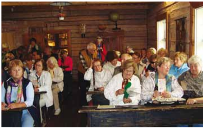
Reisieltskond Tootsi-lugude sünnupaigal.

Palamuse on Tallinnast 180 km kaugusel. Rahvakirjanik Os-