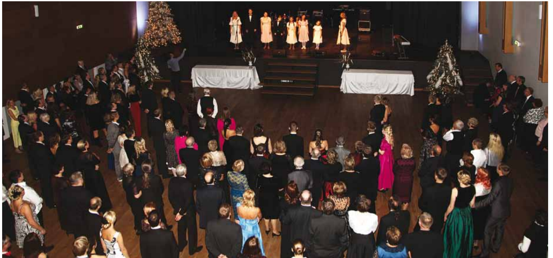
Tänavusel heategevusballil osales üle 400 inimese.

Oleme tänaseni ühingu nagu üks suur pere, kui mure on, siis ikka toetame ja püüame aidata. Peale poja kaotust raskele haigusele tundsin, et olen nende peredega nii kokku