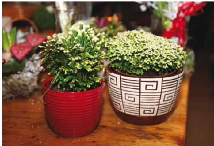
Selaginellil on hele toon juba olemas ja teda pole vaja kunstlumege tappa.

jõulutäht olgu kodumaal kasvatatud! Neis kauplustes müüdi AS Nurmiko ja OÜ Flores Aed jõulutähti.