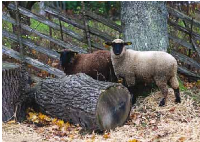
Muuseumi õnnelikud lambad.