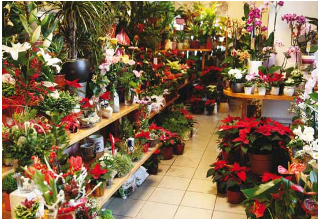
Viimsi Aiapoe külluslikus valikus püüavad esmalt silma ikka punased toonid.

Nii Viimsi Aiapoes kui ka Viimsi Aiakeskuses rõhutati: