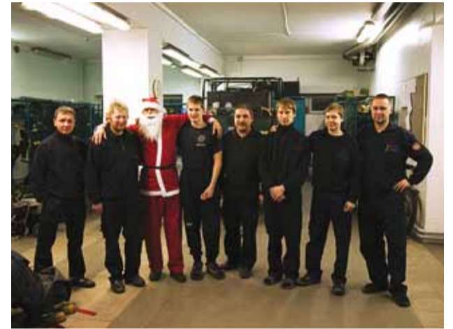
Pirita komando päästjad, kes soovivad teile rahulikke jõule.

Jõulu aeg toob ellu ootusärevust, kauneid hetki ja palju rõõmu. Ollakse koos lähedaste, sõprade ja meeldivate inimestega. Kaminas praksuv tuli teeb olemise mõnusaks, vilkuv küünlaleek lisab hubasust.