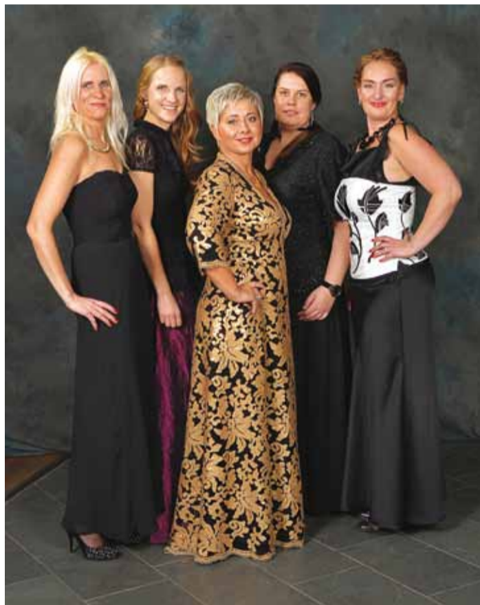
Viis toimekat erivajadusega lapse ema ja heategevusballi eestvedajat.

kasvanud, et otsustasin jätkata. Need toredad inimesed annavadki mulle jõudu ja niikaua, kui näen, et minust natukenegi abi ja tuge on, püüan jätkata. Ma ei tee seda kõike ju üksinda, juhime ühingu viiekesi – meid on viis tubli ema.