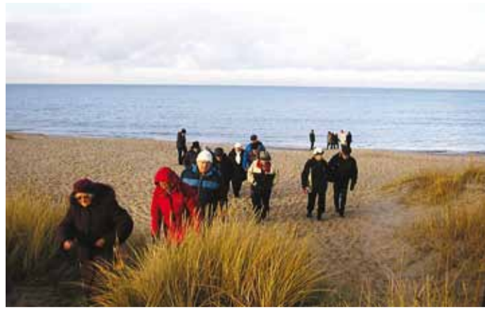
Peraküla rannas.