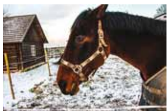
Jõuluuag on hobustele tegus.

Möödub hobuse aasta on toonud seiklusi, natuke segadust meie kõigi ellu. Tervis pole olnud just kõige parem, niiske sügis ajas veidi kõhima. Pidime tegelema ka lõputute kinnisvaraotsingutega, mis ühele hobusele küll väga lakkamööda ei ole. Nüüd oleme leidnud lauda siin Viimsi vabaõhumuuseumis, mere ääres ja tunneme ennast kodus. Soolane meretuul on meie tervisele hästi mõjunud, oleme leidnud palju sõpru ja natuke oleme saanud isegi Viimsi kandis ringi vaadata. Nädalavahetustel käime taluturul ja sõidutame lapsi, isegi kuulsale Armuneemele jõudis üks meist juba pilgu peale visata. Küll seal oli ilus vaade ja krõmpsuv rohi. Pikalt muidugi ei lubatud seal olla, tuli välja, et Viimsis ei tohi hobused üksi ringi uudistada. Vabandame, kui tegime kellelegi tüli – oleme edas-