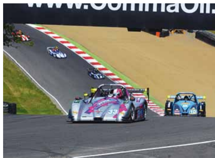
Tristan ja tema radical Valencias.