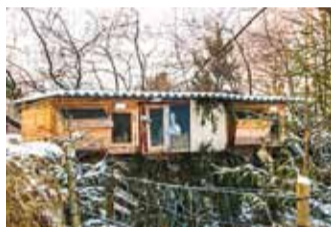
Jäneste uus ja parema vaatega kodu.

Vaatame siin seda ilma ja inimesi juba mitu aastat