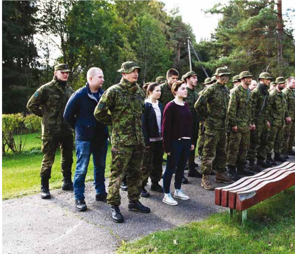
Aitäh kõigile osalejatele, korraldajatele, juhendajatele! Fotol raja läbinud võistkonnad.