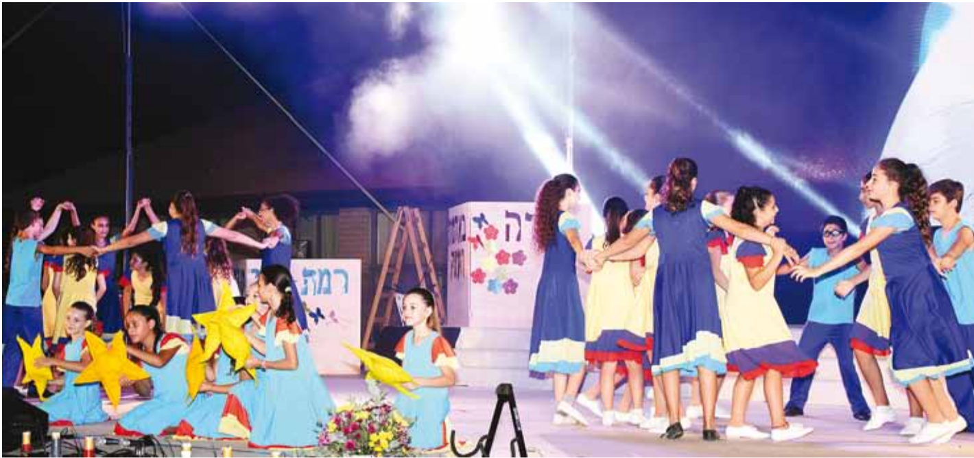
Hetk Ramat Yishaile pühendatud vabaõhuetendusest.