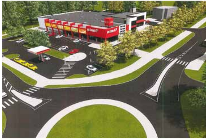
Kaubanduskeskus valmib 2016. aasta juuniks.