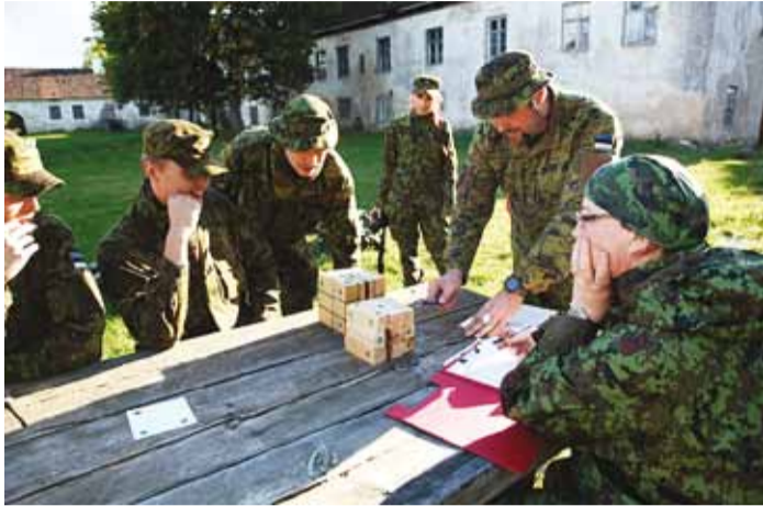
Juliet: Kui hea on meeskonnatöö?

Võistlejate kohustuslik isiklik varustus: võistkondadele eraldusmärkidega välivorm (vormi juurde kuuluvad poolsaapad või kummikud ning peakate), rakmed või seljakott, välipudel või joogikonteiner, kompass, taskulamp + varupatareid, tuletegemisvahendid, tääk või puss, individuaalne esmaabipakend, toit 35 tunniks, telk- või vihmamantel või vihmaülikond, tabelvarustuse automaat- või poolauto-