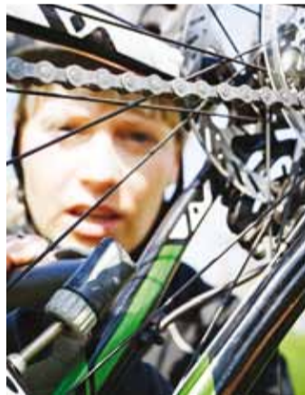
Õlita kett!

loputa ratas veega ja kuivata põhjalikult.