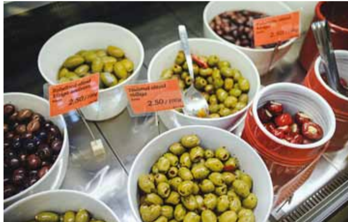
Täidetud oliivid, kuivatatud puravikud ja tomatid... Viimsi Keskusest leiab kõike!

kiita siinset teenindust, mis on väga professionaalne ja meeldiv. Teenindaja suudab kiirelt ja oskuslikult anda soovitusi ning räägib iga joogi kohta põhjaliku taustainfo. Seekord lan-