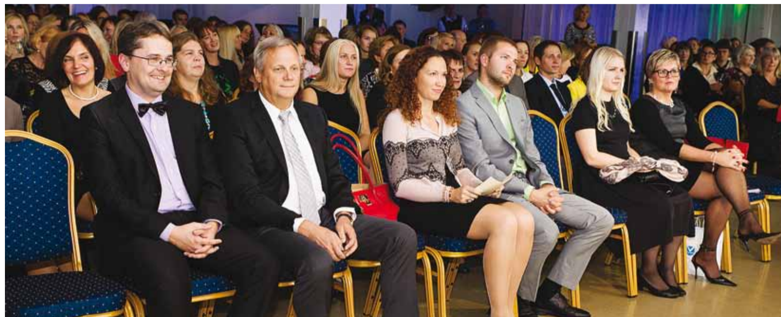
Tänavusel vastuvõtul osales üle 300 haridustöötaja. Fotol õpetajad koos vallavalitsuse, volikogu ning noorsoo- ja haridusameti esindajatega.