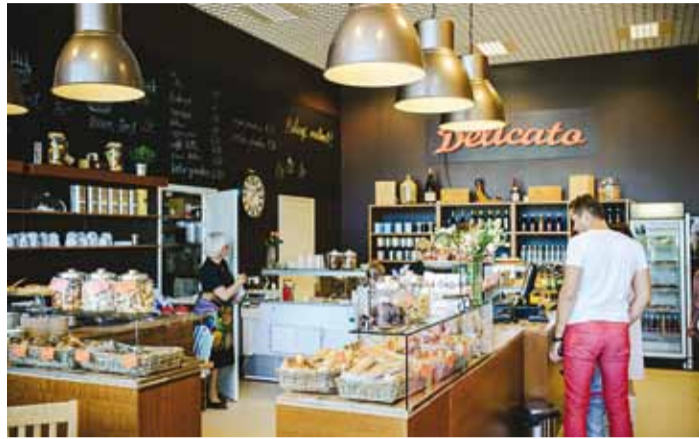
Delicato kookidest ja küpsetistest on raske keelduda.

Kuigi Viimsi toidukohtade valik on viimaste kuudega oluliselt suurenenud, on aeg-ajalt tore ka koduseid pidusid korraldada ning sõpru ja pereliikmeid põnevate toitute ja jookidega üllatada. Läksime selle mõttega augustis avatud Viimsi Keskusesse ning uurisime, milliseid hõrgutisi sealt kodusele gurmeepeole valida saab.