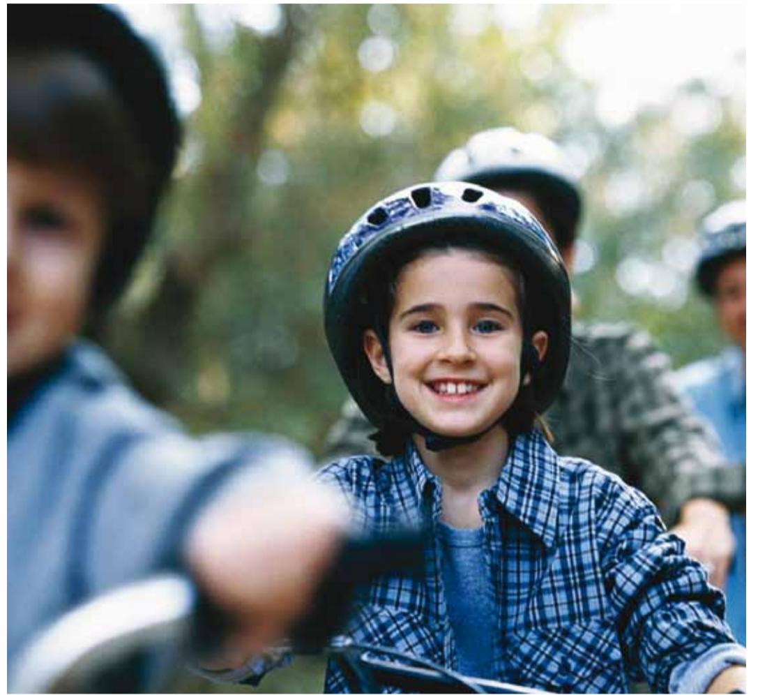
Turvalise rattasõidu tagab vastavalt nõuetele kinnitatud kiiver.

Sama oluline kui turvatooli või turvahälli kinnitamine, on lapse kinnitamine toolis või hällis rihmadega. Kuna turvatooli ja turvahälli rihmad ei tõmbu avarii korral ise pingule nii nagu auto turvavöö, on oluline, et need oleksid eelnevalt piisavalt pingutatud. Kui lapsel on talveriidid seljas, tuleb võimalusel jope seljast ära võtta või kombineerida lukk lahti teha, et saaks rihmad panna võimalikult keha lähedalt. Paksude talveriiete ja korralikult pingutamata rihmadega võib laps avarii korral turvahällist välja paiskuda. Kui imikut turvahällis on lihtne tugevamalt kinnitada, siis suuremad lapsed, kes turvatoolis istuvad, võivad protesteerima hakata, kuna pingul rihmadega ei saa nad end nii palju liigutada kui tahaksid. Vahel võib liikluses näha vaatepilti, kui turvatoolis istuv laps on õlarihmad üle öla