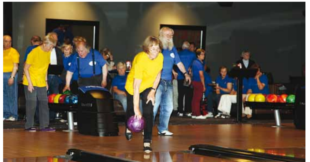
Aitäh kõikidele kuuliveeretajatele ning kohtumiseni järgmisel aastal!

Rändauhinna viis koju Pirita võistkond, II kohale tuli Viimsi Pensionäride Ühenduse võistkond ja III koha saavutas