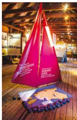
Näitus "Stopp! Piiritsoon!" saab veel enne talvepuhkust näha oktoobri keskpaigani.

Lõpetuseks üks romantiline lugu piiritsooni ajast.