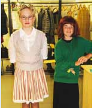
Uued ja nooremad õpetajad.

Kui tavapäraselt oleme harjunud, et õpetajate päeval on uues ametis 12. või 9. klassi õpilased, siis Haabneeme Kooli juhtisid ühel päeval kuuendikud.