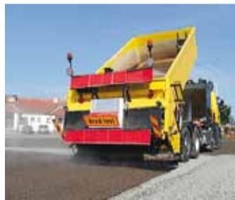
Pindamine Leppneeme sadamas.

Teekatte märgistustöid teostati kogumahus 528,17 m 2 ning need läksid maksma kokku 6800,04 eurot. Tööde käigus uuendati ülekäiguradade märgistust, telgjooni, erimärgistust, teedele kanti kiirusepiiranguid ja hoiatusmärgistust. Mitmed jalg- ja jalgrattateed, kus varasemalt puudus ülekäigu kohta märgistus, said täiesti uue mär-