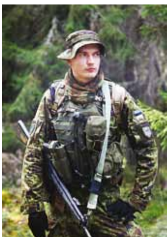
Rada on poole peal. Võiduka lõpuni!

Raadiosaatjast kostuv sõna "all" annab mõista, et meie viimane laskuja on kohal.