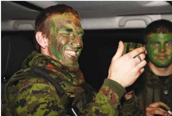
Grimmibuss enne varustuse kontrolli.

maatrelv koos salvaga (välja arvatud noortel), komplekt kõrvatroppide (välja arvatud noortel).