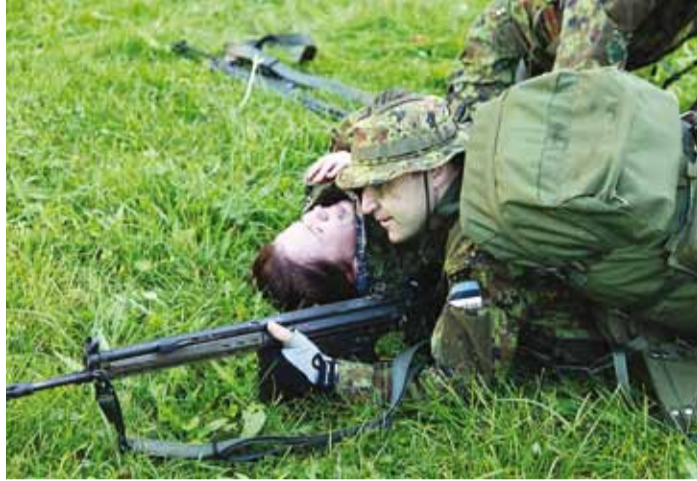
India: Ta on haavatud, teine võitleja on šokis, oleme rünnakus...

ja õde – alguse saab kandade, taldade ja varvaste plaasterdamine. On tunda, et hetkel saavad poisid nägudele naeratusel läbi valu ja ebamugavustunde.