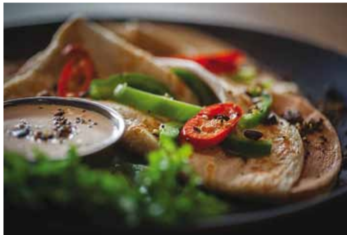
Aasia hõngulised pannkoogid on võitnud juba paljude südamed!