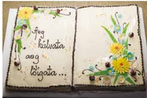
Aeg külvata, aeg lõigata... Ilusat käimasolevat õppeaastat!

Tänavune Viimsi valla pidulik haridustöötajate vastuvõtt toimus õpetajate päeval 5. oktoobril Tallinna Lauluväljaku klaassaalis. Vaata ka lk 1.