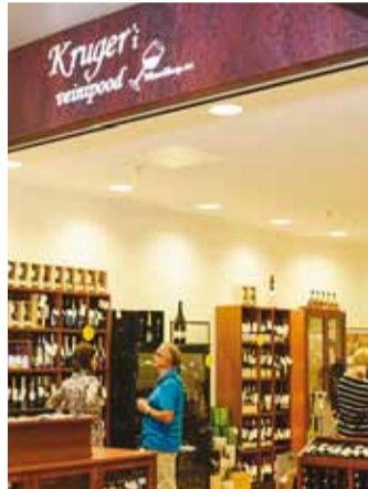
Kruger'i veinipood on kolinud gurmeemekasse.

Inimestel on jookide osas erinevad eelistused ning seetõttu täiendame valikut Kruger'i veinipoes. Kõigepealt tuleb