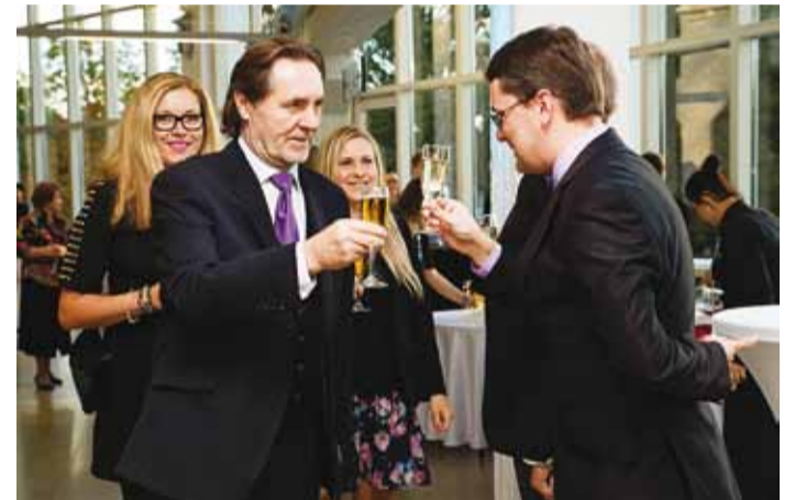
Aitäh kõikidele Viimsi haridustöötajatele!