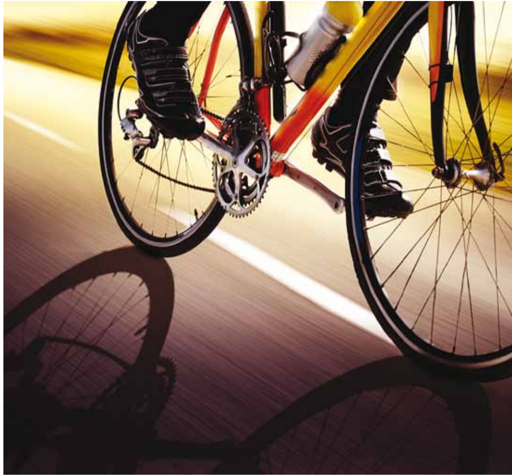
Enne ratta talvekorterisse paigutamist tuleks mitmetele pisisjajadele tähelepanu pöörata.

Kõigepealt tuleks ratas voolikust tuleva kerge surveveega puhtaks lasta ja seejärel harjaga suurema pori eemaldada. Peale seda soovime ratta švami ning sooja vee ja Fairy lahusega puhtaks pesta, lasta mõned minutid seista ning seejärel voolava veega ratas loputada. Järgmisena võiks harja või pintslit abil eemaldada keskjooksu juurest, hammasarastelt, ketilt ning teistelt pisidetailidelt kinni jäänud mustuse. Lõppviimistluseks