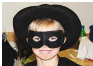
Kostüümid tegid muinasjutuõhtu veelgi põnevamaks.

Reede õhtu oli Püüsi sagimist täis – kooli poole ruttasid kurjad hundid, head haldjad, punamütsikesed ja paljud teised muinasjutukangelased. Õpetajad tegid veel viimaseid ettevalmistusi vahvate töötubade ülesseadmiseks. Õhtu alguseks koguneti au-