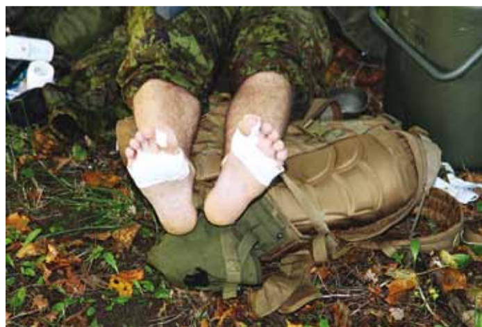
Varvaste, jalataldade ja kandade plaasterdamisega tegelesid võistlejad ja meditsiiniõde ning -sanitar.