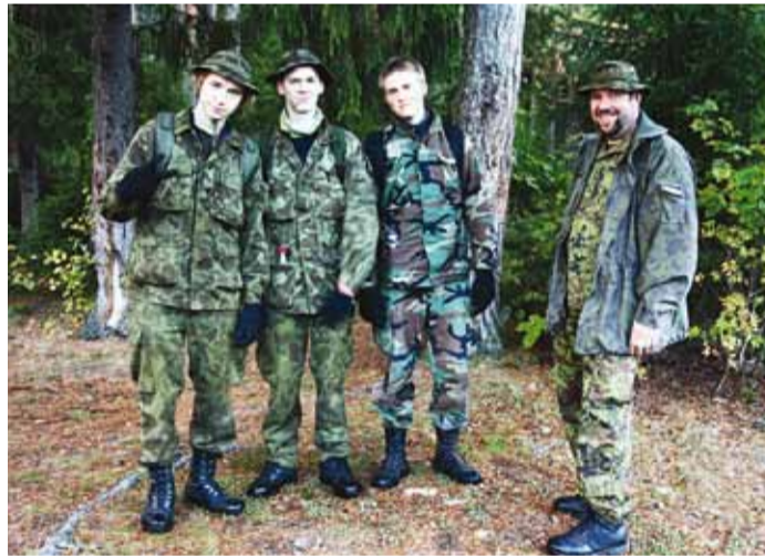
Noorkotkad viimases punktis koos kaitseliitlastest juhendajaga.

Peale iga VST lahkumist tekib meil küsimusi, kiitumisi ja pikka arutelu. Korraldame fotosessioone ning loomulikult noormeestega naljast puudust ei tule.