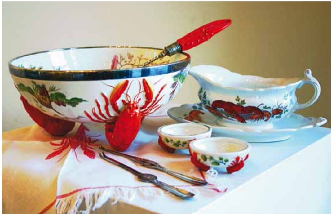
Kalad poseerivad nõudekapis veel kuni 15. novembrini.

Kes näitusele ei jõudnud, aga teema huvitab, siis muuseumi poes on veel alles pool-sada "Stopp! Piiritsoon!" raamatut, kuid arvestama peab, et tiraaž müüakse varsti läbi.