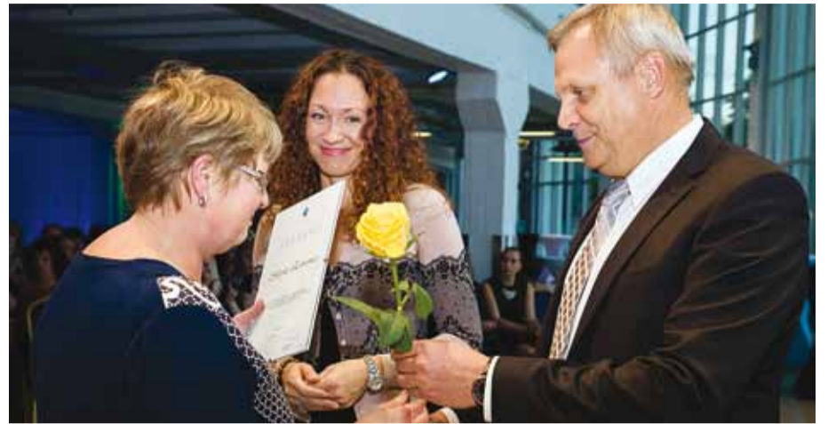
Kõik õpetajad on Viimsi valla haridusmaastiku väärtus. Tänavu tunnustati pikaajalise töö ja kooliellu panustamise eest 25 õpetajat.