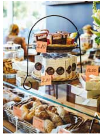
Tervisliklikud croissantid, küpsised...

Sissepääsu juures asuv Delicato tõmbab juba magnetina oma külluslike koogilettidega. Erinevad maitsekalt kaunistatud juustukogid ja pirukad on tuttavad ilmselt paljudele viimsilastele. Siit leiab ka mitmesuguseid soolaseid suppeid – näiteks maitsevõidid päikesekuivatatud tomatite või hoopis basiiliku ja seederänniseemetega, erinevate täidistega oliive või paprikaid. Väga isuäratavad paistavad kohapeal valminud värsked pestod. Jookidest jäävad silma Jaanihanso traditsioonilisel champagne-meetodil pudelis kääritatud siidrid – ikkagi kodumaine kraam ning on ju sügis õige aeg Eesti taluõuntest valmistatud jookide mekkimiseks.