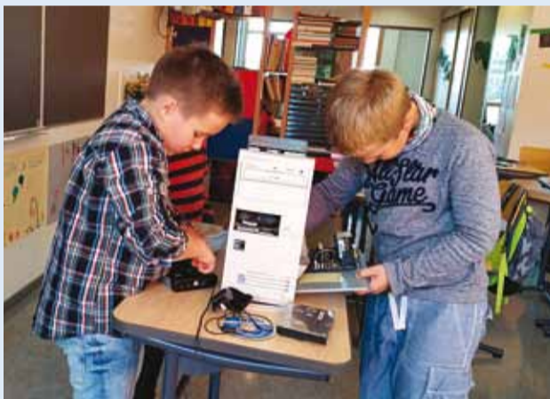
2c õpilased arvuti sisemaailmaga tutvumas.

Viimsi Koolis andsid õpetajate päeval tunde 65 lapsevanemat/külalisõpetajat.