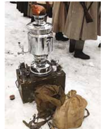
Sõda läks lahti keset igapäevaseid toimetusi.