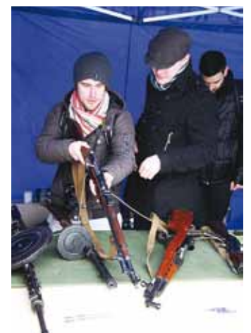
Mitmed relvad olid toimunud näitusel esmakordselt Viimsis.