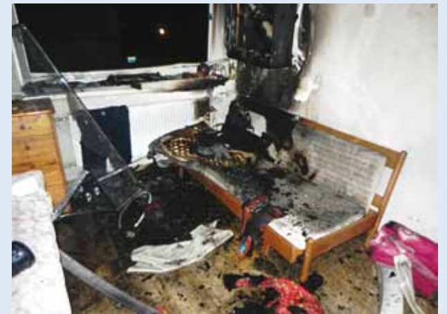
Tuli võib hävitada kodu.