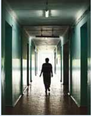
Abi tuleb otsida enne kui hilja...

Teismeliste uimastisõltuvusele tuleb tähelepanu pöörata ning kohe abi otsida.