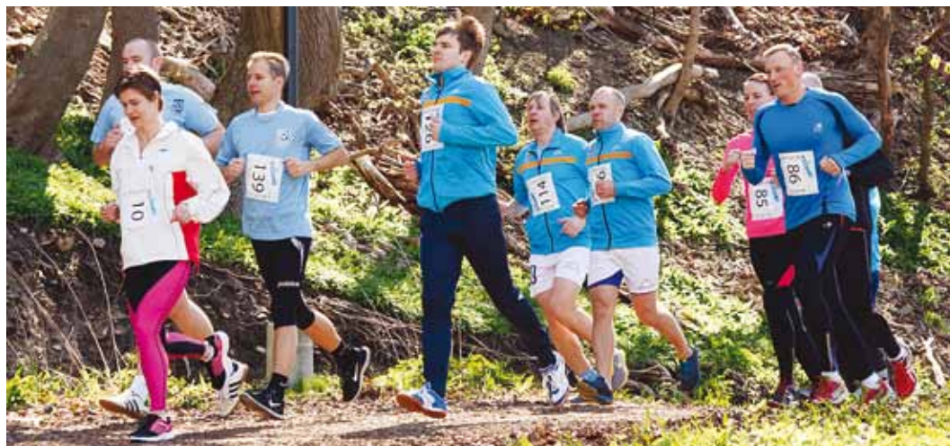
Seekordsel Viimsi Jooksul on distantse kolm: maraton, poolmaraton ja 10 km, lisaks lastejooksud.

Mai keskpaik on Eestis tavaliselt soe ja päikeseline ning loodus oma täies ilus õitsele löönud. Jooks kulgeb nii Viim-