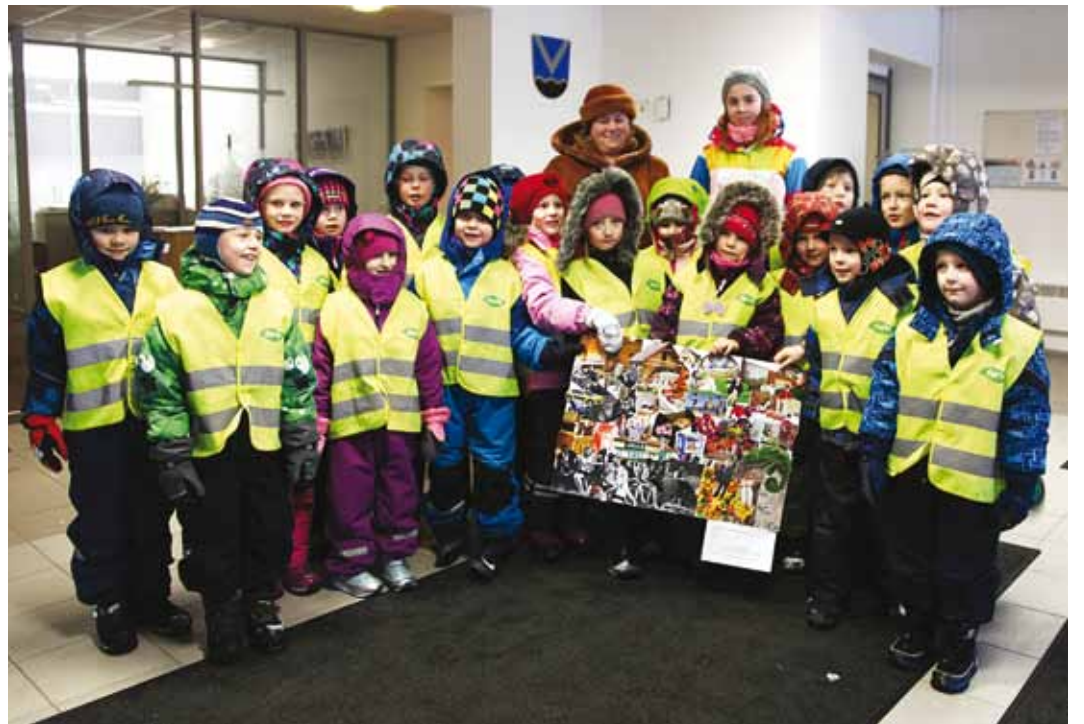
Pargi lasteaiarühm tõi kunstitööd kohale üheskoos.