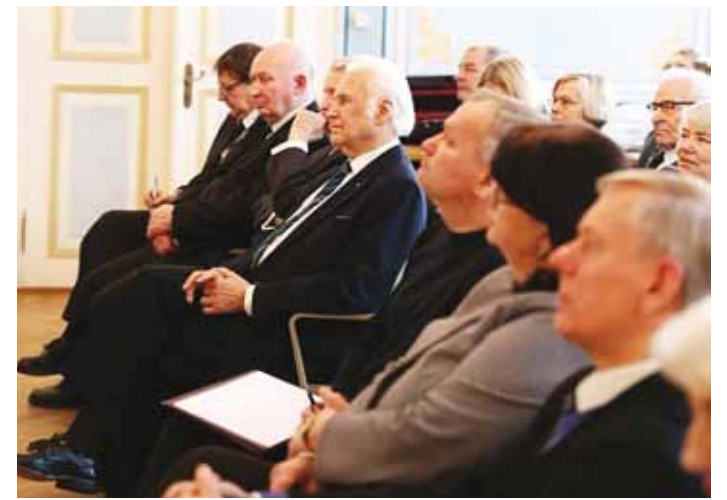
Mälestusloengut oli kuulama tulnud u 70 inimest.