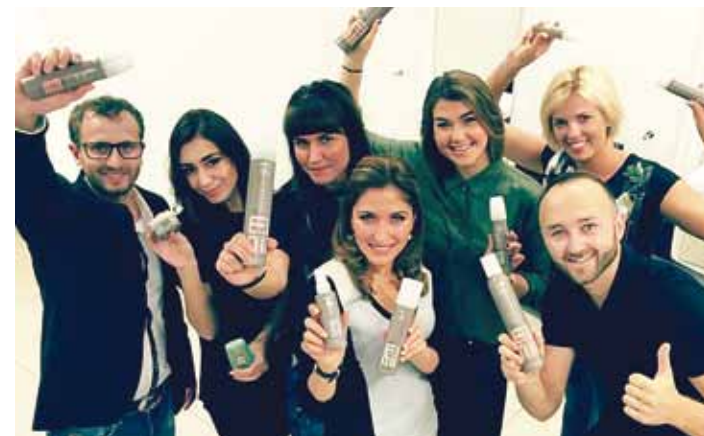
Professionaalsed juuksurid hoolditavad teie juuste tervise eest.

Pärast pikka talve kingivad juustele tervist ja jõudu teatud protseduurid, millega võite end hellitada. Regulaarselt MAKE YOUR I.D. ilusalongi külastades on teie juuksed juuksuri hoolditava ja tähelepaneliku kontrolli all ning ta märkab iga