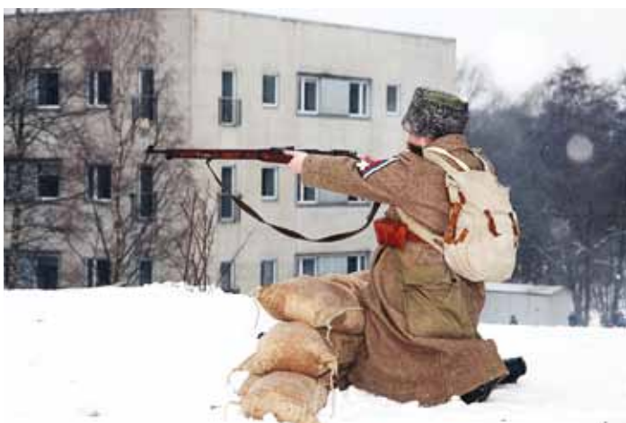
Üks kõigi, kõik ühe eest!