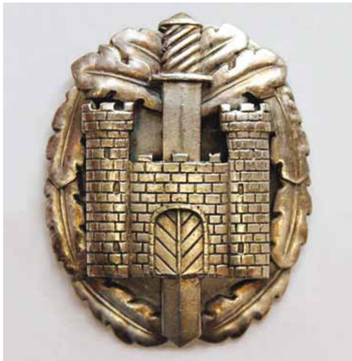
Rävalla malevkonna teenetemärk.

Kaitseliit oli ka Eesti Vabadussõja ajal kõige suurem sõjaline organisatsioon. Vabadussõja lõppedes hakkas sõjaaegne tugev Kaitseliidu organisatsioon lagunema. Isamaaliselt meelestatud kodanikud tahtsid Kaitseliidu organisatsiooni säilitada ning kujundasid Kaitseliidu asemele kütirühmad ja spordisalgad. Neile jäid relvad kätte. Kütirühmad tegutsesid kuni Kaitseliidu uuesti ellu kutsu-