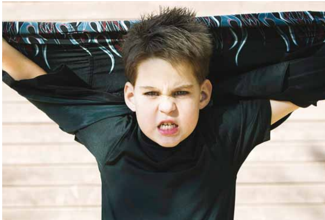
Konkursi auhindadeks on kolm ekstreemkaamerat ja hulk eriauhindu.

tis alaliselt elavad noored vanuses 7–18.