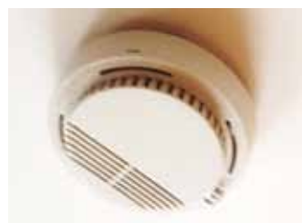
Kontrolli, kas suitsuandur ikka on töökorras. Foto Meedium

Igas majapidamises peab olema tuleohutuse tagamiseks suitsuandur ning turvalisuse tagamiseks tuleks anduri korrasolekut kontrollida.