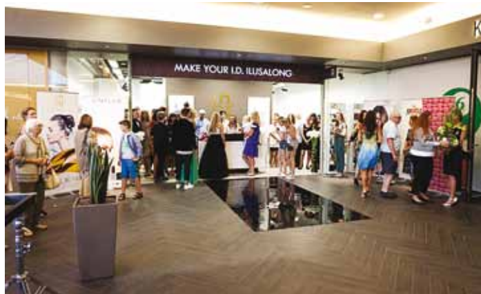
MAKE YOUR I.D. ilusalong.

võib olla ükskõik milline, olenevalt inimese soovist, tema näo omapärasest ja juuste seisukorrast.