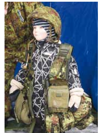
Kõik soovijad said kanda nii rakmeid kui ka kiivrit.