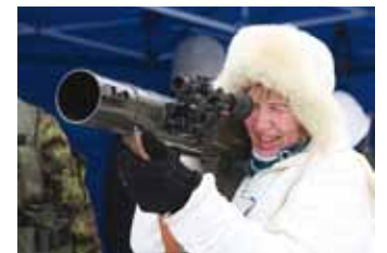
Rootsi päritolu raske tankitörjegranaadiheitja Carl-Gustav.