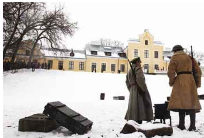
Tänavusel näidislahingul oli üle 2000 pealtvaataja.