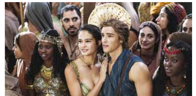
"Egiptuse jumalad" – Seti ja Horuse lugu.