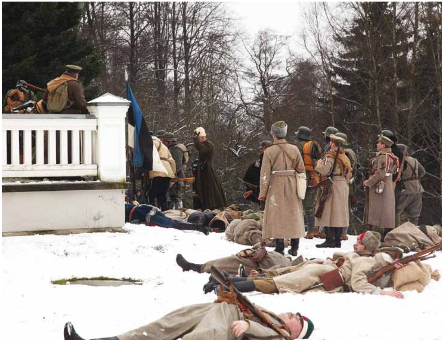
Kokku osales näidislahingus sadakond võitlejat.

Kaitseliidu Harju maleva Rävala malevkonna relvastuse ja varustuse näitusel oli kõigil soovijatel võimalus tutvuda ajalooliste ja täna kasutuses olevate relvadega: kuulipilduja DP 27, püstolkuulipilduja Suomi KP/-31, vintpüss Mosin-Nagant,