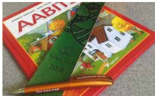
Tere tulemast kooli!