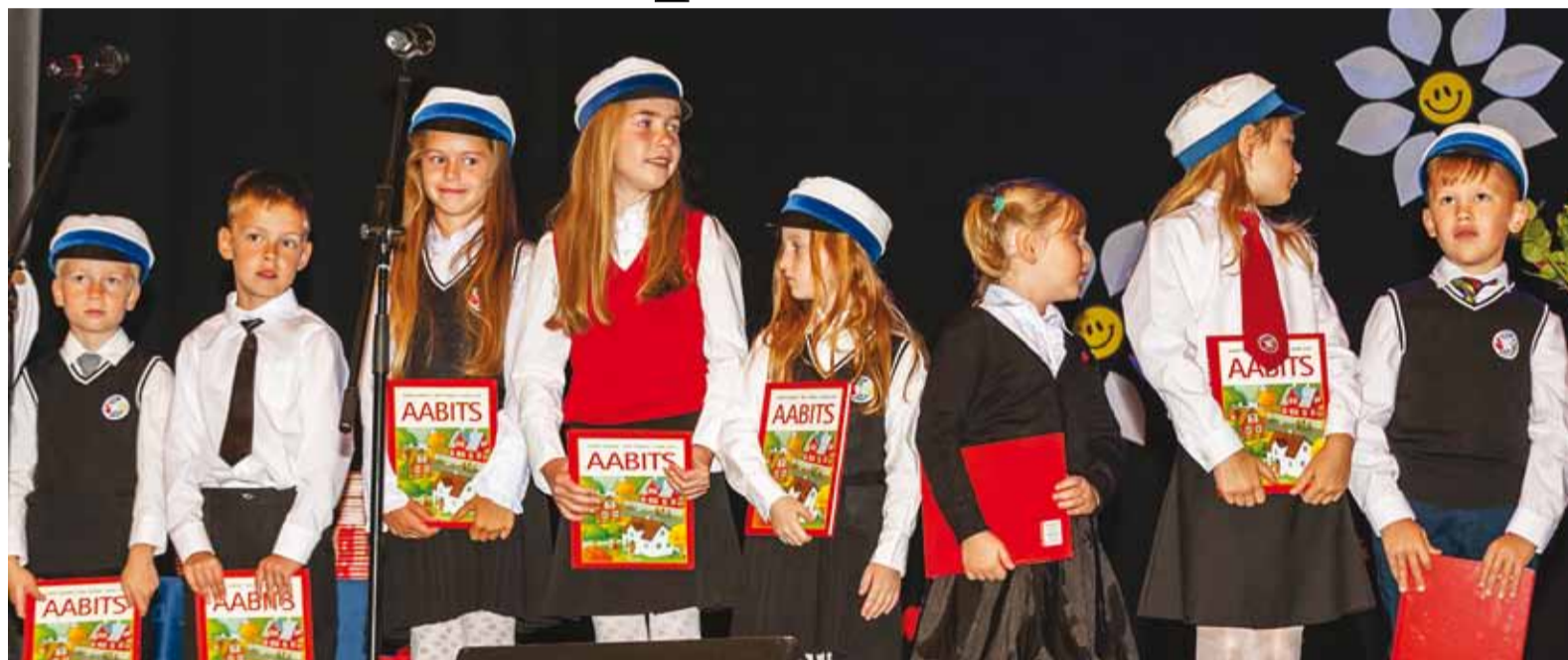
Sel aastal alustas Viimsis kooliteed 316 esimese klassi õpilast.