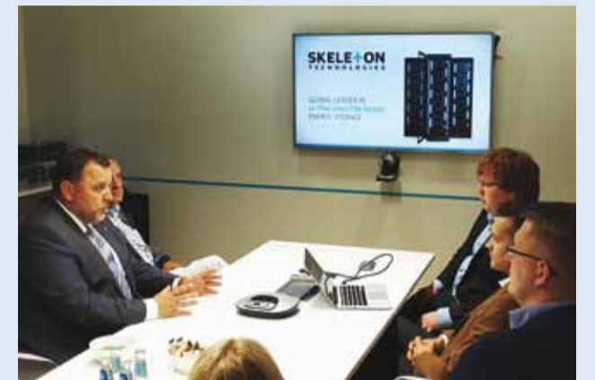
Rahandusminister kohtus visiidi käigus ka Lubja külas asuva Viimsi ettevõtte Skeleton Technologies esindajatega.

31. augustil külastas Viimsi valda rahandusminister Sven Sester. Kutsujaks oli Viimsi vallavalitsus. Kohtumisel räägiti valla finantsvõimekusest (investeeringud ja laenukoormus, maksukoormus, tulubaas tulumaksust jne) ning minister külastas ka Viimsis asuvat ettevõtet Skeleton Technologies.