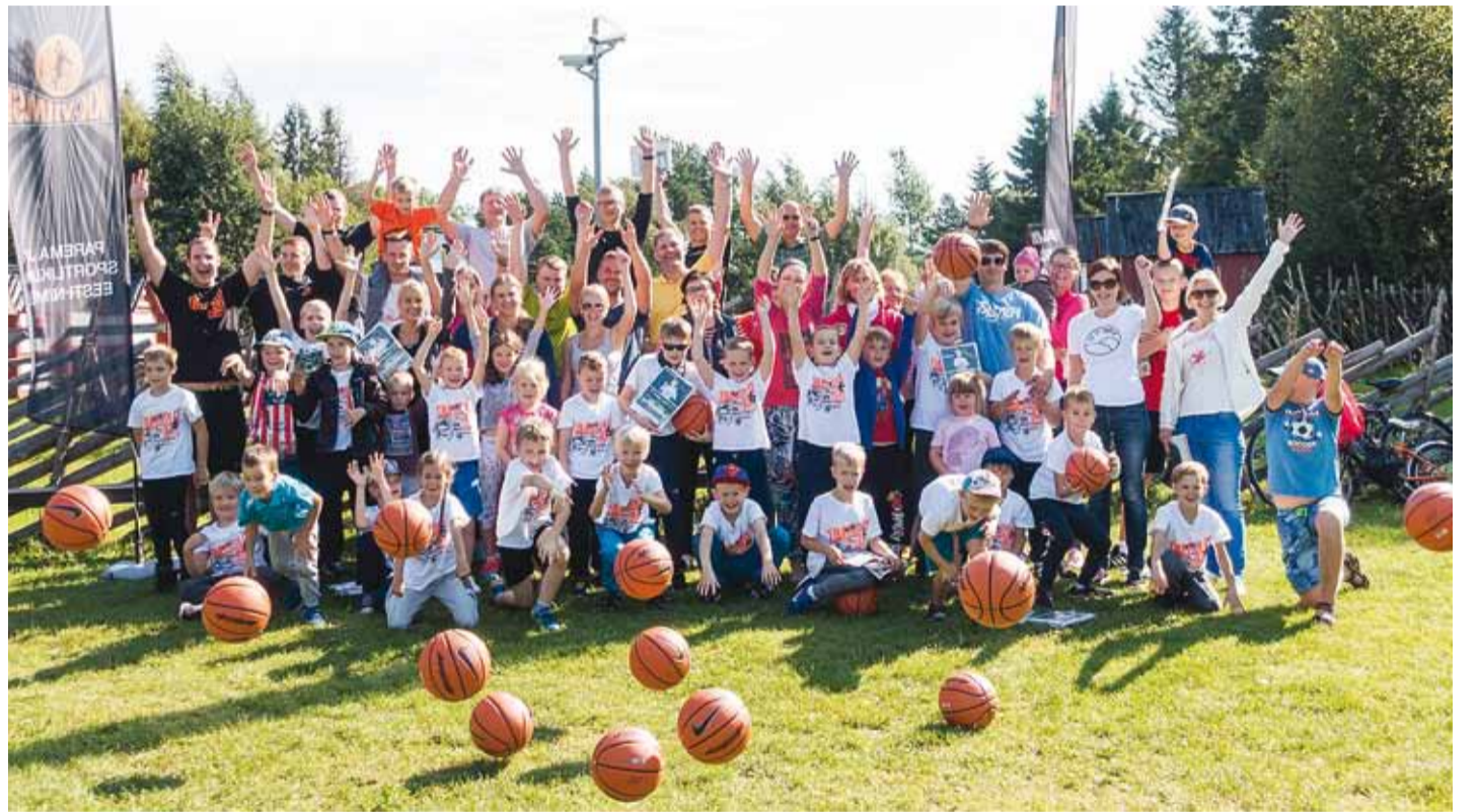
Aitäh kõikidele osalejatele ja kohtumiseni järgmistesse laagrites ja trennis!