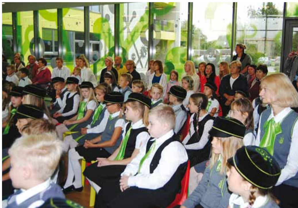
Hetk Randvere Kooli aktuselt.

1. septembril alustas Viimsi valla 1. klassides kooliteed rekordarv õpilasi – 316 (eelmisel õppeaastal 279). Kokku läks Viimsi koolidesse 2435 õpilast (2015. aastal oli õpilasi 2258).