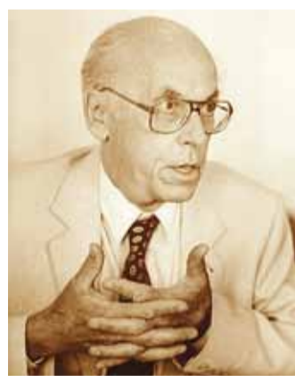
Lennart Meri.

Preemiaga soovib vald eelkõige tunnustada isikut, kes on omandanud magistrakraadi* ja koostanud silmapaistva uurimustöö (magistritöö) humanitaarteaduste valdkonnas ning on (või on olnud) seotud ka Viimsi vallaga. Preemiale võib kandideerida humanitaarteaduste valdkonna magister, kes on magistrakraadi omandanud kandideerimisele eelneva kahe kaalendriaasta jooksul. St kui taotlus preemia maksmiseks esitatakse detsembris 2016, lähivad arvesse magistratööd, mis on kaitsitud 2016., 2015. või