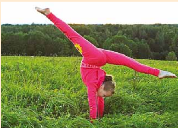
Tantsuklubist saab hea painduvuse, häid sõpru ja vahvad treeningud.