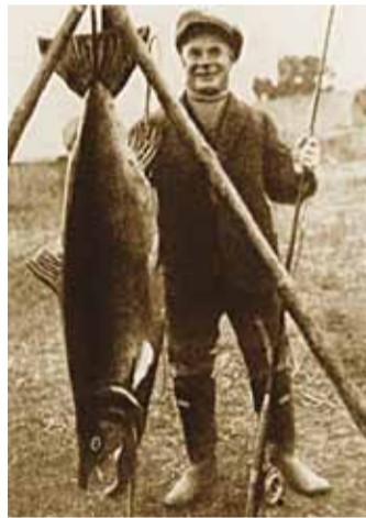
37,75 kg kaaluv rekordlõhe püüti 1938. aastal.

m/s) kruusase põhjaga alad – käreistikud. Isased kalad tõusevad koelmutele varem, võideldes parimate kohtade eest ja kaitstes neid sissetungijate vastu. Hiljem saabuvad emaslõhed, kes valivad sobiliku kudemispaiga. Tugevate sabalöökidega kaevab küljele kaldunud emaslõhe jõe põhja pesalohu, mille sügavus ulatub 30 sentimeetri ja pikkus paari meetri. Emas- ja isaskala ujuvad kõrvuti pesalohu kohal: emane poebab sinna 5–6 mm läbimõduga marjaterad, samal ajal laseb isane veevoolul kanda marjale niisa. Neil sekundeil mari viljastatakse ja saab alguse uus elu. Kohe katab emaskala