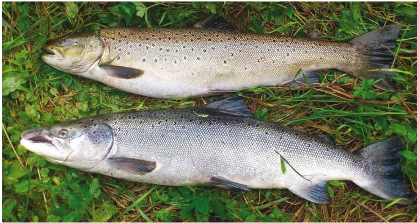
Lõhe, lõhi, lohe, laks muutub looduslikult järjest haruldasemaks.

Lõhede puhul on tähelepanuväärne see, et iga lõhe pöördub kudemise tagasi oma sünnijõkke. See on lõhedele iseloomulik ning pärilik ja Läänemeres tervikuna eksib vaid kaks protsenti lõhedest valesse jõkke. Jões sobivad kudemiseks kiirveoolulised (mitte alla 0,5