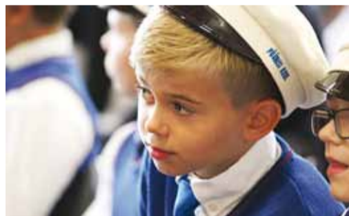
Püüsi Koolis esimene koolipäev oli ootusärevust täis.