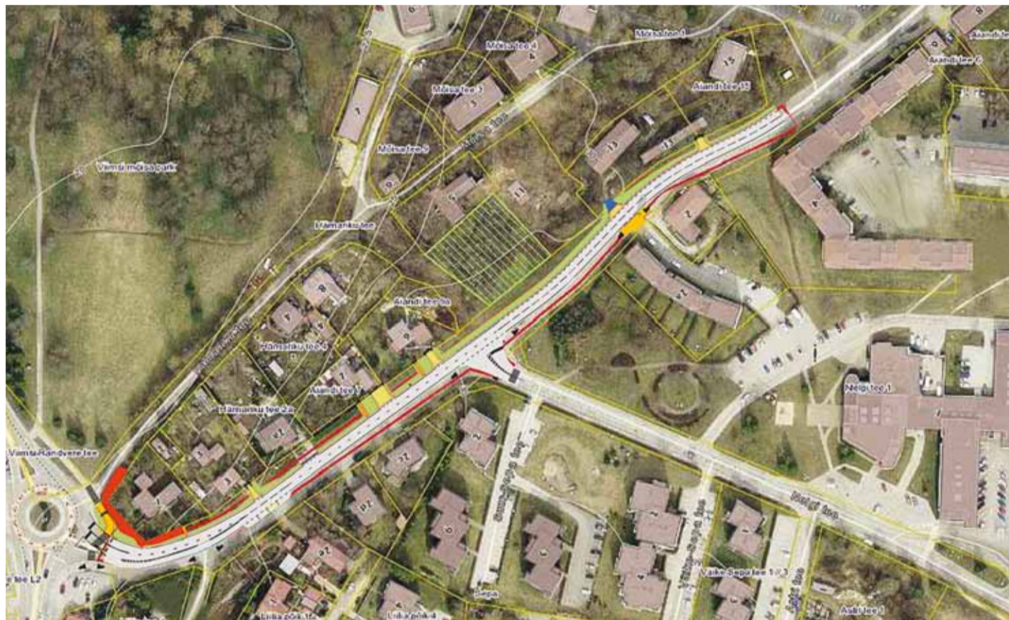
Septembri lõpus algab Aiandi tee algusest 407 m pikkune taastusremont. Kaart Maa-amet

Valla bussiliin V5 on suunatud ümbersõidule mõlemal sõidusuunal marsruudil Rohuneeme