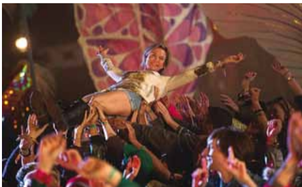
Bridget Jones (Renee Zellweger) seikleb taas: ta on lõpuks saavutanud oma ideaalkaalu ning naudib täiel rinnal üksiolemist.

Kes aga toimekat noortekoomuskit soovib, siis neile peaks ideaalselt sobima jant nimega "Nurjatud noored". See on lugu pundist nohikutest, kes otsustavad oma viimase ülikoolisuve veeta kui tõelised peoloomad. Nagu arvata võib, piinlikest hetkedest filmis puudust ei tule.