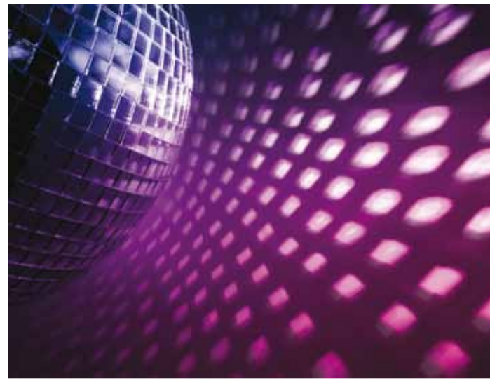
Kas teistel taevakehadel leidub elu? Foto Fotolia

Koolimaja muutub tõeliseks teadusasutuseks, kus on