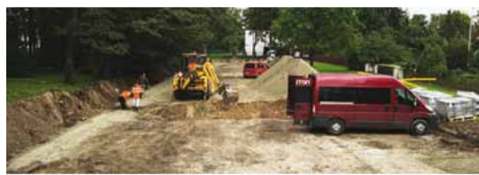
Rannaäärne Lepa tee parkla saab uue ilme ja sinna tuleb kohti 73 autole.

Augusti lõpus algasid Haabneeme alevikus Lepa teel parkla