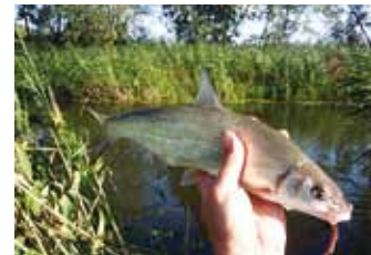
Vimb elab väheses soolsusega rannikumeres ning siirdub kudema jõgedesse, aga osa neist on ka puhtalt mageveekalad.

Eestis elutseb kahte sorti vimbasid. Ühed elavad väheses soolsusega rannikumeres ning siirduvad kudema jõgedesse,