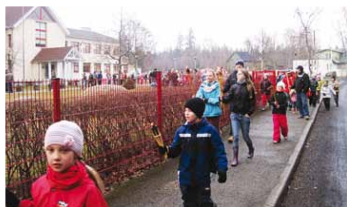
Püüsi küla tänavatele ja metsa on orienteerumisele oodatud kõik!

Lisame jalutuskäigule särtsu. Lisaks kõndimisele võtame kaarte kaardid ja asume ümbruskonda avastama orienteerumise abil. Sündmuse eesmärk on ärgitada kõiki kogukonna liikmeid liikuma, tutvustada orienteerumise võlusid professionaalse korralduse ja abivahendite abil, tutvustada Püüsi küla ajalugu (punktides asuvad kü-