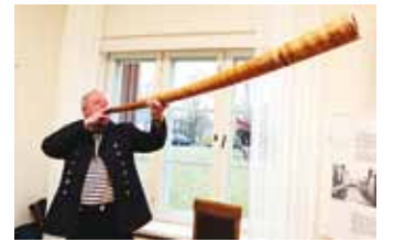
Sarve puhuja andis teada, kui uus kõneleja esile astus.

Üle Soome lahe on sõidetud iidsetest aegadest alates – hülgekütid liikusid piiritutel jääväljadel, teisele rannale sõideti kala püüdma ja leivavilja tooma. See oli randlaste sajandite pikkune rutiin. Teisel pool lahete sõlmiti sõprusuhteid, seal asuti tööle ja abielluti. Oli ka põgenejaid. See kõik kõlab usna tänapäevaselt ja ajalookiiksuga inimene võib ohata: pole midagi uut siin päikese all! Me ei tarvitse seda otseselt tajuda, kuid sajandite pikkuste kontaktide jäljed püsivad meile endalegi märkamata keeles ja kohanimedes, kommetes ja väärtus-