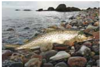
Meriforelli kehal on palju tähne, suu ulatub silmast tahapoole.

Meriforelli keha on pisut järsakam ja sabavars jämedam kui lõhel. Seljauim on tal tähtiline, suu ulatub silmast tahapoole. Ka meriforelli kehal on rohkesti tähne ja neid ka küljejoonest allpool, aga lõhel on vähem tähne ja need paiknevad valdavalt küljejoonest ülevälpool. Meriforelli sabauime serv on tavaliselt sirge või kumer, lõhel nõgus. Meriforelli pulmarüü on võrreldes teiste lõhilastega tagasihoidlik. Nagu paljudel lõhilastel, tekib isastel alalõuale konksjätke, kuid erinevalt paljudest teistest su-