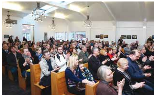
Jääääre kontsert Lennart Meri mälestusüritusel haaras kuulajad kaasa.