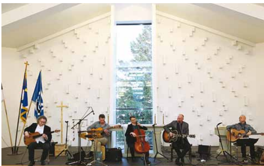
Ansambel Jäääär, keda president Lennart Meriga seob asjaolu, et nad esinesid tema valimiskampaania üritustel, andis kirikus meeleoluka kontserdi. Vaata galeriid Viimsi valla sotsiaalmeediast www.facebook.com/ViimsiVald