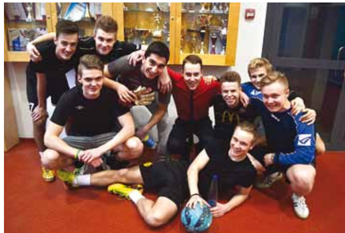
Gümnaasiumivaheline jalgpall.