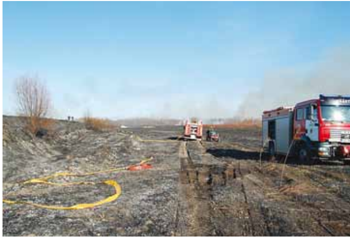
Kulupõlengutest tuleb palju kahju.

Paljude kulupõlengute taga on laste uudishimu ja teadmatust – pannakse kuivanud rohule tuld otsa, et näha leeki ning päästeautot sündmuskohale kihutamas. Tõsi, päästeautod on