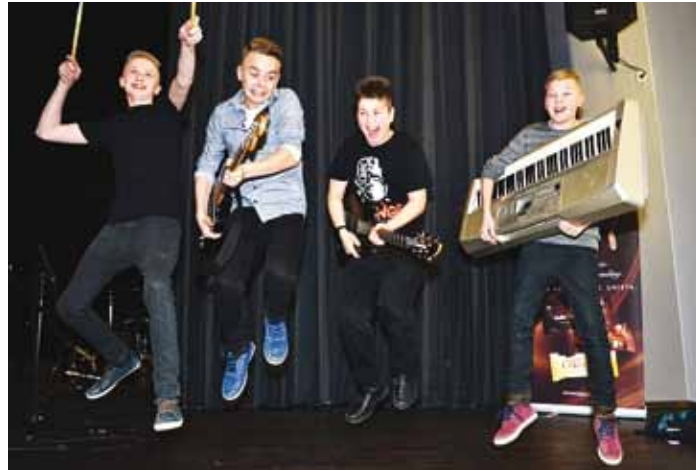
Vabalava 2016.