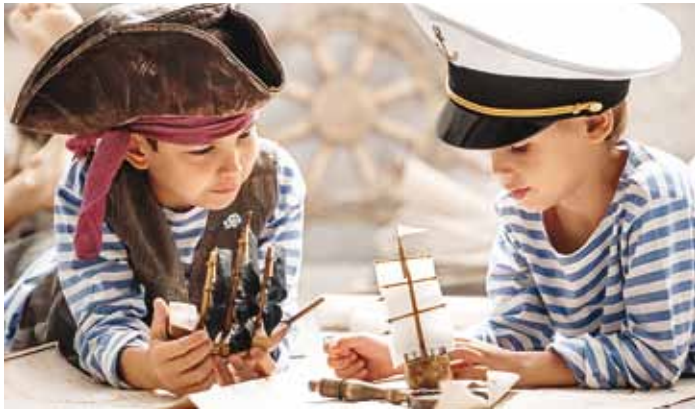
On aeg tunda end mereröövliina ja hüüda "carramba"!

Põnev piraadipidu annab võimaluse oma aasta tähtsaim pidupäev mööda saata tõeliselt