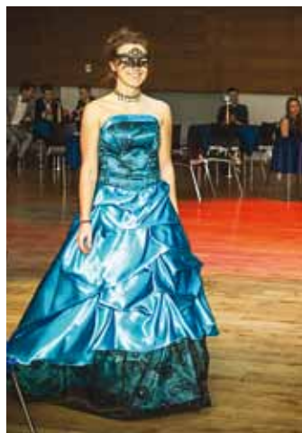
Viimsi Kooli maskiball.