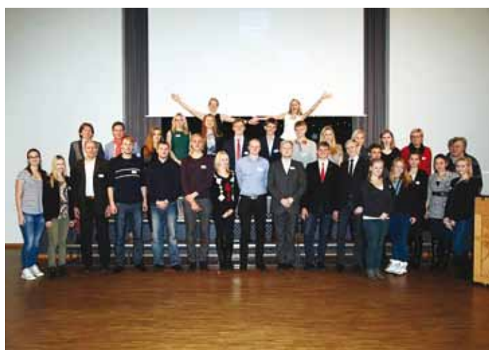
VIID osaluskohvik 2015 osalejad.

gusega kell 12.45 Viimsi Kooli aulas. VIID on kõikidele osalejatele tasuta. Õpilastel on võimalik saada üritusel osalemise tõend tundidest puudumise tõendamiseks, kuid õpetajatega peab siiski individuaalselt ka suhtlema. Üritusele registreerida saab teha Viimsi noortevolikogu FB lehel, pääsevaid vaid kiiremad.