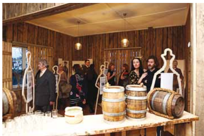
Näituse ühes toas on Malusi kõrts, kus müüdi Kolga mõisa viina ning mis oli ka teada-tuntud kohtumispaik.