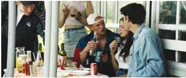
Päevad, mis ajasid segadusse.

Lumi sulanud, kevad käes ja aiad ootavad. Aga et hang ja kõblas õõnesid košmaariks ei muudaks, tasuks vast vahepeal ka tsipa pulssi alla viia. Mis oleks selleks parem, kui veeta paar tunnikest mugavas nahkistmes – kinos head filmi vaadates.