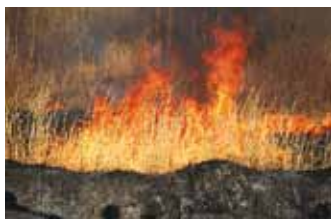
Kulupõleng on ohtlik.

põnevad ja tekitavad lastes uudishimu, kuid päästjate peamine tegevus ei ole lastele põnevuse tekitamine, vaid abivajajate aitamine. Lastele tuleb rääkida, et tikkudega mängimi-