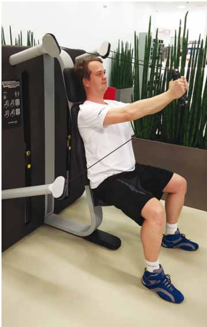
Treening rinna- ja käelihastele trennööril.

Jälgin hoolega oma toitumist. Hommikuid alustan järjekindlalt 2–3 munaga. Üks lemmikuid on omllett, kuhu sisse praen eelnevalt pisut porulauku ja hakitud tomatit. Klopitud muna sisse segan lusikataie kange adžikat, mida saab laupäeviti Viimsi taluturul vorsti-meister Janika käest. Vahelduseks keedan mune nii, et kol-