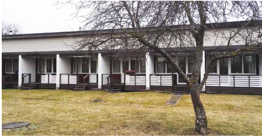
Rannapere pansionaat avas oma ukseid Kirovi kalurikolhoosi vanadekoduna piirkonna elanike tarbeks juba 1974. aastal.