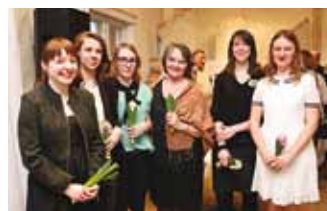
Rannarahva muuseumi töökas pere.