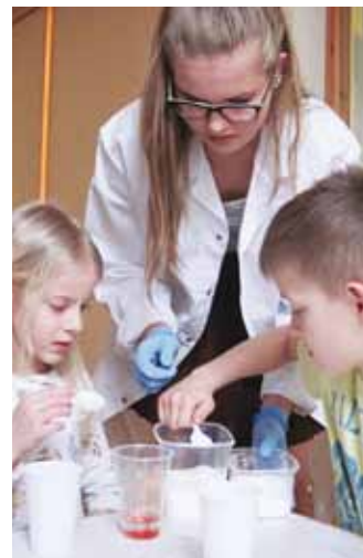
Teadusringis õpivad nii õpetajad kui ka lasteaialapsed.

leelikutel võimalik näha ja praktiseerida erinevaid teaduslikke katseid. Nii on lapsed saanud näha, et kahe läbipaistva vedeliku koostööl tekib roosa "vaarikas" ja teinekord tekib katseklaasi piimajas vedelik ehk "piim". Selgeks on õpitud esimest tähtsist reeglist teadusmaailmas – midagi maitsta ei tohi! Lastel oli põnev avastada, et sooda ja äädika koostööl tekib süsihappegaas, mida saab kasutada õhupalli täispuhumiseks. Need on vaid mõned näited teadusringi tegevusest lasteaias.