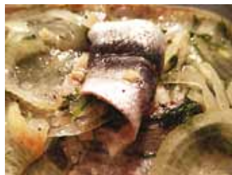
Intsu rollmopsid.

Valmistamise aeg: 2 (külm marinaad) + 2 päeva (järelmaitsestamine jahekapis).