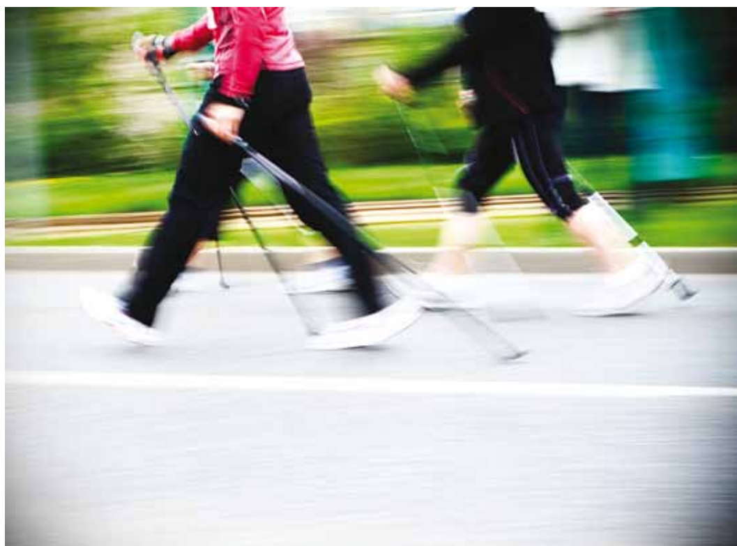
Kepikõnd aitab vabaneda kaela- ja nimmepiirkonna valudest.

Lisaks tõuseb südame löögisagedus kuni 17 lööki minutis ja suureneb hapnikutarbimisvõime tavalise käimisega võrreldes kuni 58%. Madala pulsiga harjutada soovijail tuleks seepärast keppidega kõndides olla südame löögisage-