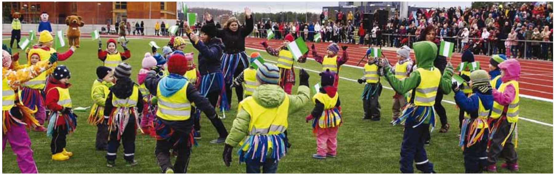
Tuulisesse kevadilma töid nigeeriapärase helide saatel eksootikat Astri maja lapsed.