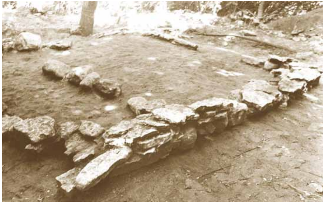
Viimsi II kalme 1990. aasta suvel, kui teostati arheoloogilisi töid. Kalme müürid on näha tänapäevalgi.

Eesti ala vabanes igijääst lõplikult umbes 12 500 aastat tagasi. Ligikaudu 11 600 aastat tagasi murdis vesi tänapäevase Rootsi keskosas Billingeni mä-