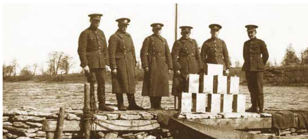
Piirivalvurid tabatud salalastiga.

"Soola toodi Rootsist kahemastiliste 22 jalga pikkade paatidega. Vedajate naised oota-