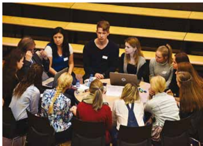
Teemalaus arutati erinevate küsimuste üle.

Pakuti välja ka idee küsitluse läbiviimiseks, et selgitada välja, millised on need valdkonnad, mis noori huvitaksid ning millistes nad sooviksid töötada. Lisaks on veel probleemiks noorte vähene teadlikkus töötamist puudutavatest seadustest, mida on võimalik parandada koolides info jagamisega.