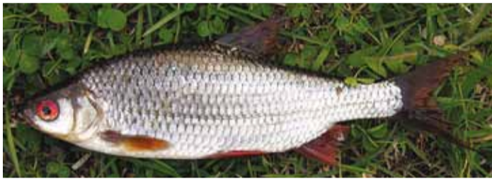
Särk pole oma paljude luude tõttu suurem asi kala söömiseks, aga kui ta ära kuivatada ja soolata, saab temast vobla.

paarkümmend aastat tagasi kindel olla, kas heeringa nime all karpi pandud kalad siiski oma rasvaste sugulaste kasinamad veljed polnud.