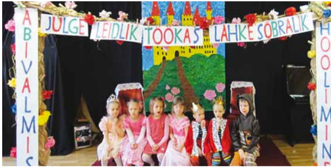
Muinasjuttude lugemisele järgneb alati ka sisu mõtestamine.

Kui lapsed imetlevad superkangelasi, muinasjutu- või välja-