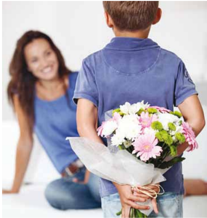
Palju õnne, armas ema! Emadepäeva tähistame mai teisel pühapäeval.

1928. aastast hakati emadepäeva tähistama hoopis maikuu teisel pühapäeval, nagu see on tavaks ka Ameerikas, kust kogu tähtpäev alguse sai. 1935. aastast juhtis emadepäeva tähistamist juba Riiklik Propagandatähtsus ja Rahvakultuuri ja Rahvahariduse Nõukogu. Aktused ja üritused muutusid ametlikuks ja väga pidulikuks. Näiteks 1938. aastal võttis Eesti Vabariigi president emadepäeval Kadrioru lossis vastu lasterikkaid emasid. Alles 1936. aastal hakati propageerima emadele kingituste tegemist, sh metsalilled kinkimist, neile laulmist, spetsiaalsete karskusseltsi poolt kujundatud ja valmisstatud emamärkide ostmist. Nõukogude ajal emadepäeva riiklikult ei tähistatud, aga paljudes peredes viidi maikuu teisel pühapäeval emale lilli ja täiskas-