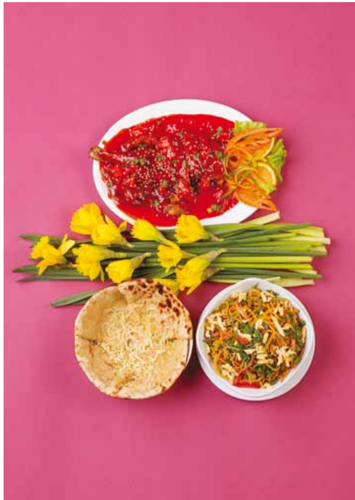
Maitsev toit Viimsi Keskuse teiselt korruselt! Fotol roog restoranist CHI.

Tõeliselt rikkalik menüü pakub gurmeehuvilistele lõputult