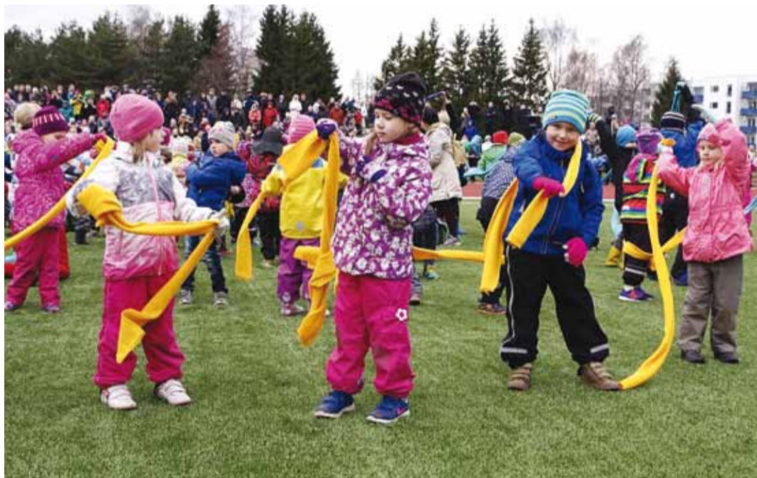
Laanelinnu maja lapsed esitasid tantsu Itaalia muusika saatel.