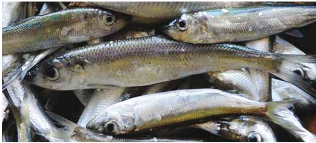
Räimest saab valmistada lihtsaid ja maitsvaid roogasid.

Läänemere asusid esimesed heeringad elama ligikaudu 10 000 aastat tagasi – seega pea samal ajal, mil inimene praeguse Eesti alale end sisse seadis. Siis oli merevesi ka tunduvalt soolasem. Meie räim ongi atlandi heeringa kärbustunud noorem veli, kes on hästi kohastunud elama väikese ja sealjuures muutuva soolsusega vees. Mõnikord on ka raske aru saada, kummaga neist kaladest parasjagu tegu on – Läänemere lõunaosas ja Taani väinade lähikonnas võib kohata nii atlandi heeringat kui ka räime ja samas ka nende vahepealseid isendeid. Kaubanduslikel eesmärkidel on eri aegadel püütud sätestada mitmeid reegleid – mõttelisi piire Läänemere lõunaosas, aga ka kala pikkusest tulenevaid määranguid, et eristada räime heeringast. Aga sellele vaatamata ei võinud veel