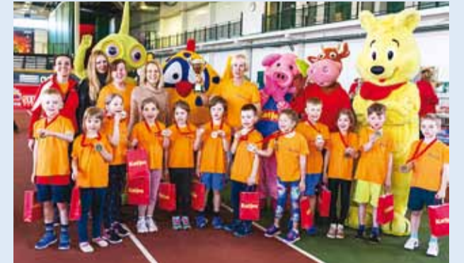
Palju õnne kõikidele pisikestele võitjatele ning täname lapsevanemaid ja õpetajaid!

MLA Viimsi Lasteaedade Laanelinnu maja lapsed osalesid edukalt vabariiklikel spordivõistlustel.