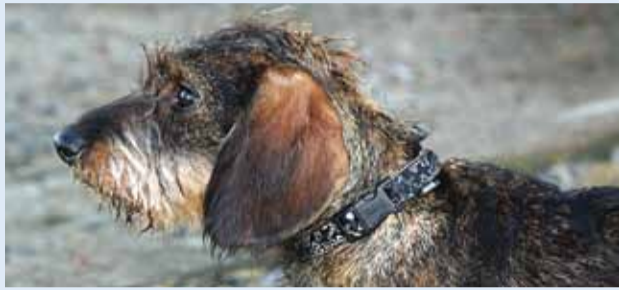
Lemmiku kiibist on kasu vaid siis, kui omaniku andmed registris.

Lemmikloomade kiibistamine on päästnud tuhandete Eesti neljajalgsete elu.