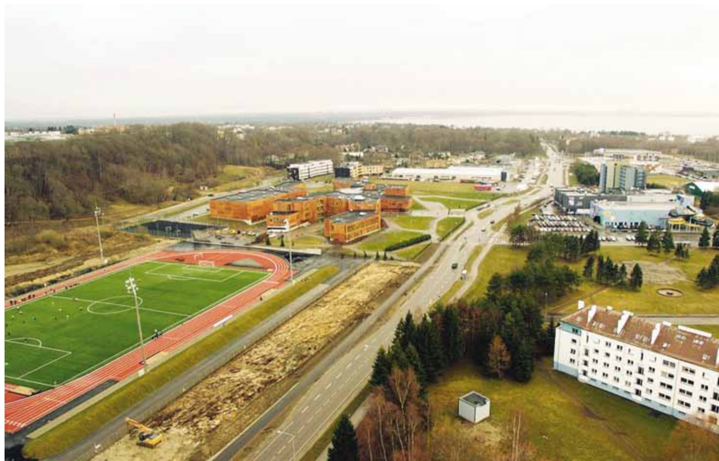
Koalitsioonilepe määrab ühise tegutsemise suunad lähiaastateks. Viimsi kasvab ja areneb.

- Peame tähtsaks kogukonna ühtsustunnet. Selle tugevda-