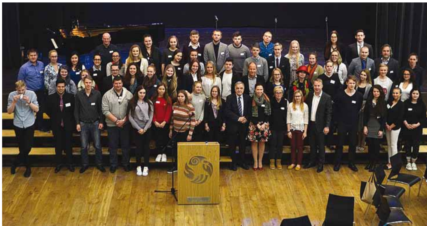
VIIDist osavõtnud jagasid häid mõtteid, mis kindlasti ka ellu viiakse.

“On eelkõige noorte endi valik, millised probleemid nad endale prioriteediks seavad.”