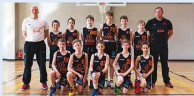
2005. aasta poiste võidumeeskond KK Viimsi koos treeneritega.