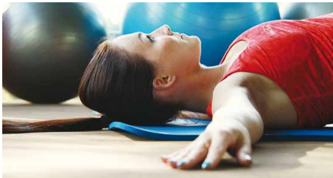
Füsioteraapia on kasulik kõigile.

Istuva iseloomuga töö puhul on kõige tähtsam leida aega puhkepausideks ning asendi vahetusteks. Kontoritöötajad peaksid iga 30 minuti tagant ennast liigutama vähemalt 3–5 minutit. Kasulik on paigutada töövahendid selliselt, et tekiks vajadus aeg-ajalt püsti tõusta. Näiteks printer või telefon võiks asuda töölaual kaugemal. Samuti on kasulik harjutada ennast teatud tegevuste puhul liikuma, näiteks kõndida mobiiltelefoniga rääkides. Sellised väikesed muudatused töökohal aitavad oluliselt rohkem liikuda. Väga oluline tegur vältimaks tööst tingitud kutsehaigusi on töökoha ergonoomiline ja õiget kehaasendit toetav paigutus. Tooli kõrgus peaks kindlasti olema reguleeritav, et jalad ulatuksid maha. Töölaual kõrgus võiks olla 5 cm küünarnu-