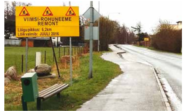
Rohuneeme tee saab korda juulis.

Riigitee nr 11251 Viimsi – Rohuneeme lõigu 1,1–7,3 km taastusremondi töödega alustati 2. mail. Tööd kestavad 3 kuud.