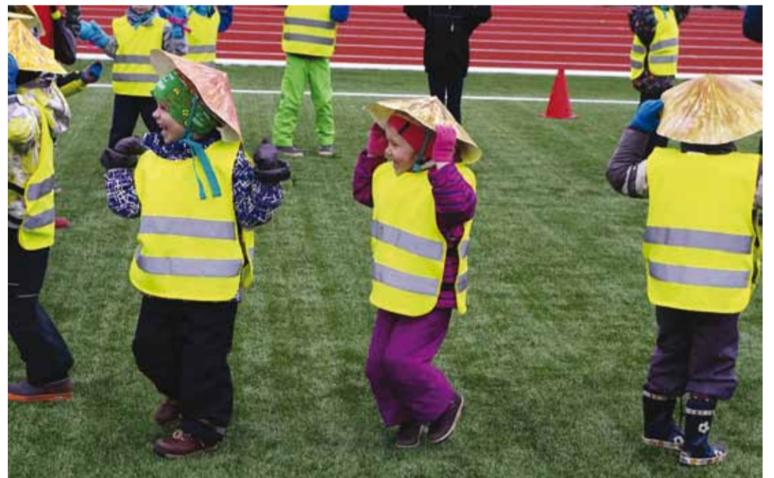
Väikesed "hiinlased" Randvere lasteaiast.