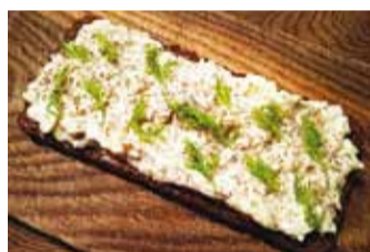
Leib sibula ja majoneesiga lutsusalatiga maitseb hea.

se lihahimuline, aga nüüd olen avastanud, et 2–3 päeva võivad märkamatult mööduda ilma liha söömata. Lihtsalt pole meelde tulnud, järelikult pole organismil selle järele vajadust. Mu igaõhtune lemmik on ikka presidendi räimed, mille retsepti paar numbrit tagasi jagasin. 5–6 kala koos sibulaga on suurepärane lisa salatiportsule. Isu kala järele kasvanud ja käin ikka meie Pepekala letti nooli-