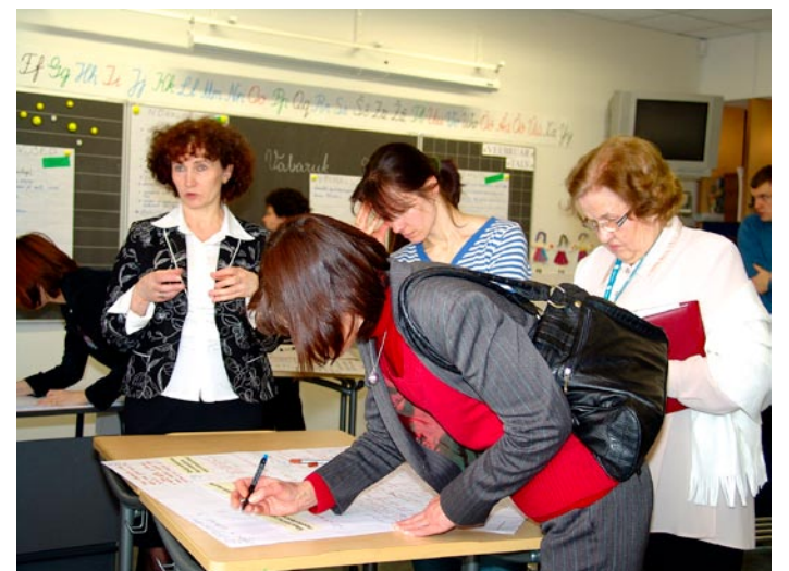
Huvilisi jätkus kõikidesse töötubadesse ning arutelud olid asjalikud ning huvitavad

Arengukava töörühma liikmed loodavad, et neil, kes on olnud protsessis ise aktiivselt osalised, on ka suurem vas-