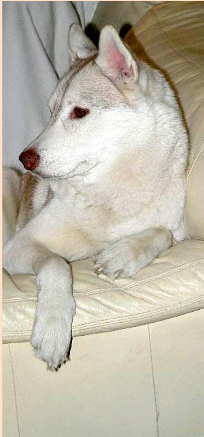
Pererahva koer lasti koduaia ees maha.

Pererahva palvel jäävad nad anonüümseks.