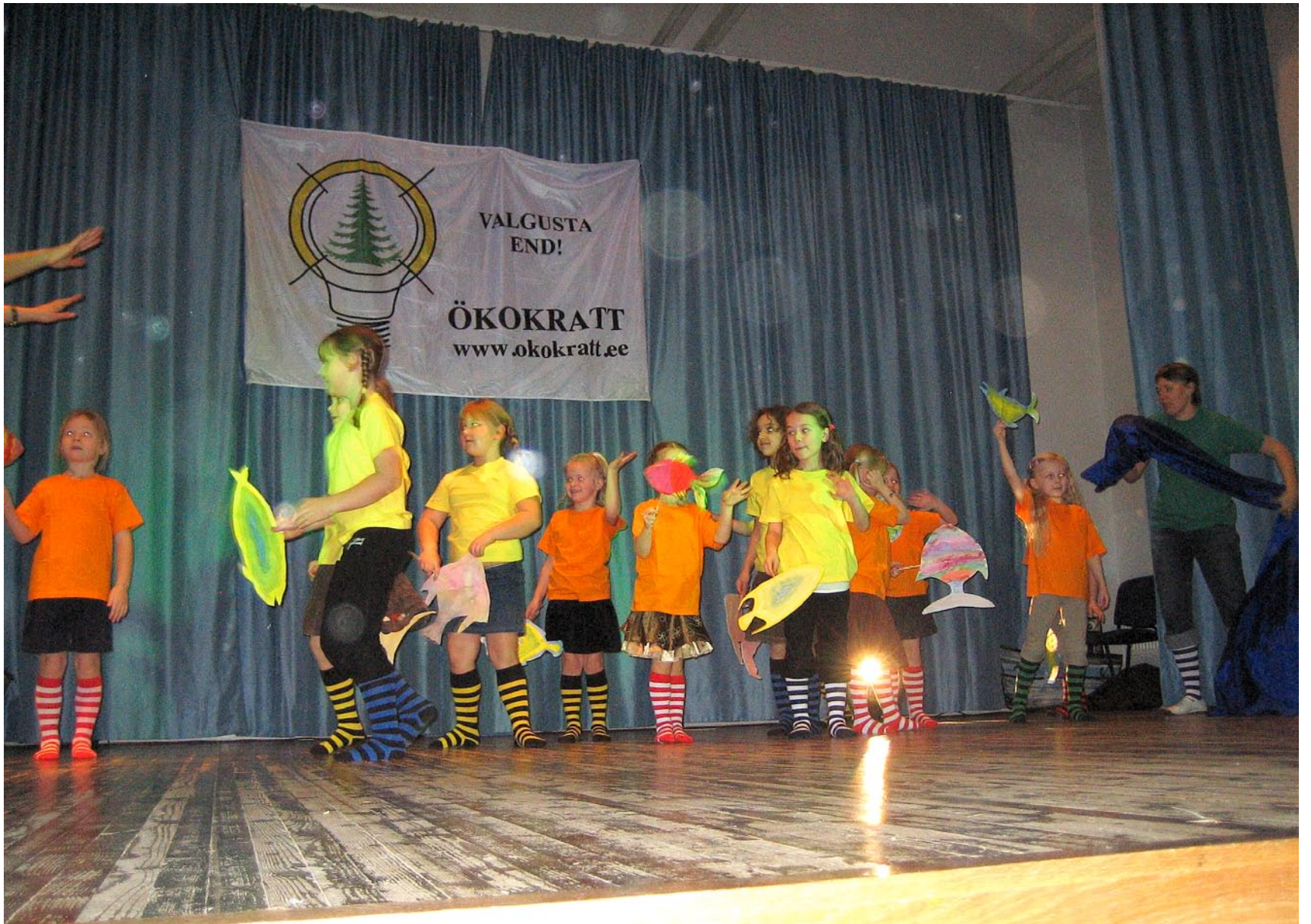
Tantsukava „Maa ja meri“