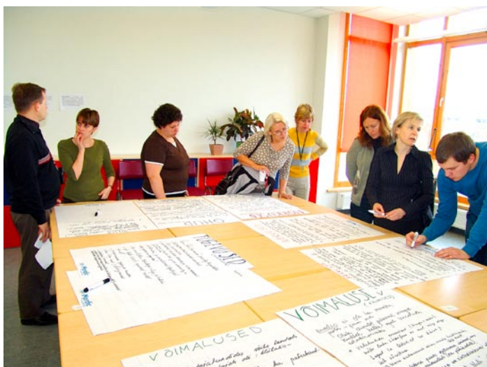
25. veebruaril toimus Viimsi Kooli ülekoolline ajurünnak, kus kõik huvilised said oma sõna sekka öelda