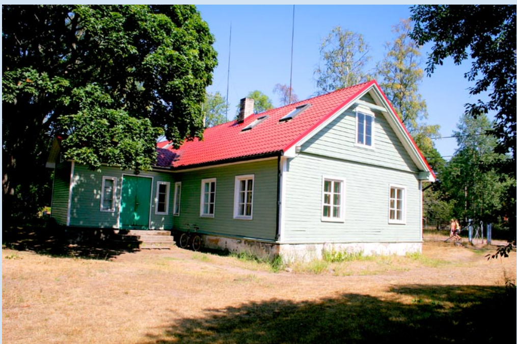
Nüüd: Prangli koolihoone 2006. aasta augustis, Jaan Kolbergi foto.

Viimastel aastatel on valla toetusel kooli põhjalikult renoveeritud. Hoone on saanud uue plekk-katuse, ruumides on tehtud remonti ning inventari on uuendatud. Praegu õpib Prangli koolis kuueliikmelise õpetajatepere juhatusel neliteist õpilast.