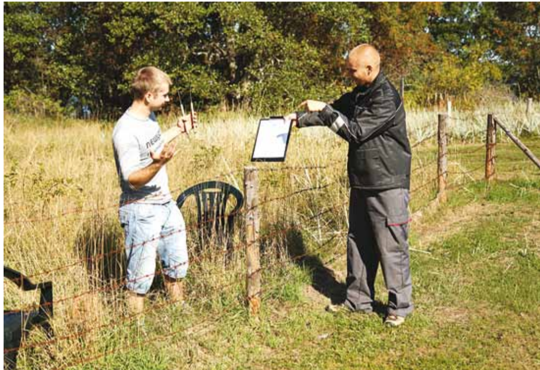
Trahv hooldamata maaüksuse eest võib nii mõnigi kord saada maaomanikule üllatusena.

Üks põhilisemaid heakorraalaseid probleeme on niitmata ja võsastunud maaüksused, sest need hakkavad reeglina enim