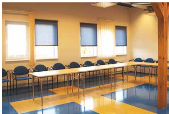
Viimsi Raamatukogu Haabneeme seminariruum mahutab kuni 25 osalejat.

Tunni ja päeva üürihind on vastavalt 8,95 € ja 35,79 €. Hind sisaldab fuajee, laudade, toolide, internetiühenduse ja tualettruumi kasutamist ning ühe tunni tasuta ettevalmistus-