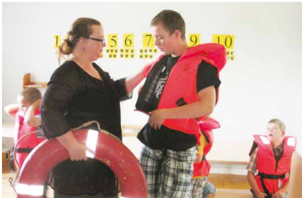
Saadi selgeks, kuidas käib selga päästevest.

Ka kõik käelised tegevused ja meisterdused olid mere- ja veeohutusteemalised. Näiteks valmisid kasvatajate juhendamisel kaunid merepildid looduslikest materjalidest, ohutusteemalised kollaažid, päästerõngakujulised külmkapimaga-