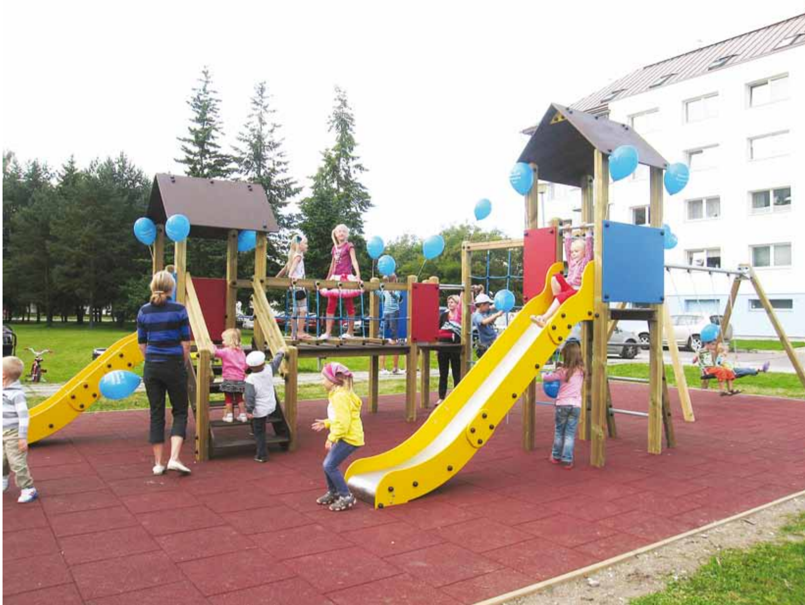
Juba avapäeval oli uus mänguväljak lapsi täis ja tegevusruumi jätkus kõigile.