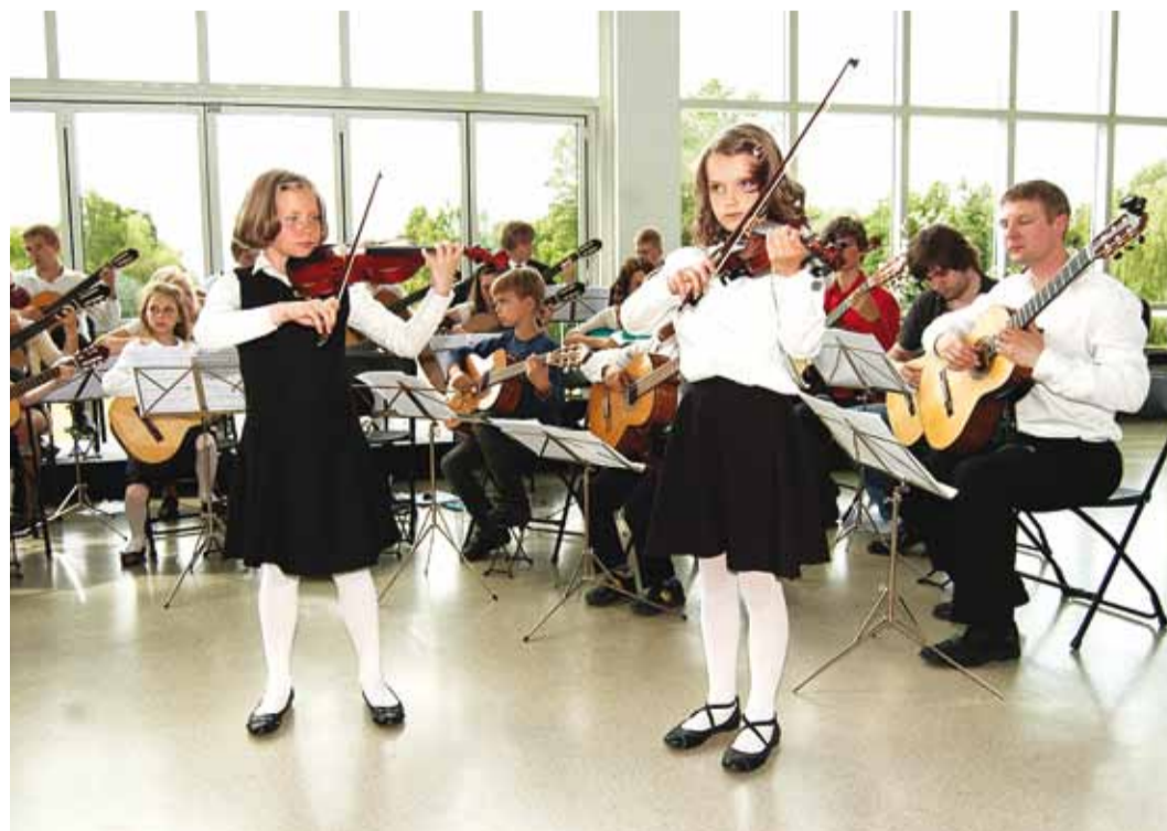
Väikesed viiulisolistid ja kitarrimängijad.