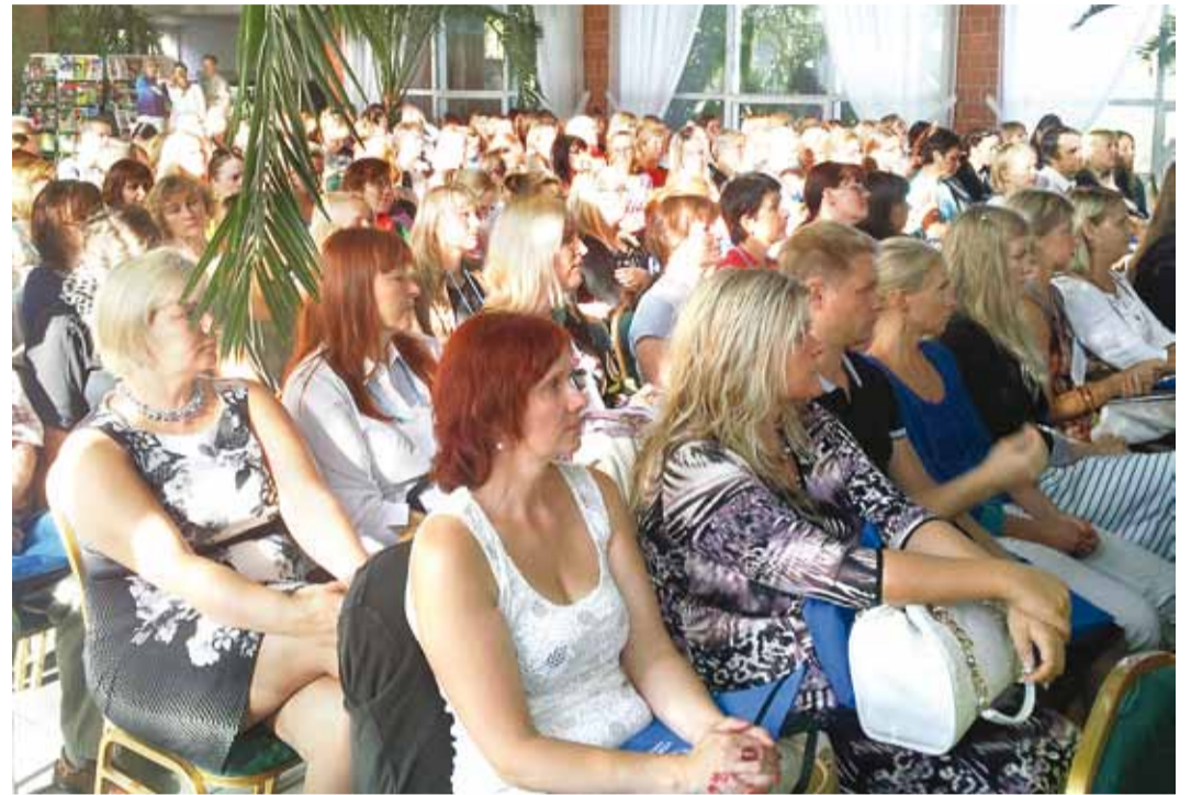
Valla üldhariduskoolide arenduspäeval osalesid Viimsi Kooli, Püüsi Kooli ja Prangli Kooli kogu personal.

Viimsi, Püüsi ja Prangli kooli esimene ühine arenduspäev toimus 26. augustil Tallinna Lillepaviljonis.