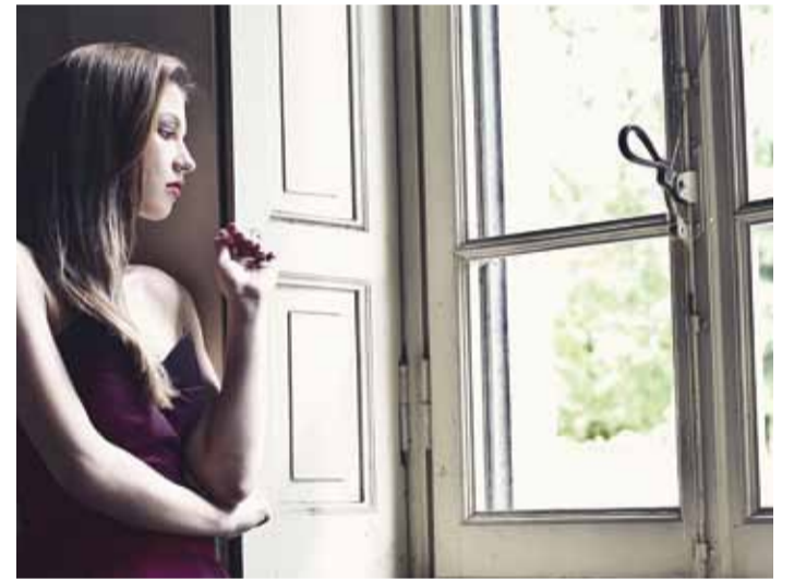
Naabrivalve hõlmab kõiki täiskasvanuid igas vanuses.