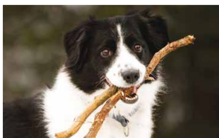
Suvekodust lahkudes jäetakse maha seni armas koduloom.

“Eestis on jätkuvalt probleem lemmikloomade hülgamisega suvilatesse. Inimesed võtavad suve alguses suvilasse puhkuseperioodiks koera- või kassipoja, kuid suvilast lahkudes hülgevad looma,” selgitas Eesti Loomakaitse Seltsi juhatuse liige Tania Selart. “Hea meel on aga tõdeda, et seltsi infotelefoni statistika põhjal on selline trend languses. Võrreldes eelmise aastaga oleme sel aastal saa-