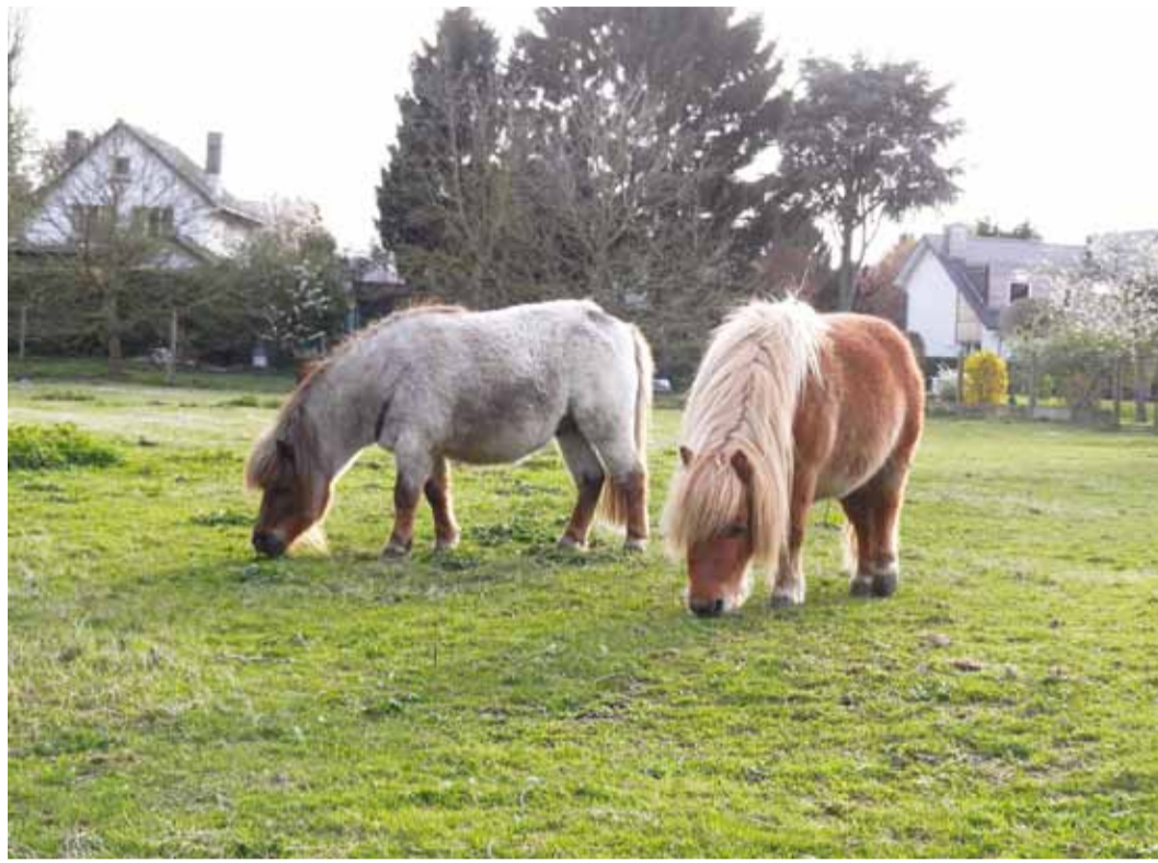
Ponid Brüsseli äärelinnas.

Viimsi alles ootab kõigi võimaluste ärakasutamist elukeskkonnana ning seejuures ei tasu imestada, et ka valla elu korraldajaks pürgijad libisesid näiteks eelmiste valimiste eel keskkonnateemast kas üldse üle või pakkusid kindla peale minekuna võetavaid ettepanekuid. Oluliseks peeti puhtaid supelrandu, hea juurdepääsu tagamist mererannale ja korras haljasalaseid, lubati korraldada keskkonnanalaseid koolitusi ja seista metsaalade säilimise eest, vajadusel veelgi laiendades kaitsealaseid maid. Oli ka üks üsna resolootne seisukoht,