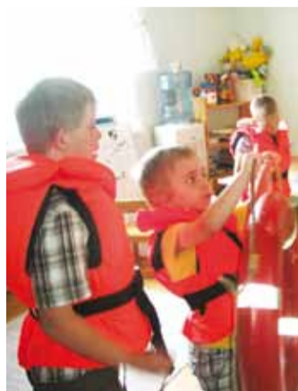
Tehti tutvust päästerõngaga.

netid, kuldkalakestega vaasid ja palju muid põnevaid asju. Koos lapsevanematega käisi-