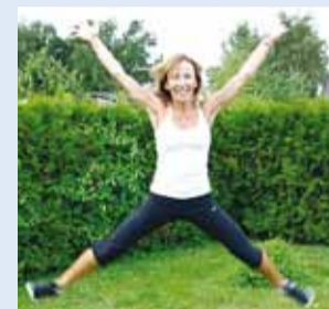
Treenn sobib kõigile.

Bootcamp – suurim võimalik kalorikulu 45 minutiga! Boonuseks treenitud lihased, kiirem ainevahetus, hommikune energialaeng ja hea tuju!