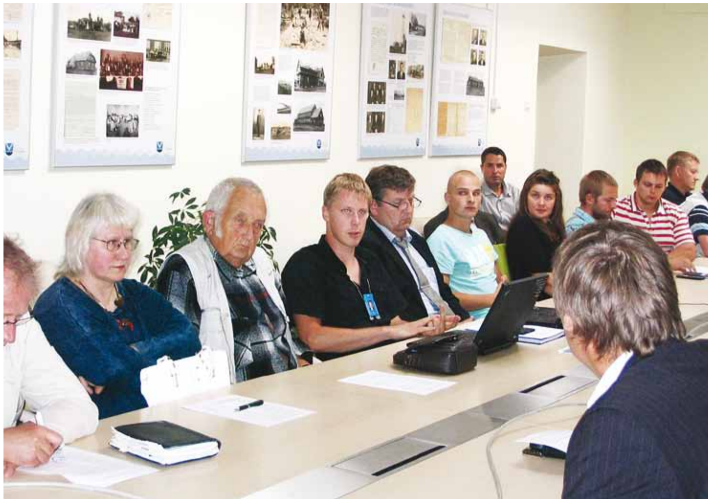
Naabrivalve ümarlaud oli osavõturohke ja aktiivne.

Selle aasta esimene Naabrivalve ümarlaud toimus 2. mail, kus arutati mitmetel turvalisust puudutavatel teemadel, mida kohale tulnud sektorite vanemad olulisteks pidasid. Naabrivalve töö paremaks korraldamiseks valiti sektorite vanemate hulgast Viimsi Naabrivalve sektorite koordinaator, kelle ülesanneteks on ümarlaudade töö korraldamine. Koordinaator aitab muuta paremaks ka naabrivalve sektorite liikmete suhtlemist nii valla kui teiste osapoolte ja üritustele kaasatud partneritega.