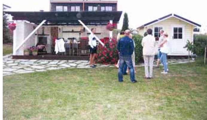
Linnase tee Naabrivalve sektor peab koosolekut.

Selle esimese etapp oli avaldada Viimsi Teatajas kolm artiklit aktiivsete naabrivalve liikmete tähelepanekute põhjal. Kaks neist valmisid koostöös kommunaalametiga ja üks