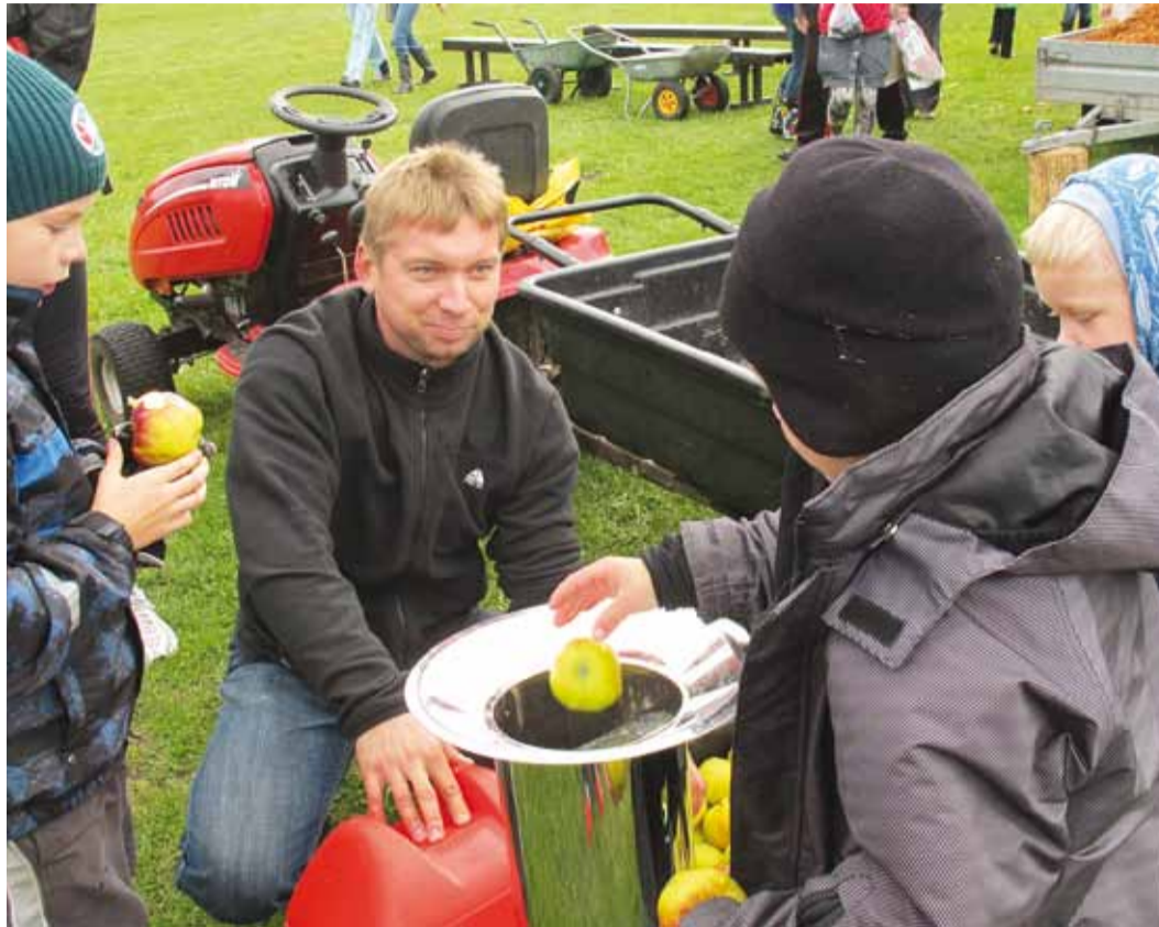
Õunamahla tegemine pakub põnevust ka lastele.

Esimeses võistlusvoorus ehk Halika õunatalu voorus grillitakse korraldaja poolt antavat kindlat õunasorti "Sügisjook" tervikõunana. 2012. aastal oli esimese võistlusvooru õunaks Halika Õunatalu "Lobo". Lubatud on õuna koorimine, maitsustamine, sh ka süstimise meetodil. Kohtunikud hindavad selle vooru võistlustöid pimehindamise meetodil.