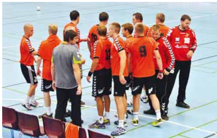
Käsipallurid mänguplatsil nõu pidamas.

Tugevatasemelise Lärkkulla Cupi esimeses kohtumises alistati numbritega 21:18 tu-