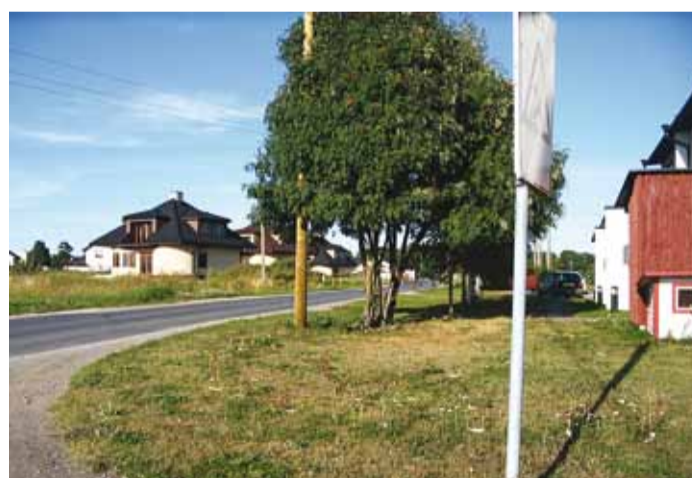
Liiklusohutuse tagamiseks lageda ja Vehema teede ristmikul pügati seal kasvavat pihlakat.

koostöös Viimsi piirkondliku politseiga.