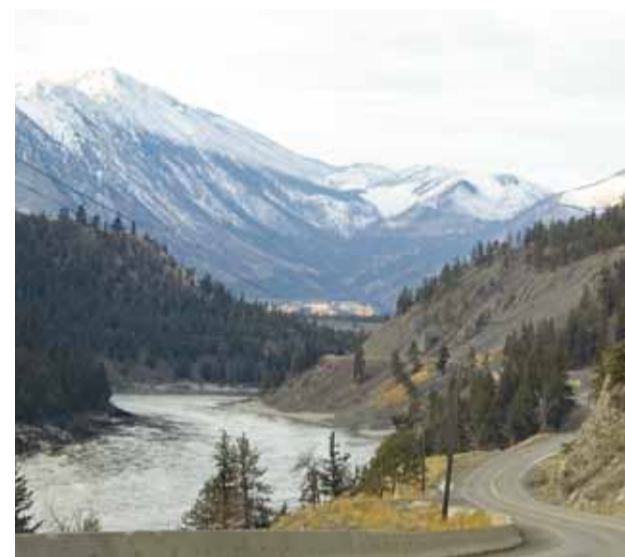
Elugi kirjeldatakse teena, mis teeb oma käänakuid.

Käies teed oleme me harjunud sellega, et see teeb käänakuid, vahel tõuseb ja siis taas langeb. Selline on tee, mida mööda tavaliselt liigume.