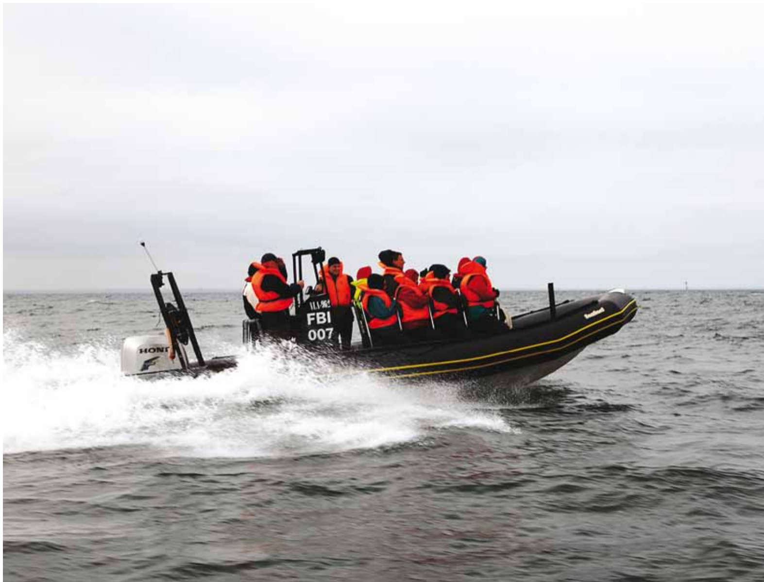
Watersport.ee viib Viimsi saartele, korraldab veesporti ja toredaid merereise.