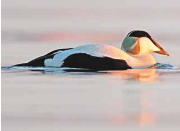
Isane hahk.

Hahk on polaarrändurite suurim sõber, kuna tema sulgi kasutatakse ülisoojade riiete valmistamiseks. Aul on aga osav sukelduja, kes võib toitu hankida isegi poolesaja meetri sügavuselt merepõhjast.