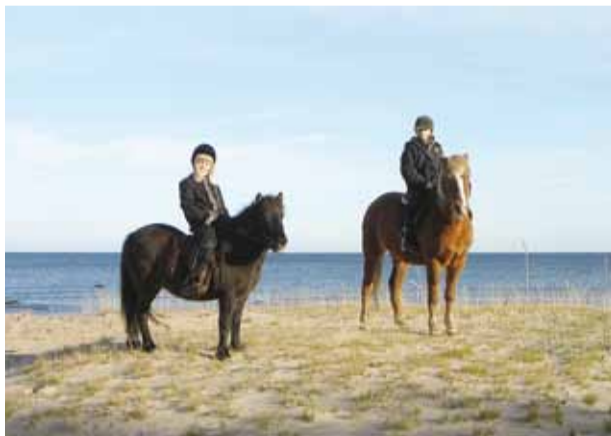
Prangli Jaagu-Uuetoa talus saab ratsutada ning talviti saaniga sõita.

Naissaar on ühest küljest oma patareide, kaitserajatiste ja varematega justkui militaarne vabaõhumuuseum, teisalt aga avastamisrõõmu ja seiklusi pakkuv looduspark – sellel saarel võib viibida nädalaid ja ikka ei suuda kõike näha. Rannakaitse-