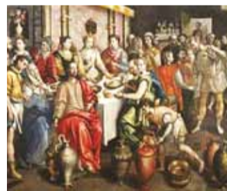
“Kaana pulm”. Tundmatu autor

Vaadates tagasi näituse ettevalmistamisele, kerkib silme ette üllatuste rida: mida kõike Eestis ei leidu ja kui paljusid kunstiteoseid võib toidukultuurist ning ka ainuüksi veini- ja leivamotiivist lähtuvalt interpreteerida. Rõhutame siinkohal