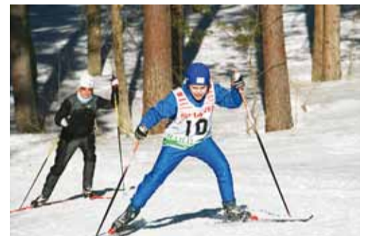
Valla meistrivõistlustel suusatamises 2011.

Nüüd, kus lumi maas, on aeg talispordiga tegeleda.