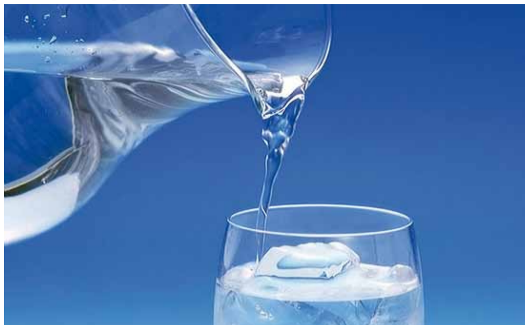
Peagi valmiv joogivee puhastusjaam tõstab tunduvalt Viimsi vee maitseomadusi.

Tänu Euroopa Ühtekuuluvusfondi veemajandusprojektidele on tehtud Viimsis palju – kaasajastatud on 80% Viimsi poolsaare veemajandusest. Samas on vald pidanud omafinantseeringu katteks võtma suuri laene, mille tagasimaksmine nüüdseks enam nii teravalt tunda ei anna. See on ka üks põhjusi, miks Viimsi Vesi