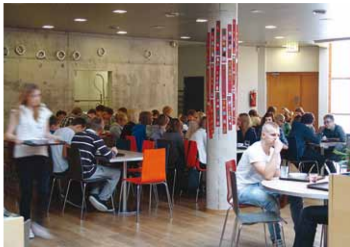
Söögivahtetund Viimsi Kooli sööklas.

Uue koolilõuna toetuse kasutamise tingimuste ja korra kohaselt ei pea enam 5. ja 6. klasside lapsevanemad tasuma valla munitsipaal-koolides koolilõuna eest. Lapsevanema osa tasub otse koolitoitlustajale AS Tampe Viimsi vald ning