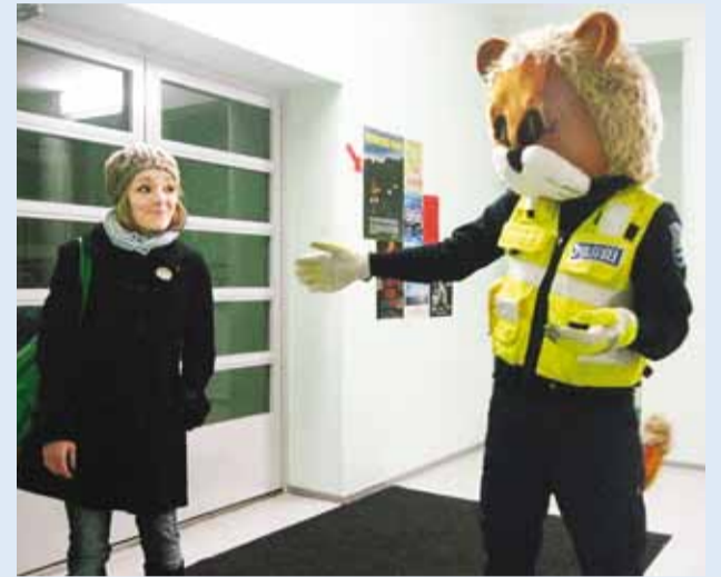
Lõvi Leo tervitab kooli saabujaid.

13. kuupäeva ja reedet peetakse tavaliselt halvaendeliseks kuupäevaks. Nii võis arvata ka osa Püüsi Kooli õpilastest, kui nägid 13. jaanuari hommikul kooli hoovis politseiautot. Toimus noorsoopolitsei poolt läbiviidav helkurikontroll.