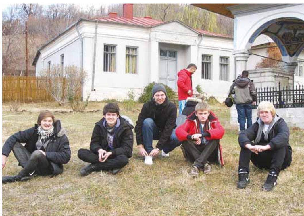
Viimsi noored koos kaaslastega Lätist jalgu puhkamas.

Sotsiaalmeedia tähtsus ja kasutatavus on tänapäeva noorte seas üha levinud ja kasvav nähtus just Facebooki näol. Nagu reedab projekti nimi "Sa-