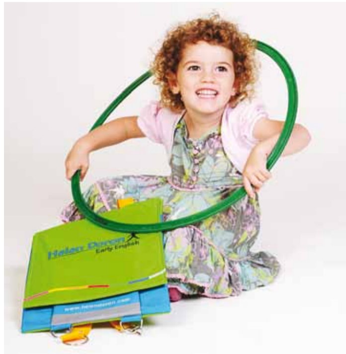
Tundides on palju muusikat, liikumist ja mängu.