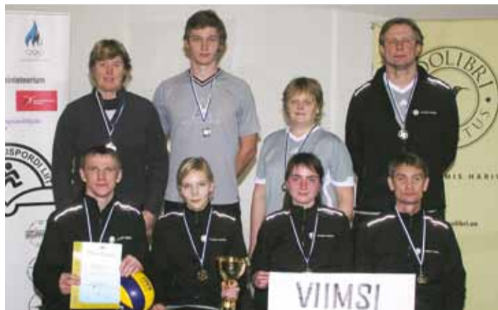
Viimsi Kooli õpetajate võistkond.

Alagrupimängude teine vastane – Oru Kooli võistkond – oli aga hoopis teisest puust. Esimeses geimis tuligi tunnistada vastase paremust. Teise geimi võit tuli Viimsi võistkonnale ja alagrupis väga olulist