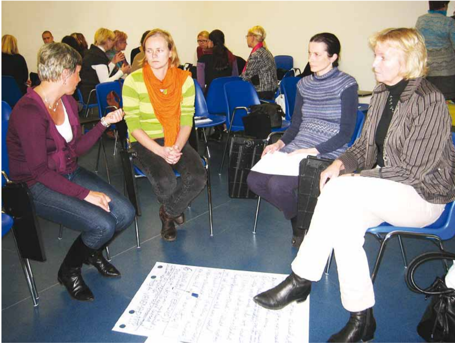
Et ükski abivajav laps ei jääks märkamata, selle nimel tegutseb vallas hulk spetsialiste.

JazzPopfest toimub juba neljandat korda. Loe lk 4