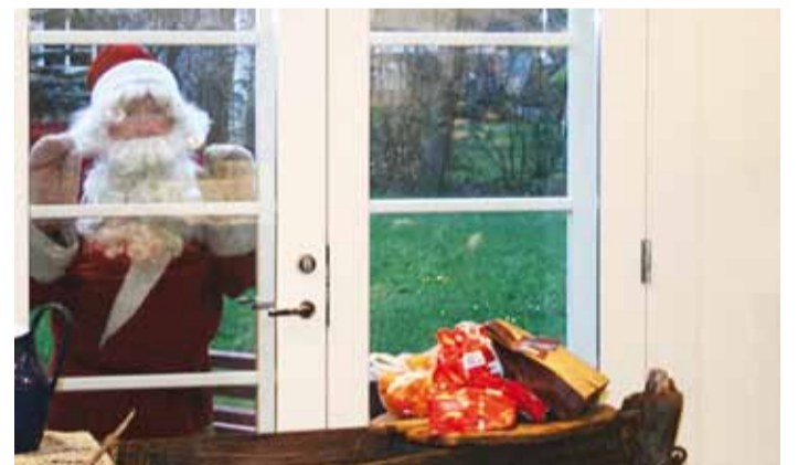
Jõulumees koputab aknale.

tundi; mõeldud lastele vanuses 4–10 aasta.