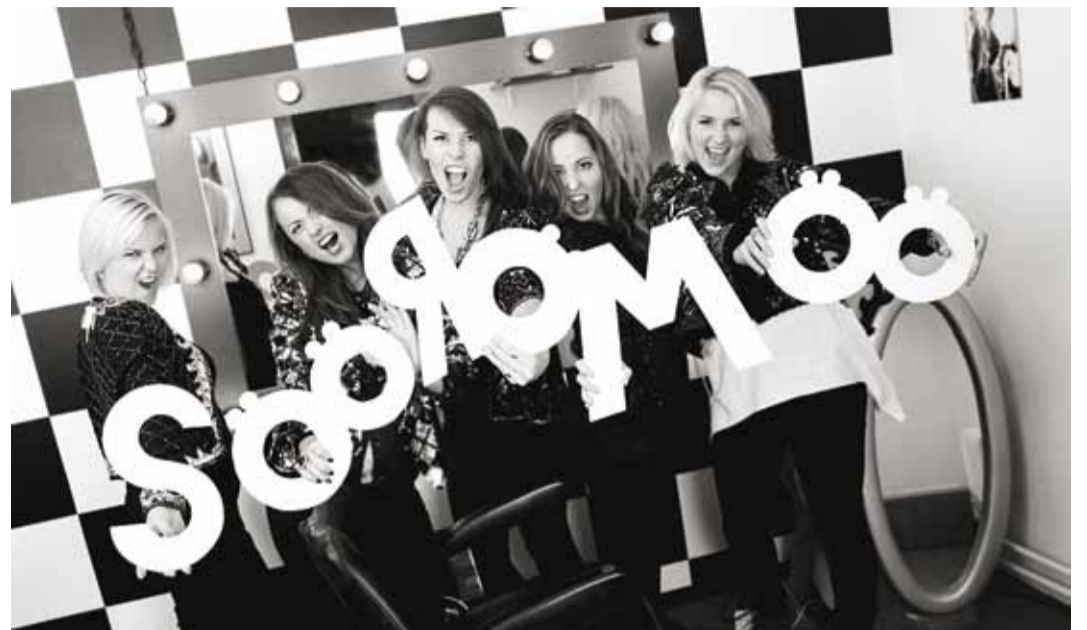
Söörömöö – 2011. aasta festivali üks paremaid vokaalansambleid.

IV Viimsi JazzPopFest kutsus osalema vokaalansambleid ja koore kõikidest kooriliikidest. Festival toimub neljas alagrupis: tulevikukoorid Future is Yours (vanus kuni 12), A-kategooria Simply the Best (vanus alates 13), B-kategooria Just for Fun (vanus alates 13) ja vokaalansamblid Little Less (vanus alates 13, ansambelis 3–12 lauljat). Kuna järgmisel aastal tähistatakse Raimond Valgre 100. ja Uno Naissoo 85. sünniaastapäeva ning Valter Ojakäärul täitub 90. sünnipäev, siis peab ka Viimsi festival neid Eesti kergemuusika tippe mees ning osalejatel on kohustus leida nende loomingust üks sobiv teos. Konkurss toimub kooridele A-kategoorias ja