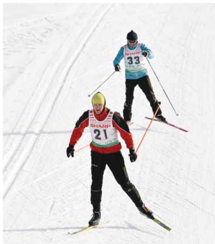
Valla suusaradadel saab teha tervisesporti ja võistelda.

Sel talvel sai vallas tõesti väga erinevais paigus suusata ja seda ehk kõigi aegade hooldatumatel radadel. Valla poolt eelmisel aastal hangitud 3 m laiune rajahooldusseade on osutunud ülimalt õigeks investeringuks, mis on lubanud paremas korras hoida Karulaugu valgustatud raja, tõmmata suusajäljed Laidoneri parki, isegi koolimaja ümbrusse, Püüsi koolimaja juurest Ro-