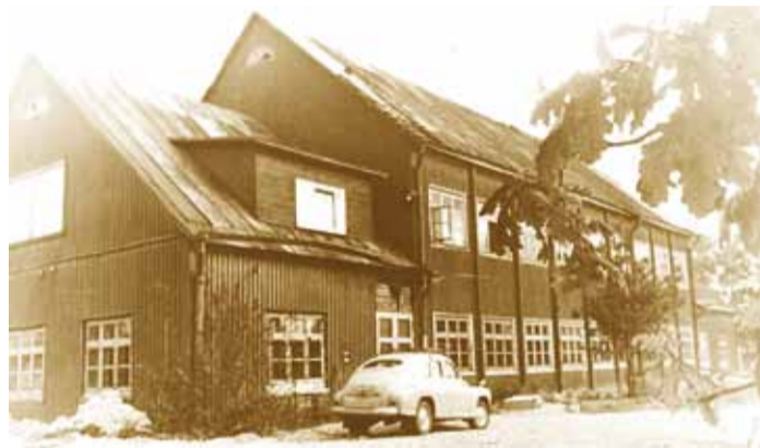
Viimsi kool 1960-ndatel aastatel.