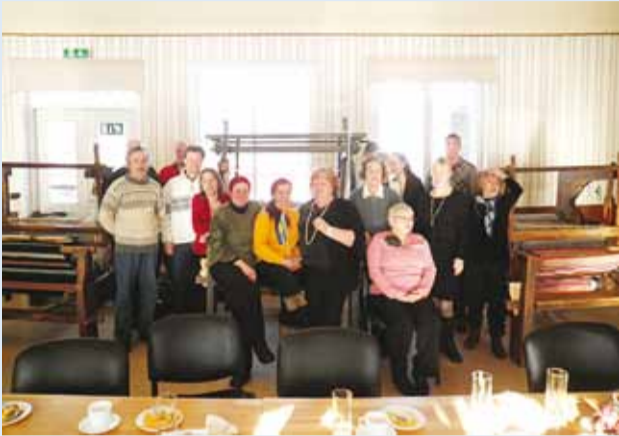
Eesti minut. 24. veebruar kell 13, Prangli saar, Prangli rahvamaja.

Prangli saarel, Prangli rahvamajas tähistati 24. veebruaril EV 95. juubeli sünnipäeva koos lõunase kohvilaua ja isetehtud maitsva sokoladikoogiga.