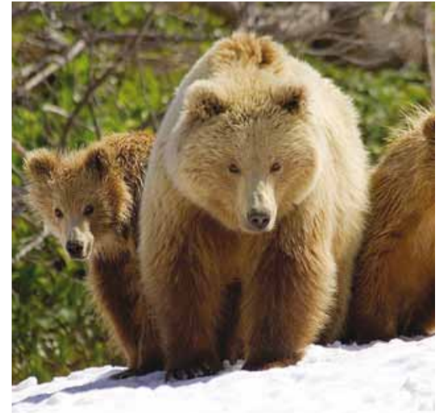
Kui päike kõrgel, virguvad karud ja asuvad toimetama.

Kätte on jõudnud kevad – aeg, mil loodus virgub, hakkab taas elama.