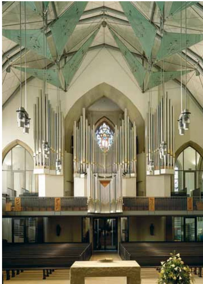
Mühleiseni firma valmistatud 82 registriga orel Stuttgarti evangeelse peakirikus.

Kuna orel on pill, mis vajab ruumi, ja Viimsi kirikus on seda vähe, siis otsustati ehitusi viisi kasuks, mida Eestis veel tehtud ei ole. Seda nimetatakse saksa keeles wechselschleife süsteemiks. See tähendab, et ühte registrit (s.o vilede rida)