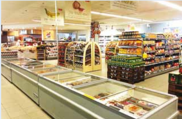
Mini-Rimi avar kaubasaal.

Eesti suurim jaekett avas Viimsis Rimi kaupluse.