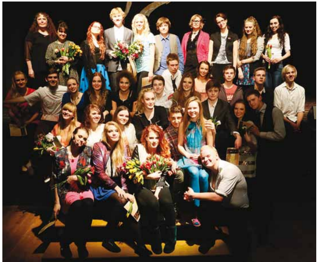
Viimsi Kooliteatri etenduse "Fame" trupp pärast esietendust.

Pika arvutamise ja meenutamise tulemusena julgeme väita, et meie etendusi on vaatanud käinud umbes 50 000 vaatajat. Seda nii Viimsi Kooli aulas, Viimsi Huvikeskuse saalis, Viimsi Rannarahva muuseumis, Viimsi mõisas, Viimsi Spordihallis, Rohuneeme kalmistu kõrval oleval platsil ja Viimsi mõisa taga mäel, kus oleme koos noorte tantsijatega teinud toredaid suveetendusi.