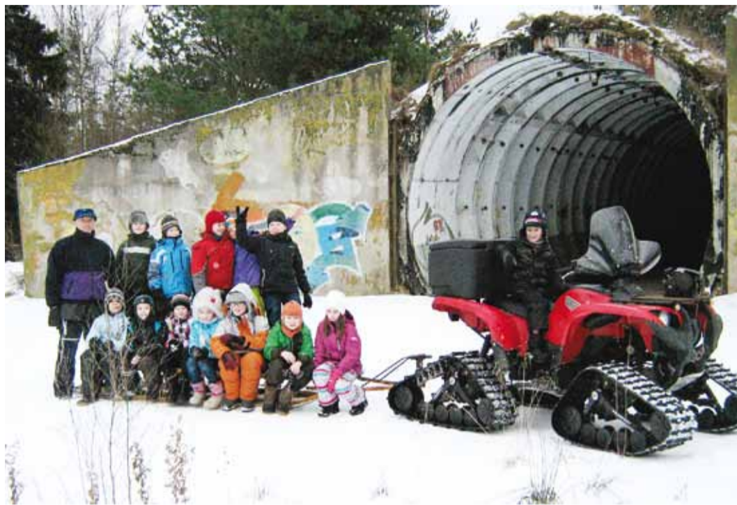
Loodusretke vastu on laste huvi aina kasvanud.

Detsembris käidi vaata- mas mägraugusid ja nende elukombeid. Jaanuaris tutvuti militaarehitistega Viimsi val-