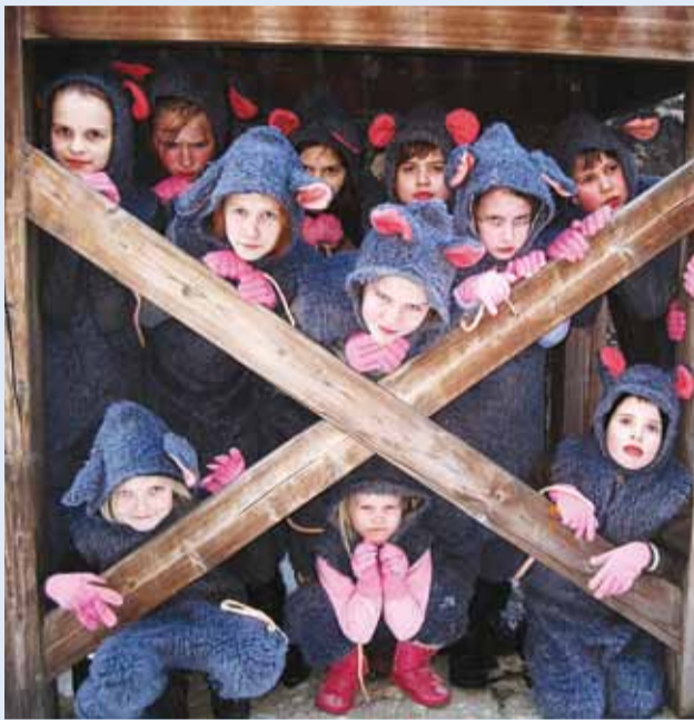
Rotid vallutavad linna.

Viimsi Harrastusteatri on lavaküpseks saamas uus peremusikal "Hamelini Vilepillimees".