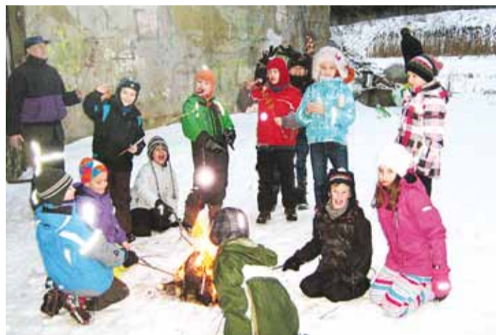
Matkal grillitakse vorsti ja juuakse taimeteed.

las. Veebruaris tähistati koos metsasõpradega sõbrapäeva. Loeti nende jälgi, viidi süüa, söödi koos vastlakukleid.