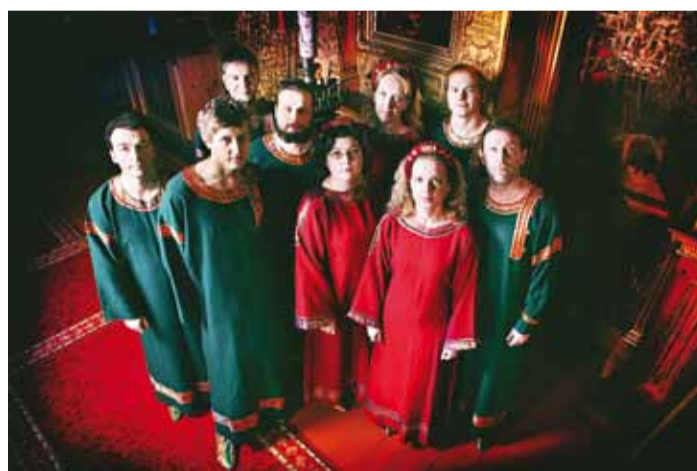
Orthodox Singers esitab õigeusu muusikat.

Orthodox Singers on uuni- kum Eesti kultuurimaastikul. See on ainus Eestis õigeusu muusikat esitav kutseline kol-