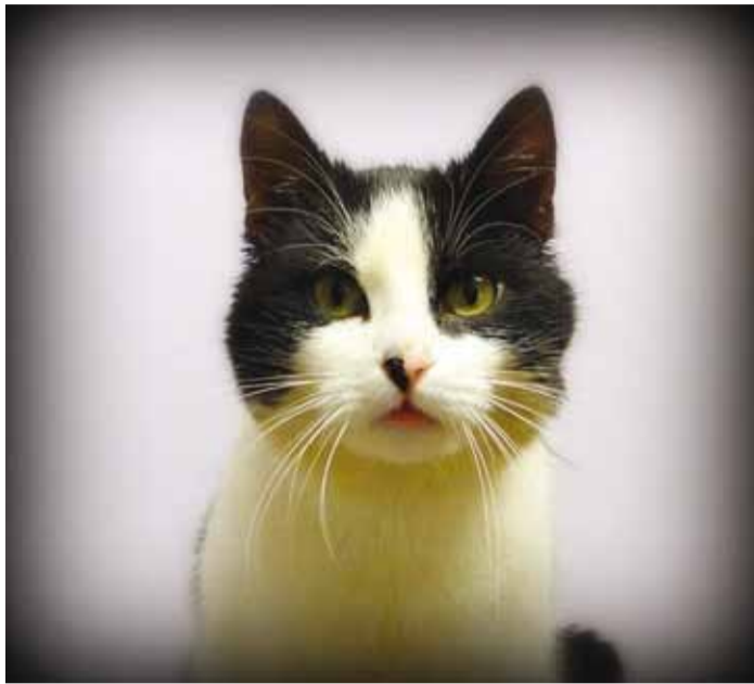
Muri on esinduslik ja tark alfaisane.

Kõik kassid viibivad turvakodus kuni kodu leidmiseni, Kasside Turvakodu ei hukka