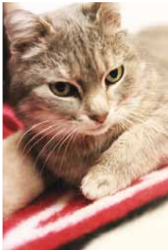
Lilian on vaikne ja hell.

ühtegi looma! Näiteks läks turvakodust eelmisel aastal koju kuus ja pool aastat kodu oodanud Villu ning sel aastal viis ja pool aastat kodu oodanud Victor. Seitsme tegutsemisaasta jooksul on turvakodu abil uue armastava kodu leidnud kokku ligi 5000 kassi.