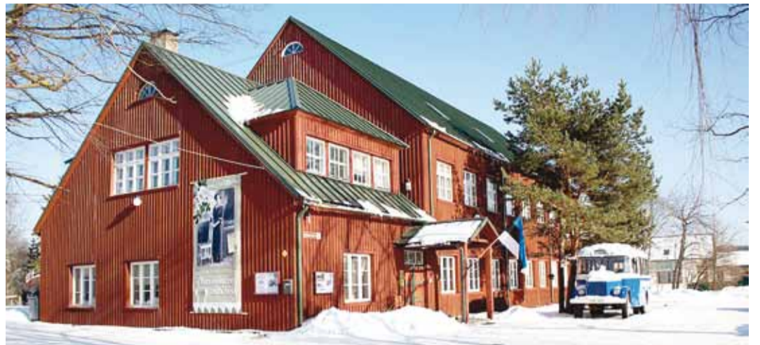
Praegu on siin Rannarahva muuseum.

Koolimajas toimus lisaks õppetööle ka seltsitegevus ja rahvapeod, mille eest seltsid valla kassasse raha maksid. Alumise korruse saali ehitas