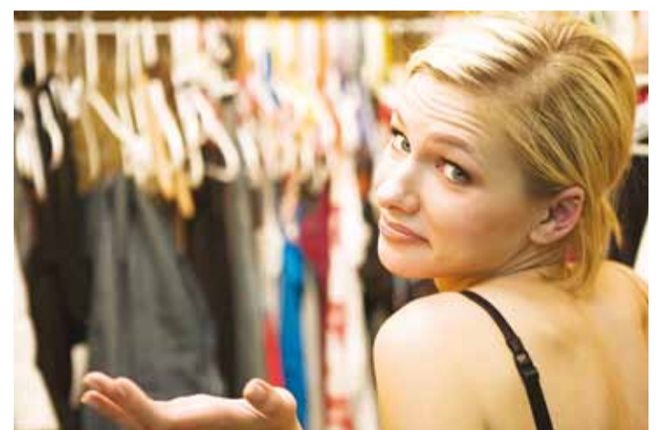
Milleks nii palju riideid, mida sa ei kann?

föderatsiooni kuuluvad organisatsioonid tegutsevad 43 riigis ning viivad ellu üle 440 projekti, mis tegelevad hariduse, keskkonna, kliimamuutuste, tervishoiu ja paljude teiste oluliste sotsiaalsete küsimustega. Kõige selle eesmärk on tagada inimväärne elu ka kõige vaesemate riikide elanikele.