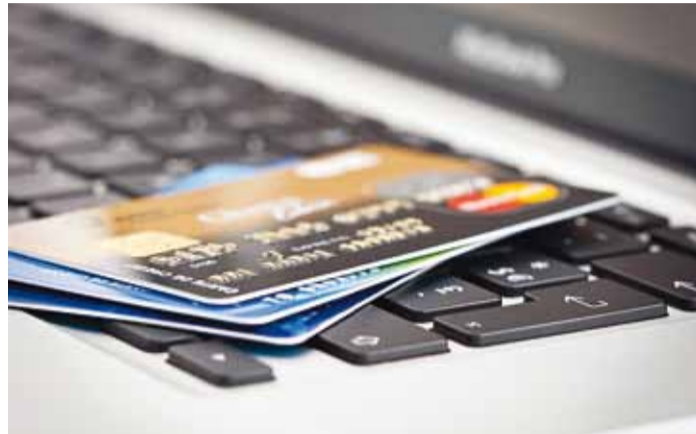
Pangakaardil on palju kasutusvõimalusi.

Suur hulk eestimaalasi peab kaardimakse võimalust täna legaalse ettevõtluse võrdkujuks ning on sügavalt häiritud, kui seda põhiõigusena tunduvalt makseviisi mõnes asutuses ei pakuta. Teine osa aga kasutab pangakaarti peamiselt sularaha väljavõtmiseks pangautomaadist, mistõttu jäävad neil kasutamata mitmed pangakaardi eeliseid.