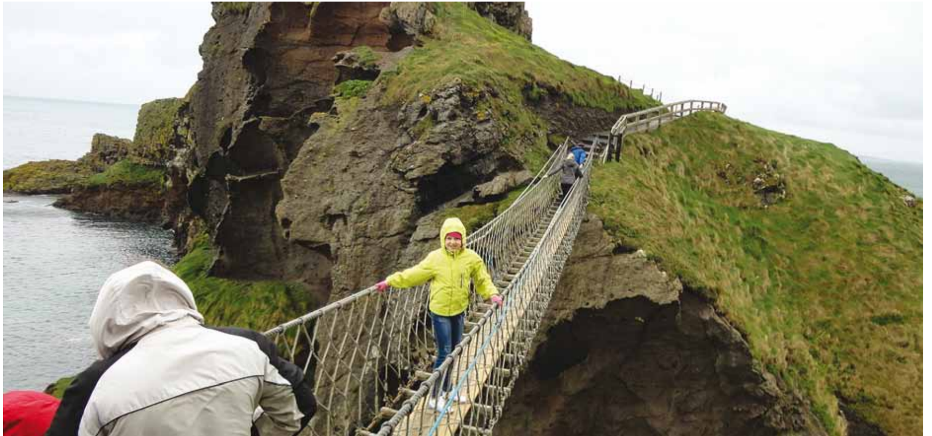
Iirimaa loodus on väga ilus, aasta ringi roheline ning pakub üllatavalt kauneid ja meeldejäävaid vaateid.

Kool algas 30. augustil ning nii nagu Eestiski hakkasin käima elukohajärgses koolis. Kuna Iirimaa ei ole riiklikke lasteaedu, siis hakkavad lapsed juba alates neljandast eluaastast koolis käima, seega hakkasime koos õega ühes koolis käima. Mina läksin 4. klassi ja õde junior infants (noorem väikelapse) klassi, mis ei ole eelkool. Eelkool on veel enne seda kolmeaastaselt. Alustasin Iirimaaal oma õpinguid klassikõrgemal, Eestis oleksin läinud 3. klassi, aga Iirimaaal pandi vanuse järgi 4. klassi. Olin õppinud ainult ühe aasta Eestis inglise keelt ning mu õde polnud õppinud ühtegi sõna – nii me siis läksime kahekesi 30. augustil umbkeelsetena uude kooli, mis oli võrreldes Viimsi kooliga imepisike kahekorruselise koolimaja viie klassiruumi ja ühe aulaga. Eraldi klassiruumides oli preschool (eelkool), junior infants (noorem väikelaps), senior infants (vanem väikelaps) ja ülejäänud klassid olid kahekaupa koos: 1.-2. klass, 3.-4. klass ja 5.-6. klass, kelle õpperuumiks oli kooli aula. Kooli teisel korral oli üks õpperuum ja raamatukogu ning selles õpperuumis olen õppinud kõik kolm aastat. Iirimaa on katoliiklik riik