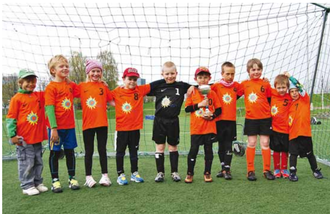
Võidukas Päikeseratta lasteaia võistkond.

Päikeseratta meeskond, kes paistis silma ka sellega, et meil olid ilusad oranžid oma laste-