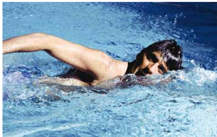
Tänavu on juba uppunud 13 inimest.

kuid paraku on joobeseisundis inimese koordinatsioon paigast ära. Ka kõige parema ujuja koordinatsioon on joobes olekus häiritud ning vaatamata heale ujumisoskusele võib ta uppuda. See kehtib nii alkoholi- kui narkojoobe korral.