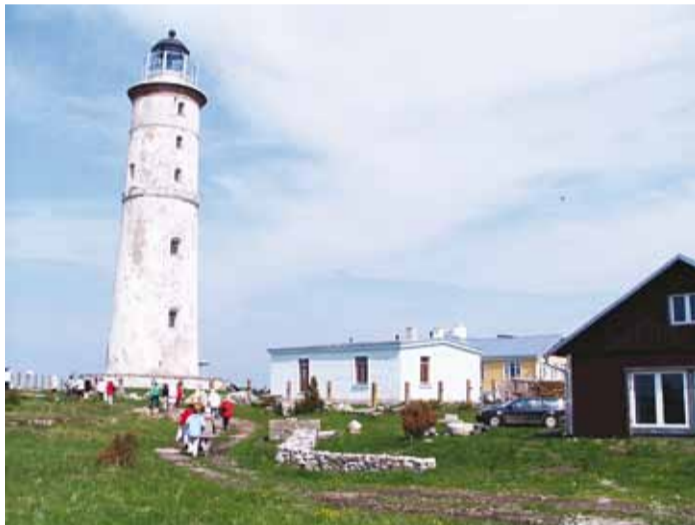
Teel Vilsandi majaka juurde.