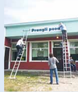
Pood sai ka uue sildi.

Kui mujal väiksemates maakohtades suletakse kauplusi, siis Pranglis juhtus vastupidi.