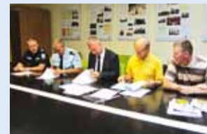
Leping saab allkirjad.

14. juunil moodustati Kesk-Kaare tee 2 valla 16. naabrivalve sektor.