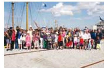
Invaühingu pere sadamas.

Lapsed, kes ühingu loomise ajal käisid alles lasteaias, on noorukiikka jõudnud, muutunud on nii rõõmud kui ka mured. Samas on tore tõdeda, et oleme üheksa tegevusaastaga ka arvuliselt kasvanud, lisandunud on uusi liikmeid, mis tõendab, et meie tegemistest on abi ja tuge peredele, kus on sirgumas erivajadusega laps.