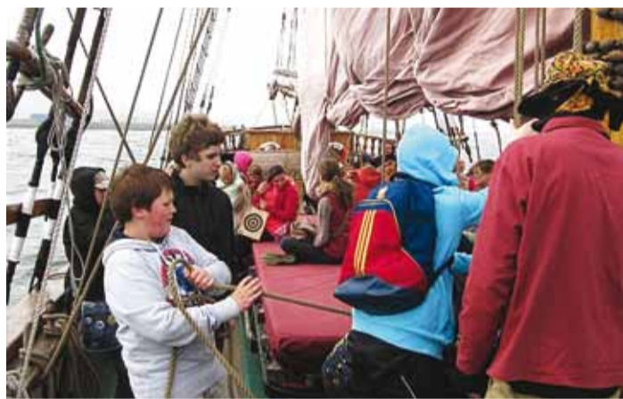
Purjelaeval sai osavust ja jõudu proovida.

Esiailgu oli nähtav udu tõttu väga halb, ei näinud reelingust kaugemale. Kapteni loengu vahele lasti udupusinat ja elavamaks muutus olukord siis, kui teistelt laevadelt udupusuna hüüid vastu kajas. Pärast kahe-tunnist merel seilamist sai kuumat suppi ja morssi.