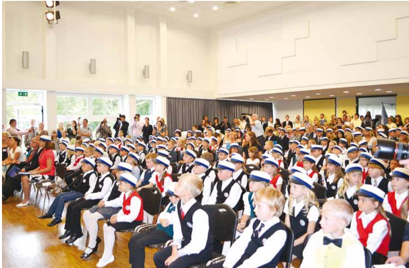
Lõppeva kooliaasta 1. septembri aktus Viimsi Kooli Karulaugu majas.

Kui koolis õpetatakse, et viisakas inimene sõõb noa ja kahvliga, aga kodus isa toetab küünarnuki lauale ja selle asemel, et kahvel suu juurde viia, kummardub taldriku kohale hiiglaslikku suutäit sisse vohmima, tekivad lapsel üsna