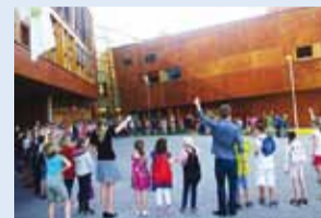
Koolipäev algas ühisringis.

5.–14. juunini toimus Viimsi Koolis suvekool Noored Kooli. Kaheksa päeva jooksul toetasid 14 Noored Kooli 7. lennu õpetajat 117 Viimsi Kooli 1.–8. klassi õpilaste inglise keele, funktsionaalse lugemise või matemaatilise-loomulise mõtlemise arengut.