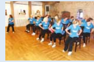
Viimsi proud eestvõimlejaid vanalinna päevadel.

Tänavuste Tallinna vanalinna päevade tervisepäeva üheks sisukamaks ning edukamaks ürituseks kujunes “Tervete liigeste saladus”.