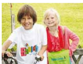
Võõrkeelt saab lõbusalt õppida.

Ka sel suvel ootab Helen Doron English Viimsi Huvikool lapsi vahvatesse õppe- ja puhkelaagritesse. Valik on saanud täiendust – lisaks kursusele I am the World saavad lapsed end proovile panna ka kursusel English Through Drama .