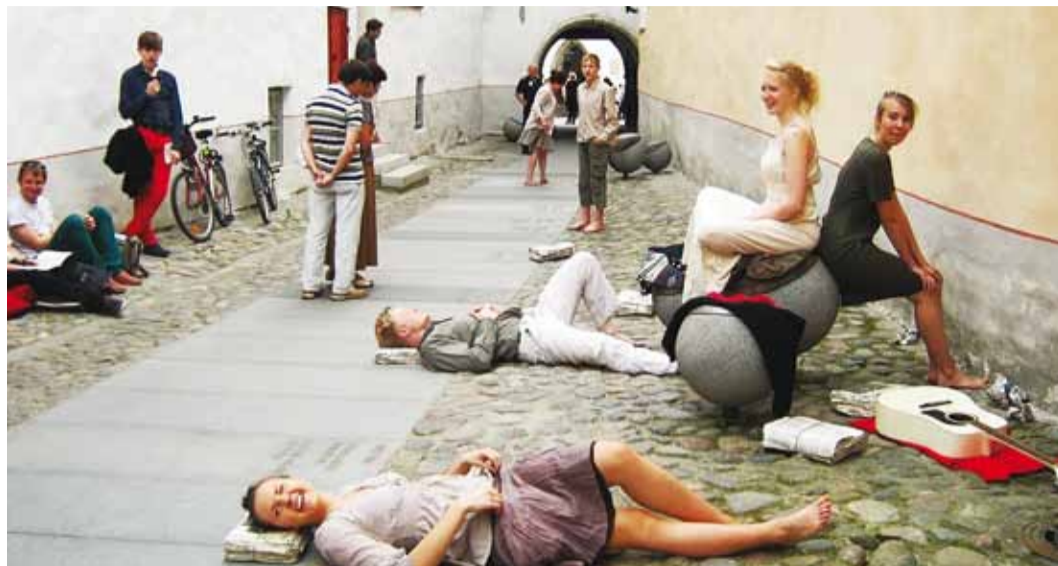
Kooliteater mängis ka Tallinn vanalinnas Börsi käigus.

Algkool: I laurea – Viimsi Kooli algklasside näitering “Kui need kooliseinad võiksid rääkida”, juhendajad Elle