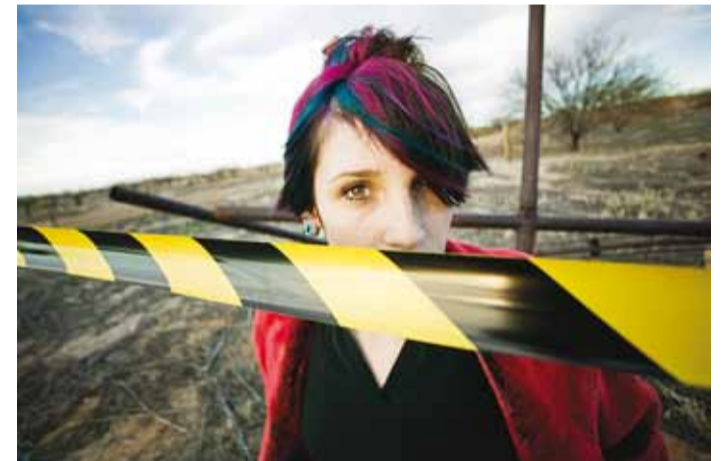
Pilootprojekt kutsub noori tänaval märkama.

Alates 2012. aasta novembrikuust on MTÜ RuaCrew eestvedamisel Viimsi vallas aset leidnud mobiilse noorsootöö käivitamise pilootprojekt "MNT kui kompleksne lähenemine: Märkame noori – tänaval, kodus, koolis!". Projekti rahastab Eesti-Sveitsi koostööprogrammi Vabatahtlaste Fond ja Kodanikuühiskonna Sihtkapital. Projekti raa-