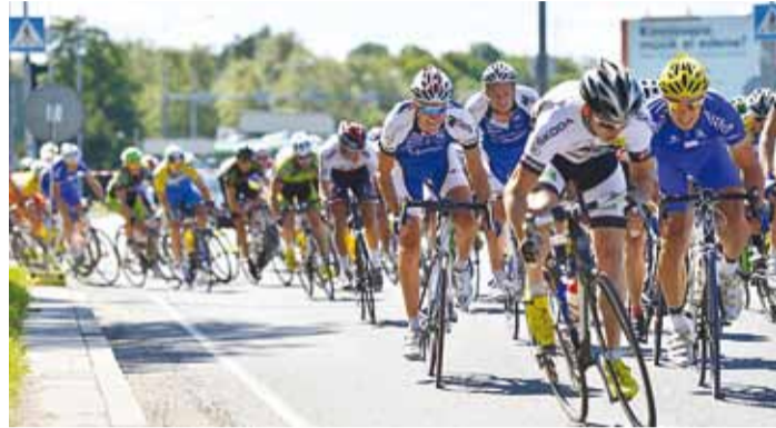
Hetk Lauri Ausi mälestusvõistluselt.

Kõik sõidud algavad Pirita kloostri esiselt alalt – harrastajatele ja noorsportlastele mõeldud eelregistreerimisega Maxima GP rahvasõidu start antakse kell 11, peresõidule starditakse kell 11.05 ja tillusõidule kell 11.30. Publikule on võistluste jälgimine tasuta, samuti on tasuta pere- ja tillusõit.