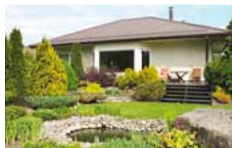
Kaunis kodu Kelvingis.

Kodukaunistamise Harjumaa Kogu hindas eelmisel nädalal konkursi Eesti kaunis kodu 2013 raames omavalitsuste esitatud objektide kategooriates eramud ja korrusmajad, maakodud ning ühiskondlikud hooned ja ettevõtted. Tänavusele Harju maakondlikule konkursile esitasid 13 omavalitsust