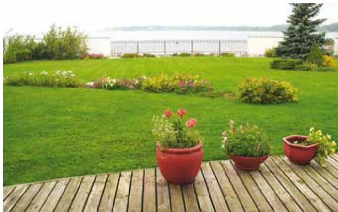
Viimsi kaunis kodu 2012 Miidurannas.

Selle pika ajaga on pärjatud kõrge tunnustusega 42 kodu. Nominente on aga kordi rohkem. Tegelikult saame pea 81% kodude kohta öelda kaunis kodu. Selleks, et elamispaigast saaks kodu, peab sinna südamesoojust sisse panema. Kui seda on tehtud, siis nendele, kes seal elavad, on see ka kaunis. Seepärast ei saa fikseerida kindlaid mängureegleid, kuid oleks sätestatud, mis peab kaunis kodus olema. Esmatähtis on, et see oleks kodu. Alles