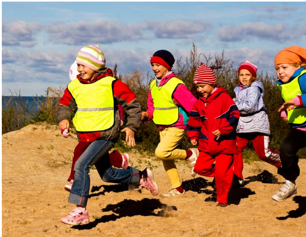
Rannajooksul osales kokku ligi 300 last

Jooksul kogetu põhjal võib väita, et kõige kiiremad õpetajad kasvatavad lapsi Haabneemes. Päikeserattas oli Piilupesa järel ka üks arvukamatest osalejatest lastejooksudes. Lisaks neile oli osalejaid Pargi lasteaiast ning Kelvingist.