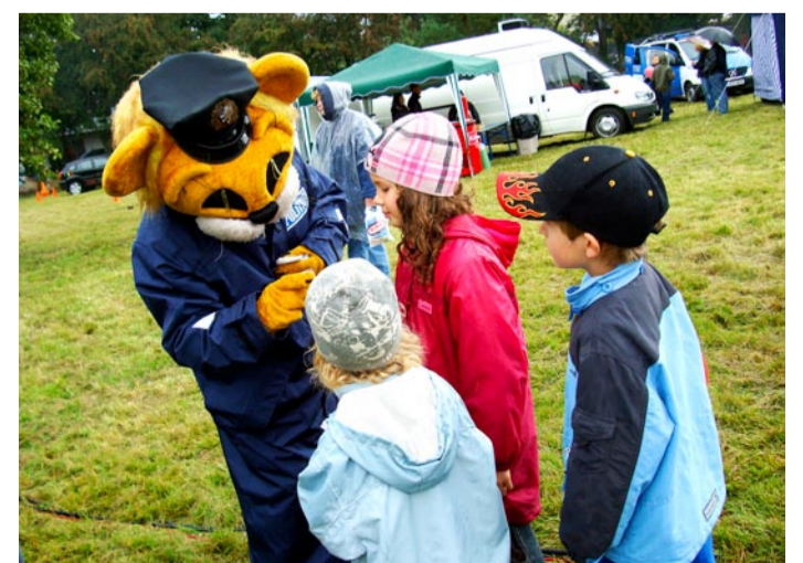
Lövi Leo tunnistab, et lapsed kipuvad teda kartma ning lastevanematele meeldib ta alati rohkem kui lastele.

Soovime kindlasti Viimsi turvalisuspäevast teha iga-aastase meeldejäeva ürituse Viimsi vallas.