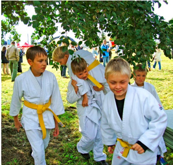
Spordiklubi Viimsi Judo poisid: „Turvalisuspäeval on kõige toreloom tuletõrjajate demonstratsiooniesinemine ja maitsvad kommid, mida jagavad kiirabi ja politsei.“