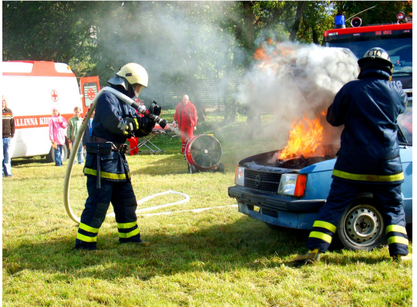
Vabatahtliku reservpäästerühma populaarne demonstratsioon