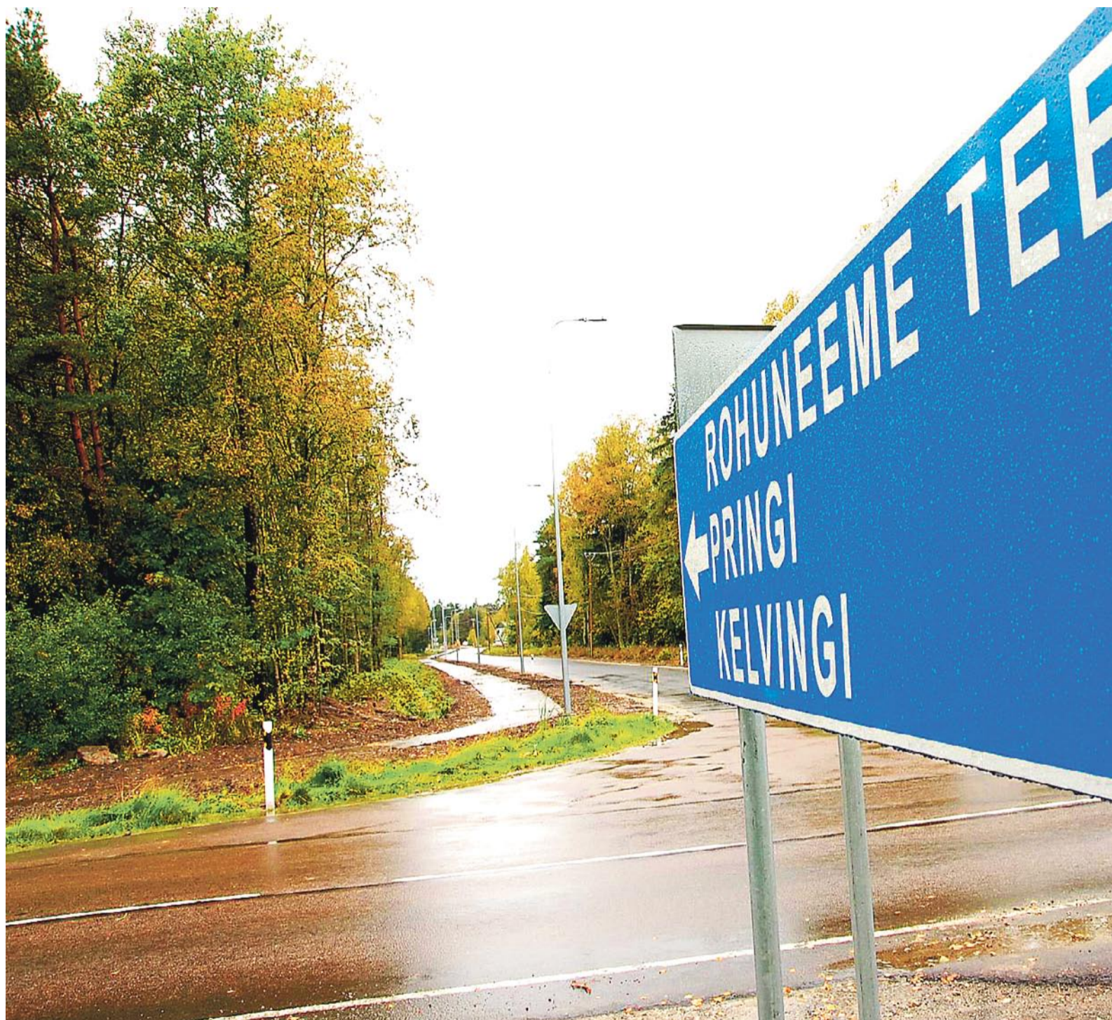
Kauaoodatud Kelvingi-Leppneeme tee on valmis