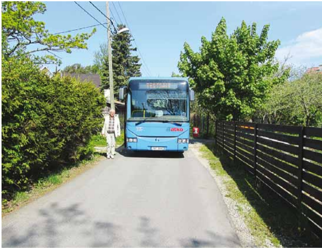
Buss ja jalakäija Luhaääre teel – teemaale on istutatud hekk ja osaliselt ulatub sinna ka aed.

Et seda kõike saavutada, on teede jaoks ette nähtud eraldi transpordimaa sihtotstarbega kinnistud/ katastriüksused – teemaad. Teemaa on seega eraldi maatükk teetarindite, teesade ja tee-elementide paigaldamiseks ning tee korrahoiuks. Näiteks haljastust, aedasid, ilukive, peenraid, liivakoormaid, lauavirnasid jmt ei tohi teemaale paigutada ega hoiustada. Tee on rajatis, mis paikneb teemaal. Teeseaduse kohaselt korraldab teehoiudu tulenevalt omandivormist omanik, seega riigimaantee osas riik, eratee osas eraisik ja kohalike teede osas vallavalitsus. Nii ongi Viimsi valla kohalike teede teehoiutööde korraldamine vallavalitsuse üks seadusest tulevaid kohustusi.