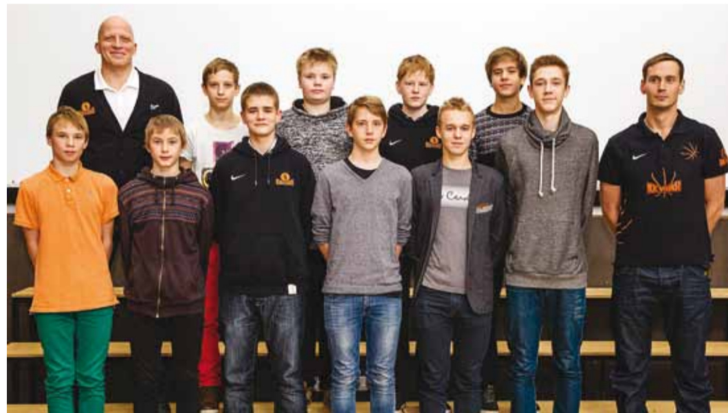
Korvpalliklubi Viimsi Poisid C1 vanuseklass ja treenerid.