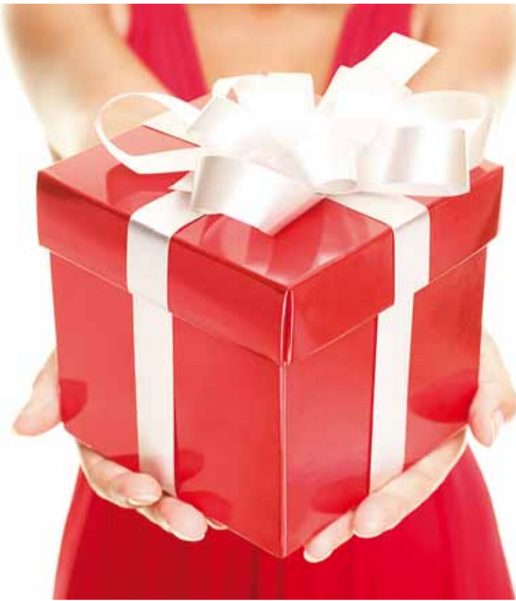
Kingirõõm peaks kestma kauem kui vaid ühe öhtu.

Teiste tarbimiseks mõeldud laenu puhul, mida pakuvad nii pangad kui teised laenuandjad ning mille intress ja muud tingimused on SMS-laenudest üldjuhul soodsamad, tasub endale aru anda, et tegemist on rahalise kohustusega. Muide,