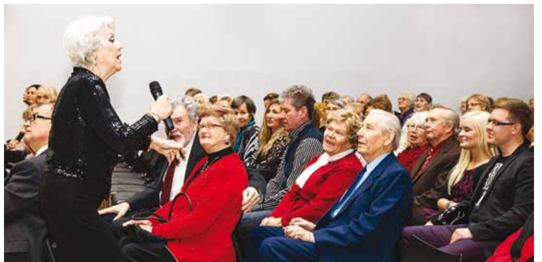
Heidi Tamme pani publiku endaga kaasa laulma.

Laste kontserdi järel astus saali ette Heidi Tamme. "Tervist, endised horoskoopplased," kuulutas armastatud lauljatar ja teenis kohe suure aplausi. Ja siis algas kontsert, kus laulja liikis saalis rahva seas, pani publiku heldimusega laulutaktis kaasa õõtsuma nagu viljapõllu ja isegi püsti seistes kaasa laulma. "Saime hoo sisse!" hüüdis Heidi Tamme ja jätkas ikka ho-