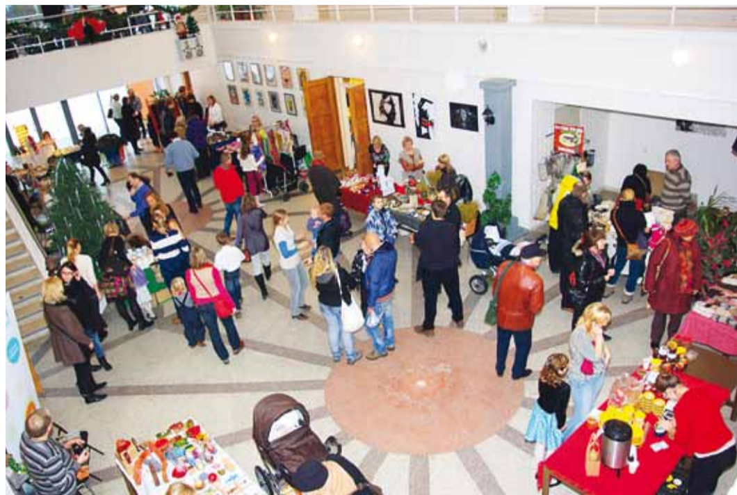
VT Jõululaat Viimsi Huvikeskuses.

See laupäev oli sisukas nii suurtele kui väikestele.