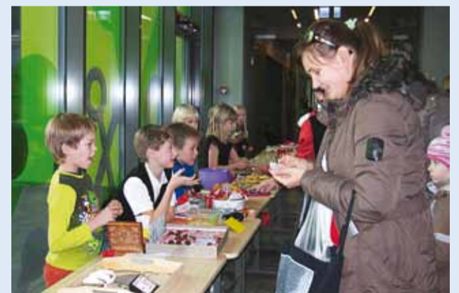
Tundide vaheajal käis koolis vilgas ostmine ja müümine.

Viimsi Invaühingu heategevusballi eel peeti valla koolides jõululaata, mille tulu läks invallaste heaks.