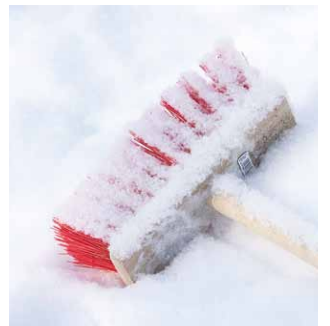
Ärme oota talgud, koristame kohe.