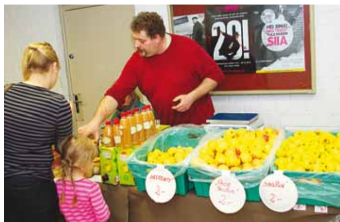
Laadalt sai ka tervislikku kodumaist kaupa.

Eelregistreerimine: tel 5904 5023 või e-mailil pilletali@gmail.com