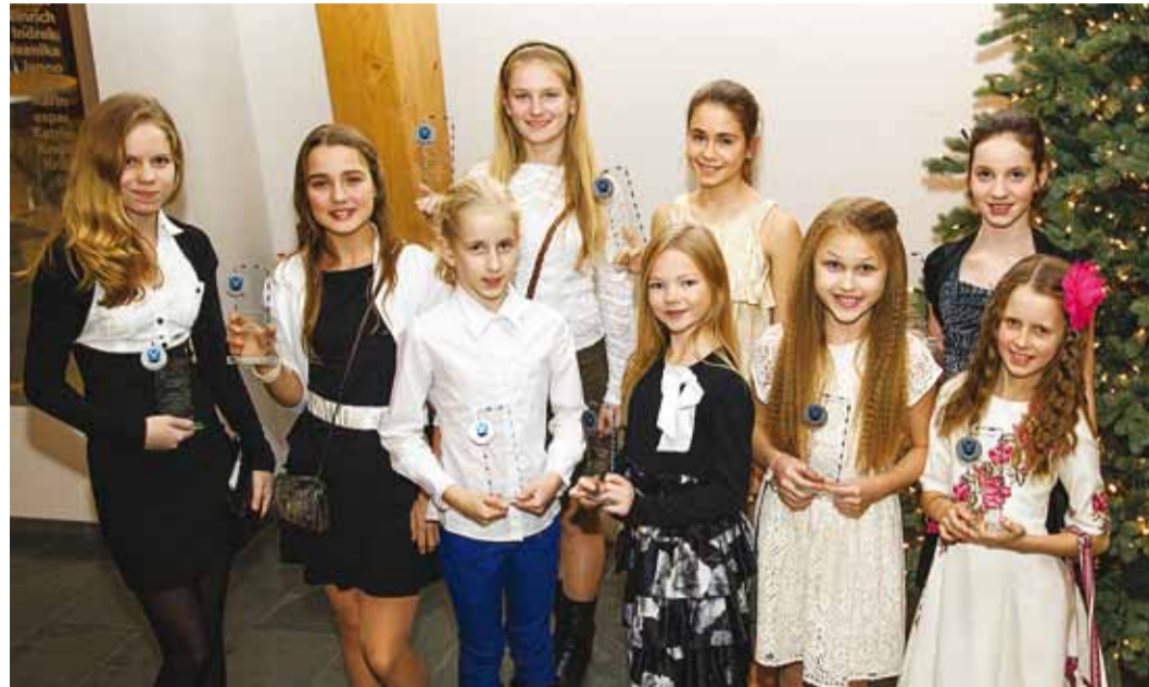
Rulluisutajate klubi Rullest võidukad tüdrukud.