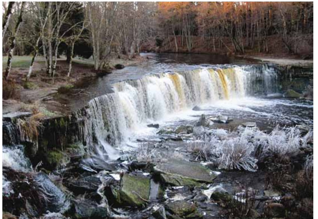
Mitmekesise maastikuga Keila-Joa park ja Keila juga.

Meie sõit kulgeb edasi Paldiski linna poole. Linna tunnuslause on "roheline energia linn". Sõidame mööda tuulepargist. Täna on Pakri poolsaarel 26 tuulikut. Näeme Paldiski tollivaba tsooni sadade sõiduautodega, mis ootamas edasiviimist. Kaame Paldiski jaamahoonet ja laiarööpmelist raudteed.