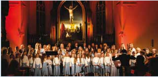
Maire Eliste muusikakooli koorid Jaani kirikus.

See tundub olevat nii lihtne – korraldada jõulukontsert. Maailmas on palju head muusikat. Ainult vali... ja jõulud oma väljakujunenud kommetega korduvad ju igal aastal, samuti ka jõululaulud.