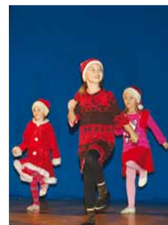
Saalis esinesid lapsed.