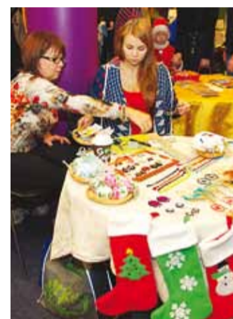
Kingivalik oli lai.