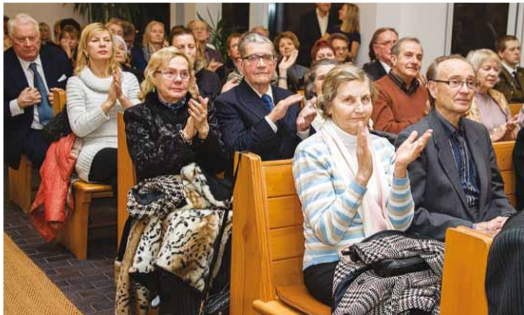
Adventikontserdil oli kirik rahvast täis.

Viimsi vald asutati 26. jaanuaril 1919. a ja liideti Iru vallaga 1939. a ning taastati iseseiva vallana 20.12.1990.a. Vald asub 73 km 2 -l. 1. dets. 2013. a seisuga on vallas registreeritud 17 838 elanikku. Vallas on 2 alevikku, 20 küla ja 15 saart.