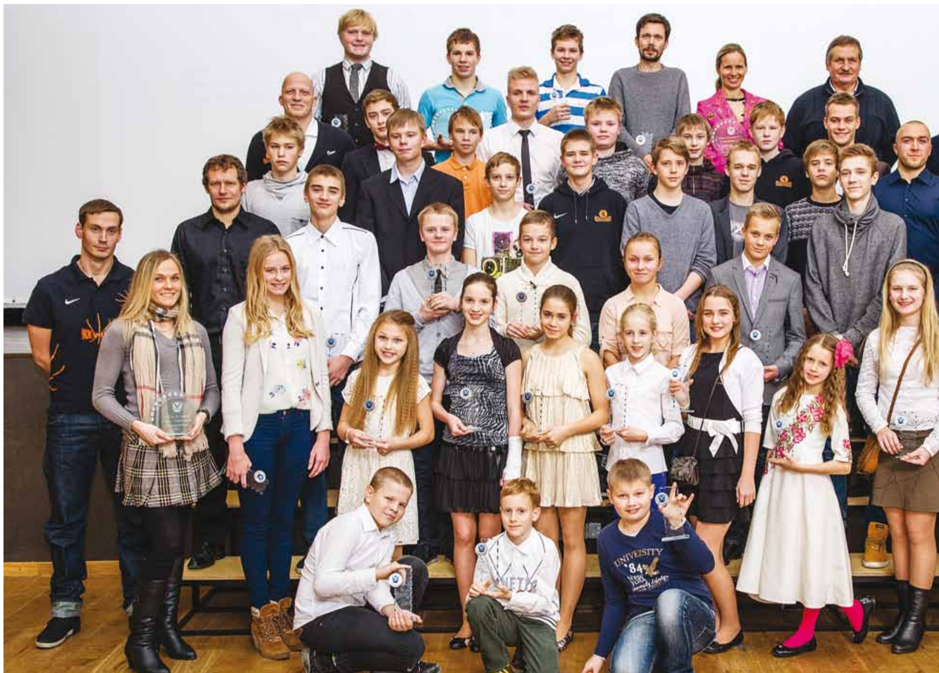
Sellele pildile mahtusid kõik, kes pälvisid tunnustust ja olid sel pidulikul õhtul kohal Viimsi Koolis. Fotod Aime Estna. Rohkem fotosid vaata ja telli www.fotograafid.ee

Spordiaasta teo nominente oli samuti kolm: Rein Ottoso-