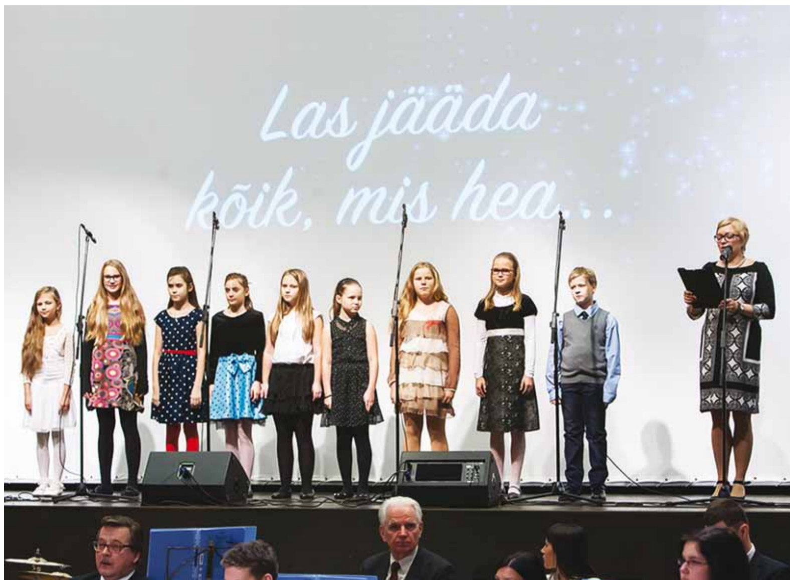
Balli esimesed esinejad olid Viimsi Huvikeskuse laulustudio lapsed.

Vald tunnustas parimaid sportlasi. Loe lk 16-17