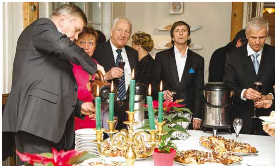
Valla aastapäeva puhul pakuti rannarahva muuseumis kringlit ja kuumajooki.