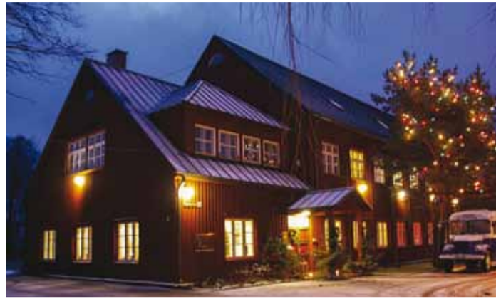
Rannarahva Muuseum särab kutsuvalt tuledes.

21. ja 28. detsembril on Viimsi Vabaõhumuuseumis taluturu jõuluturg kolinud pühade puhul kuuse alla. Müügil verivorstid, kasad, leivad, vorstid, singid, hoidised ja palju muud põnevat kodumaist kraami