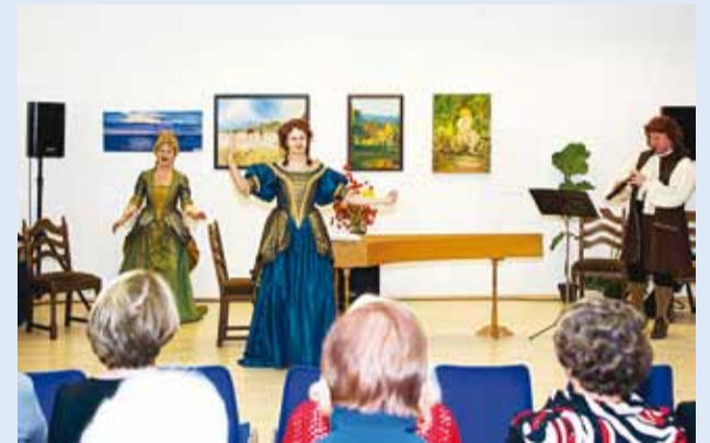
Esineb ansambel Tallinn Baroque.

Reedel, 6. detsembril oli Viimsi Päevakeskuses käsitööringide jõululaat.