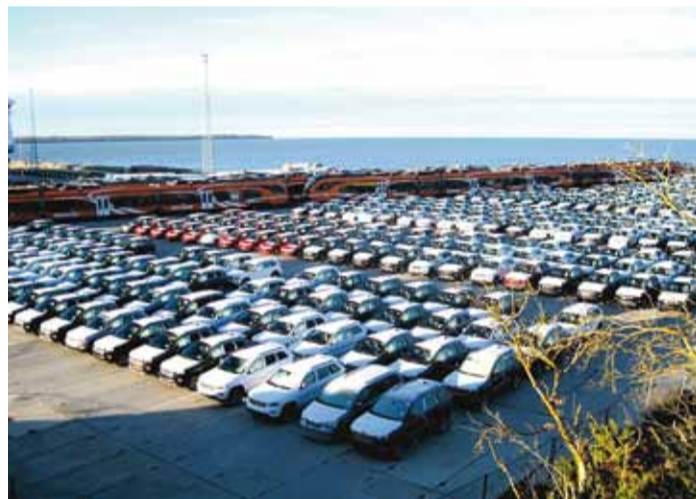
Selline on Paldiski sadam.

Lõunat sööme Paldiski linna Tolli Tavernis, kus pakutakse kuumu suppi ja pirukat. Kuna organism ei ole veel külmakraadidega kohanenud, siis on õues üpris vilu ja tuulepoiss aitab kaasa, nii et kuum supp soojendab meid hästi üles. Soe kontides, sõidame Padisele tsistertlaste kloostrile varemide vaatama, mille rajasid Dünamündest pärit mungad 14. sajandil. Kloostr on pika ja huvitava ajaloo, praegu korraldatakse seal kontserte ja kultuuriüritusi.