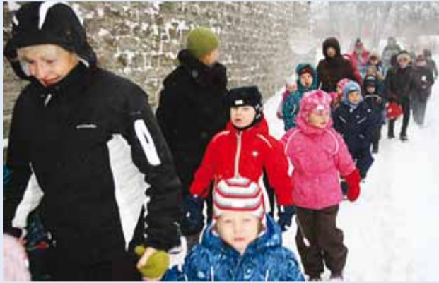
Läbi tuisu rõõmsalt teatrisse.

Torm Moonika tekitas paraja ärevuse reede hommikuks, mil Püünsi Kooli algklassid ja laste-aed valmistusid külastama Eesti Nuku- ja Noorsooteatrit, et minna vaatama jõuluetendust "12 kinki jõuluvanale".