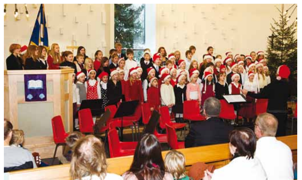
11. detsembril oli Püha Jaakobi kirikus kaunis kontsert, kus esinesid Viimsi Muusikakooli õpilased koos oma õpetajatega. Kuulajad said aimu sellest, kui mitmekülgset muusikaharidust on selles koolis võimalik omandada ja kui andekad lapsed seal õpivad. Lisaks peaaegu kõik lapsed ka laulavad kooli kooris ning paljud mängivad orkestris. Pildil laulavad kooli laululapsed. Foto Aime Estna

4. jaanuaril 2011 algusega kell 16.00 toimub Viimsi vallamaja (Nelgi tee 1) II korruse saalis Haabneeme aleviku, Laivi maaüksuse detailplaneeringu eskiislahendust ja lähteseisukohti tutvustav teine avalik arutelu. Detailplaneeringu koostamise eesmärk on sihtotstarbe muutmine üldplaneeringujärgsest tootmisaast elamu- ja ärimaaks, lasteaia kavandamine, avaliku pargiala moodustamine ning perspektiivse randa ja aleviku keskust ühendava jalakäijate promenaadi planeerimine.