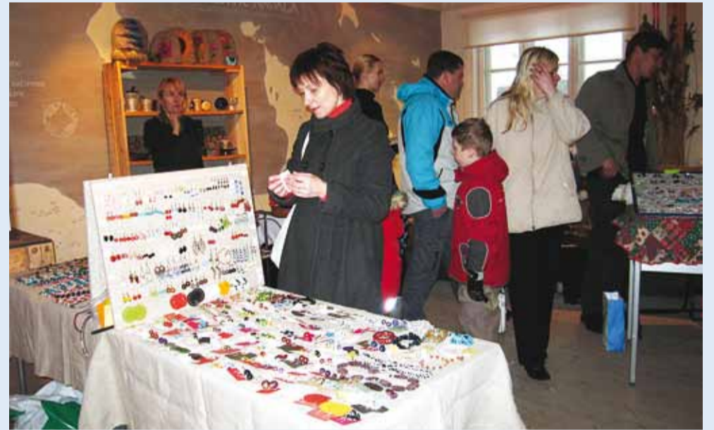
Laadalt sai osta ainulaadseid ehted.