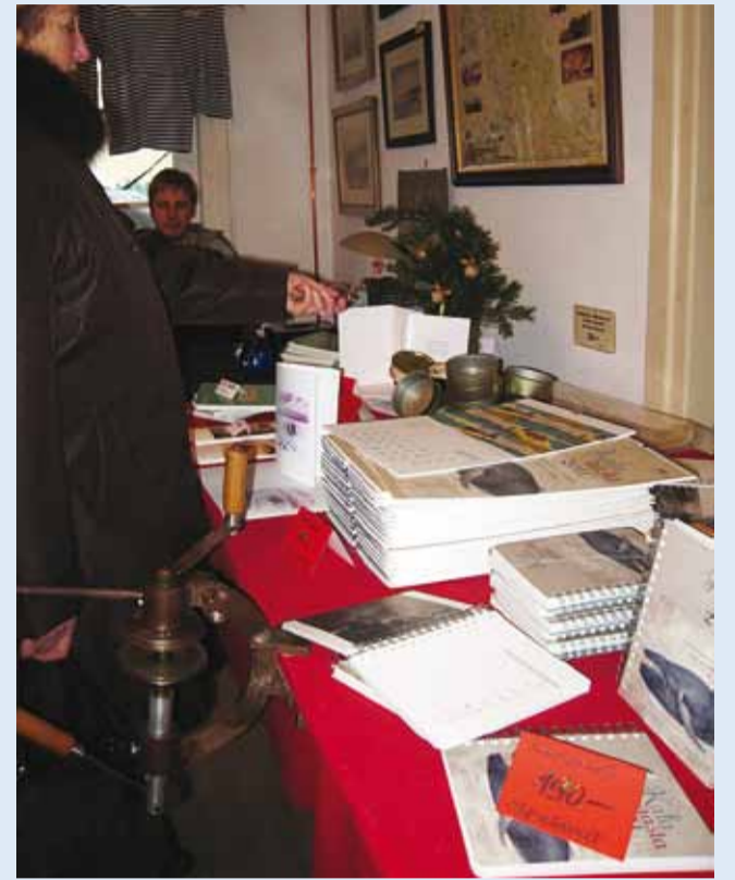
Alar Mik Muuseum müüs ka oma kaupa.

Külastajaid käis oodatust rohkemgi – muuseumi jõululaada traditsioon on saanud rahva poolehoiu.