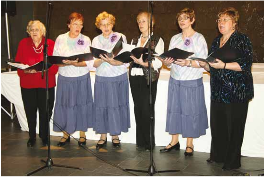
Laulavad Randvere seeniorid. Veel fotosid vaata www.segasumma.planet.ee/viimsi .