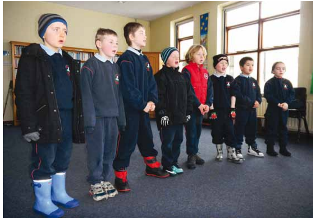
Läbi lume saabunud Whitecross Primary Schooli õpilased kaugetele külalistele laulu harjutamas.

Eesti maskott sai ka Iirimaaale kaasa võetud ning seitsme kooli maskottide konkursil osutus Püünsi oma võitjaks, niisiis on projekti "How Big is your Foot" maskott pärit Eestist. Maskotiks sai seitsme varbaga jalajalg, varbaküünteks on erinevate osalejariikide lipud. Jalajälje värvid lähevad punasest rohelisest mõttega, et mida väiksem on jalajalg, seda rohelisem see on. Embleemide seas