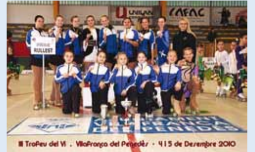
Rullest Hispaania võistlustel nelja auhinnalise koha karikaga.

MM-ist võttis osa ligi 1000 sportlast 25