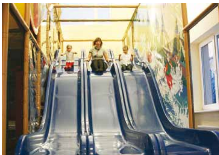
Liugu saab lasta terve korruse kõrguselt.

Kahekorruseline 1000 m 2 suurune laste mängu- ja lõbustuskeskus ehk mürala on iga lapse ja lapsevanema unelm. Sellist suurt ja sisukat müralat pole üheski teises Eesti spaas. Siin on avarust, valgust ja palju põnevaid tegevusvõimalusi, nagu näiteks sumokostüümid, mille sees võib ennast tõelise sumomehena tunda ja mitte ainult tunda, vaid ka liigutada. On pallimered, eraldi suuremate-