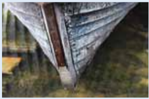
Paat on kaluri töövahend.

Rannarahva Muuseum koolitab koostöös MTÜ-ga Harju Kalandusühing ja MTÜ-ga Räimeühing tulevase ja praeguseid rannakalureid.