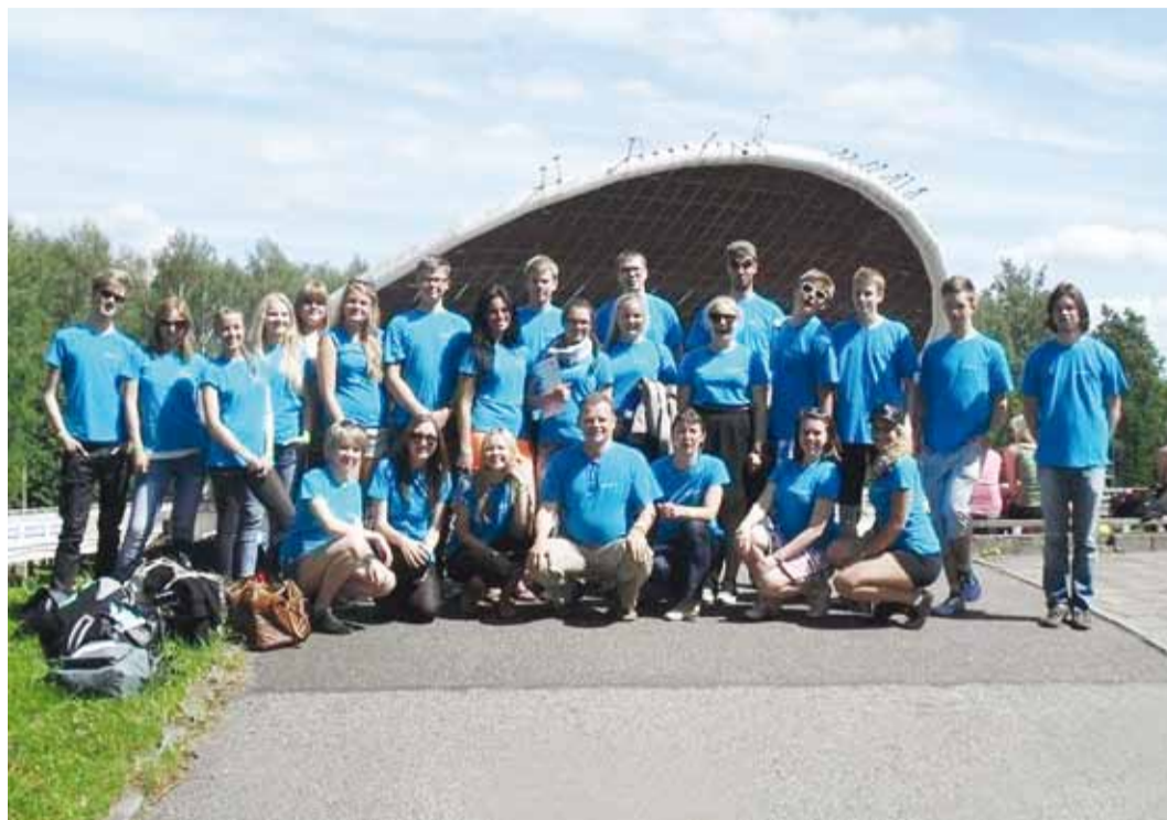
Viimsi Keskkooli Noortekoor Tartu Lauluväljakul.

Omaette elamuseks oli paljudele peol osalenud noortele ja lastele laulmine koos meie