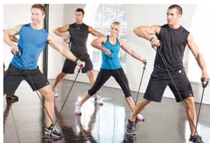
CXWORKS treeningus lisab koormust kummituubi kasutamine.