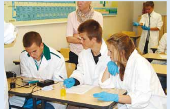
Õpilased mullusel teadlaste ööl.

Reedel, 21. septembril kell 19–21 toimub üritus “Teadlaste öö Viimsi Koolis”. Sel õhtul poevad laboripimedusest nähtavale ja pühivad tolmu kitlitelt selline liik elusolendeid nagu TEADLASED.