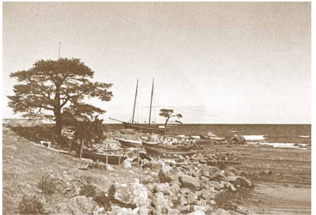
Vaade rannamaastikule 20. sajandi alguses.

Üldiselt on Uutmaa maalid otsekui vaated mingisugusesse ideaalmaailma, kus elab ja hingab rannaküla kõigis oma askeldustes ja toimetustes. Elu lõpupoole muutuvad tema maalid küll inimitühjadeks ning näeme järjest enam ainult