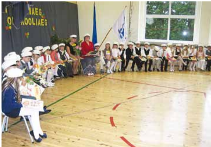
1. september Püüsi Koolis.

Taas on alanud uus kooliaasta. Viimsi valla koolides alustas õppetööga 1795 õpilast, mis on 95 õpilast rohkem kui eelmisel õppeaastal.