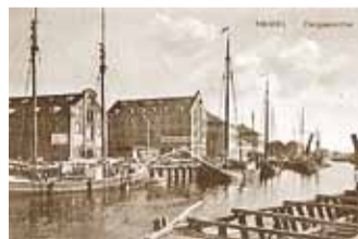
Meemeli linn Saksamaal, praegune Klaipeda Leedus.

"Sõitsime Saksamaalt välja, et üle Läänemere Soome lahe-