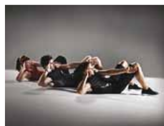
Treening on intensiivne.

sobib nii meestele kui ka naistele, niihästi algajatele tervisesportlastele kui ka neile, kes pidevalt treenivad. Kõik on tere- tulnud, kes soovivad tugevdada oma kerelihaseid, ennendada seljavalusid ning unistavad saledast taljest ja kaunitest kõhulihastest.