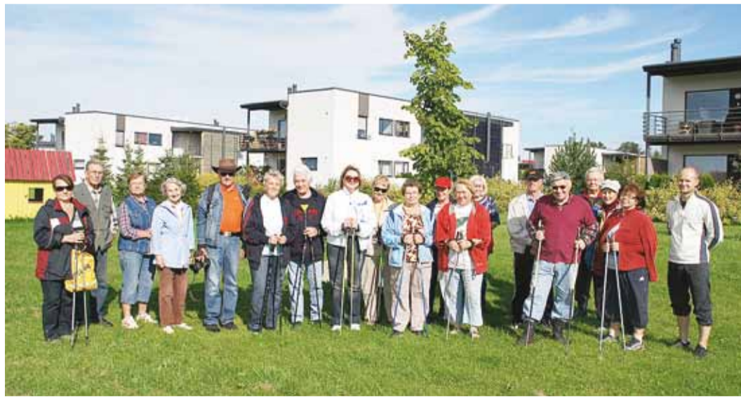
Koduvallaga tutvuvad matkajad tegid Pärnamäe külas ühispildi.