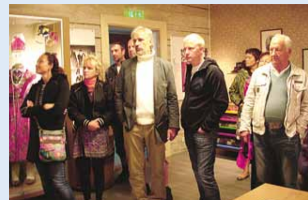
Külaskäik Kihnu muuseumi.

MTÜ Põhja-Harju Koostöökogu eestvõtmisel toimus 10.–11. augustini õppereis Pärnumaale tutvumaks LEADER-programmist rahastatud MTÜ Pärnu Lahe Partnerluskoogu koostööprojektiga “Romantiline rannatee”.