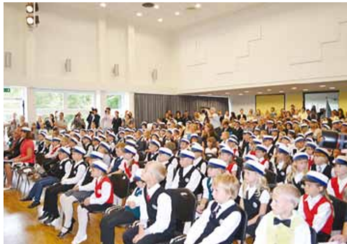
1. september Viimsi Kooli Karulaugu majas.

Viimsi Kooli avas 2012/2013 kümme esimest klassi, millest