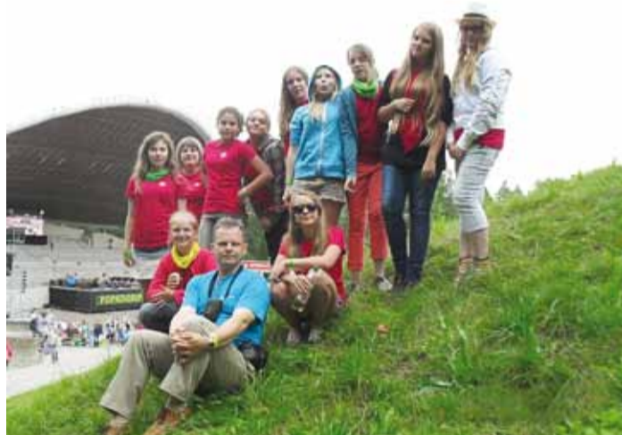
Neidude koor Tartus popkooripeol.

nimekate popstaaridega, keda esindasid Koit Toome, Birgit Öigemeel, Orelipoiss Jaan Pehk, Genka, Tõnu Aare, Jaan Arder, Jaanika Sillamaa, Hedvig Hanson, Maarja-Liis Ilus, Uku Suviste jt. Teismeliste autogrammikutide erilise tähele-