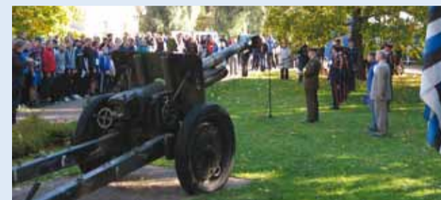
Mullune võistluste avamine Laidoneri pargis.

Jooksu korraldajateks on taas Eesti Spordiselts Kalev ja Johan Laidoneri Selts. Ka koht ei ole muutunud – ikka Laidoneri mõisa ümbrus ja park.