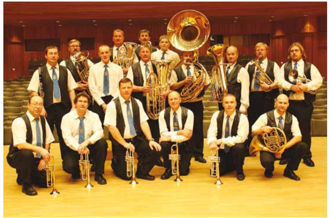
Avinurme puhkpilliorkester augustis 2010, kui esineti koos Viimsi segakooriga.