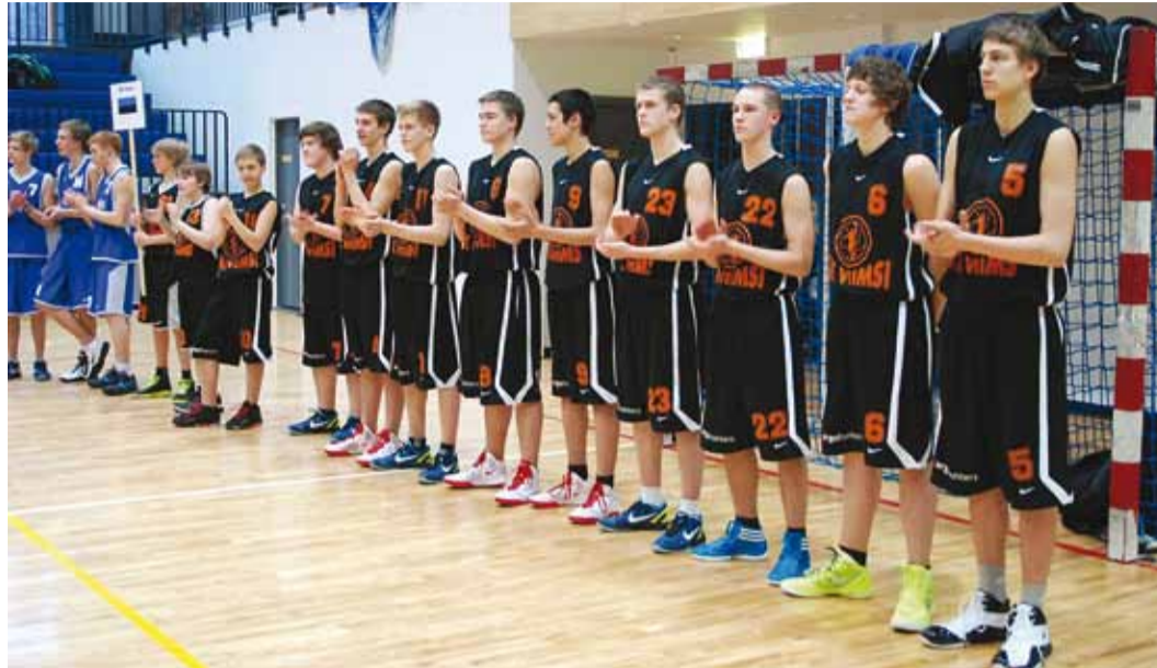
KK Viimsi võistkond võistluste avamisel.