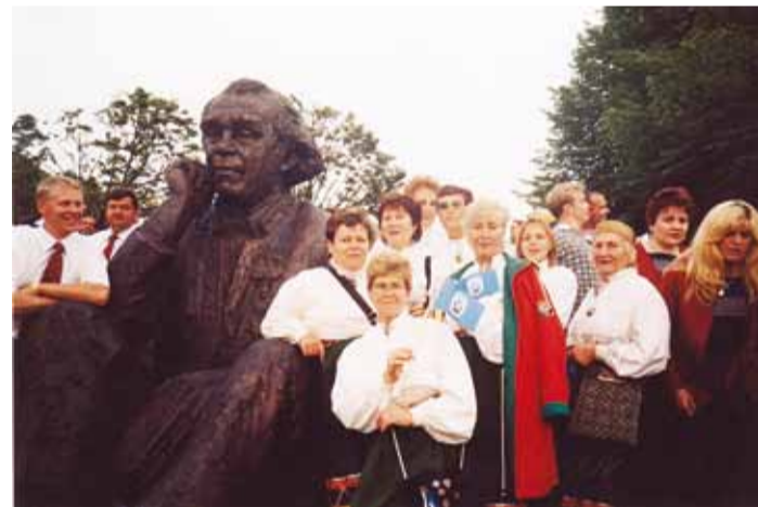
Tervitus laulutaadile XXIV üldlaulupeol 2004. aastal

Laulsime vastastikku, tantsisime ja mängisime ringmänge, itaallased võtsid kõigest aktiivselt osa. Oli imeilus su-