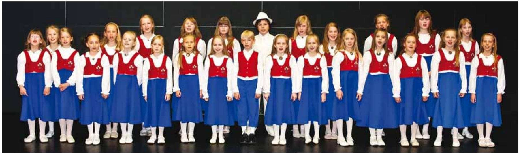
Maire Eliste muusikakooli laululapsed.

Lavakogemuse ja -julguse kasvatamiseks korraldab kool avalikke kontserte. Nii on esinenud Estonia kontserdisaalis, Pärnu ja Vanemuise kontserdimajas, Viljandi Pärimumuusika aidas, Pärnu Eliisabeti kirikus, Tartu Salemi kirikus, Haapsalu toomkirikus, Tallinna Jaani ja Kaarli kirikus, Piri-