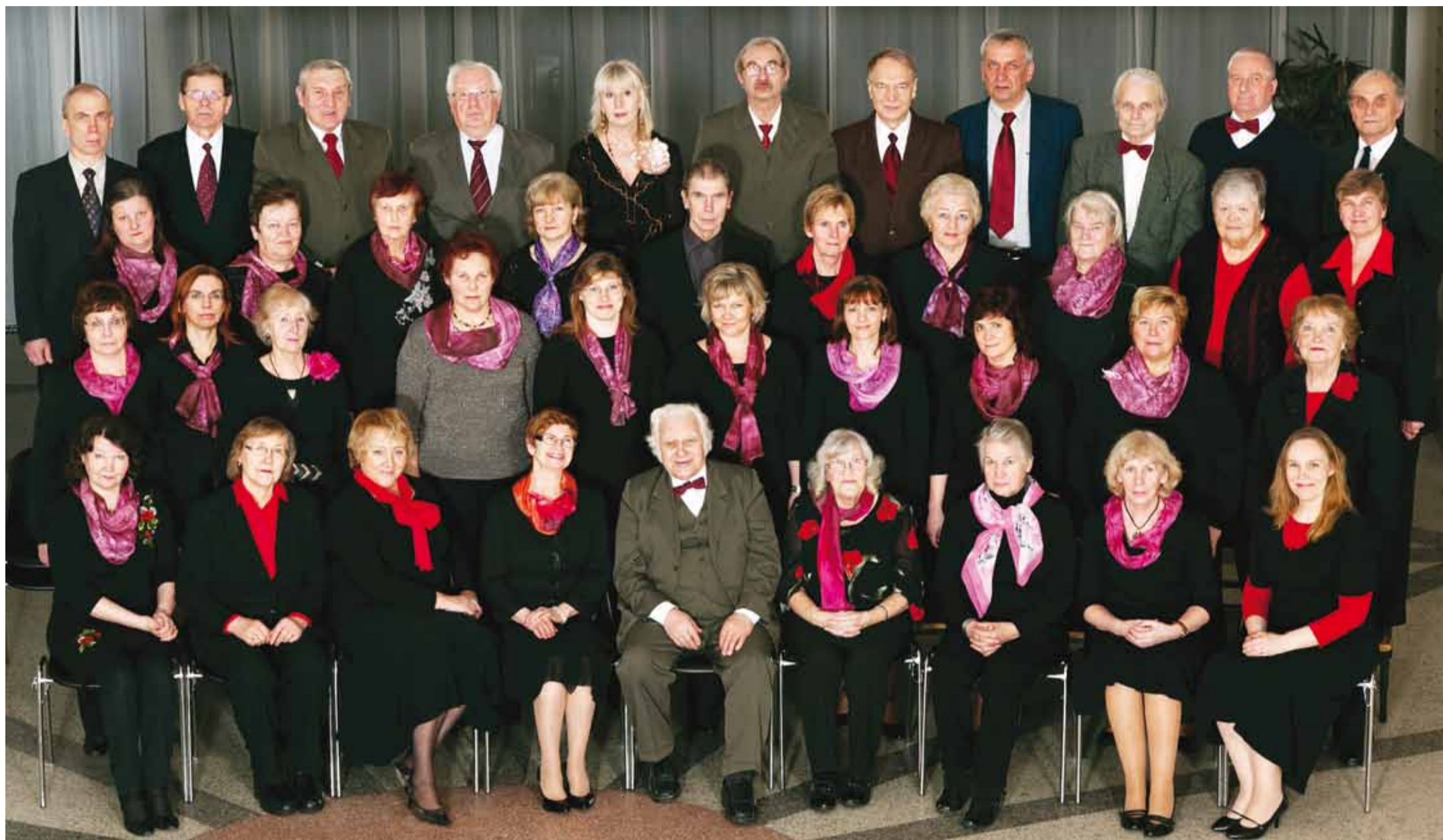
Segakoor Viimsi 30. sünnipäeva eel.