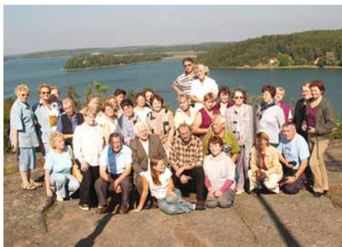
Foto meenutuseks reisist Ahvenamaale.