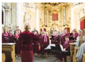
Kontsert Karlovy Vary kirikus.

kontsertidega Sankt-Peterburgis 2003. aastal. Kontsert oli Saksa kirikus, kuid laulsime ka