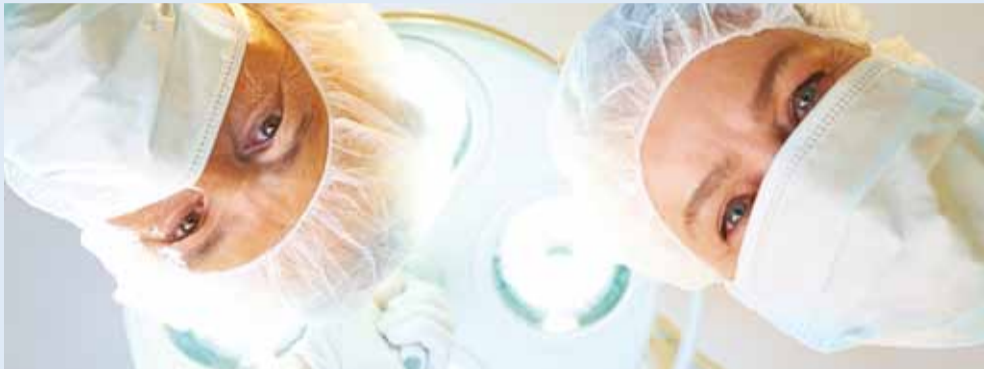
Patsiendil on õigus valida eriarsti ja raviasutust.

Teenuste saamiseks tuleb inimesel end registreerida järjekorda. Iseenesest mõistetakse on pikk ette registreerimine juuksuri juurde, mõnele kontserdile või ka autoteenindusse. Arstilt konsultatsiooni saamine ei ole siin erand. Paljud on kogenud ooteaegu, milleks enne registreerimist pole vaim valmis olnud.