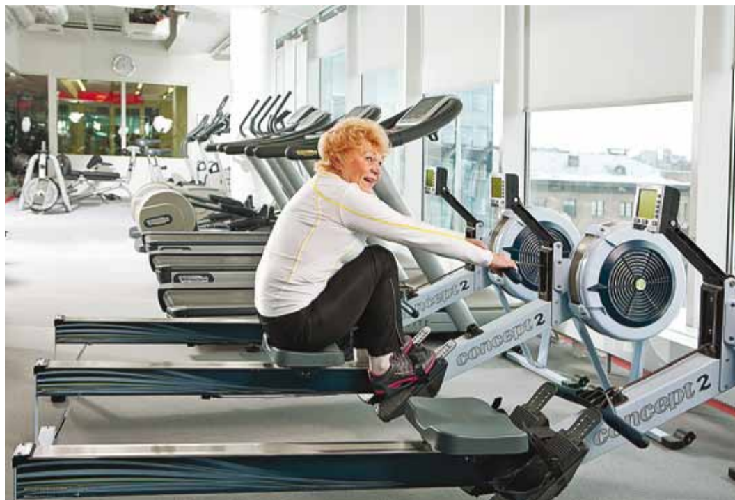
Organismi vastupidavust saab hästi parandada näiteks sõudeergomeetrial treenides.

Mida see endast kujutab? Raamatu autor Riku Aalto on üks personaalreitingu teerajajaist Soomes, kel on lai alda-