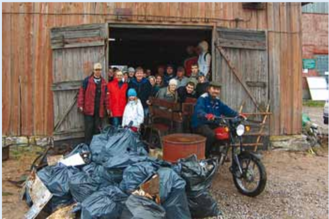
Pranglile tuli talgulisi isegi Tartust ja Saaremaalt.