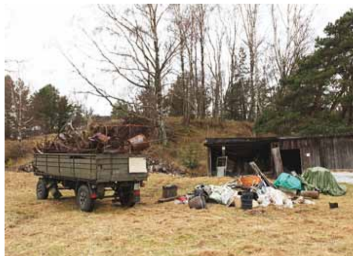
1. mail koguti üle Eesti tonnide viisi prügi ja jäätmeid. See pilt on Naissaare talgutelt.

Avaldus vaadatakse läbi, komisjon kontrollib objekti ja otsustab seejärel, kas annab vabastuse. Maist septembrini ei