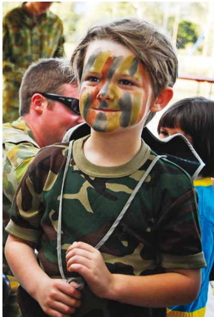
Muuseumiööil saab tutvust teha maskeerimisvõimalustega.

Just kunstnikud olid need, kes reaalse äratuntava objekti eksitavaks maskeeringuks, võtsid Esimeses ja Teises maailmasõjas aluseks kubismile omase vormikeele. Kubistid tegelesid oma teostes esinevate objektide abstraherimisega geomeetrilisteks kujunditeks,