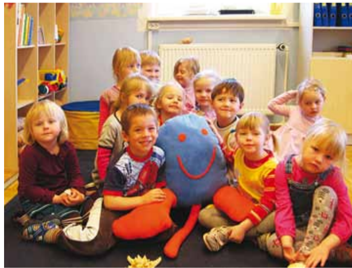
Noorem rühm oma maskoti Kombuga.

Meie kaheksajalgade kombitsatel on eriline võluvägi, mis annab edasi väärtusi, mida lapsed oma aruteludes kõige tähtsamateks pidasid. Kaheksajalad Misse ja Kombu on väga uudis-