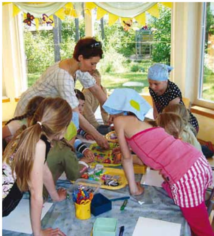
Suvelaagris toimub iga päev midagi põnevat.

Lasteaia suvi on igal nädalal uus teema, mille raames toimub erinevaid ettevõtmisi, nt Väike väänik anna asu, et ma suureks eal ei kasu – nädal segasummasuvis või Paremu, kui lapsel on oma peenar, olgu või väike, olgu või veerand. Lasteaia suvest saavad osa võtta kõik soovijad ka väljaspoolt maja KIIRE ABI raames, mis