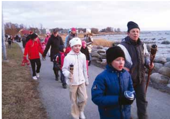
Põnev raamatupäev lõpetati jüriöö jalutuskäiguga.

Selle päeva tähistamisega tahetakse väärtustada raamatuid ja lugemist ning roosi kinkimisega ostjatele väljendatakse tänulikkust. Meiegi tagasihoidlik palve lapsevanematele oli sel