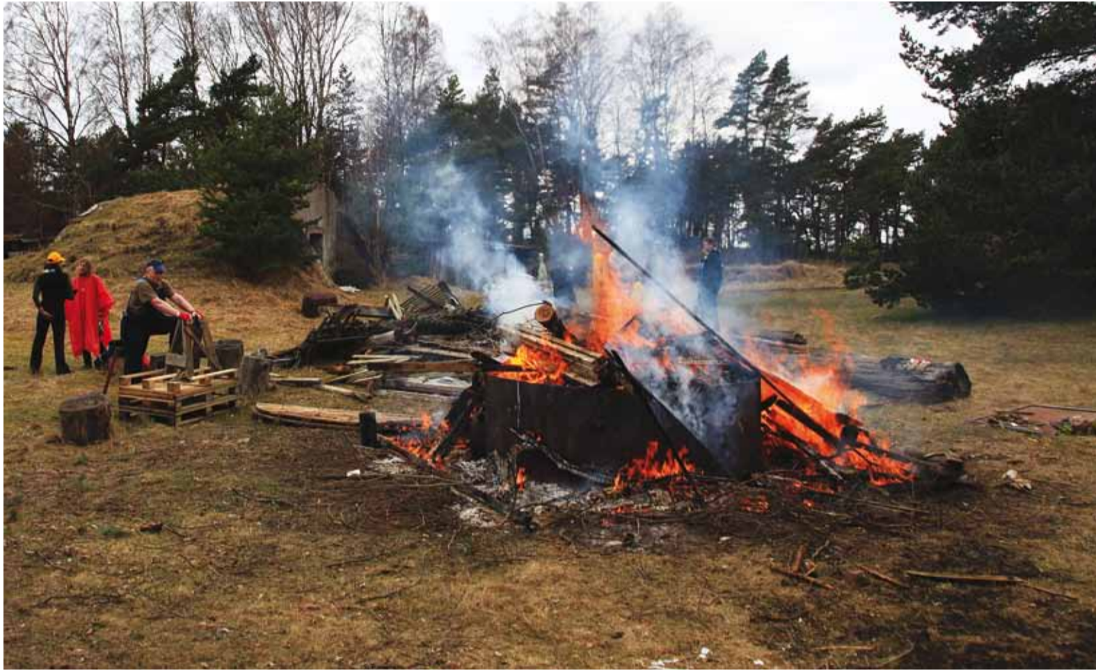
Talgulöke Naissaarel, kus talgulis on pildile vähe jäänud. See-eest on teisel pildil näha, kui palju sõitis rahvast Naissaarele tööle.