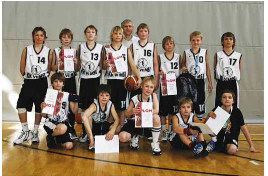
Edukad Viimsi korvpallipoisid.

Olime seekord mänguks hästi valmis ja suutsime oma västaga kohe käima saada. I veerandaeg möödus tasavägiselt, skoor 10:13. II viisik tegi kohe veerandaja alguses 12:0 vahespurdi, kuid siis mäng ta-