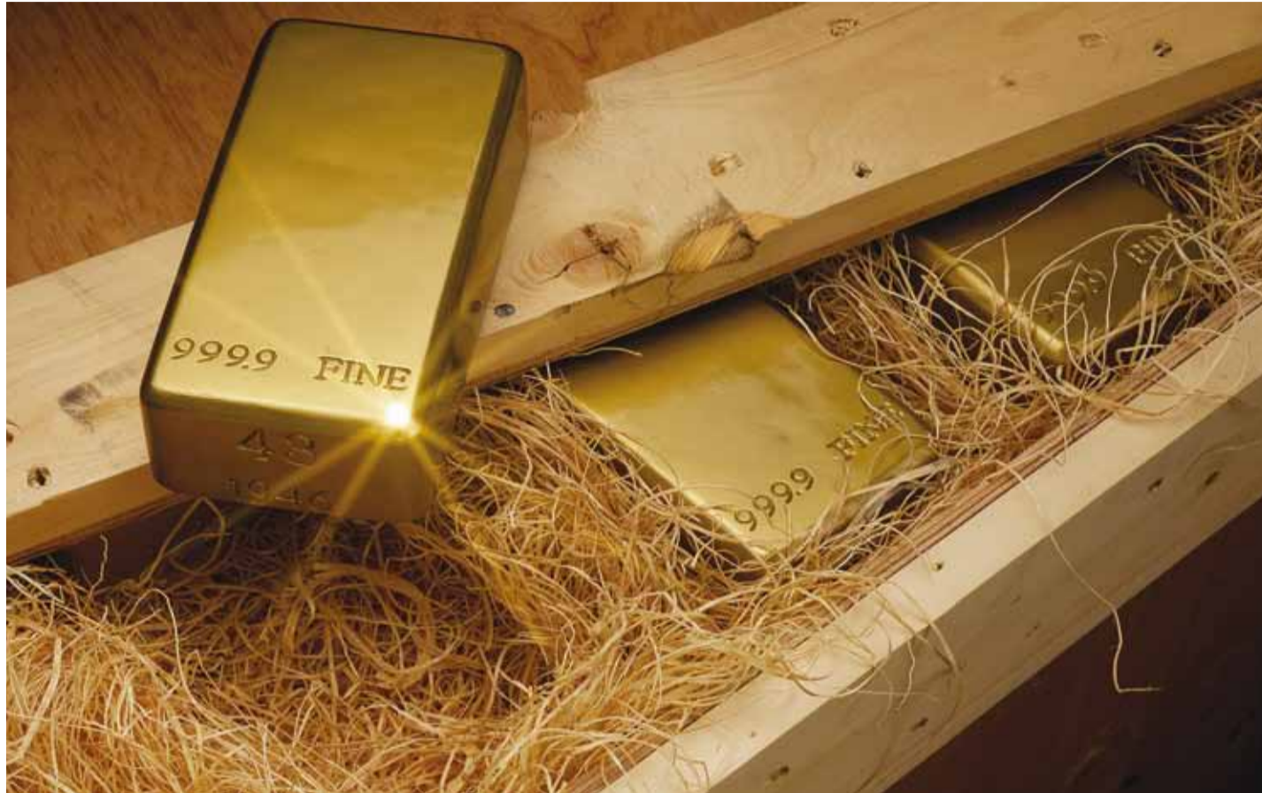
Valla reserv püsib esialgu puutumatusena.

Aastaplaani koostamisel sai tehtud ka jaotus kuude lõikes. Kusjuures kuude graafikute koostamisel on jälgitud majanduslanguse kõvera, võimalikke liikumisi keskmise palga ja maksimaksjate osas. See näitas, et suure tõenäosusega on just aasta alguses veidi parem laekumine ja nii on ka läi-