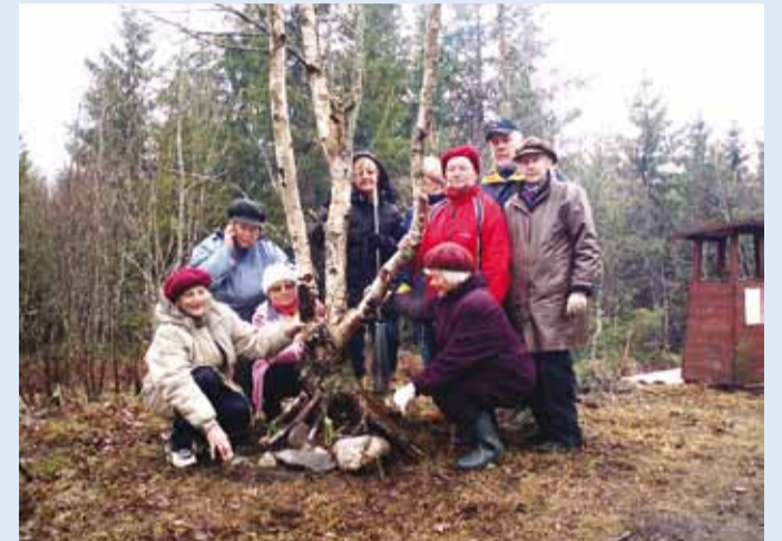
Talgulisi seob ühtehoidmise vajadus.