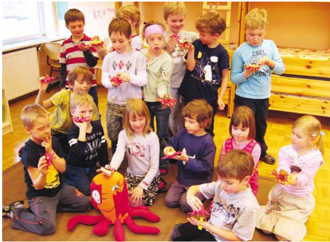
Lapsed koos maskott Missegaga.