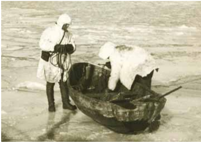
Naissaare hülgekütid 1933.–1935. aastatel hülgejahil.