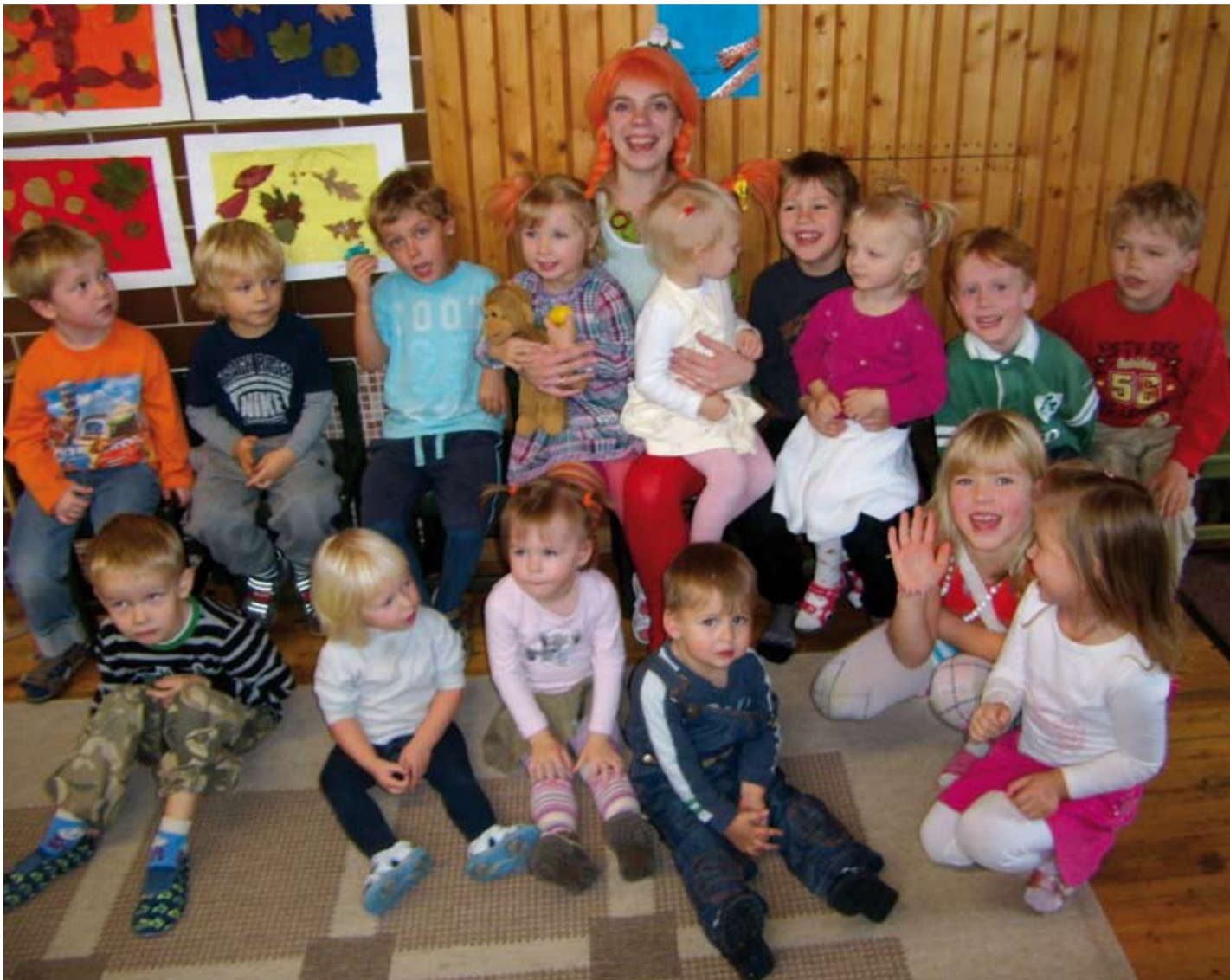
Pipi Pikksukk Lillelaste mängudehommikul.