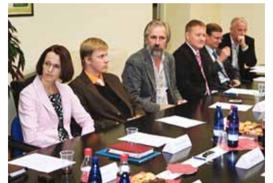
Siit pildilt leiab ka mitu uut volikogulast.