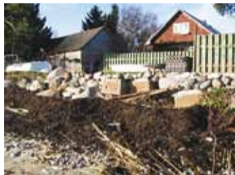
Ka nii kaitstakse randa.