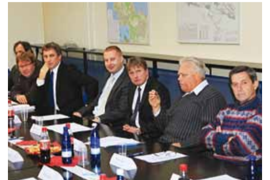
Volikogulased jälgivad tähelepanelikult toimuvat.