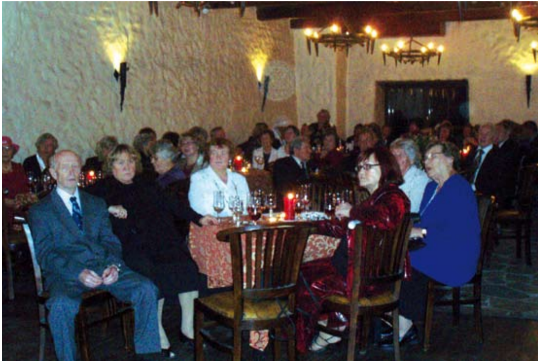
Suur osa balli õnnestumisel oli ka vana aja hõngulistel ruumidel.