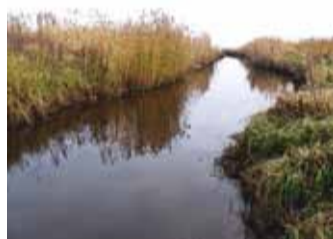
Ebaseaduslikult kaevatud kanal.