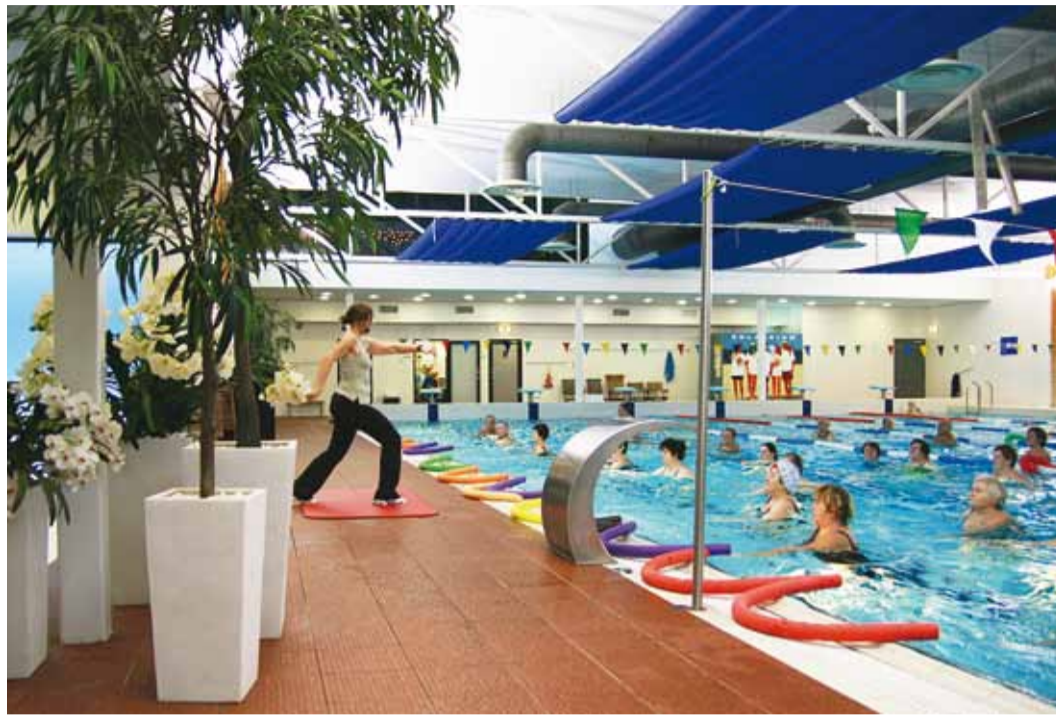
Viimsi SPA-s on vesiaerobika väga populaarne.

Praegu võib leida Viimsi SPA kodulehel selle spordiklubi klientuurile soodsaid pakkumisi Saaremaal ning neid lisandub lähiajal veelgi. Viimsi Tervise kliendikaardiga saab Viimsis soodsalt kõiki teenuseid ja eripakkumisi, tulevikus