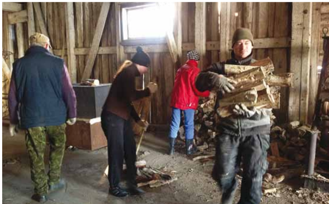
Sadamakuur kraamiti sügisel sodist puhtaks.

"Kuuri oli ehitatud viis basseini, igäüks mahutas üle kümne tonni silku," meenutab saarevanem. Soolatud kala veeti tünnides kord päevas laevaga pealinna. Hoonesse ehitati ka