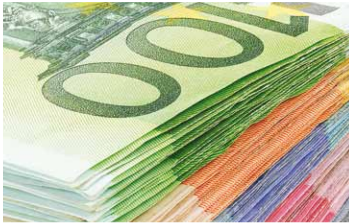
Toetussumma on kuni 14 000 €, kui peres on 8 või rohkem last, siis kuni 14 000 €.

• eluaseme püstitamine, rekonstrueerimine või laiendamine,