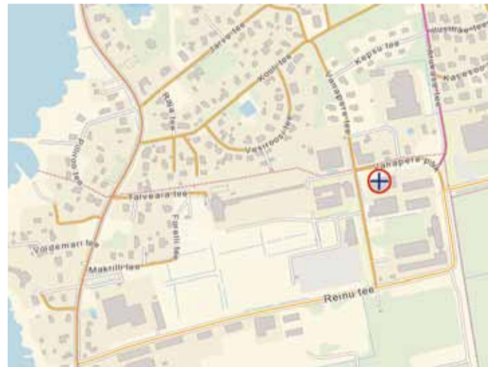
Jäätmejaam asub Püüsi külas Vanapere põikteel.

Päris kõike majapidamises üle jäävat, näiteks mööblit, päris tasuta ära anda ei saa. Täpsema suurjäätmete vastuvõtu hinnakirja leiab www.viimsivald.ee/public/jaatmejaama_hinnakiri.pdf .