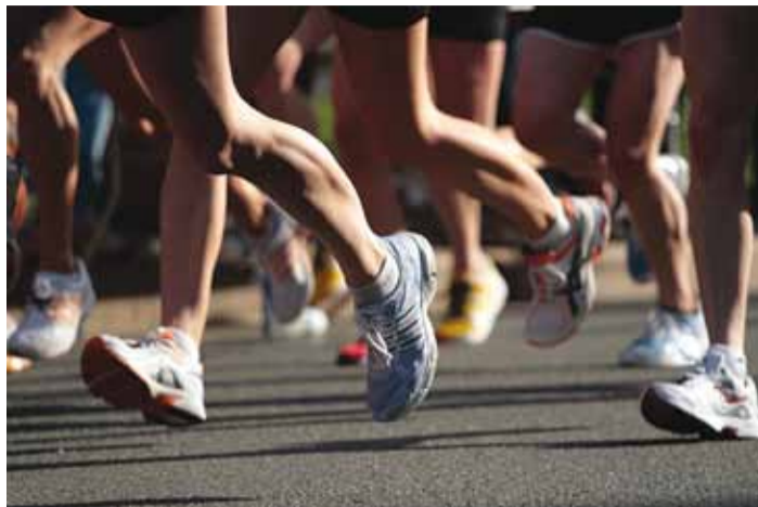
Jooksurajal näeme.

Väikelaste, laste ja noorte jooksupaigad paiknevad ainult kooli territooriumil. Põhidistantsi raja