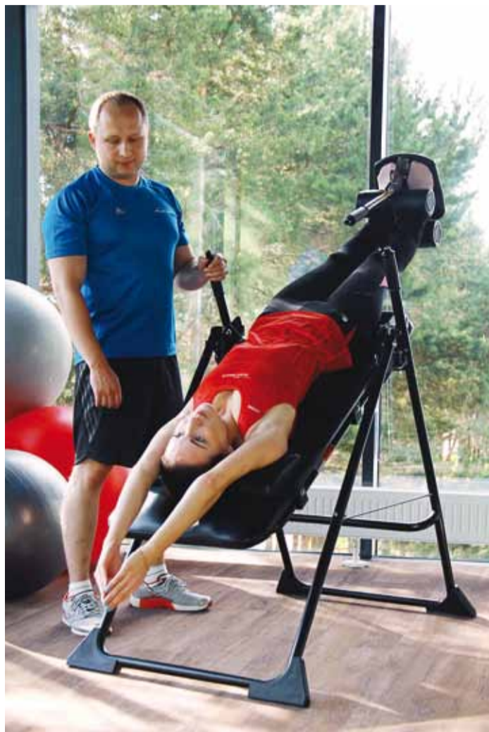
Füsioterapeudi juures saab seljavalule abi.

Enamiku inimeste jaoks valmistab raskusi hinnata oma lihaste seisundit ning rühti. Professionaalse hinnangu saab anda tervishoiu- või spordiasutuses tegutsev füsioterapeut, kes aitab leida seljavalu tekke põhjuse ning ravida rühihäiret