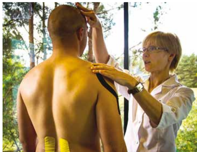
Seljavalu leevendab kinesioteip.

selja valu korral on võimalik teha ka endal rühianalüüsi täispiikkuses peegli ees, kuid kaht-