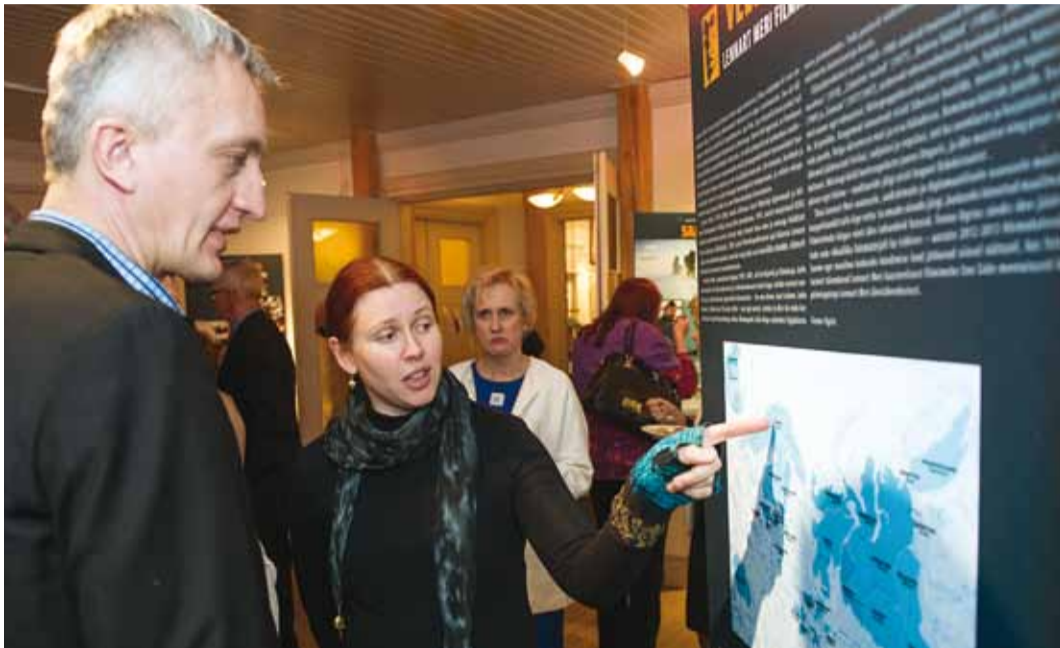
Näituse avamisel oli uudistajaid iga stendi juures.

Lennart Meri, armastatud riigipea 1992–2001, oli ka kirjanik ja filmilooja. Tema missioon oli jutustada eesti ja ta hõimurahvaste iidset lugu, otsides vastust eskäkt just väikerahvaste igavestele küsimustele – kes me oleme, kust tuleme, kuhu läheme.