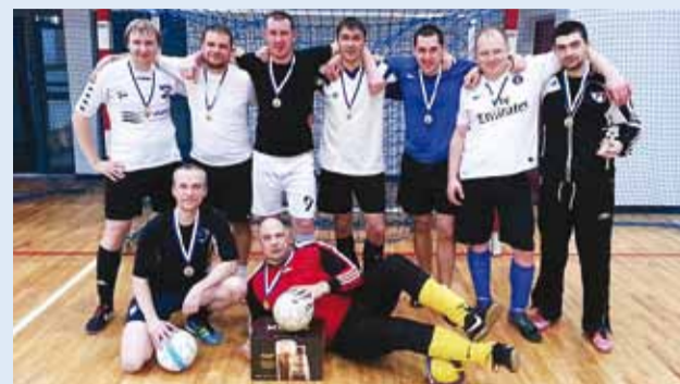
Viimsi valla meister saali jalgpallis Viimsi Ehitus.

Märtsikuu alguses toimusid Viimsi Spordikompleksi valla meistrivõistlused saali jalgpallis (futsal).