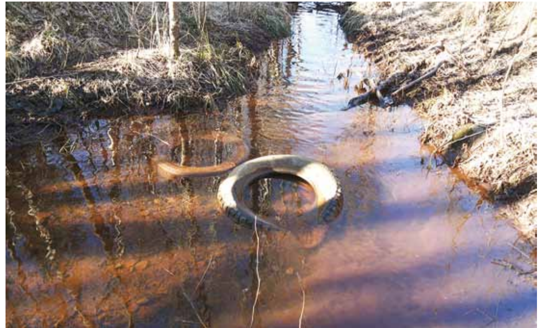
Kraav pole jäätmete koht. Mittevajalikust kraamist saab lahti Viimsi Jäätmejaamas.

Viimsi Jäätmejaam asub Püüsi külas Vanapere põikteel ja võtab vastu pea kõike peale olmejäätmete, kasutatud riiete ja autoosade. Paljud jäätmeliigid võetakse vastu suisa tasuta, nende hulgas näiteks sõiduauto rehvid (kuni kaks jooksu korraga), klaas, töötlemata puit, paberi ja papi jäätmed, kompleksed elektri- ja elektroonikaseadmed ja vanametall. Tasuta võetakse vastu ka õlide ja rasvade jäätmed, värvid, liimid ja vaigud, seda tingimusel, et need on hermeetiliselt suletavates anumates. Vastuvõtt toimub ka laupäeviti ja pühapäeviti.