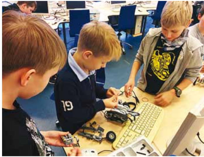
Viimsi Kooli robotikaringi õpilased.

Kuidas tekitada noortes huvi loodus-, täppis- ja tehnoloogia valdkonna vastu? Üheks võimaluseks on luua tingimused teadushuvihariduses (loodus-, täppis- ja tehnoloogivaldkonna ehk LTT) huvialaringides osalemiseks. Koolivälise tegevuse on väga mitmekihiline. Enamikus koolides ja valdade huvikeskustes on loodud tingimused osalemiseks kunsti-, tantsu-, muusika-, spordi- või näiteringides. 2013. aasta kevade seisuga on kõigist Eestis tegutsevatest huvialaringidest loodus- ja tehnikavaldkonna teemalisi vaid 7,16%. LTT valdkonna osakaal kõigist huviringidest võiks olla vähemalt 25% ja mitte teiste valdkondade vähendamise, vaid selle valdkonna arendamise kaudu.