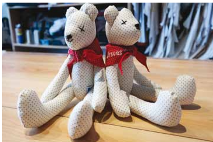
Õmblusringis valminud vahvad loomad.

Õmblushuviliste seltskond käib huvikeskuses koos kord nädalas neljapäeva õhtuti. Õmblemise kohapeal, õmblusmasinad tuakse kaasa. Tunnis jagab Veskaru juhtnööre, kuidas kodus jätkata. "Oma masin on hea seepärast kaasa võtta, et väga paljud on saanud kingituseks või päranduseks õmblusmasina ja ei oska sellega kodus midagi peale hakata," rääkis Veskaru. "Tunnis vaatame koos,