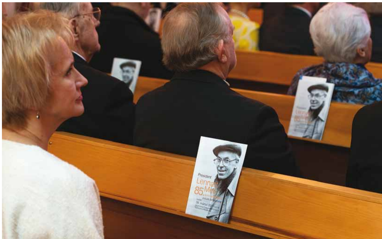
Lennart Meri oli kõigi Balti riikide eestkõneleja, eesmärkide sõnastaja ja selgitaja.