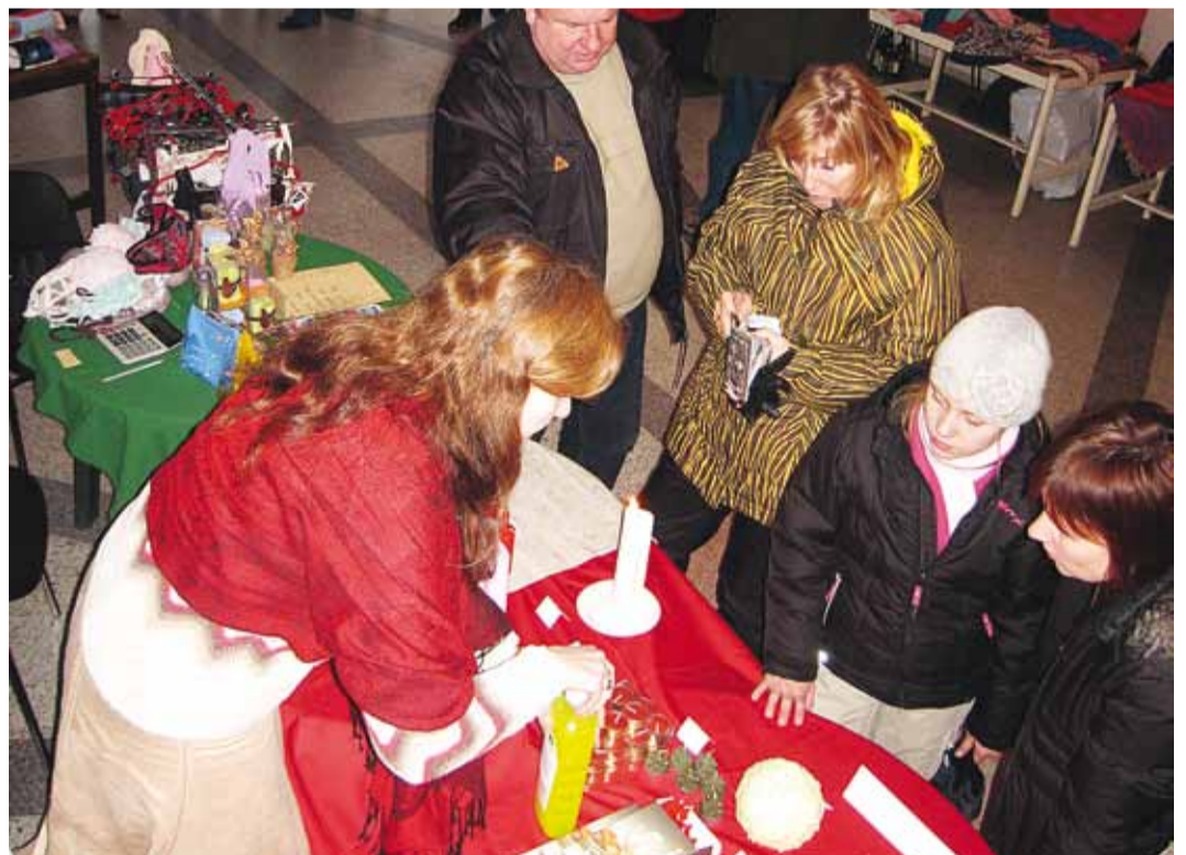
▲ Jõulukaupadel oli minekut.

Rahvast tuli rohkem selleks ajaks, kui saalis kontsert algas ja esinesid rahvakunstiambel Pirita ning Viimsi tantsutüdrukud tantsuklubist Viira. Esinejate isad-emad ja vanaemad-vana-isad vaatavad ka laadakauba üle ja tegid oma ostudki.