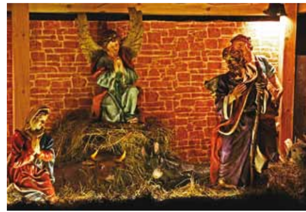
Advent on valguse aeg.

Adventus Domini – Issanda tulemine, just sellest väljendist on kasvanud välja nimetus advent, millega me tähistame aega, mis jääb igal aastal enne jõule. Enne pühi, mil suurem osa maailmast tähistab Jeesuse Kristuse sündimise päeva.