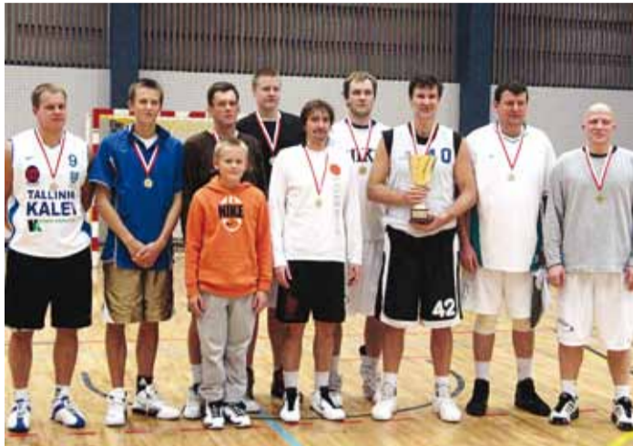
Viimsi Veteranide meeskond.