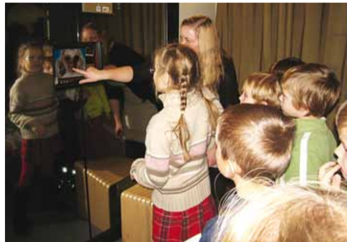
Siin saab endast pildi e-kirjaga koju saata.