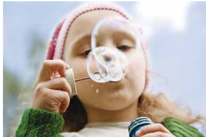
Logopeed aitab kõnet ja suhtlemist parandada.

Hääldamine – kuidas laps sõnu hääldab, kas võõras inimene saab lapsest aru. 4-aastase lapse hääldus peab juba olema selge ja arusaadav. Erandiks on r-häälik, mille õige hääldusliigutuse äraõppimine võtab mõnevõrra kauem aega. Viienda eluaasta lõpuks peaksid aga kõik häälikud olema lapsel omandatud ning häälikuühendite hääldamine korrektne.