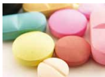
Ravimitele saab hüvitist.

Milliseid ravimeid kasutad sina, kui pead oma tervise parandamiseks neid kasutama? Nagu sama toiteväärtega toidud on väga erinevate hindadega on ka sama toimeainega ravimid erinevate hindadega. Küsi arstilt ja apteekrilt enda jaoks soodsaimat!