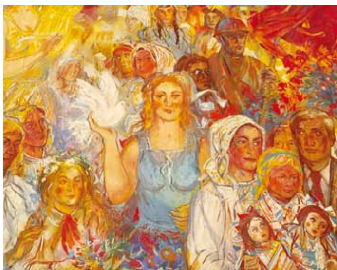
Fragment Evald Okase pannoo “Rahvaste sõprus”.

Ajaloomuuseumis on säilinud Evald Okase pannoo eskiiside mapp. See sisaldab palju hulgas ka tema vabaloomingule omaseid aktifiguure, mis aga tollase ideoloogiasekretäri otsusel kuidagi temaatilise pannoo ei sobinud. Evald Okas on paigutanud otsese ideoloogilise inventari, Nõukogude Liidu ja Eesti NSV lipud saali otsaseina, liiduvabariikide lipud ümbritsevad saaliist. Lippude hoolikalt läbimaalitud pinnad, samuti pannoo külgeintel toimuv karnevalimeeleolus figuuride dünaamiline liikumine on