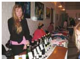
▼ Esmakordselt laadal Saksa veinid.