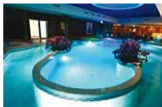
Veealuse massaažiga bassein.