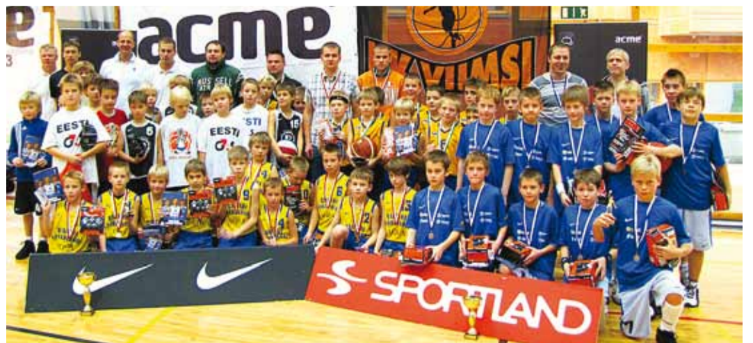
Viimsi Sügisturniiri esinelik, treenerid ja korraldajad.

Viimsi Sügisturniir 2010 toetajad: Viimsi vald, Acme, Nike, Sportland, Hasartmängumaksu nõukogu, Gamestar. Külalised majutas ja toitlustas hotell Athena.