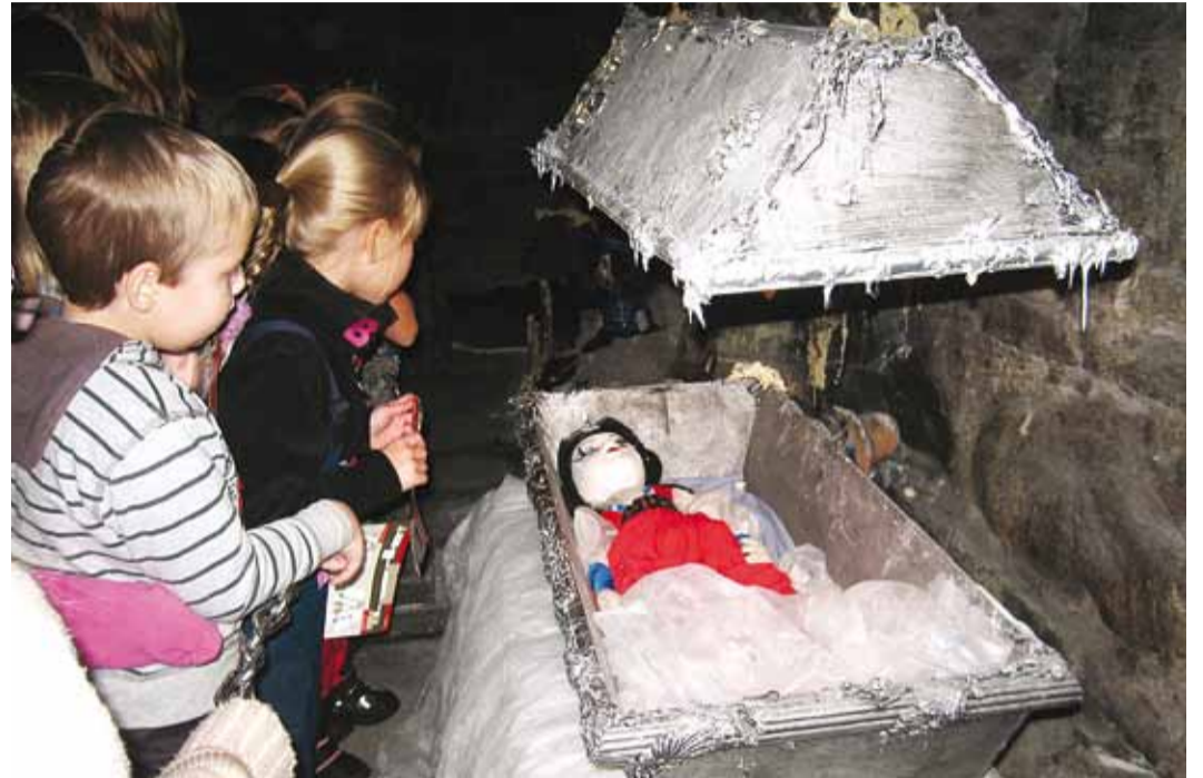
Kord saja aasta sees teeb Lumivalgeke silmad lahti.

Põnev oli tuba, kus ekraani puudutades sai panna nukud liikuma. Kõige põnevamaks ja nagu lõpuks selgus, ka kõige meeldejäävamaks oli aga Õudukas. Seal magas Lumivalgeke 100-aastast und, aga oh, imet – tegi just nüüd äkki silmad korraks lahti. Ent kõige jubebada oli Lihasööja-Jänes. "Ärge lähedale minge, ta hammustab!" hoiatas muuseumi