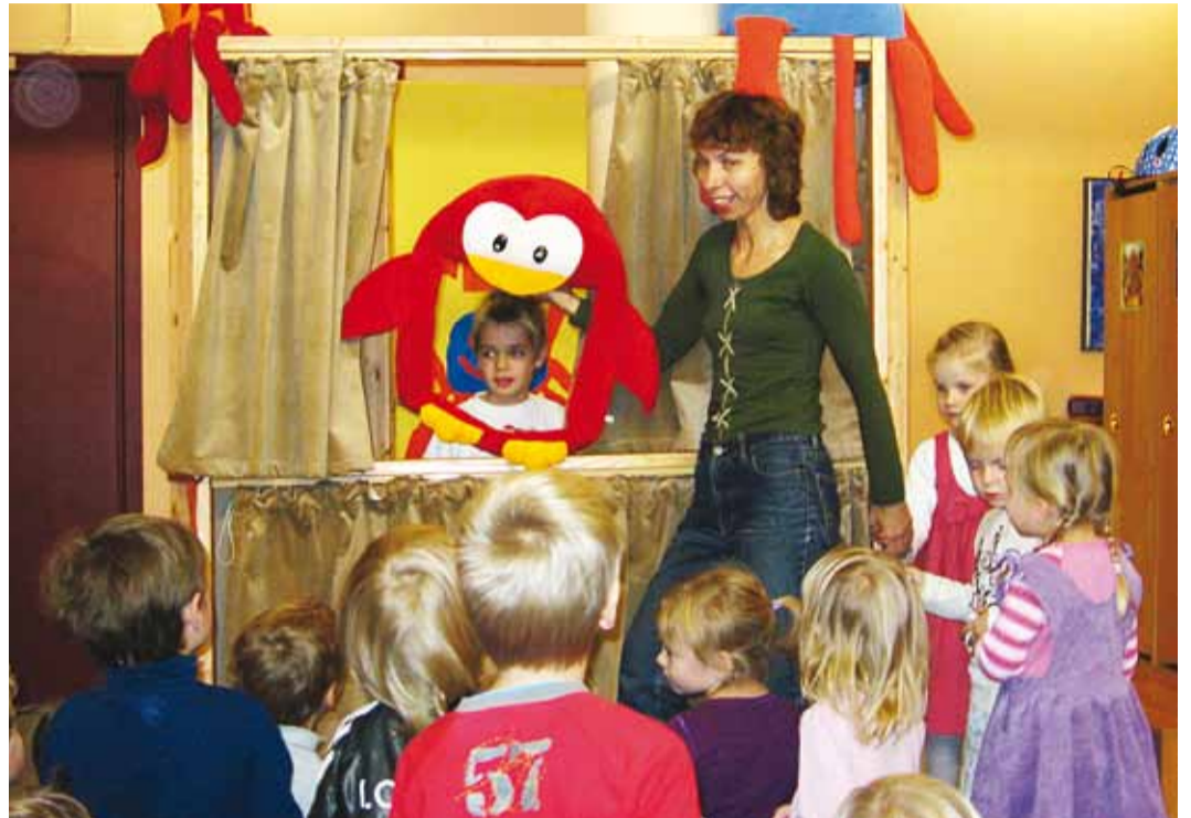
Läbi akna öeldi häid soove sünnipäevaks.

Enne, kui pidu jätkus kommid ja koogiga, õppisid lapsed vahva sünnipäevalaulu. Koos lauldi ja tantsiti ning süüdati sünnipäevaküünal.