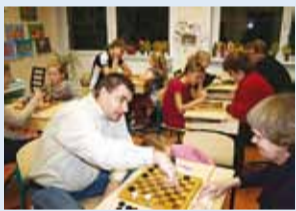
Isad võistlesid lastega.

19. novembril oli Püüsi Kooli õpilastel taas põhjust ootusärevuseks. Mitmendat aastat on koolis isadepäeva paiku tore traditsioon – perepäev.