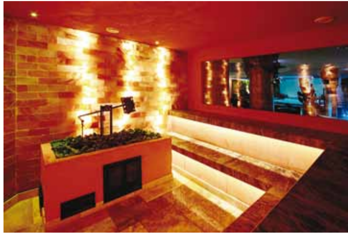
Soolakivisaun rahustab ja leevendab pingeid.

Eesti aladel oli kuni 20. sajandini ainsaks saunatüübiks suitsusaun. Eestlastel oli levinud sarnane saunatamise viis