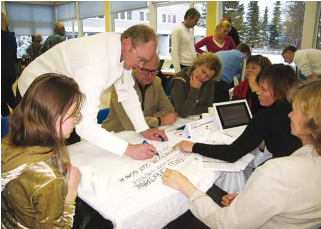
Hariduse tööühm vormistab ettekandeks oma olulisi ideid.

Erksam rahvas üle Harjumaa kogunes Viimsisse, et arutada, kuidas elu paremaks muuta ja kuhu Eesti võiks jõuda.