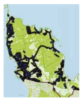
Viimsi valla tänavavalgustuse skeem.

Pime aeg on käes ning kommunaalmetisse pööratakse ühe enam tänavavalgustuse küsimustes. Peamine mure on kustunud tänavavalgustid. Suur hulk pöördumisi on siiski seotud nn säästurežiimi lampidega.