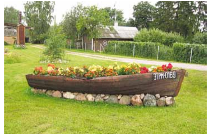
Rannu vallas perekond Leitade kodus asuv vanast paadist lillepeenar.