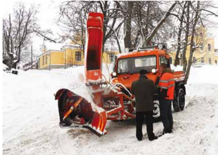
Möödunud talvel oli juba novembris lumi maas.

Viimsi valla teed, avalikult kasutatavad RMK teed ja 14 erateed (kellel on sõlmitud eratee avaliku kasutamise leping) on arvatud valla talihooldete koosseisu. Riigiteed on Maanteeameti hooldada, kõik ülejäänud erateed on vastava teeomaniku hooldada. Kui