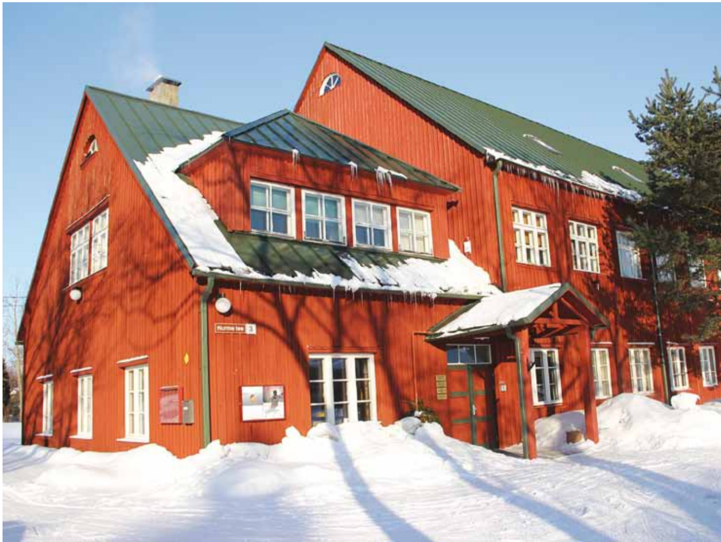
Rannarahva Muuseum Pringi külas. Olete lahkesti külastama oodatud!

See oleks olnud justkui alles, kui võtsime kokku 2010. aastat. Aga tege-likult on märkamatu- järele 12 kuud möödas ja jõuluaeg ukse ees. Rannarahva Muuseum hetkel jõuludeks valmistumise rütmis hingabki.