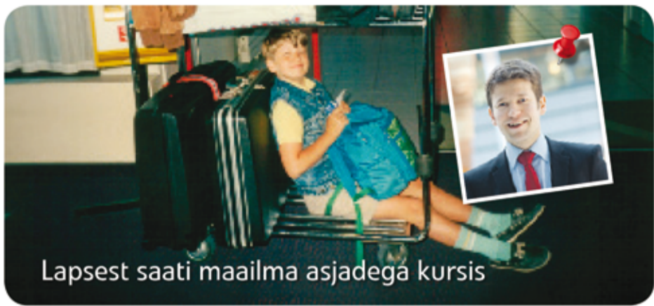
Lapsest saati maailma asjadega kursis

Fortum on üks juhtivaid energeetikafirmasid, kelle tegevus on keskendunud Põhjamaadele, Venemaale ja Läänemere piirkonnale. Fortumi tegevusalade hulka kuuluvad elektri- ja soojusenergia tootmine, jaotus ja müük ning elektri jaamade käitamine ja tehniline hooldus. Meie visioon on olla tipptasemel jätkusuutlik energiaettevõtte.