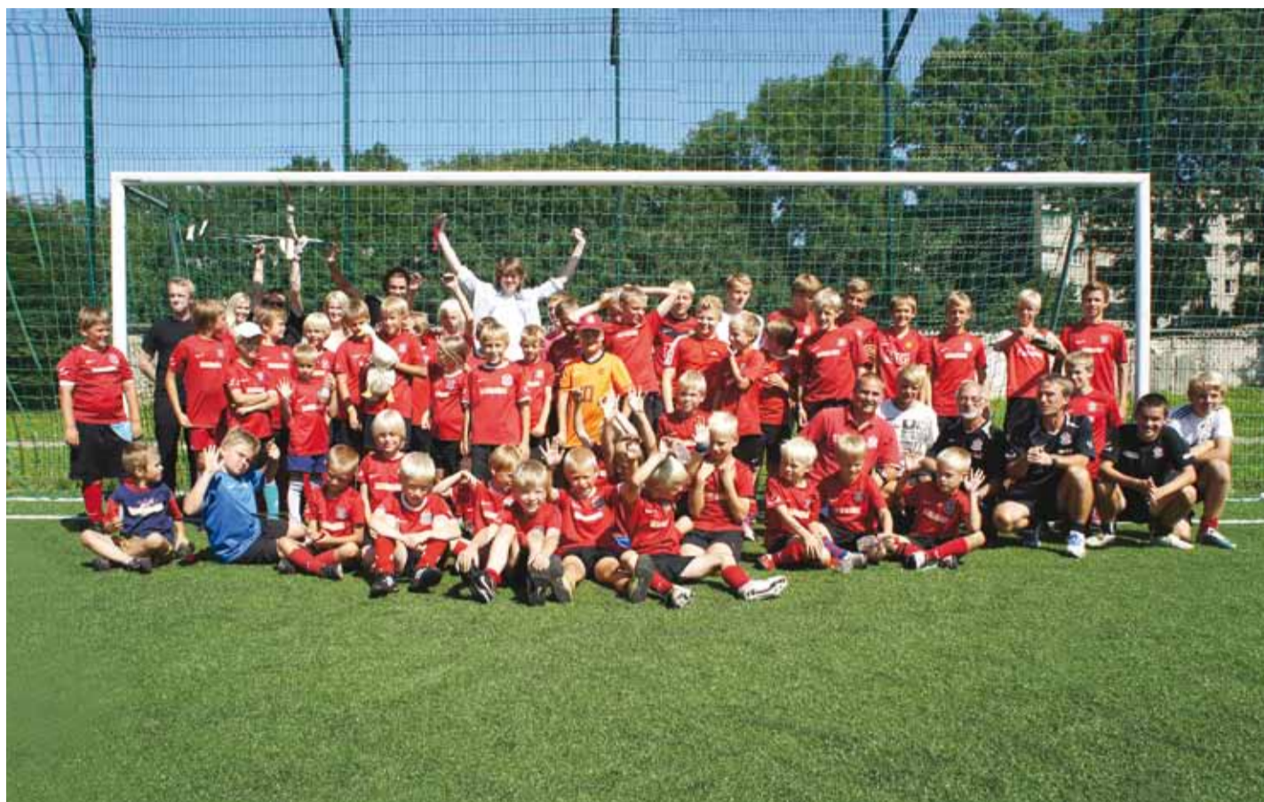
Martin Reimi jalgpallikool on hetkel tegutsevatest klubidest Viimsis ka kõige suurema laste arvuga.

Turniiridel mängis meie kooli üks perspektiivikamaid meeskondi järgmiselt: 16.01.