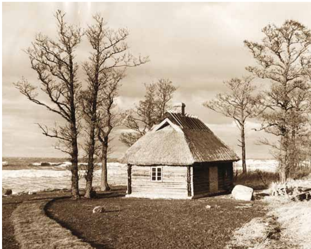
Restoran Paadist sadakond meetrit Rohuneeme pool seisis enne maatüki müümist muuseumi saun.

Kui nimetada veel kesku-sehonesse sisustatud nõuete-kohast fondihoidlat ja samuti muuseumi juures tegutsenud ajalooringi, hüüaksid tänapäeva muuseumitöötajad umbes nii, nagu lasteaialaps nõuka-