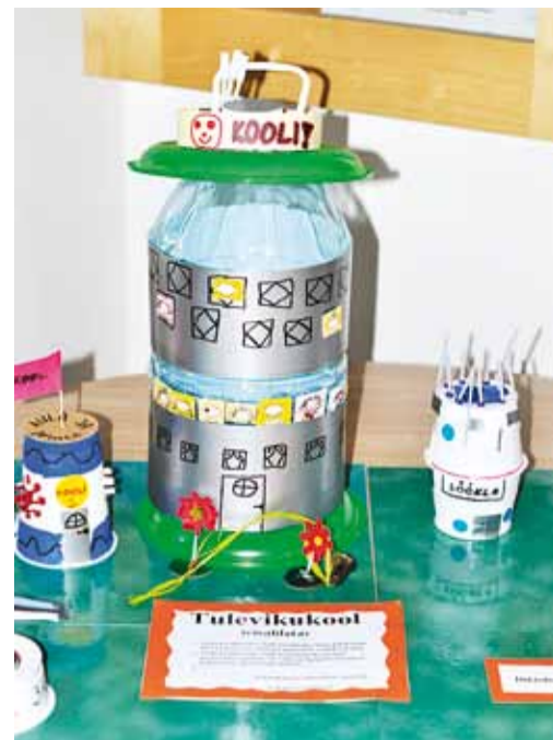
Viimsi hariduse visiooni-konverents 2011. Loe lk 6