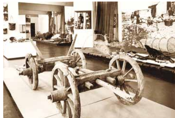
Kirovi muuseumi näituseruum oli nii avar, et seal oleks võinud hobuse ja vankriga sõita.

27. juunil 2000. aastal asutati ME Vival juurde filiaalina Naissaare Muuseum. 2000. aasta sügisel nimetati Munitsipaal-ettevõtte Vival ümber ja uueks nimeks sai Munitsi-