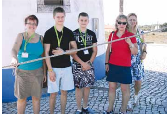
Püünsi Kooli esindajad Pinhoa tuuleveskite juures.

12.–16. oktoobrini toimus järjekordne Comeniuse projekti "How Big is Your Foot?" projektikoolide kokkusaamine. Seekord kohtuti Portugali väikelinnas Lourinhas.