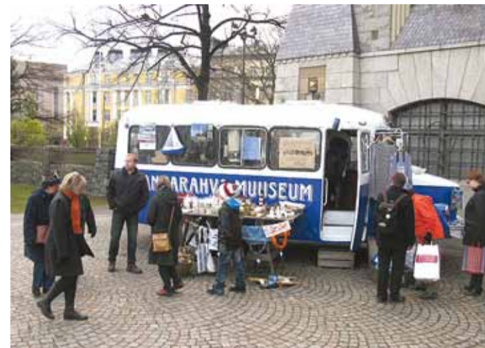
Muuseumi pood muuseumipoodide kokkutulekul

Samaaegselt suurima Eestit tutvustava sündmusega Soomes – Martin Markkinat nime all tuntuud mardilaadaga – toimus muuseumiringkondadele tähtis üritus ka Helsingi südalinnas asuvas võimsas Soome rahvusmuuseumis.