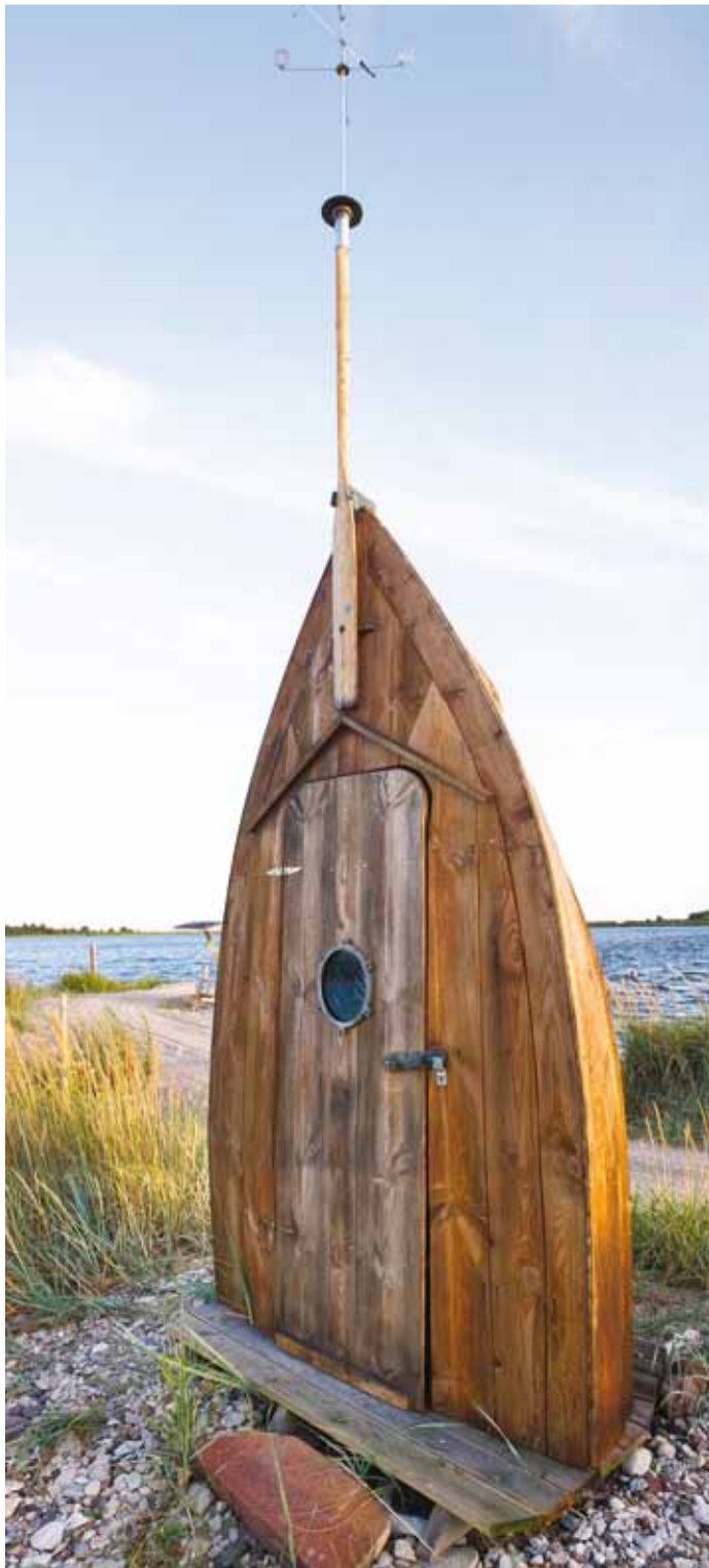
Vahase saarel asuv paadist välikäimla.