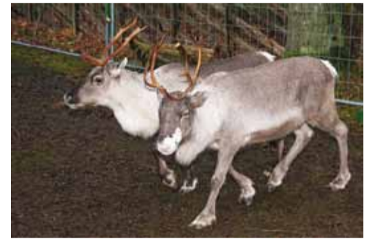
Kingu talu pererahvas röömustab külalisi seekord oma uute pudulojustega – põhjapötradega.