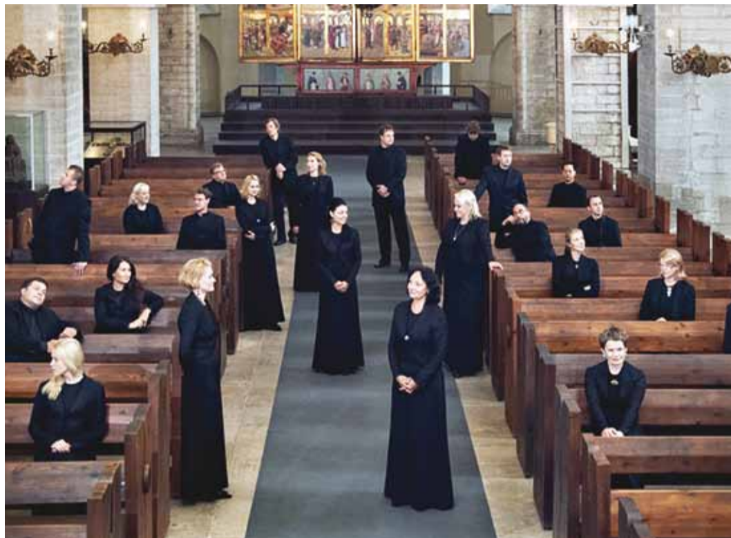
Eesti Filharmoonia Kammerkoor on esinenud paljudes riikides mitmes maailmajaos.

Eesti Filharmoonia Kammerkoor on aastakümnete jooksul palju tutvustanud Eesti muusikat terves maailmas. Lisaks