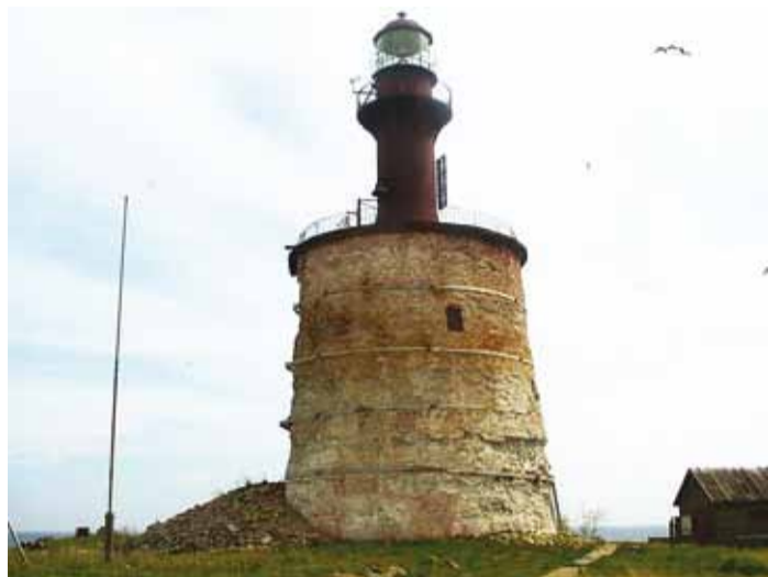
Ainulaadse arhitektuuriga Keri tuletorn.

Keri saarel asuv tuletorn on oma ainulaadse arhitektuuri ja põneva ehitusloo poolest Viimsi valla tähelepanuväärsemaid ehitismälestisi. Praeguse tuletorni ehitamist alustati 1803. aastal. Et ehitusolud osutusid erakordselt rasketeks, jäeti kiviosa ehitamine pooleli praeguses kõrguses. 15 meetri kõrgusele kivialusele püstitati esialgu puidust torn ja 1857. aastal käesolevani säilinud metalltorn. Ajaloolise faktina olgu märgitud seegi, et aastatel 1907–1912 töötas tuletorn saare enda maagaasi energial. Juba 1920. aastatel täheldati kivijalamil ohtlikke pragusid, mida parandati 1937. aastal nelja raudbetoonist vöö abil. Kapitalsem remont teostati 1959, mil kivijala ümber valati raudbetoonist särk, mis ei suutnud aga tõkestada hilisemat varingut. Tuletorni veerandosa välismüürist varises 1996. aastal, misjärel ümbrit-