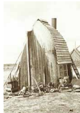
1961. aastal pildistatud Audruranna kolhoosi sepikoda.

pole enam vaja lõputult võrke parandada. Samuti tarbivad randlased samasugust kultuuri nagu ülejäänud Eesti inimesed. Ometigi on jäänud see eriline miski – igatsus mere järele, avatus uutele ideedele, soov oma eluga hakkama saada ja seda ise paremaks teha. Nõnda võtab vana rannakalur ikkagi oma lappaja, kutsub kaasa lapselapse ning sõidab merele võrke sisse laskma.