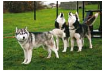
Kelgukoerad ootavad kannatamatult, millal saaks külarahvast lõbusõidule viia.

27. novembril süütas vallavanem Viimsi Vabaõhmuuseumis adventiküünla ning kuulutas välja jõulurahu. Ühtlasi avati vabaõhmuuseumi talvine hooaeg ja jõuluküla, mis jääb avatuks kuni 7. jaanuarini.