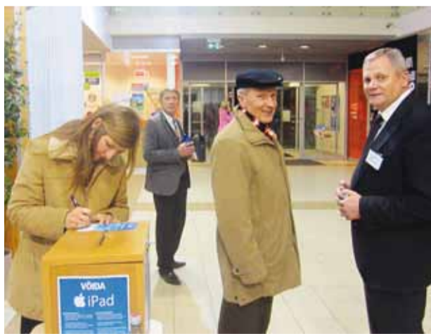
Vallajuhid Comarketis kampaaniat tutvustamas.

15. ja 18. novembril toimusid perepäevad Viimsi (15.11) ja Püüsi (18.11) koolis, kus vanemad said koos lastega kaasa lüüa erinevates töötubades. Üheks töötoaks oli ka Viimsile tunnuslause leidmine. Nii lapsed kui ka lapsevanemad esitasid palju toredaid ettepanekuid ja rõõm on