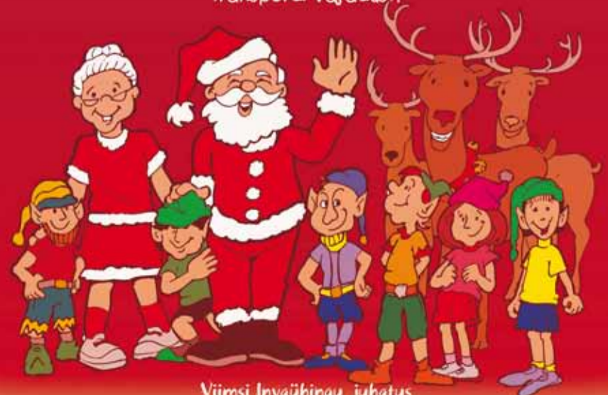
Viimsi Invaühingu juhatus

Osalemise soovist palume teatada hiljemalt 8. detsembriks meie e-posti aadressil inva@viimsivv.ee või mob. 52 54 674 Angelika. Soovime teada osavõtjate pereliikmete arvu ja transpordi vajadust.