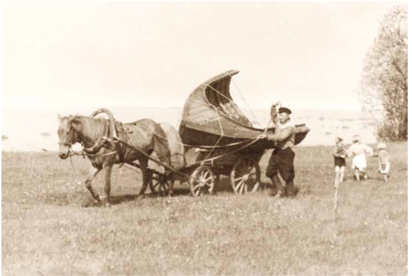
Pooliku paadi transportimine hobuvankril.

Ometigi ei suutnud ka sääraseid vintsutused randlust lõplikult välja suretada. Tõsi, tänapäeva randlus on kindlasti midagi muud kui see oli esimese Eesti Vabariigi ajal. Merel käiakse kala toomas nüüd põhiliselt väiketraalpaatide ja kakuampaatidega. Rannalastel on lõpuks aega mängida, sest