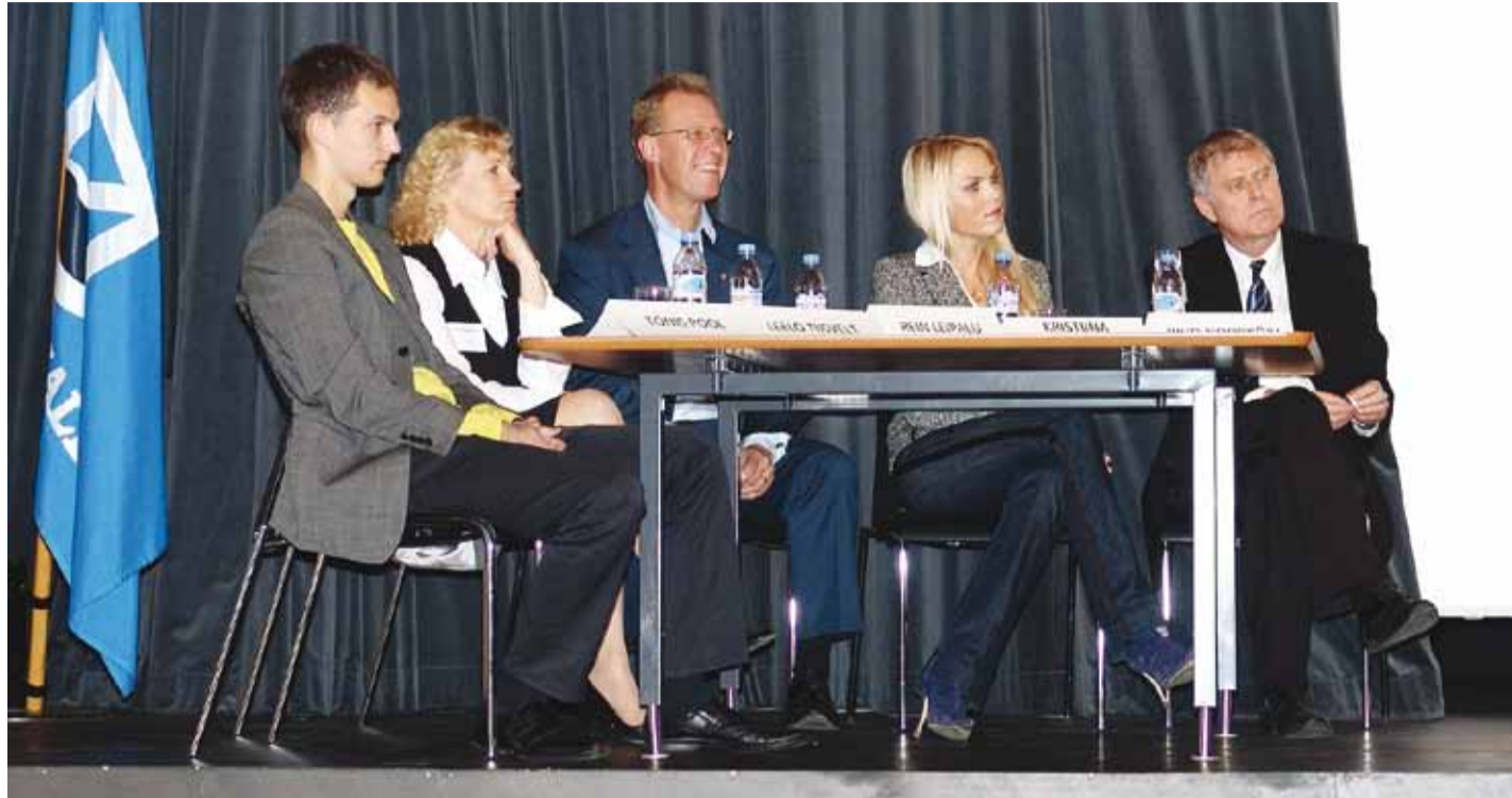
Visioonikonverentsi paneeldiskussioonis osalejad.

Rahvastikuprognosis näitab jätkuvalt laste sündivuse kasvutrende vallas. Aastaks 2013 saavad kooliküpsiks 300 last, mis teeb ca 50 last enam, kui käesoleval aastal kooliteed alustas. Kui aastal 2007 läks I klassi Viimsis 151 last, siis käesoleval aastal alustas oma kooliteed 212 õpilast. See tähendab, et iga-aastaselt on kasvunud Viimsi I klassi minevate laste arv ning aastaks 2013 on Viimsi vald seisus, kus Viimsi Koolis praeguse III (7.–9. klass) kooliastmel oleva 13 paralleeli asemel on juba 17 paralleelklassi (lisaks Püüsi Kooli