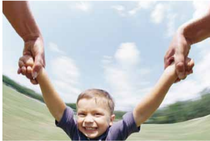
Terve laps on rõõmus.

Erinevates Euroopa riikides varieerub laste ööpäevane unetundide arv oluliselt, ulatudes 9–10 tunnist Eestis rohkem kui 11 tunnini Belgias. Lõuna- ja Ida-Euroopa lapsed magavad üldiselt vähem, kui põhjapoolsete riikide lapsed.