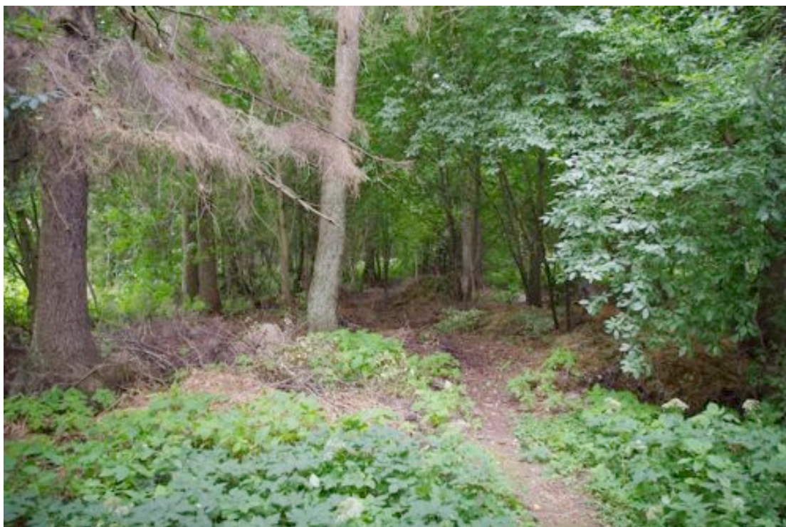
Foto 2: Vaade alus metsale planeeringuala lääneosas.