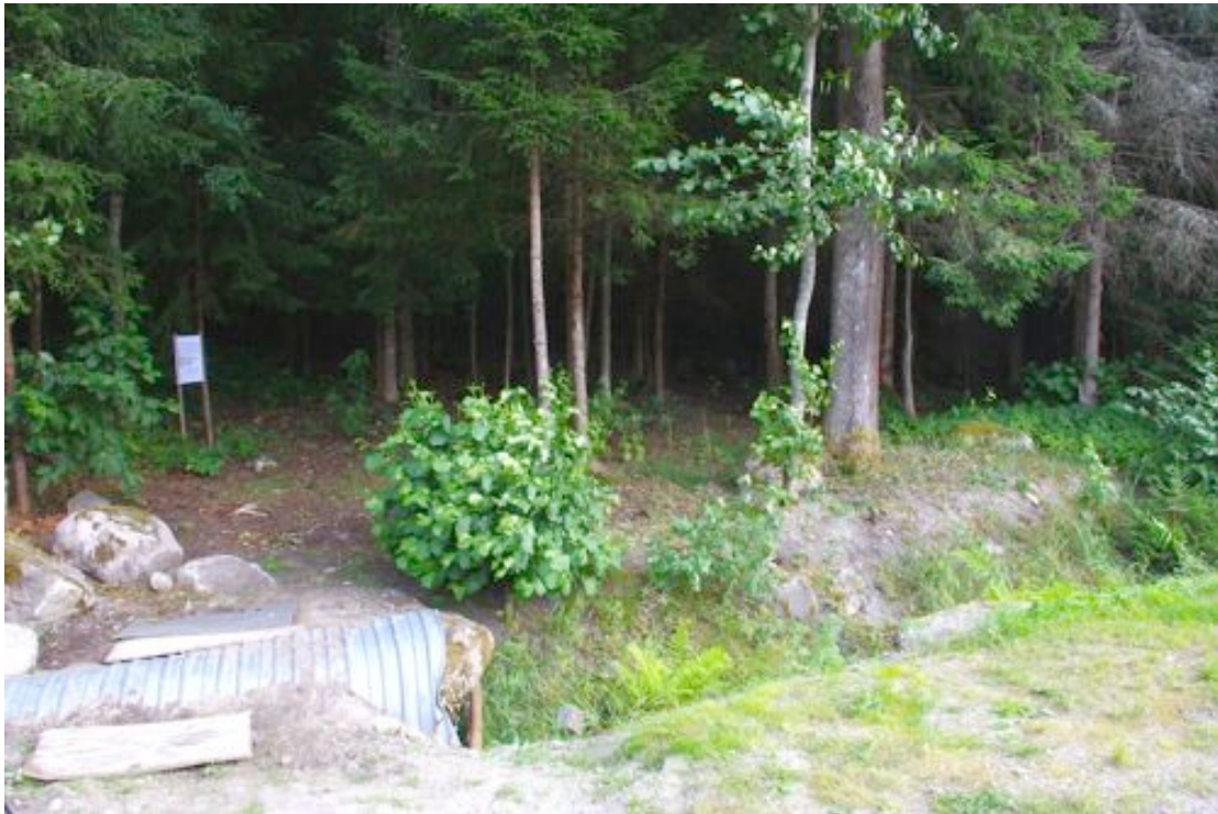
Foto 3: Vaade alus metsale planeeringuala idaosas Rannavälja teelt. Esiplaanil on Rannavälja tee ääres kulgev kuivenduskraav.