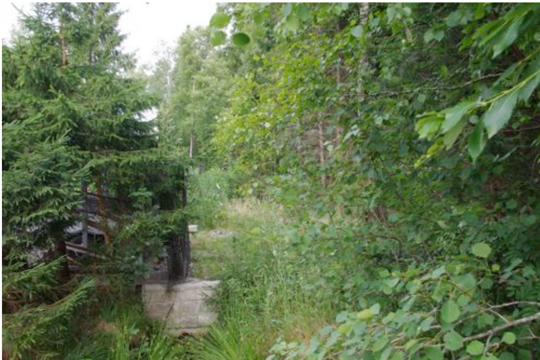
Foto 4: Vaade tulevase Rannavälja tee pikenduse alale. Fotol keskosas olev heinane ala on umbe kasvanud kuivenduskraav. Fotol olev aed piirab Rannavälja tee 81 krunti.