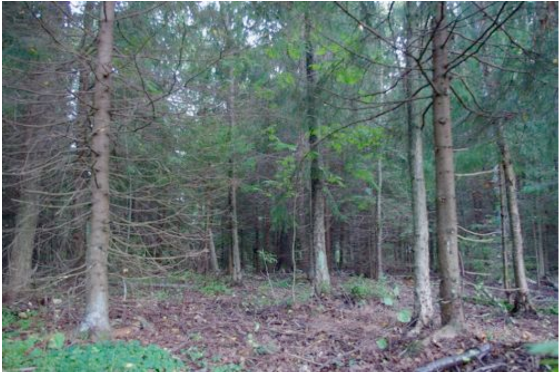
Foto 5: Vaade kuusemetsa alustaimestikule ja puudele.