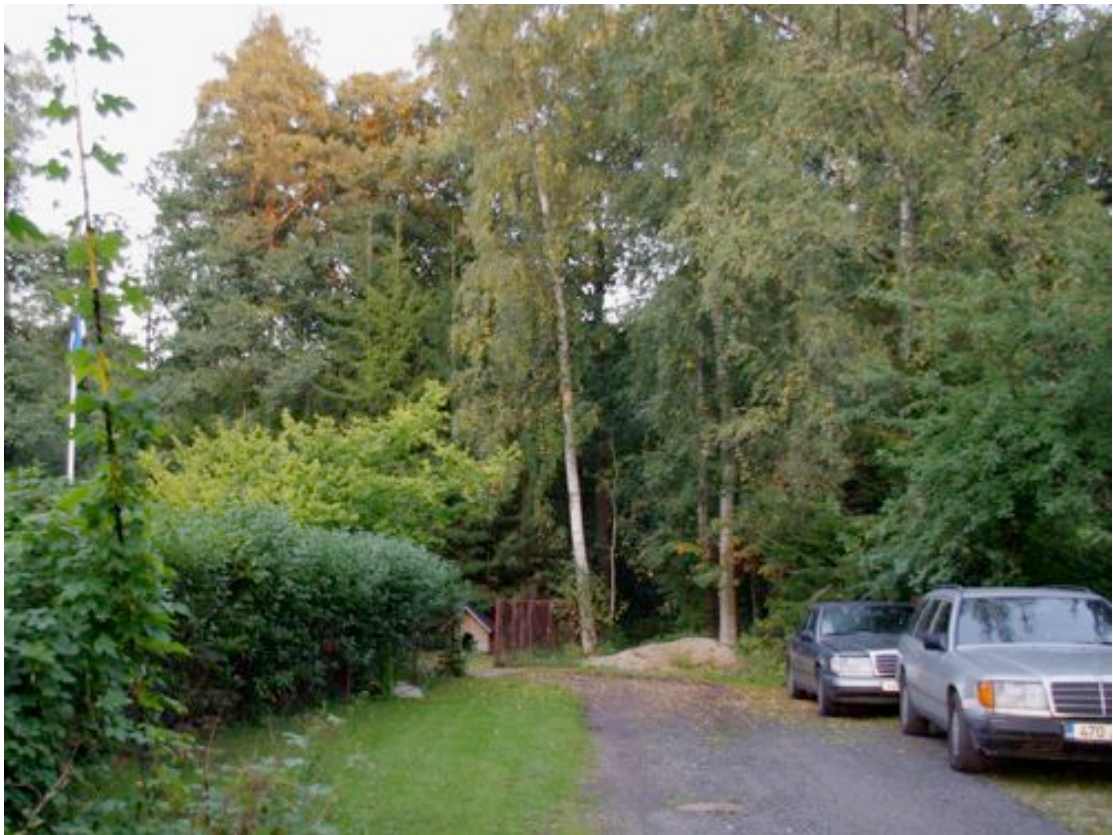
Foto 6: Vaade Rannavälja põik teelt planeeringualale olevale pääsule. Siit hakkab planeeringualale suunduma metsarada.