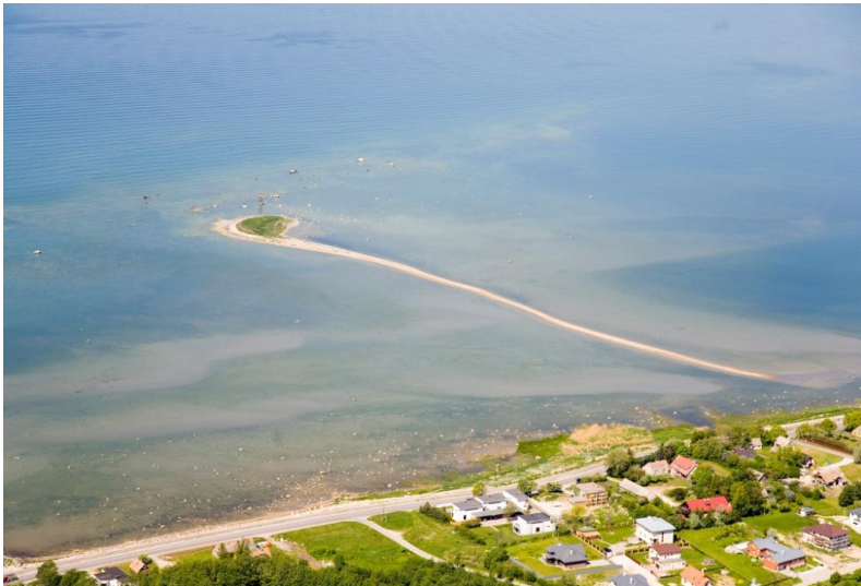
Joonis 4 Pandju laid (aerofoto)

olulise tähtsusega merelindude pesitsuspaik. Ilma inimtegevusele piiranguid seadmata on Pandju laid ning merelindude pesitsus- ja toitumisala määratud hävinemisele. Näiteks Tallinki Autoexpress ja Superseacat 4 tekitatud lainetus 1990-ndatel aastatel vähendasid Pandju lai pindala peaaegu kolmandiku võrra. Õnneks on vähemalt praegu suuri ja intensiivseid kiirlaineid tekitanud laevad Tallinna lähelt eemaldatud.