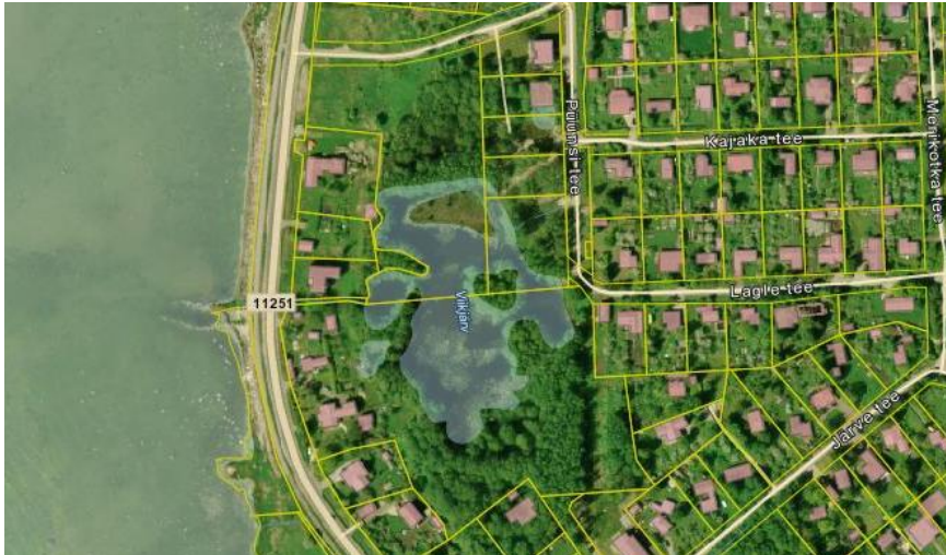
Joonis 2 Püünsi küla ainus järv: Viikjärv

Püünsis paikneb valla ainuke säilinud järv: Püünsi tee ääres asuv ca 1,4 hektariline Viikjärv.