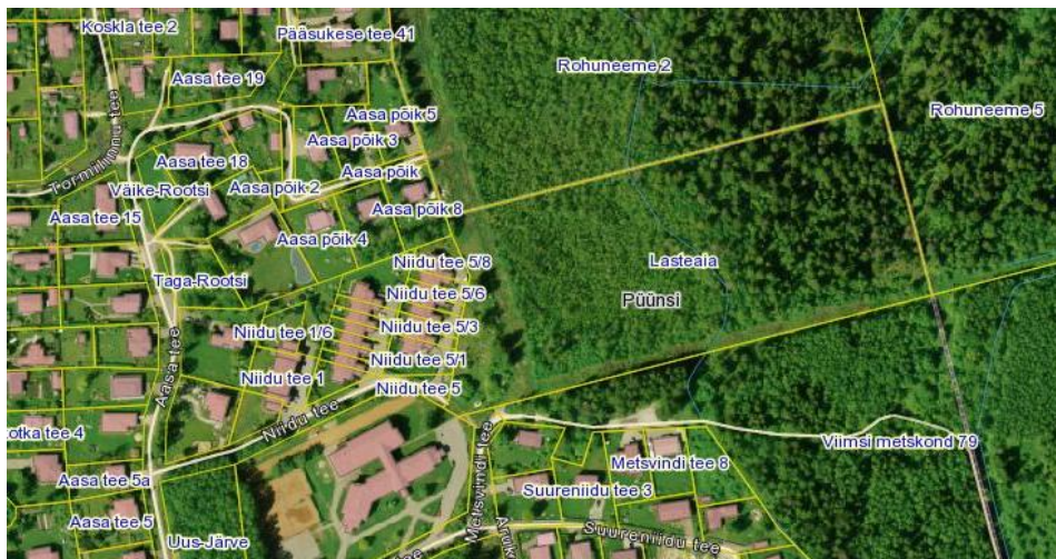
Joonis 3 Püünsi küla ainus metsa-ala: Lasteaia kinnistu (Maa-ameti ortofoto)

Küla administratiivsesse koosseisu kuulub Rohuneeme metsa-alast eraldatud 3,46 hektariline Lasteaia maaüksus, mis vastavalt kehtivale Viimsi valla üldplaneeringule on ette nähtud sotsiaalseks arenguks: sotsiaal-, haridus-, tervishoiu-, kultuuri- ja spordiehitiste rajamiseks ning kuhu on kavandatud Püünsi uus lasteaed. Lasteaia maaüksuse metsaalal kasvav kõrghaljastus on majanduslikult väheväärtuslik. Peapuuliigi moodustab hariliku kase järelkasv.