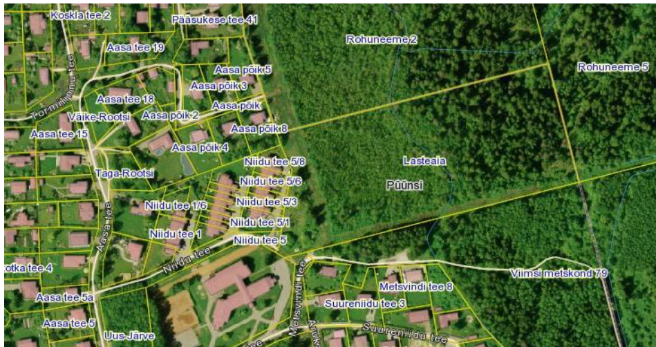
Joonis 3 Püünsi küla ainus metsa-ala: Lasteaia kinnistu

Püünsi küla looduse ja elukeskkonna kaks olulisemat mõjutajat on meri ja mets, mis jäävad administratiivselt väljaspoole küla piiri (välja arvatud metsaosa Lasteaia maaüksusel), kuid mõjutavad oluliselt nii kliimatilisi tingimusi kui ka elanike vaba-aja tegevust. Kevad on siin hilisem, sügis aga see-eest pikem ja soojem kui sisemaal. Nagu mereäärsetes piirkondades tavaks, on tuulevaikseid perioode harva, selle kompensatsiooniks on puhas mereõhk ja põlis-metsa vahetu lähedus.