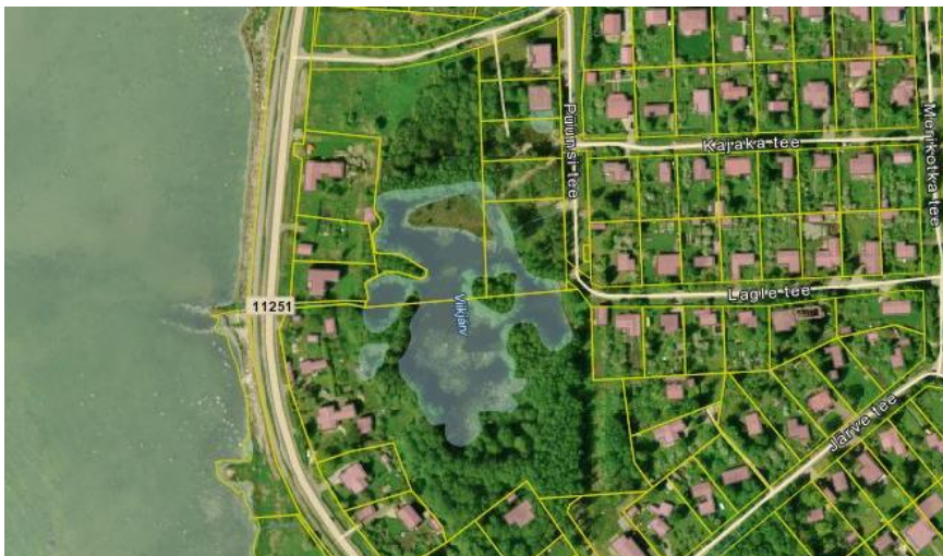
Joonis 2 Püünsi küla ainus järv: Viikjärv

Püünsis paikneb valla ainuke säilinud järv: Püünsi tee ääres asuv ca 1,4 hektariline Viikjärv.