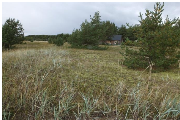
Vaade punktist 196 loodesse üle elupaiga PRA_07:2130/C elamuehituse tõttu hävinud elupaigale PRA_10:0.