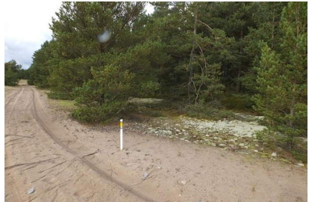
4 fotot elupaigast PRA_08:2120/B punktis 209. Elupaiga seisund maastikukaitseala piiri ääres on hea, tallamine on mõõdukas.