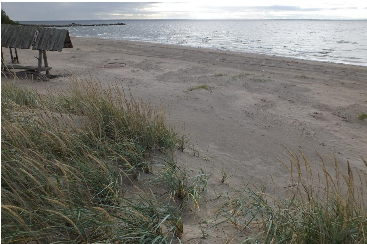
Püsirohttaimestikuga liivarand ja rand-luidekaeraga kaetud liikuv rannikulüide.

Liivarandadele järgneb juba püsivama, liiva kinnistava rand-luidekaera vöönd. See taimestu talub tallamist suhteliselt hästi, sest rand-luidekaera risoomid on kohastunud pidevalt liikuva sõreda liivaga. Kui pidevalt kuhjuvad uued rannavallid, siis on mõningane tallamine isegi soovitatav, et hoida ära edasist kamardumist (juhul kui soovitakse säilitada just seda elupaigatüüpi, vastasel juhul järgneb suktessioonilises reas halli lüite elupaigatüüp). Uurimisalal on liikuvad rannikulüited võrdlemisi heas seisundis, vaid sadama lähistel ei vasta väike lõik enam elupaiga kvaliteedile nii rajatiste kui küllastatavuse tõttu.