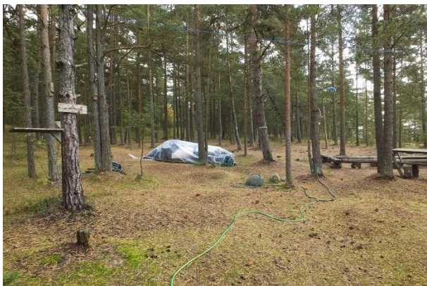
Tegevus Metsaranna kinnistul, elupaigas PRA_04:2180/D. Puistu on säilinud, kuid taimkate tugevalt ületallatud. Puistu võiks olla ka hõredam (säilitada erivanuselisuus!), kuid maapind peaks vähemalt laiguti olema kaetud püsitaimekattega.