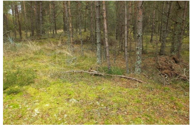
Vaade punktist 198 idasuunas, elupaik PRA_04:2180/D, vajaks harvendamist selles paigas.