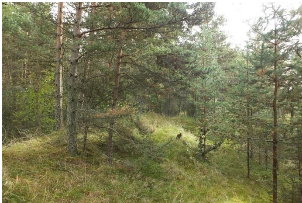
Vaade punktist 202 metsale PRA_05:2180/B. Noort männi järelkasvu võib eemaldada.