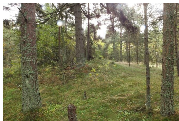
Punkti 208 ümbruses olev väärtuslik luitemetsa elupaik PRA_05:2180/B. Vajadusel võib raiuda hõredamaks noore ja keskealise männi juurdekasvugruppe, kuid mitte vanu ega kuivanud puid. Üsna looduslikus olekus/arengus mets on sellel kinnistul, omab looduskaitselist väärtust.