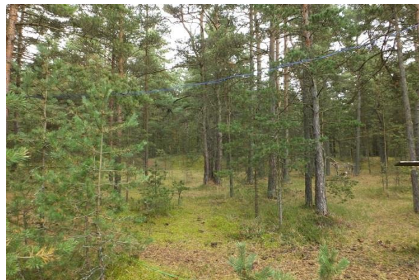
Vaade elupaigale PRA_05:2180/B punktist 203. Tallamine kohati piiripealse koormusega selles osas, üldiselt aga mets heas seisundis.