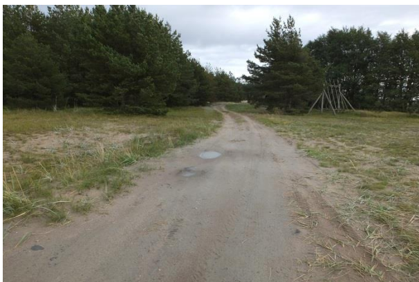
Vaade punktist 197 idasuunas, vasakul säilinud PRA_06:2130/B. Soovitatav oleks teeserv piirata tara/kiviaiaga, et ei sõidetaks nõmmele.