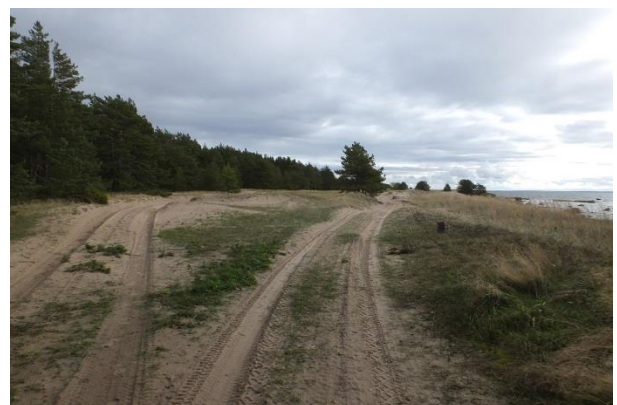
Elupaikades PRA_09:1640/A ja PRA_08:2120/B uurimisala idaserval on sõidetud. Rannikuvööndis ei tohiks üldse mootorsõidukitega sõita.