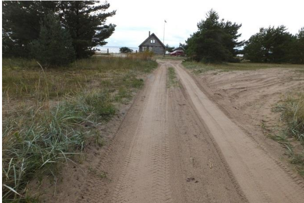
Vaade punktist 196 mööda Mölgisalu teed lõunasse Mölgisilla maaüksusele.