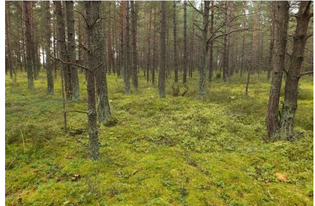
Vaade punktist 184 lõunasuunas elupaigale PRA_04:2180/D. Praegused tegevused ala ei kahjusta.