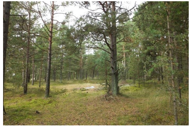
Vaade punktist 202 metsale PRA_04:2180/D. Puistu on valdavalt noorem ja tugeva inimõju märkidega.