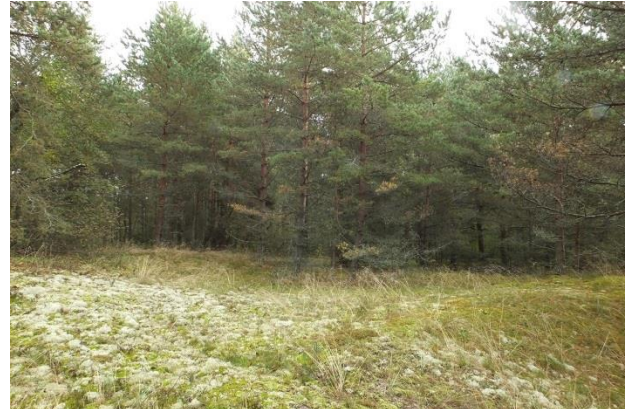
Vaated punktist 200 elupaigale PRA_05:2180/B, kus on säilinud nõmmelagendikke ning põõsasja kujuga lehtpuid. Ilmselt olid need alad varem karjatatavad. Noorte mändide salke võiks tunduvalt harvendada, eelistatult kasvama jätta vanemad ja kõverad-laiuvad puud.