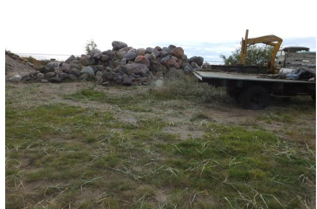
Vaade punktist 197 lõunasuunas. Maa-ala on väga intensiivses kasutuses, tehismaastikuks muudetud.