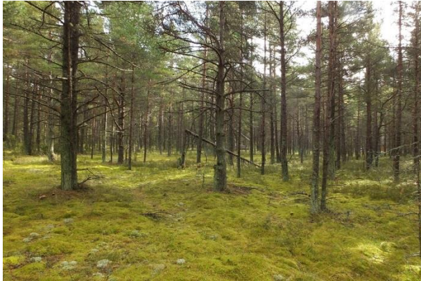
Vaade punktist 183 idasuunas elupaigale PRA_04:2180/D. Praegused tegevused ala ei kahjusta.