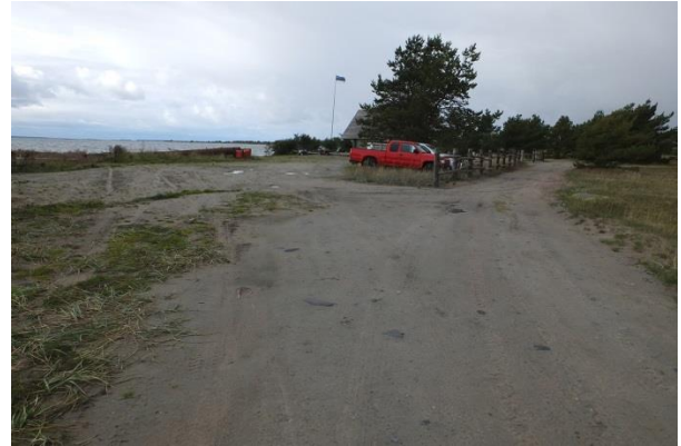
Vaade punktist 197 Mölgisadama maaüksuselt Mölgisilla ja Mölgisadama tee maaüksusele.