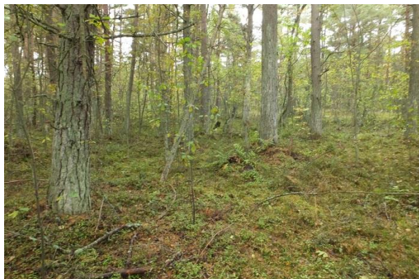
Vaade elupaigale PRA_05:2180/B punktist 204. Kergelt turvastunud muld (2190), ilmselt kasutatud ajalooliselt püsimeetsana ja karjatamiseks.