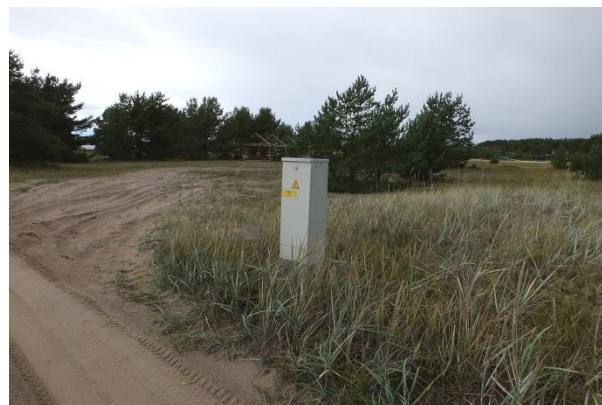
Vaade punktist 196 edelasse, ajutistele rajatistele elupaigas PRA_07:2130/C. Kasutamiskoormus enam kõrgemaks minna ei tohiks, mändide järelkasvu võib eemaldada.