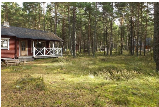
Vaade punktist 182 kirdesuunas elupaigale PRA_10:0. Loodust on suhteliselt vähe kahjustatud, maapinna tallamiskoormus on sobiv.