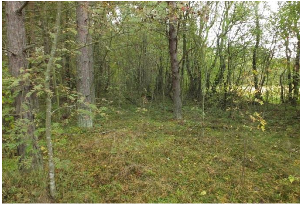
Vaade punktist 194 kagusuunas, esiplaanil elupaik PRA_01:2180/D, tagaplaanil PRA_02:6410/B.