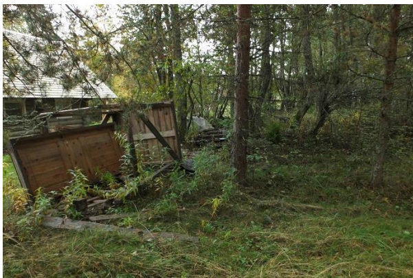
Foto punktist 191, metsa alla on ladestatud sinna mittekuuluvat rämpsü.