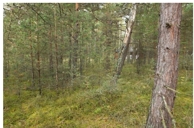
Vaade punktist 181 põhjasuunas elupaigale PRA_04:2180/D. Noore järelkasvu ja sirgetüveliste keskealiste puude eemaldamine oleks soovitav.