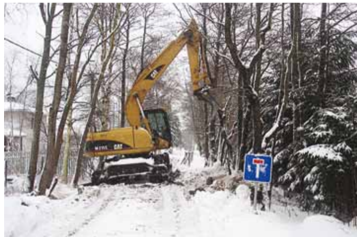
Tööd käivad lume kiuste.

joogivee tarnekindlust, tuleb rajada Viimsi ida- ja lääneranniku veevõrgu ühendamiseks veetorustik ning suurendada osade olemasolevate torustike läbimõõte. Lahendamist vajab ka olemasolevate torustike halb tehniline seisund, millele viitab suur lekke- ja infiltratsioonivee