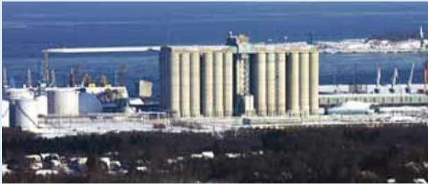
Muuga sadamas tegutsevaid ettevõtteid on küsitluse tulemustest teavitatud.

Uuringutulemused kinnitavad lõhnaprobleemi tõsidust Muuga sadama ümbruskonnas.