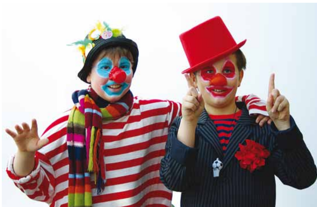
Lõbusad klounid.