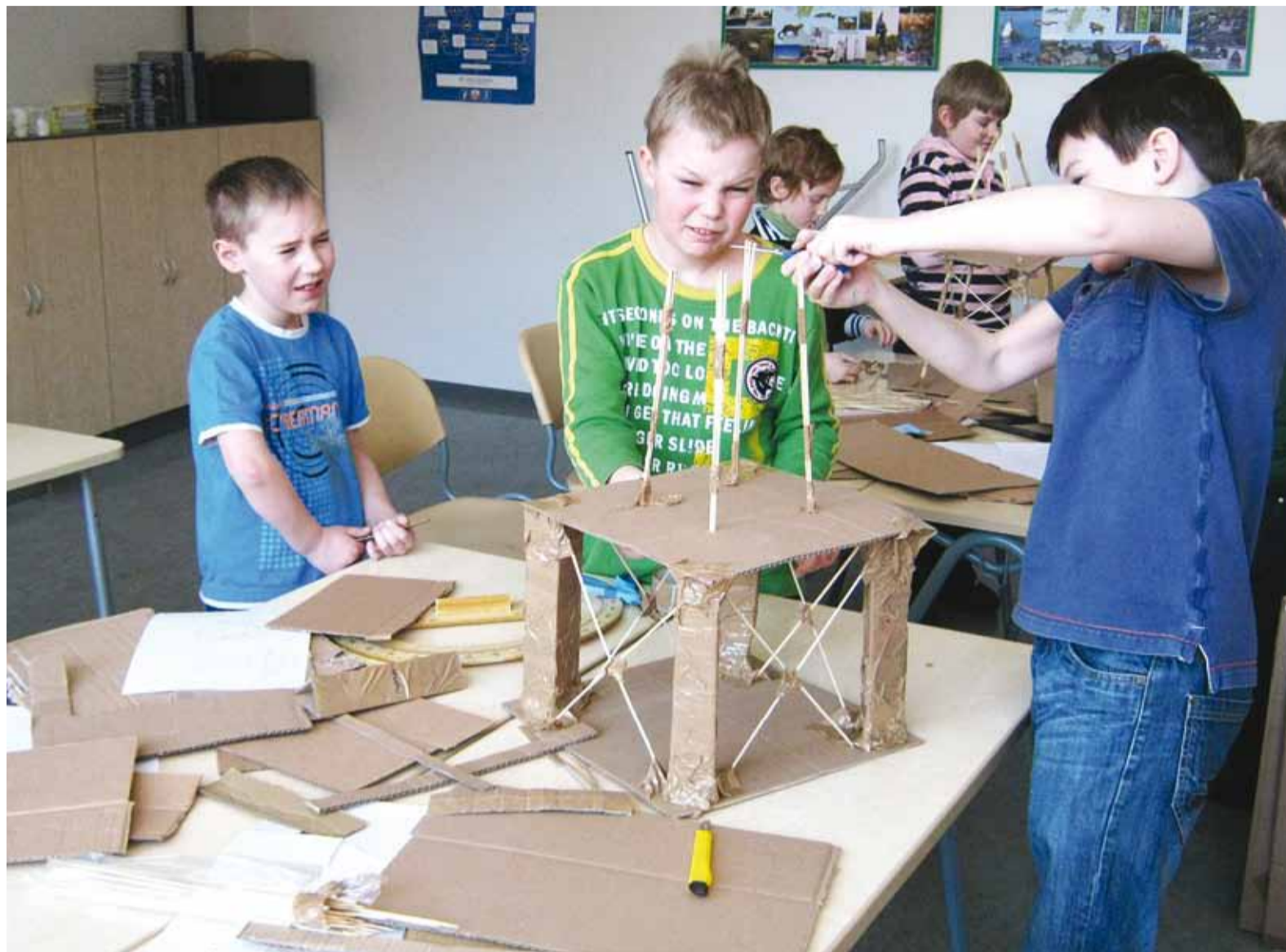
Viimsi Kooli väikesed teadmishimulised õppurid, kes lahendavad õpitoas inseneriülesandeid.