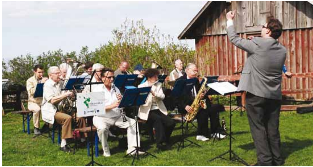
Randvere puhkpilliorkester on suvel oodatud külalisteks ka vabaõhuüritustel.

Juba praegu mängivad meie pasunakooris koos nii kogenud pillimängijad kui ka noored Kaitseväe, Kaitseliidu, Tuletõrjehingu jt orkestritest. Kogenud ja mitmel juhul akadeemilise muusikalise kõrgharidusega pillimeeste/naiste osalus võimaldab neid piisava huvi ja soovi korral kasutada pillimänguõpetajatena noorte-