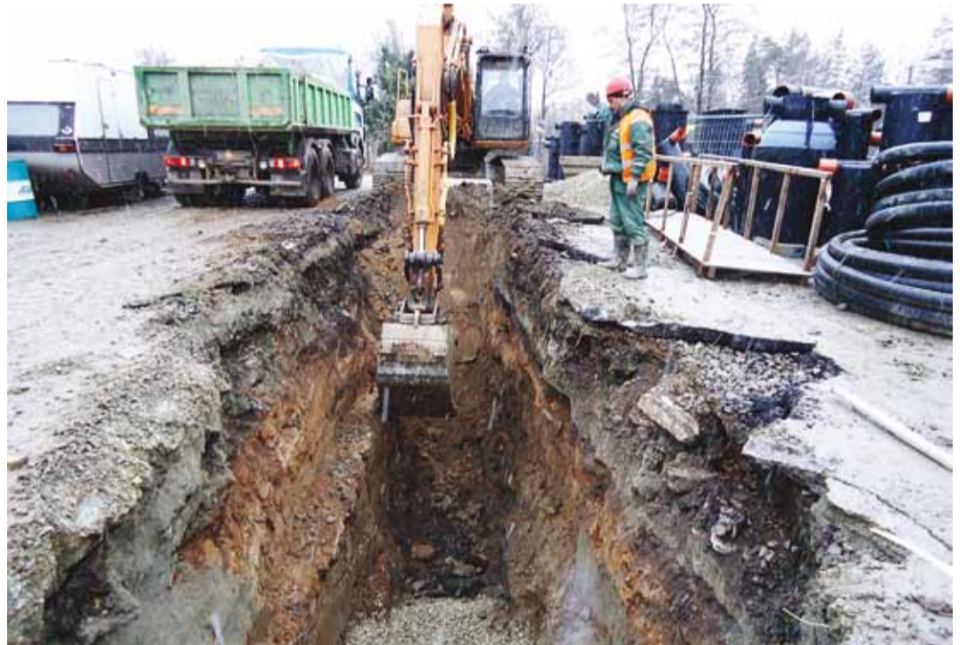
Kvaliteetse joogivee saamiseks on vajalik täiendavate torustike rajamine.

Enne Viimsi veetöötusjaama valmimist veebruaris 2012 ületas Viimsi joogivee joogiveedirektiivi nõudeid raua, mangaani, kloriidide, ammooniumi ja radionukleiidide sisalduse osas. Olukorra muutmiseks rajati valla keskmises olevas metsamassiivi veehaare ning projekti raames veetöötlemisjaam koos puhta vee reservuaaride (3 x 2000 m 3 ) ja teise astme pumplaga. Töödeldud ja nõuetekohase kvaliteediga joogivee tarnimiseks elanikele on vajalik täiendavate ühisveevarustuse torustike rajamine. Töstmaks