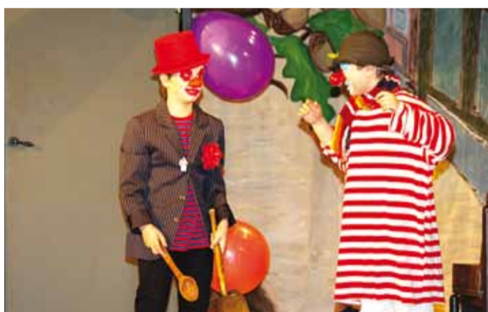
Klounid laval.

oskavad laulda, tantsida, luuletusi lugeda ja mitmeid pille mängida. Mina lihtsalt lustin koos nendega ja õpetan juurde klounireegleid ning seda, kuidas leida igas etteastes tüpazhile vastav lahendus."