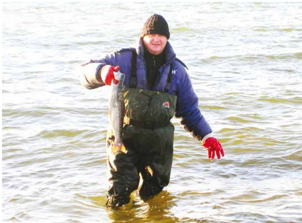
Nii suur kala annab ennast kätte võib-olla vaid põlisele saareelanikule.

Kui tihti käite mandril ja kui hästi tunnete ülejäänud