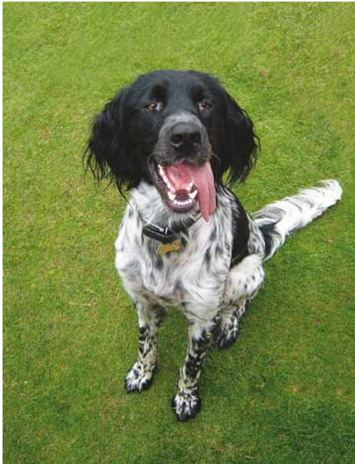
Igaüks saab leida endale sobilikku koera.