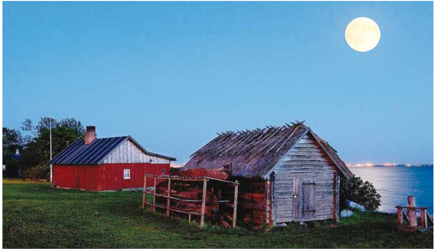
Kontserdid toimuvad Viimsi Vabaõhumuuseumi ja Rannarahva Muuseumi hoovil, lisaks jõuab muusika Viimsi kirikutesse ja kabelitesse.