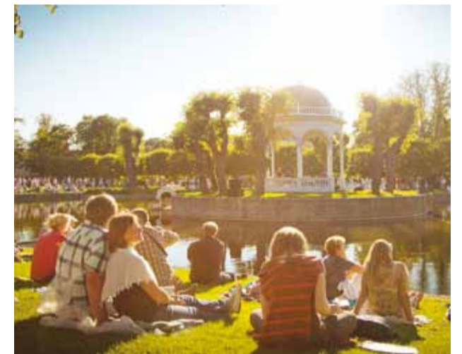
Kultuurisündmus toidab hinge.

Kultuursus avardab inimese maailmavaadet, ja eriti veel siis, kui veidi maailmas ringi liikuda, võime näha ja kogeda väga huvitavalt just nimelt seda, kuidas inimesed erinevates kultuuriruumides toimetamas on. Kultuursus on traditsioonid ja kombad, kultuuritus aga ülbus ja lahmimine.