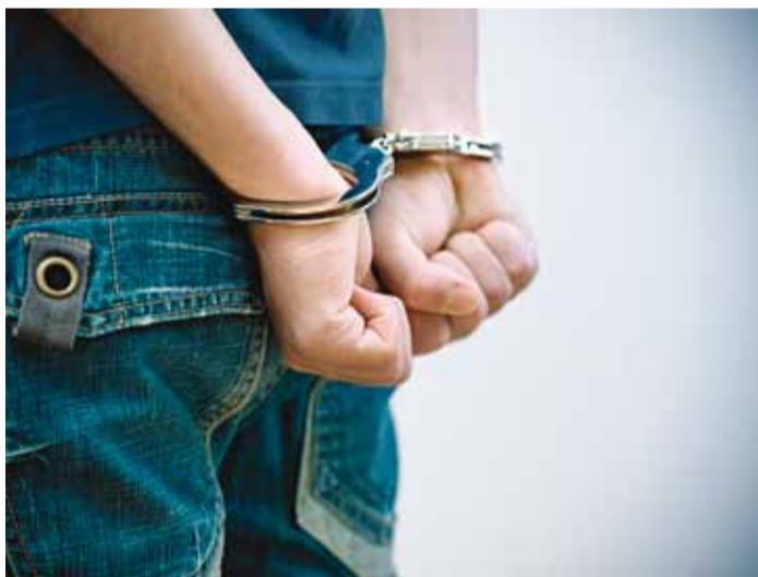
Petmised võivad lõppeda karistusega.

Näiteks kogus Osta.ee lehel inimene raha vigastatud koera ravikulude katteks oma erakontole. ELS pöördus kuulutaja poole, et uurida vigastuse asjaolusid. Kuulutaja kinni-