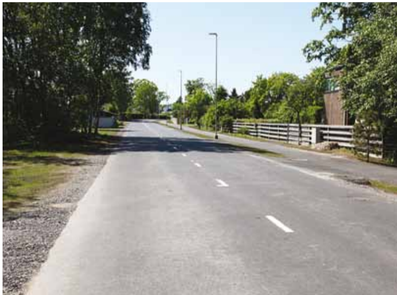
Rekonstrueeritud Kooli teel on rajatud 2,5 meetri laiune kõnnitee ning parkimiskohad Püüsi kooli esisel lõigul.