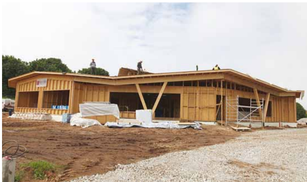
Uus-Pärtle lasteaia ehitus sujub plaanipäraselt.

"Kaasaegse omavalitsusena soovime oma elanikele pakkuda parimaid õpetingimusi ja -keskkonda. Lapsed ja haridus on kindel prioriteet, millesse panustamine on justkui investering tuleviku," ütles abivallavanem. Koolikohtade kõrval püsib Viimsis vajadus