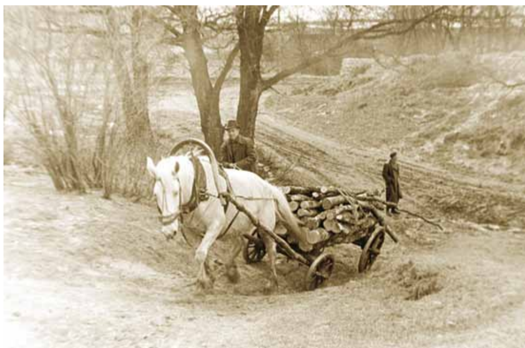
Lubjamäe vana tee.

Viimsi külad on ajaloo kogumise osas viimastel aastatel olnud vägagi eesrindlikud. Püüsi loodi paari aasta eest lausa külaselts, et kohalik ajalugu kokku koguda ning see raamatuks vormida. Miidurannas on aga kuni augustini käimas kampania “Minu Miiduranna lugu” ehk kirjatükkide, fotode ja joonistuste võistlus, mille üks