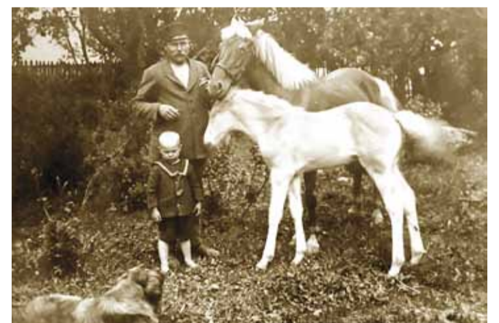
Uuetoa õuel 1927. aastal.

Lubja küla puhul on muutused maastikul olnud muidugi eriti kardinaalsed. Uus suusamägi muutis n-ö röövlikoobas-