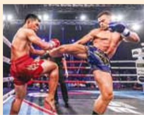
Hetk Tai suurimas profivõistlussarjas Max Muay Thai.

Eesti kikk- ja tai poksijad eesotsas Viimsi Tigers Gymi sportlastega sõitsid 5. juunil Taimaale treeninglaagrisse eesmärgiga võistelda Tai suurimas ja mainekamas profivõistlussarjas Max Muay Thai.