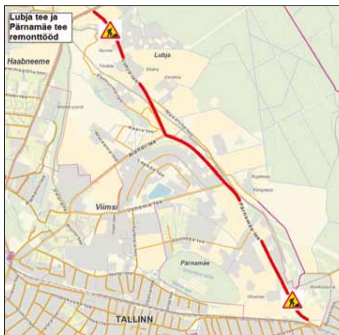
Lubja tee ja Pärnamäe tee remonttööd.

na pinke, muuta liikluskorraldust ja renoveerida taristut. Töid teostab TREF Nord AS, tööde maksumus on ca 292 000 eurot.