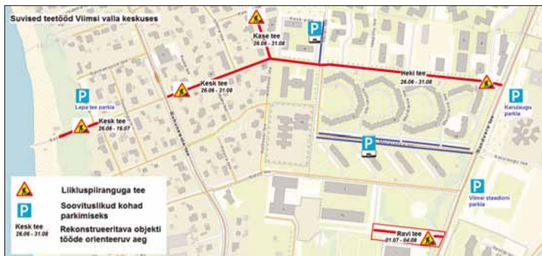
Suvised teetöid Viimsi valla keskuses. Kaardid Kommunaalamet

Tööde käigus on kavas rekonstrueerida kogu tee, parkimiskohad, kõnniteed, rajada haljassaared koos peenardega, paigaldada uus tänavavalgustus, uuendada bussipeatused, pan-