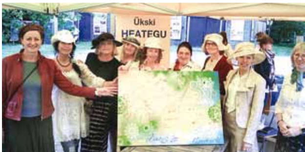
Viimsiranna LC klubi liikmete heategevuslik maal.