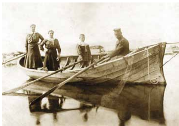
Viislaid Viimsis eelmise sajandi alguses.

Miks ehitati siinsetes rannades paatidele ette ulatuv kiil?