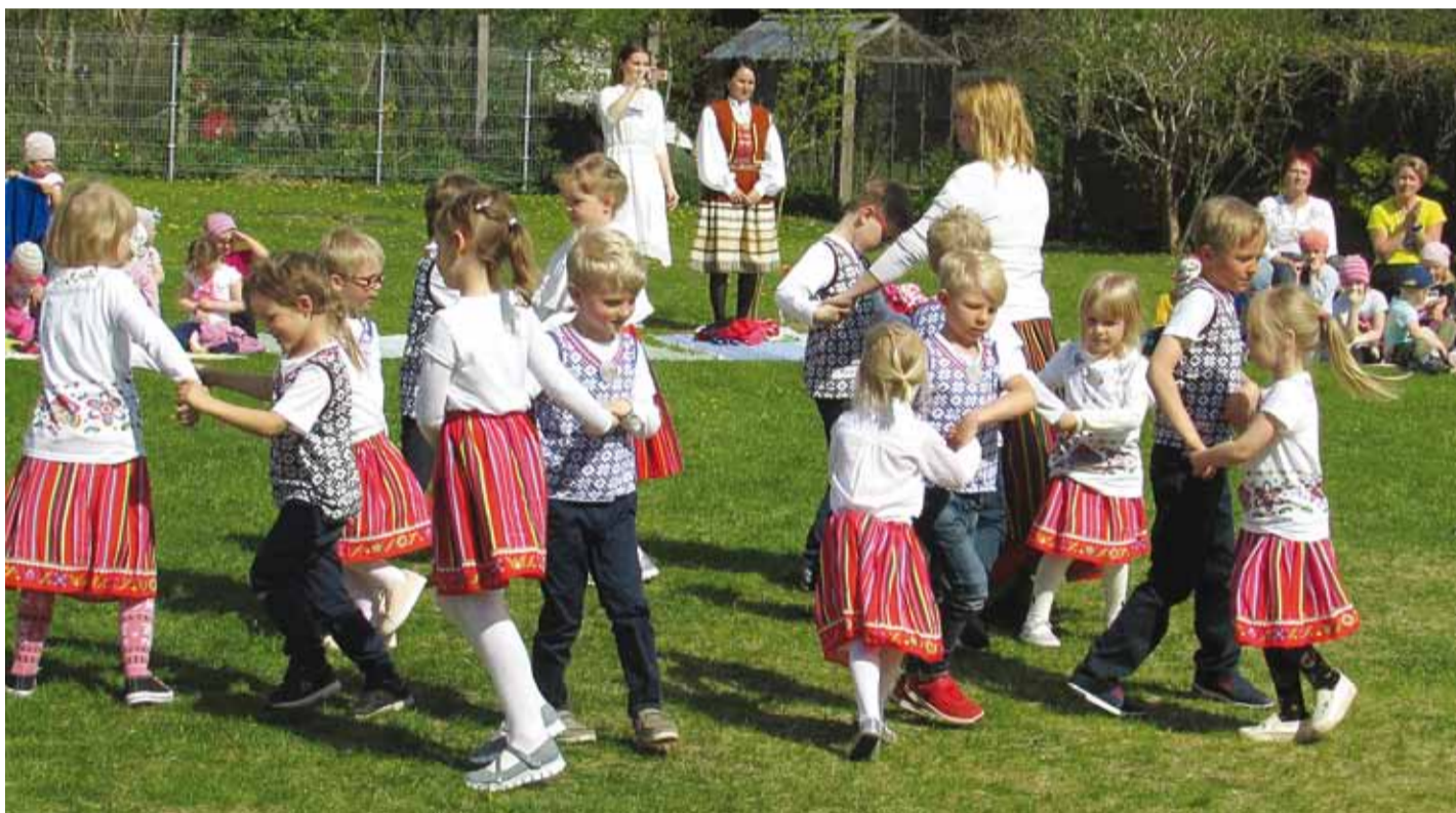
Misse rühma lapsed käisid tantsimas Laulasmaa rahvatantsupäeval.

Kristin Jakobson Püünsi Kooli lasteaia tantsuõpetaja