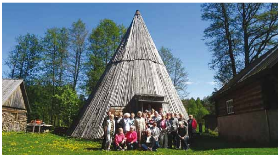
Aitäh kõikidele eakatele ning kohtumiseni järgmistel reisirid!

Edasi sõitsime vaatama Jaani-Tooma rändrahu, mille mõõdeteks 11,8 x 8,6 x 7,6 m. Seejärel uudistasime Jaanioja käsitöötalus, kus sünnivad se-