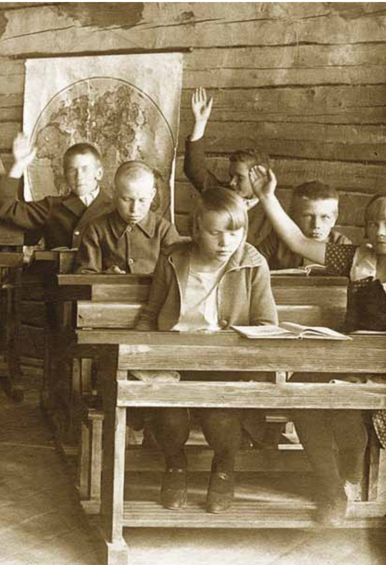
misel palume Viimsi elanike abi.

Pringi kooli endised õpilased ja õpetajad! Tuletage palun kooliaega meelde: otsige välja vanad fotoalbumid ja hakake mälestusi kirja panema – ja ärge jätke neid lausahtlisse vaid tooge muuseumi. Viimsi kool väärrib 2018. aastal üht korralikku näitust ja seda saame teha ainult üheskoos.