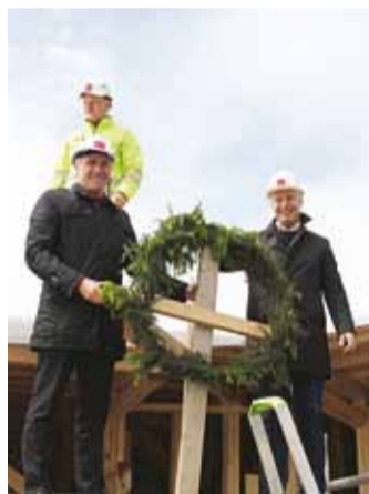
Sarikapärg on alla toodud.

jätakuvalt ka lasteaia kohtade järele. 2017. aasta jaanuari seisuga oli munitsipaallasteaia kohta ootel järjekorras umbes 300 last. Kuigi lähiaastatel hakkab lasteaia ealist laste arv tasapisi langema, püsib siiski vajadus täiendavate lasteaia kohtade loomise järele.