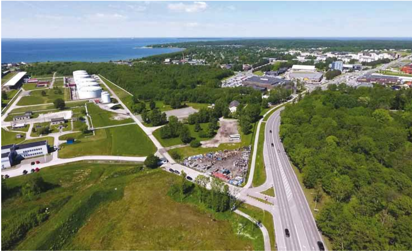
Valla ruumilises arengus on suurimaks väljakutseks vallakeskuse väljaehitamine Haabneeme – Viimsi – Miiduranna kolmnurgas.

Arengudokumendis märgitakse et, valla ruumilises arengus on suurimaks väljakutseks vallakeskuse väljaehitamine Haabneeme – Viimsi – Miiduranna kolmnurgas. Keskne idee võiks seisneda valla keskuse ja mereäärse tervikliku ühendamisena ning olemasolevate looduslike ja inimtekkeliste väärtuste sidumises. Tegemist on hajalin-