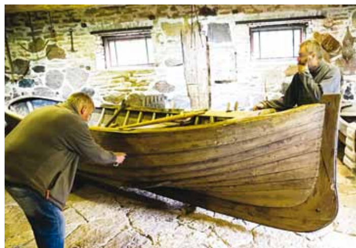
Rootsi-Kallavere muuseumis paati mõõtmis.

See on põnev küsimus, mille vastust täpselt ei teata. Eesti tuntumate paadiehitajate suguvõsa liikme Harald Aksbergi jaoks oli sellise iseäraliku võõri kuju algne põhjus tundmatu ja põhines eelkõige kohalikul traditsioonil. Oma paatide ajalugu käsitlevates artiklites on ta selle kohta küll arvamusi esitanud.