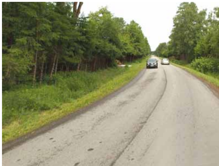
Muuga tee enne jalgratta- ja jalgte ehitust.

Ligi aasta aega kestnud Kooli tee parandustööd Püüsi külas jõudsid lõpule ning 7. juunil toimus tee pidulik avamine. 14. juunil avati pidulikult ka Muuga tee jalgratta- ja jalgte koos teevalgustuse ja bussipeatustega.