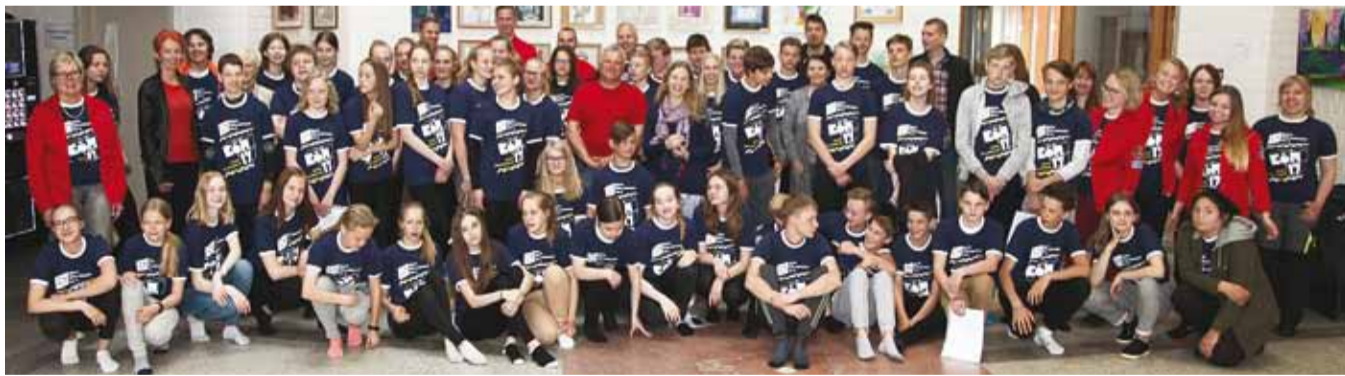
Head malevasuve Viimsi õpilasmaleva esimesele vahetusele!