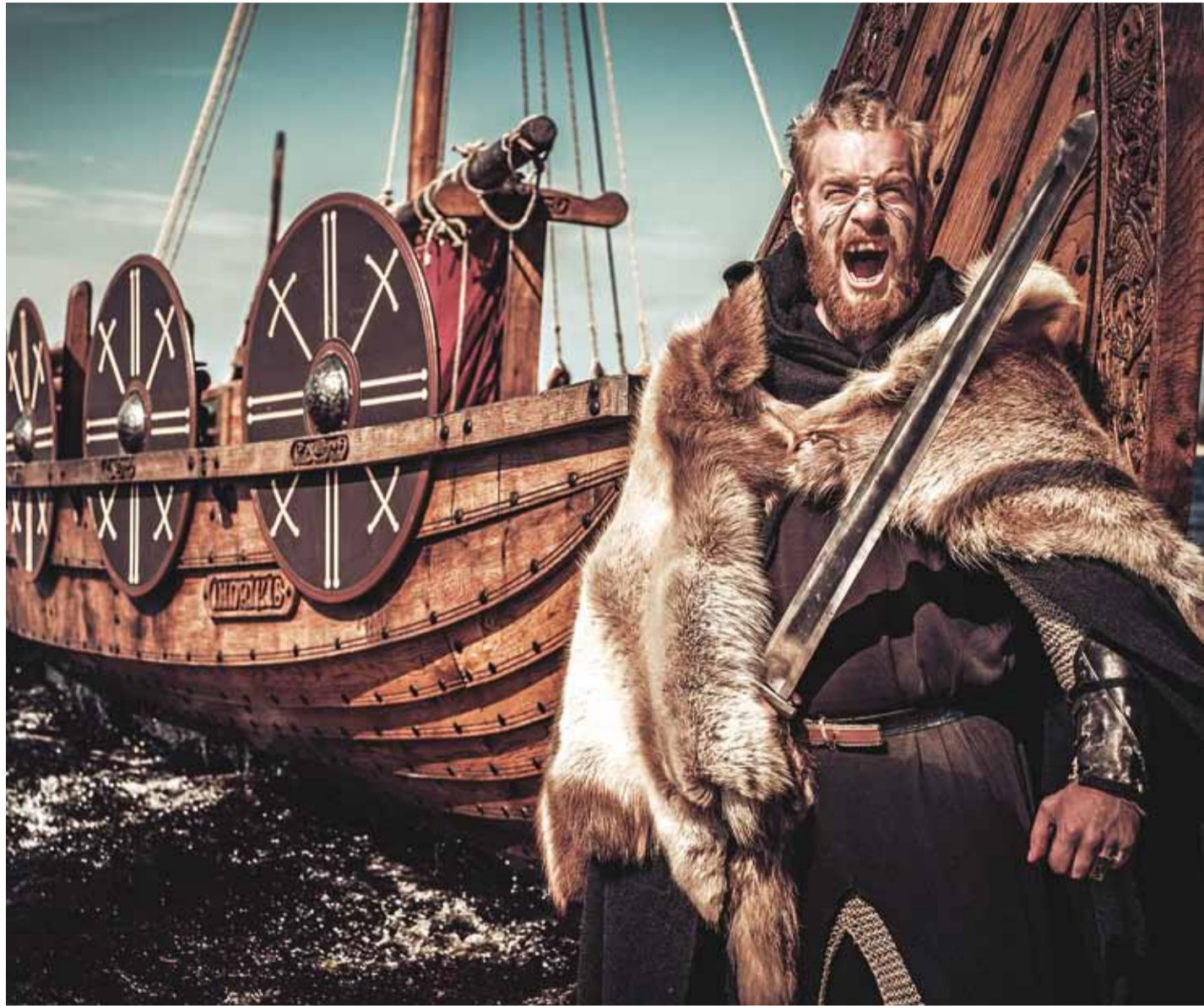
Kas selline võis välja näha kuningas Ingvar?

Eesti muinasajaloo romantilisemas pooles on saanud oma-