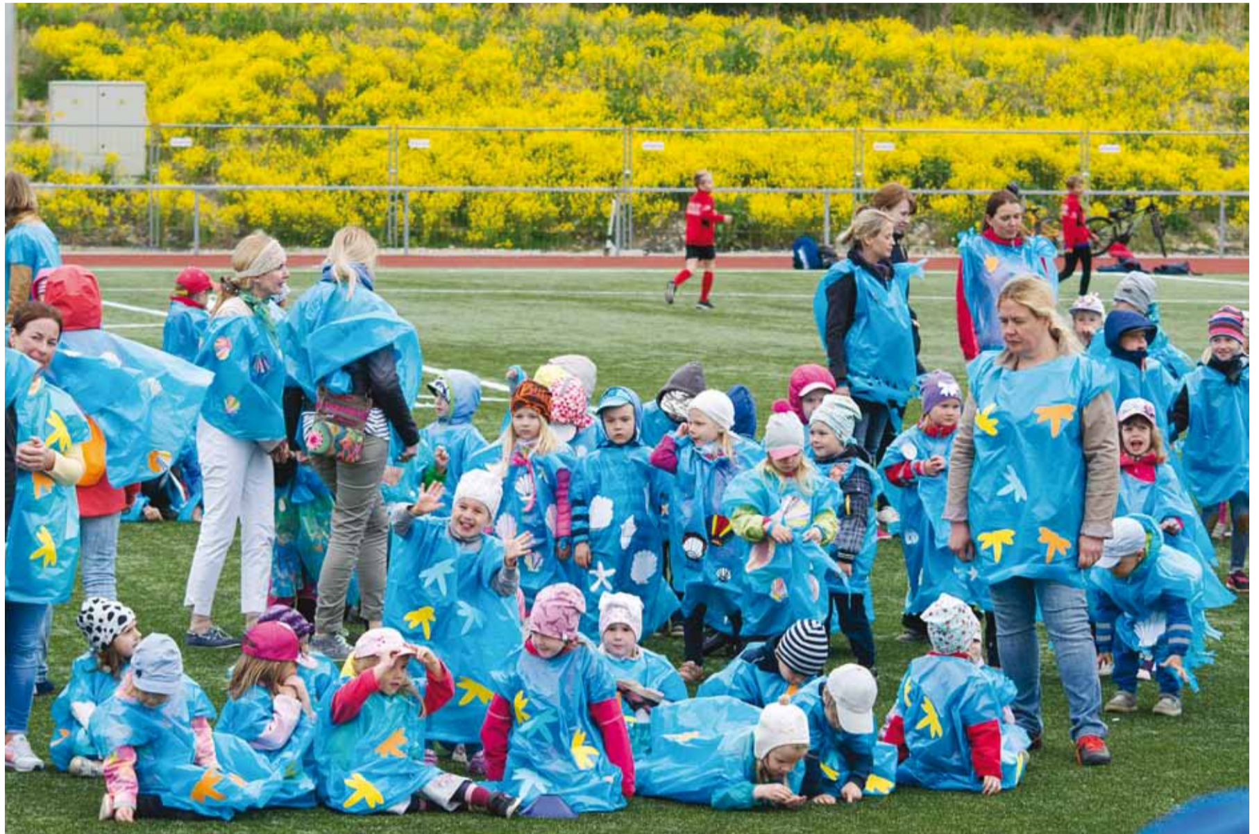
Kahisevates kilekeepides saabusid Randvere lasteaia ebamaised mereelukad.

Esimesena saabusid vetikad, keda kehastasid Amarülluse lasteaia pisikesed mudilased. Nende järel saabusid kahisevates kilekeepides Randvere lasteaia ebamaised mereelukad. Leppneeme poolt loivasid kohale viigerhülged. Laanelinnu metsaservast saabus kajakaparv ja asus pesa ehitama. Lõpuks oli tekkinud piisavalt tingimusi ka inimeste jaoks. Astri lasteaia poisid kehastasid meremehi ning tüdrukud rannapiigasid, kes vahuse mere ääres laevadelt uudiseid ootsid. Pargi lasteaia poolt saabusid uhked paadid, kus mõned jäneseidki end salaja pardale sokutanud olid. Esialgu ohtlikena paistnud Karulaugu lasteaia piraadid osutusid hoopis vägevateks tantsulööjateks. Kõige lõpuks saabusid staadionile Päikeseratta lasteaia kaptenid ning tantsupäev saigi alata.