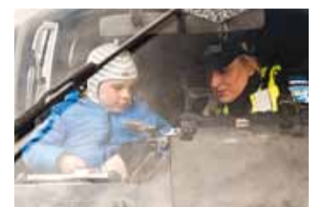
Milline on politseiauto ja mida teevad nupud?