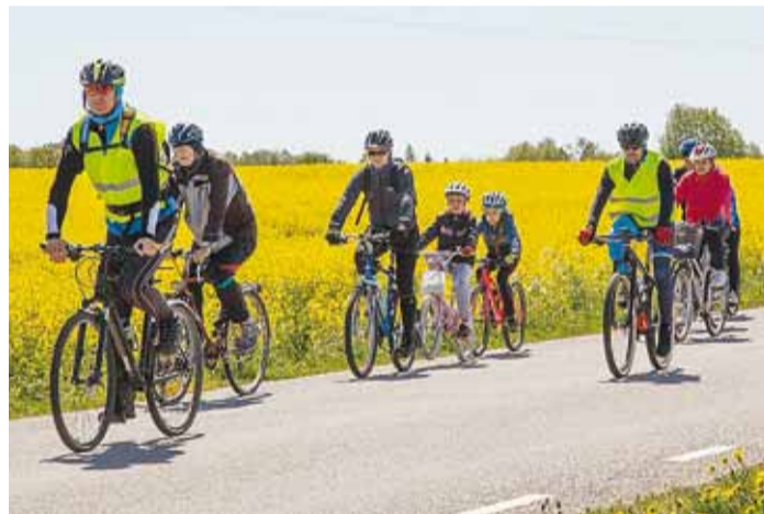
Tänavuse rattaretkes raames sõideti läbi Viimsi Maardusse ja Jõelähtmele.

le rattaretk! Ja ehk aitab rattaretk kaasa sellele, et muutume ka pisut liikuvamaks ja mõtte-laadilt rohelisemaks."