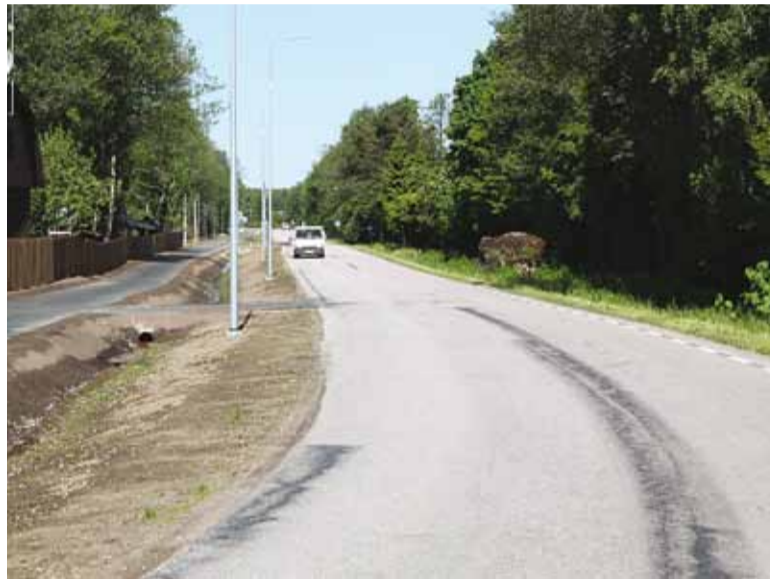
Rajatud kergliiklustee tagab turvalisema liikluse kurvilisel teelõigul.