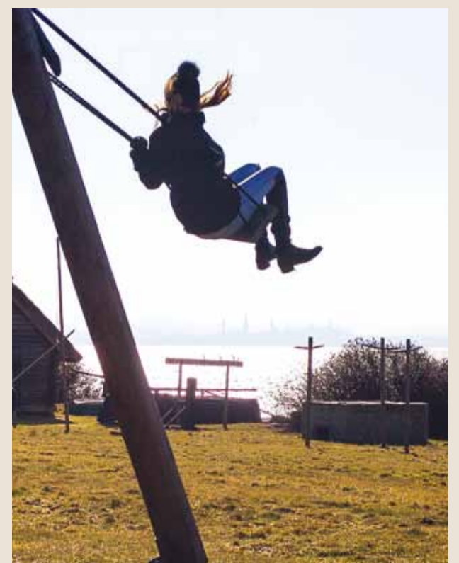
Rannarahva muuseum ja Viimsi vabaõhumuuseum kutsuvad külla.