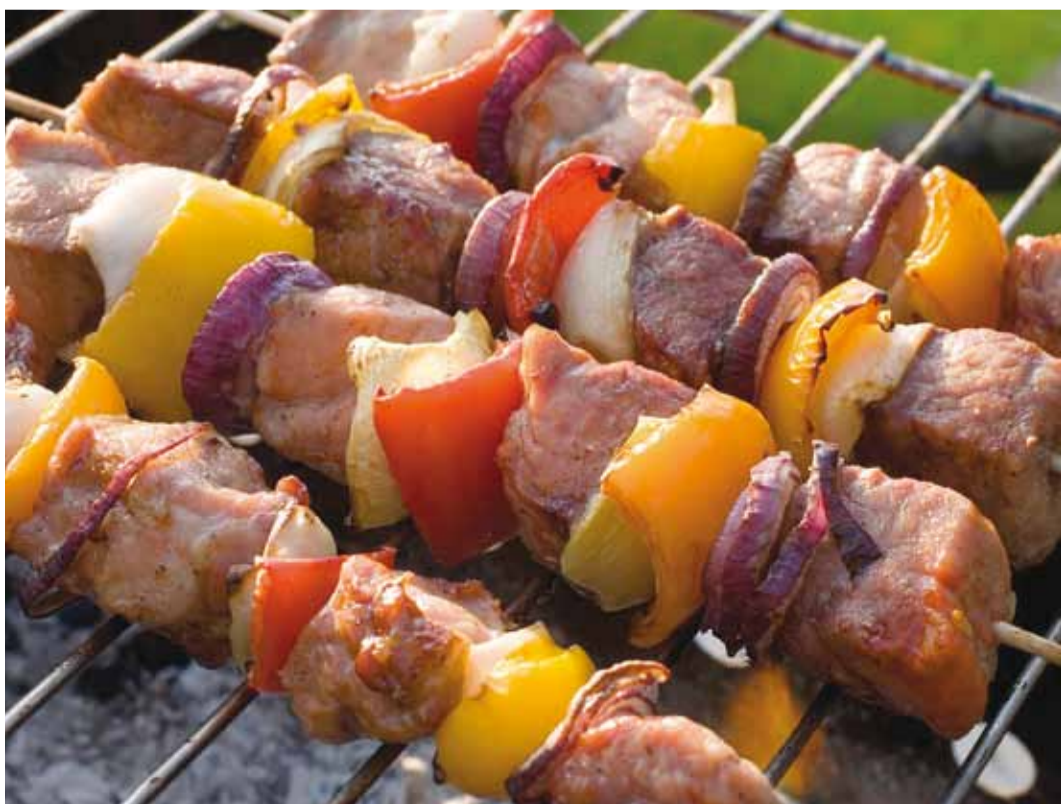
Grillimisel tuleks vältida liha üle küpsetamist.