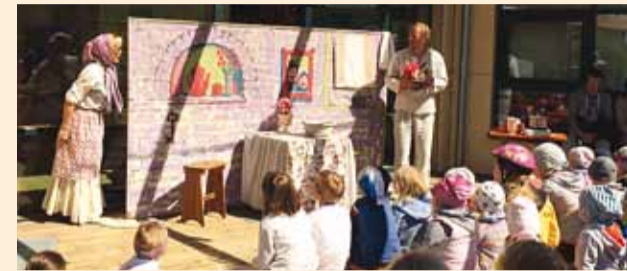
Lastepäeva üheks olulisemaks sündmuseks lastele oli Miku-Manni lasteteater.

4. juunil kogunesid Pärnamäe küla lapsed ja nende sõbrad lasteaia Väike Päike hoovi, et pidada maha üks lõbus lastepäev.