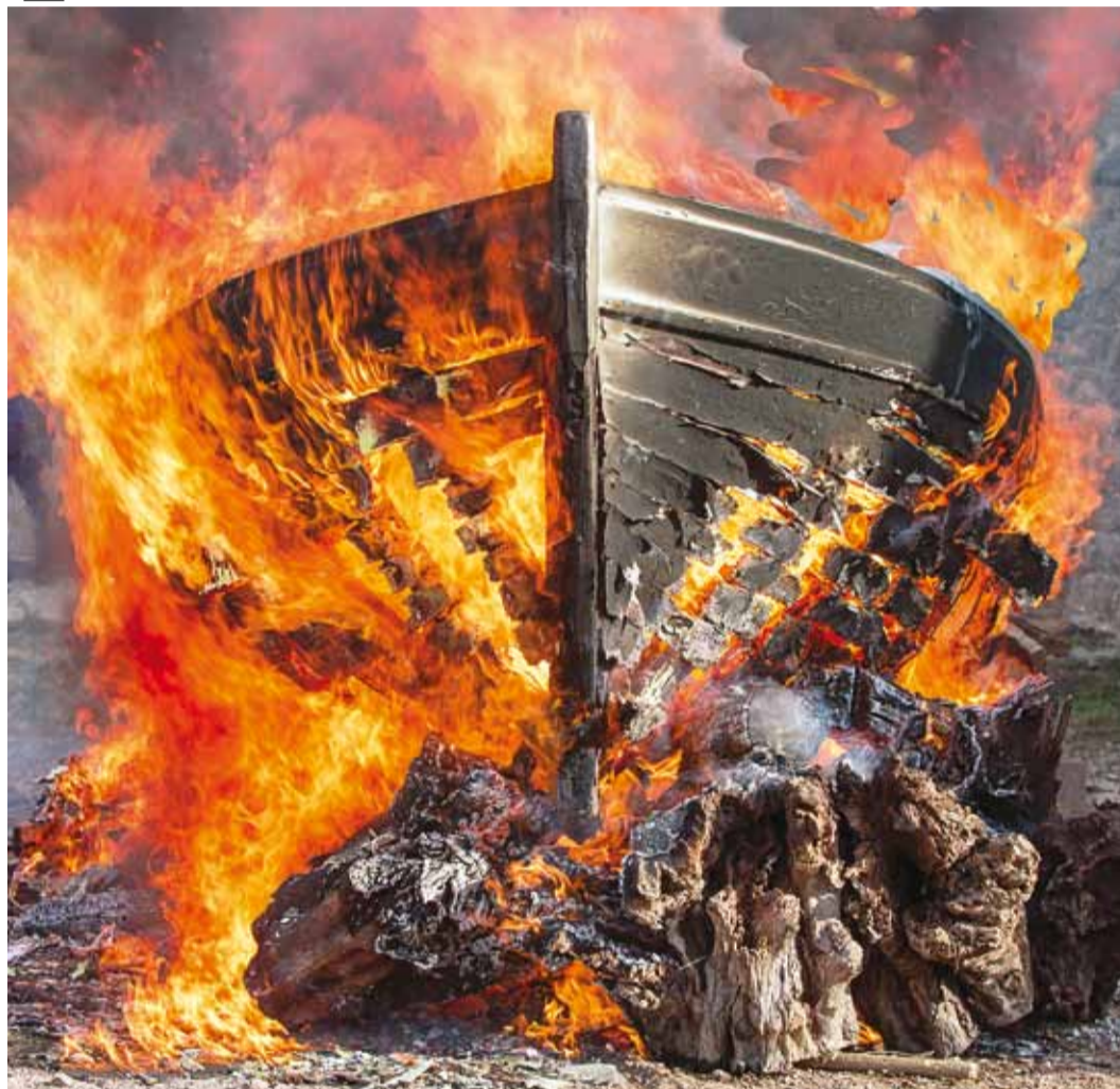
Rituaalne paadipõletus.

Kui on saabunud jaanitule haripunkt, siis algab paatide põletamine. Nooremad saaremehed lähevad alla rannale,