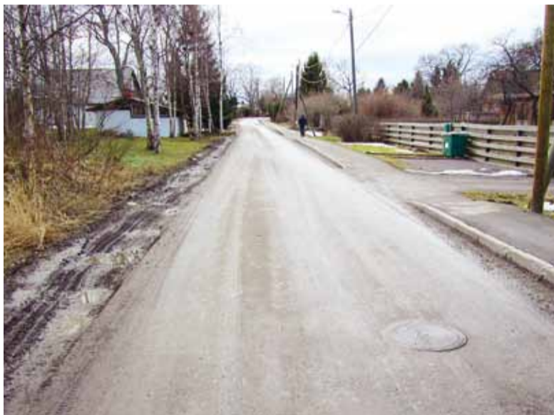
Kooli tee enne rekonstrueerimist.