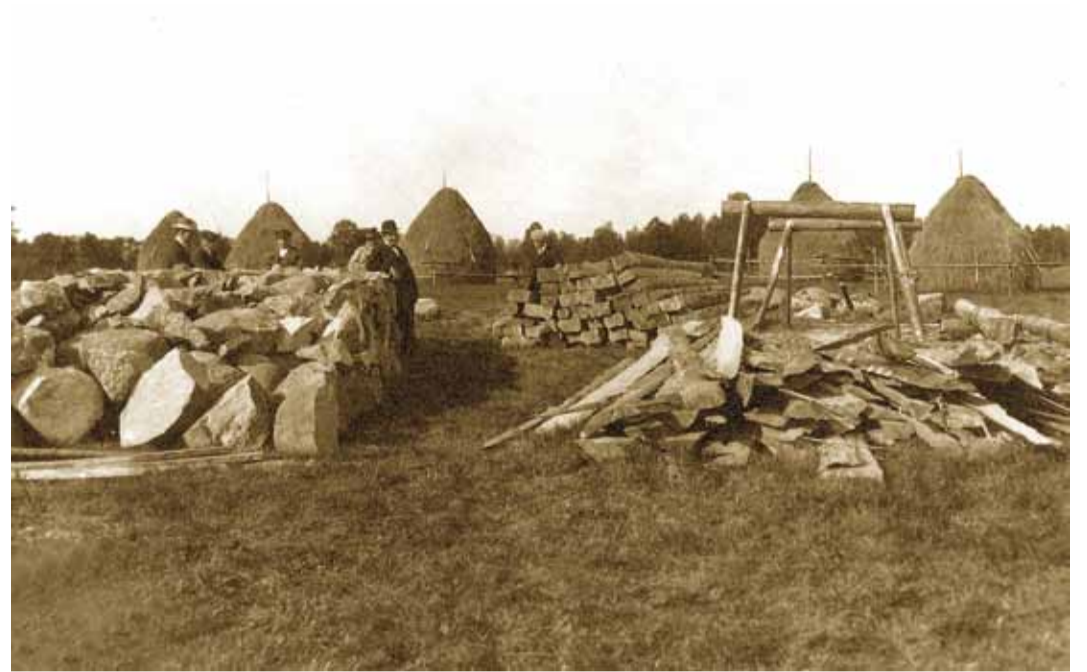
Koolimaja ehitamine algab, 7. septembril 1924.