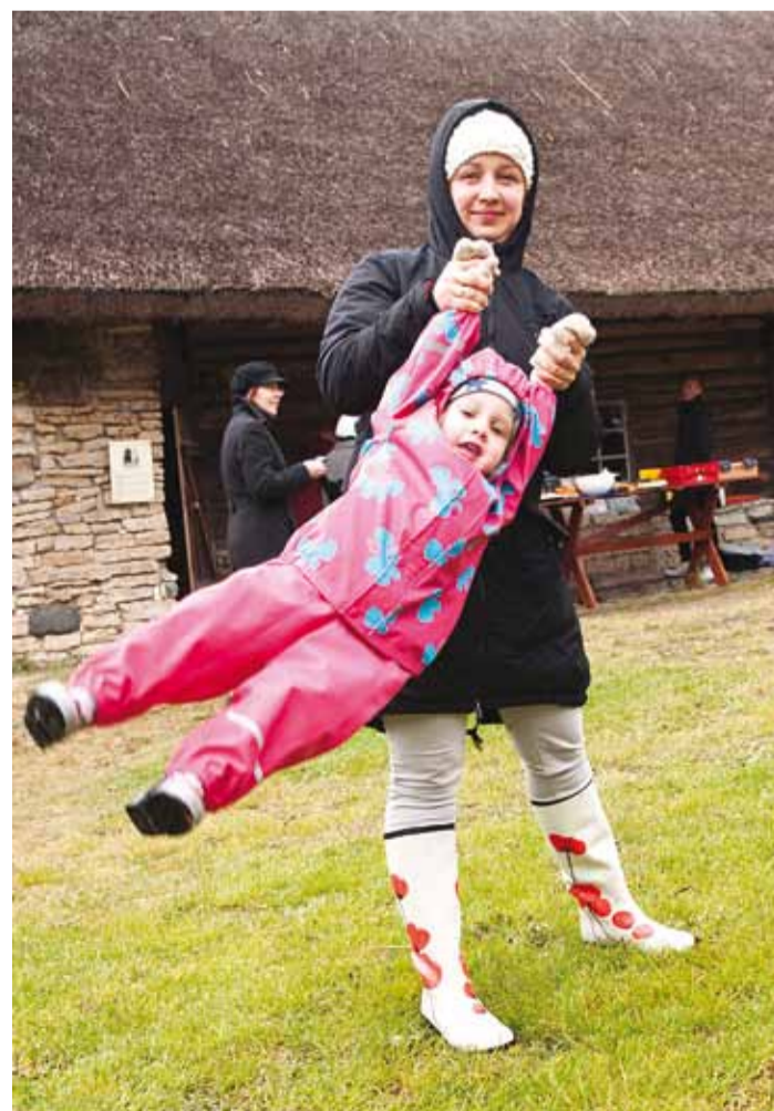
Kas teadsite, et Viimsi vallas on üle 5300 lapse?

Lastekaitsepäeval esinesid Põnnipesa lasteaia tantsijad ja