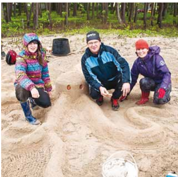
Valmisid nii kilpkonnad, sajaljalgsed, merineitsid kui ka kaheksajalad.