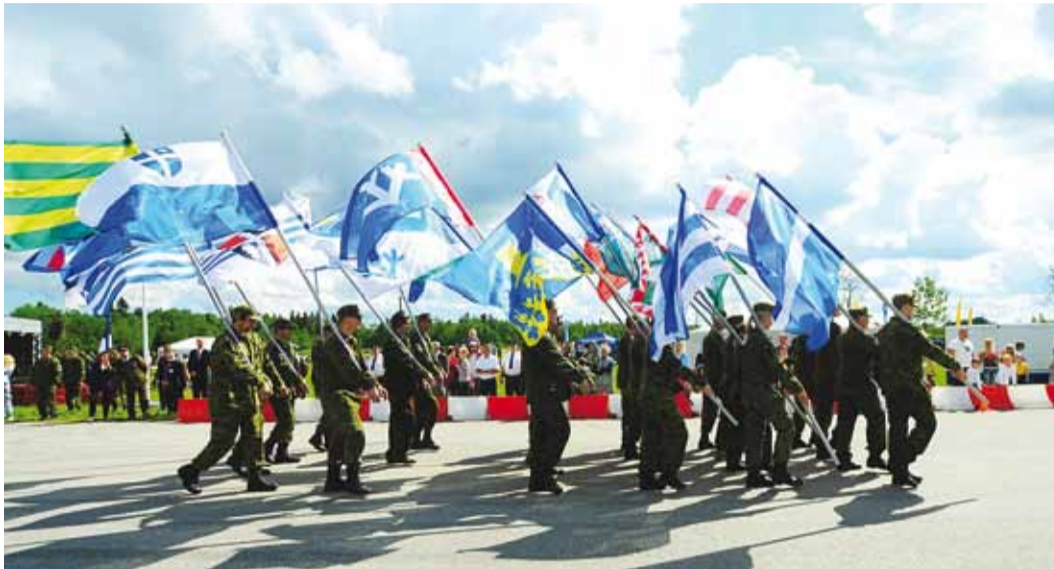
Maakaitsepäeva sündmused on külastajatele tasuta. Fotol möödunud aasta maakaitsepäeva paraad.

Harju XXII Maakaitsepäeva, millega tähistame Võidupüha, alustame juba 22. juunil Lool, Jõelähtme vallas, Vabaduse Hiies, kus traditsiooniliselt istutab tammepuu see omavalitsus, kelle territooriumil maakaitsepäev toimub – sel korral